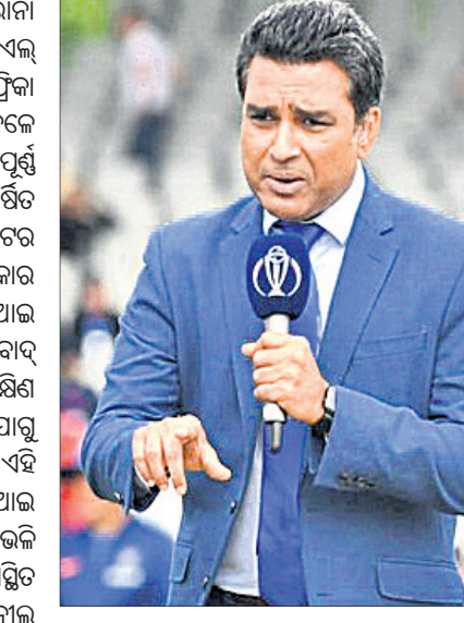
ଆଉ ଗତବର୍ଷ ପିଏସ୍ ବିଏଲ୍ ଟେଣ୍ଡେରରେ ସହ ଭାଷ୍ୟକାର ହର୍ଶ୍ ଭୋଗଲେଙ୍କ ସହ ଯୁକ୍ତିତର୍କ ମଧ୍ୟ ହୋଇଥିଲା।

କରୋନା ଭାଇରସ୍ ଯୋଗୁ ଆଇସିଏଲ୍ ସ୍ଥଗିତ ଓ ଭାରତ- ଦକ୍ଷିଣ ଆଫ୍ରିକା ବିରିକ୍ ବାତିଲ ହୋଇଥିବା ବେଳେ ବିସିସିଆଇର ଏକ ଗୁରୁତ୍ୱପୂର୍ଣ୍ଣ ନିଷ୍ପତ୍ତି ପ୍ରତି କାହାରି ଧ୍ୟାନ ଆକର୍ଷିତ କରିନାହିଁ।