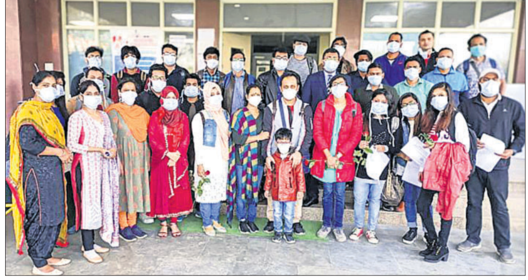
ଚାନ୍ଦିନୀ ଚେନ୍ଦି ନୂଆଦିଲ୍ଲୀର ଛାତ୍ରାଳୟରେ ଆଇଡିପିଓ କ୍ୱାରାଣ୍ଟାଇନ୍ କେନ୍ଦ୍ରରେ ଥିବା ଭାରତୀୟ ସେମାନଙ୍କୁ କରୋନା ସଂକ୍ରମଣ ହୋଇ ନ ଥିବା ପରୀକ୍ଷା କରାଯାଉଛି।

କେନ୍ଦ୍ରାପଡ଼ା, ୧୪ମାର୍ଚ୍ଚ ସ୍ତ୍ରୋତ ଏବେ ମାରାତ୍ମକ କରୋନା ଭୂତାଣୁର ନୂଆ କେନ୍ଦ୍ରସ୍ଥଳ ପାଲଟିଛି ବୋଲି ବିଶ୍ୱାସୀୟ ସଂଗଠନ (ଡକ୍ସିଏସ୍) ପକ୍ଷରୁ ଘୋଷଣା କରାଯାଇଛି। ଡକ୍ସିଏସ୍ ଏବଂ ଏହି ଘୋଷଣା ପରେ ବିଶ୍ୱର ବିଭିନ୍ନ ଦେଶ ସେମାନଙ୍କ ସାମାଜିକ ଦେଶର ନାଗରିକମାନଙ୍କ ପାଇଁ ବନ୍ଦ କରିବାରେ ଲାଗିଛନ୍ତି। ଅନେକ ଡକ୍ସିଏସ୍ ଘୋଷଣା ■ ସାମାଜିକ କଲେ ପଡ଼ୋଶୀ ■ ମୁଖ୍ୟତଃ ପର୍ଯ୍ୟଟନସ୍ଥଳ ବନ୍ଦ