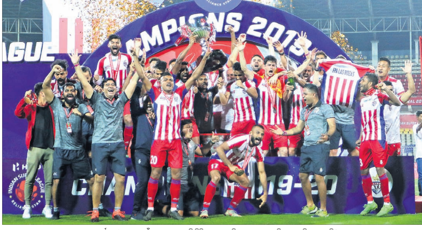
ରେକର୍ଡ ତୃତୀୟ ଥର ପାଇଁ ଆଇଏସଏଲ ଟ୍ରଫି ଜିତିବା ପରେ ଏଟିକେ ଦଳର ଖେଳାଳିମାନେ ଖୁସି ମନାଉଛନ୍ତି।