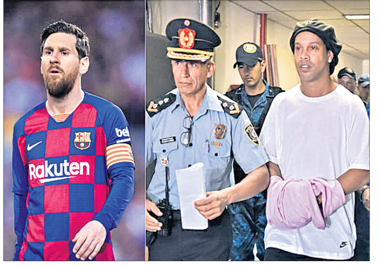
ଲିଓନେଲ୍ ମେସି ଓ ରୋନାଲ୍ଡିନୋ।

କାସିନୋ ମାଲିକଙ୍କ ଆମନ୍ତ୍ରଣରେ ପୂର୍ବତନ ସୁପରଷ୍ଟାର୍ ପାର୍ଲି ଓ ବାର୍ସିଲୋନା ଷ୍ଟାର ରୋନାଲ୍ଡୋ ଫେବ ପାସପୋର୍ଟ ସହ ପାରାଗୁଏ ଗସ୍ତ କରିଥିଲେ।