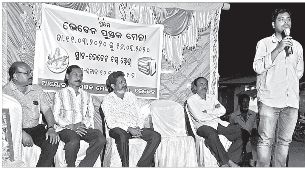
ଭେଡ଼େନ ପୁସ୍ତକମେଳାର ବର୍ତ୍ତମାନ ଅତିଥିମଣ୍ଡଳ ।