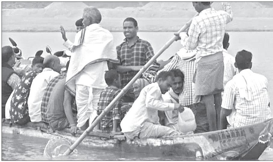
ପୋଲ ନ ଥିବାରୁ ଯାତ୍ରୀମାନେ ତଙ୍ଗାରେ ବିପଦସଙ୍କୁଳ ଭାବେ ଯାତ୍ରା କରୁଛନ୍ତି ।