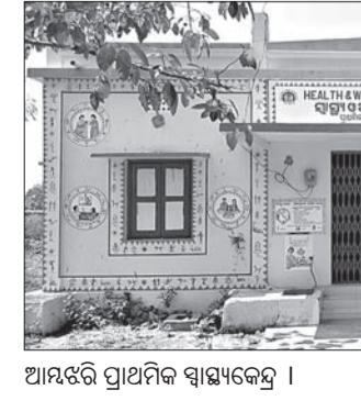
ଆୟତ୍ତର ପ୍ରାଥମିକ ସ୍ଵାସ୍ଥ୍ୟକେନ୍ଦ୍ର ।

ନିର୍ଭର କରନ୍ତି । ତାଲୁର ନିୟମିତ ରହୁ ନ ଥିବାରୁ ରୋଗୀମାନେ ବାଧ୍ୟ ହୋଇ ବାଉଁଶୁଣୀ ଅଥବା ବୌଦ୍ଧକୁ ଯାଇ ଖର୍ଚ୍ଚ ହେଉଛନ୍ତି । ଏ ନେଇ ପଞ୍ଚାୟତବାସୀ ଲୋକ ପ୍ରତିନିଧିଠାରୁ ଆରମ୍ଭ କରି ଜିଲ୍ଲା ପ୍ରଶାସନକୁ ଅଭିଯୋଗ କରିଥିଲେ ମଧ୍ୟ କିଛି ସୁଫଳ ମିଳିନାହିଁ । ଜିଲ୍ଲାପାଳ