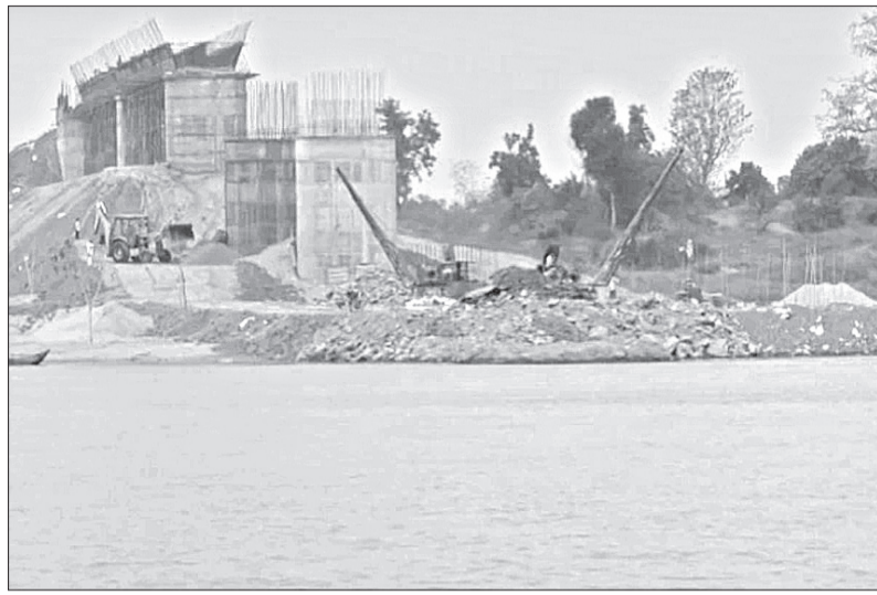
ତେଲ ନଦୀରେ ପୋଲକାମ ଚାଲିଛି ।