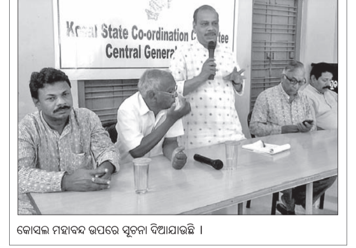
କୋସଲ ମହାବନ୍ଦ ଉପରେ ସୂଚନା ଦିଆଯାଇଛି ।