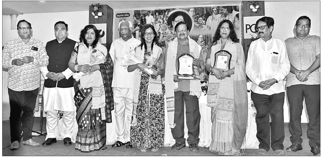
ପ୍ରେସ କ୍ଲବ୍ ଅଫ୍ ଓଡ଼ିଶାରେ ଶନିବାର ଆୟୋଜିତ ଚନ୍ଦ୍ରପ୍ରଭା ସ୍ମୃତି ସମ୍ମାନ-୨୦୨୦ କାର୍ଯ୍ୟକ୍ରମରେ ଉପସ୍ଥିତ ଅତିଥିକ ଗଣରେ ସମ୍ମାନିତ ବ୍ୟକ୍ତିମାନେ।