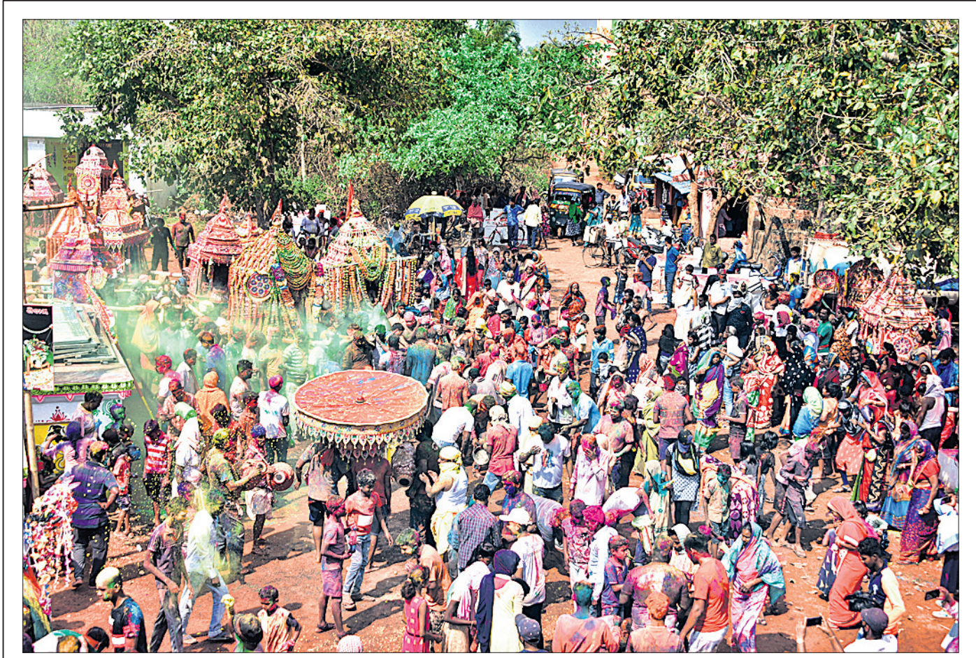
ଭୁବନେଶ୍ୱର ଉପକଣ୍ଠ ମଦନପୁର ଗ୍ରାମରେ ଶନିବାର ଅନୁଷ୍ଠିତ ଶ୍ରୀ ଶ୍ରୀ ଚନ୍ଦ୍ରଶେଖର ଦେବ ପଞ୍ଚୁଦୋଳ ମେଳଣରେ ଏକତ୍ରିତ ହୋଇଥିବା ଦୋଳବିମାନ।

ନିମାପଡ଼ା, ୧୪ମାର୍ଚ୍ଚ (ବି.ଏନ୍.ଏ.): ନିମାପଡ଼ା ଏନ୍‌ଏସ୍ ଅଞ୍ଚଳରେ ଥିବା ଏକ ଘରୋଇ ଅର୍ଥ ଲଗାଣକାରୀ ସଂସ୍ଥା କାର୍ଯ୍ୟାଳୟକୁ ରଖି ନେବା ପାଇଁ ଆସିଥିବା ୭ଜଣ ମହିଳାଙ୍କୁ ସଂସ୍ଥାର ଶାଖା ପରିଚାଳକ, ଗ୍ରୁପ୍ କ୍ରେଡିଟ୍ ଅଫିସର ଓ ଆସିଷ୍ଟାଣ୍ଟ ରିଜିଷ୍ଟ୍ରାର ମ୍ୟାନେଜର ଦୁର୍ଭିକ୍ଷର ଅଭିଯୋଗ ନେଇ ଶନିବାର ନିମାପଡ଼ା ଥାନାରେ ଅଭିଯୋଗ ହୋଇଛି। ସୂଚନା ଅନୁଯାୟୀ, ରଖି କରିଦେବାକୁ କହି ସଂସ୍ଥାର ଗ୍ରୁପ୍ କ୍ରେଡିଟ୍ ଅଫିସର ପିପିଲି ଅଞ୍ଚଳର ୨୪ଜଣ ମହିଳାଙ୍କଠାରୁ ବିଭିନ୍ନ ଚଳୁଥିବା ସହ ୨ଗଣ ଟଙ୍କା ଲେଖାଏଁ ନେଇଥିଲେ। ଦାୟିତ୍ୱ ବିତର୍କିତ ହେବା ପରେ ୨ଗଣ ମହିଳାଙ୍କୁ ମହିଳାମାନେ ନିମାପଡ଼ା ଶାଖା କାର୍ଯ୍ୟାଳୟରେ ପହଞ୍ଚି ରଖି ସମ୍ପର୍କରେ ପଚାରିବାରୁ ଶାଖା ପରିଚାଳକ, ଗ୍ରୁପ୍ କ୍ରେଡିଟ୍ ଅଫିସର ଓ ଆସିଷ୍ଟାଣ୍ଟ ରିଜିଷ୍ଟ୍ରାର ମ୍ୟାନେଜର ଦୁର୍ଭିକ୍ଷର ଅଭିଯୋଗ ନେଇ ଶନିବାର ନିମାପଡ଼ା ଥାନାରେ ଅଭିଯୋଗ ହୋଇଛି। ଅନ୍ୟ ସଂସ୍ଥାରୁ ମହିଳାମାନେ ରଖି କରି ଗ୍ରୁପ୍ ନ ଥିବାରୁ ଆମ ସଂସ୍ଥାରୁ ରଖି ଦେବନହେବ ନାହିଁ ବୋଲି କହିଥିଲେ। ଅନ୍ୟପକ୍ଷରେ ଏ ନେଇ ଆଇଆଇସି କନାର୍ଡନ ପାଢ଼ା କୁହୁଡ଼ି, ପିପିଲି ଥାନାରେ ଏ ସମ୍ପର୍କରେ ଅଭିଯୋଗ କରିବାକୁ ଅଭିଯୋଗକାରୀଙ୍କୁ କୁହାଯାଇଛି।