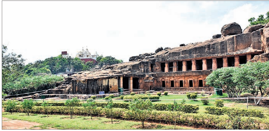
ଭୁବନେଶ୍ୱରସ୍ଥିତ ଭଦ୍ରନଗର କନଶୂନ୍ୟ ହୋଇପଡ଼ିଛି।