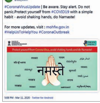
ଆଣ୍ଡ୍ରୋୟିଡ ବିଷୟ, ନମସ୍କାର ପୁସ୍ତକ ମିଳାଇବା ପରିବେଶ ନମସ୍କାର(ନମସ୍ତେ) ସହ ଏକାଧିକ ଭାରତୀୟ ଭାଷାରେ କରିବାକୁ ଉତ୍ସାହ କରାଯାଇଛି । ହେଲେ

ଭୁବନେଶ୍ୱର, ୧୫ ମାର୍ଚ୍ଚ (ସ୍ମରଣ) ସାରା ବିଶ୍ୱରେ ବର୍ତ୍ତମାନ କରୋନା ଭୂତାଣୁ କାୟା ବିସ୍ତାର କରିବାରେ ଲାଗିଛି । ଏହାକୁ ନିଜିତ ଭାବେ ପୂଜାଦିକା କରିବାକୁ ସମସ୍ତେ ପ୍ରସାସ ଜାରି ରଖିଛନ୍ତି । ଉଭୟ କେନ୍ଦ୍ର ଓ ରାଜ୍ୟ ସରକାର ଏହାକୁ ବିପତ୍ତି ବୋଲି ଘୋଷଣା କରିଛନ୍ତି । ଏ ସମ୍ପର୍କିତ ସଚେତନତା କାର୍ଯ୍ୟକ୍ରମ ସ୍ୱାସ୍ଥ୍ୟ ସମେତ ବିଭିନ୍ନ ମନୁଶାଳୟ ପକ୍ଷରୁ କରାଯାଇଛି । ସେହି କ୍ରମରେ ଇଲେକଟ୍ରୋନିକ୍ ଆଣ୍ଡ ଇନ୍ଫରମେଶନ୍ ଟେକ୍ନୋଲୋଜି ମନୁଶାଳୟ ପକ୍ଷରୁ ପରସ୍ପର ସାଥେ ଆଣ୍ଡ୍ରୋୟିଡ ବିଷୟ, ନମସ୍କାର ପୁସ୍ତକ ମିଳାଇବା ପରିବେଶ ନମସ୍କାର(ନମସ୍ତେ) ସହ ଏକାଧିକ ଭାରତୀୟ ଭାଷାରେ କରିବାକୁ ଉତ୍ସାହ କରାଯାଇଛି । ହେଲେ