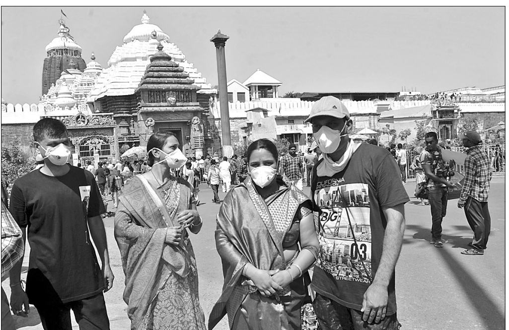
କରୋନା ସଂକ୍ରମଣକୁ ଦୂଷ୍ଟରେ ରଖି ଶ୍ରଦ୍ଧାଳୁମାନେ ମାଙ୍କୁ ପିନ୍ଧି ଶନିବାର ପୁରୀ ସହରରେ ବୁଲୁଛନ୍ତି ।

ଶ୍ରୀ ଗୋପୀନାଥ ଦେବ ପଞ୍ଚୁପାଣ୍ଡବଙ୍କୁ ମେଳଣ କୁଞ୍ଜକୁ ପାଞ୍ଚୋଟି ନେଇଥିଲେ । ଏହି ଅବସରରେ ବ୍ରହ୍ମଗିରି ଗ୍ରାମବାସୀଙ୍କ ତରଫରୁ ପାରମ୍ପରିକ ସାହିତ୍ୟ, ନାଟ୍ୟ ନୃତ୍ୟ, ମେଢ଼ା ନୃତ୍ୟ ପରିବେଷଣ କରାଯାଇଥିଲା । ରାତିତମାମ ସାହିତ୍ୟରେ ଗାଁ ଦାଣ୍ଡ ପ୍ରକାଶିତ ହେଉଥିବାର ଦୃଶ୍ୟ ବେଶ ରୋମାଞ୍ଚକର ଥିଲା । ୧୦୮ ଦୋଳ ଏକତ୍ରିତ ହୋଇ ତିନି ଦିନ ଧରି ପଞ୍ଚୁପାଣ୍ଡବ ପଡ଼ିଆରେ ହୋଇଥିଲା । ପରେ ଗୋପୀନାଥଙ୍କ ସମେତ ପଞ୍ଚୁପାଣ୍ଡବ ନିକଟକୁ ପଞ୍ଚୁପାଣ୍ଡବ ମେଳଣ କୁଞ୍ଜରେ ବିଜେ କରିଛନ୍ତି । ସନ୍ଧ୍ୟାରେ ବିଭିନ୍ନ ବାଣ ପ୍ରତିଯୋଗିତା, ବାଦ୍ୟ, ଘଣ୍ଟଘଣ୍ଟା, ସଂକୀର୍ତ୍ତନ, ସାହିତ୍ୟ, ନାଟ୍ୟ, ମେଢ଼ା, ଘୋଡ଼ାନାଚ ଇତ୍ୟାଦି ସାଂସ୍କୃତିକ କାର୍ଯ୍ୟକ୍ରମ ଅନୁଷ୍ଠିତ ହେବ । ଏକ ବିରାଟ ଶୋଭାଯାତ୍ରାରେ