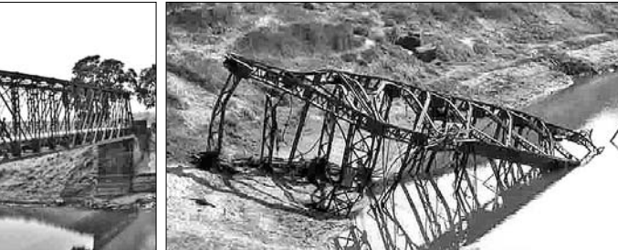
ଭାସିଗଲା ପରେ କୁଳରେ ଲାଗିଥିବା ସେତୁ ।

ବାଙ୍କୀ କଟକ ପୁଖ୍ୟ ରାସ୍ତାର କାଟପୁଞ୍ଜିଆ ନିକଟବର୍ତ୍ତୀ ରଣ ନଦୀ ଉପରେ ୧୯୯୬ରେ ଲୌହ ସେତୁ ନିର୍ମାଣ କରାଯାଇଥିଲା । କଳିକତା ବନ୍ଦ ଏଣ୍ଡ କମ୍ପାନୀ ଦ୍ୱାରା ପ୍ରସ୍ତୁତ ଏହି ସେତୁ ୯୨ ବର୍ଷ ପର୍ଯ୍ୟନ୍ତ ବାଙ୍କୀ- କଟକ ମଧ୍ୟରେ ପୁଖ୍ୟ ଗମନାଗମନର ମାଧ୍ୟମ ପାଲଟିଥିଲା । ଏତିହ୍ୟସମ୍ପନ୍ନ ଏହି ଲୌହ ସେତୁ ଏବେ କୁଳରେ ପୋତି ହୋଇଯିବାକୁ ବସିଥିବା ବେଳେ ଏହାର ସୁରକ୍ଷା ପ୍ରତି ଧ୍ୟାନ ଦିଆଯାଇ ନ ଥିବା ଅଭିଯୋଗ ହୋଇଛି । ବିକ୍ରମ ଶାସନ ସମୟରେ ନିର୍ମିତ ଏହି ଲୌହସେତୁ କଳିକତା ହାତରୁ ବିକ୍ରମ ସଦୃଶ୍ୟ । ଇଂରେଜମାନେ ନିଜ ବୁଦ୍ଧିକୌଶଳ ମାଧ୍ୟମରେ ୨୮୫୫ ଟଙ୍କା ଉପରେ ସେତୁକୁ ଝୁଲାଇ ରଖିଥିଲେ । ଏହା ବହୁ ସୁନ୍ଦର ଓ ଆକର୍ଷଣୀୟ ଥିଲା । ଏହି ସେତୁ ଦେଇ ଦୈନିକ କଟକ, ଭୁବନେଶ୍ୱର, ଡେଙ୍କାନାଳ, ବଉଦ୍, ସୋନପୁର, ଖଣ୍ଡପଡ଼ା ଆଦି ସ୍ଥାନକୁ ଯାନବାହନ ଚଳାଚଳ ହେଉଥିଲା ।