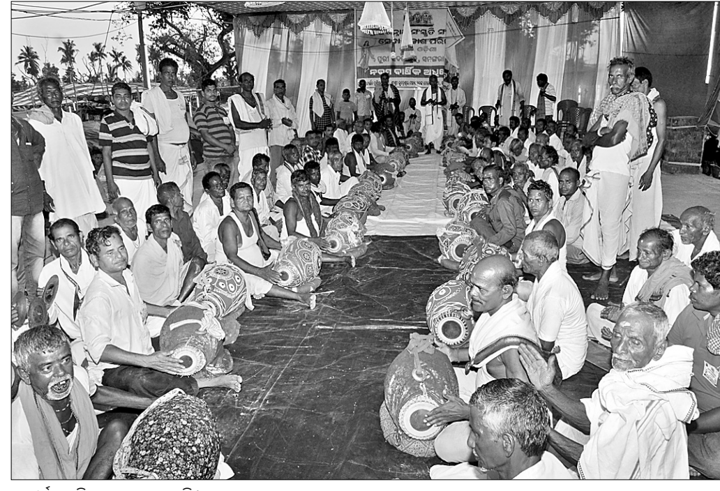
ସଂକୀର୍ତ୍ତନ ପରିବେଷଣ କରାଯାଇଛି ।