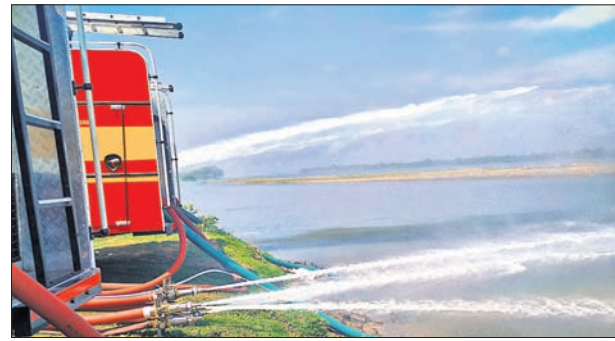
ଓଡ଼ିଶା ଅଗ୍ନିଶମ ସେବାରେ ଦୂତନ ବନକ ଗାଡିରେ ସଂଯୁକ୍ତ ମୋଟର ପମ୍ପ କାର୍ଯ୍ୟକାରୀକୁ ନେଇ ଗଡ଼ଜାତିଆ ଘାଟ ମହାନଦୀ ଚକରେ ପରୀକ୍ଷାମୂଳକ ଭାବେ ବ୍ୟବହାର କରାଯାଇଛି