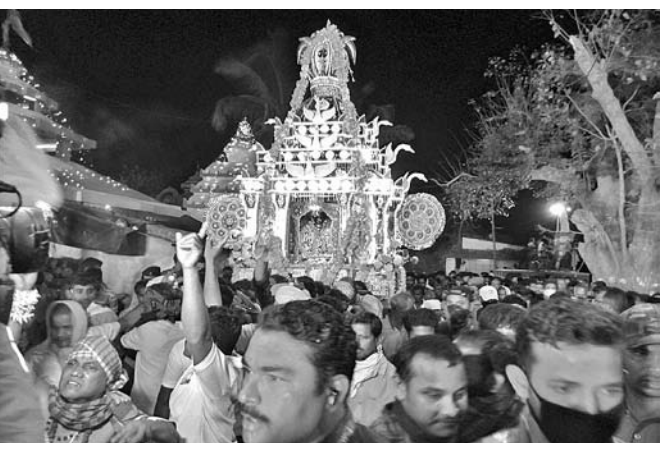
ଠାକୁରଙ୍କୁ ଦୋଳ ବିନାମରେ ନିଆଯାଇଛି । କରାଯାଇଥିଲା । ଏହାପରେ ଠାକୁର ଦୋଳ ବିନାମରେ ବିଜେ କରିଥିଲେ । ପରେ ପତ୍ରିମାତାଙ୍କୁ ଦୋଳ ବିରାଟ ପଟୁଆରରେ ଅବସରରେ ଆକର୍ଷଣୀୟ ଆତସବାଜି ପଟୁଆରରେ ଯିବା ସମୟରେ ବାଟରେ ଥିବା ଶ୍ରୀଗୋପାଳଙ୍କ(ମଠ ଠାକୁର) ଓ ଶ୍ରୀବାଳକୃଷ୍ଣଙ୍କୁ ହେବ ପାଲଟିରେ ଆନନ୍ଦିତ ହେବ ମେଳଣ ପଡ଼ିଆକୁ ଯାଇଥିଲେ । ଏହି ମେଳଣ ପଡ଼ିଆକୁ ଯାତ୍ରା କରିଥିଲେ । ପଟୁଆରରେ ଯିବା ସମୟରେ ବାଟରେ

ଓଡ଼ିଶା ପ୍ରସିଦ୍ଧ ଶ୍ରୀପତ୍ରିମାତାଙ୍କୁ ସୋମନାଥ ଦେବଙ୍କ ପଞ୍ଚୁପାଣ୍ଡବ ମେଳଣ ଶନିବାର ରାତିରୁ ଆରମ୍ଭ ହୋଇଛି । କଟକ ନିକଟବର୍ତ୍ତୀ ହରିରାଜପୁର ଗ୍ରାମରେ ଅନୁଷ୍ଠିତ ଏହି ମେଳଣରେ ଶନିବାର ଜମାଣ ରାତିରେ ଲକ୍ଷ୍ମୀଙ୍କ ଜନସମାଗମ ହୋଇଛି । ବିଭିନ୍ନ ଅଞ୍ଚଳରୁ ଆସିଥିବା ପ୍ରାୟ ୩୦୦୦ ବ୍ୟକ୍ତିଙ୍କ ସମେତ ମାନସିକ ପୁରଣ ହୋଇଥିବା ବନ୍ଧୁ ଭକ୍ତ ଏଠାରେ ରାତିତମାମ ବାଣ ପୁରାଇଥିଲେ । ଆତସବାଜି ପ୍ରଦର୍ଶନରେ ମେଳଣ ପଡ଼ିଆ ଝଲସି ଉଠିଥିଲା ।