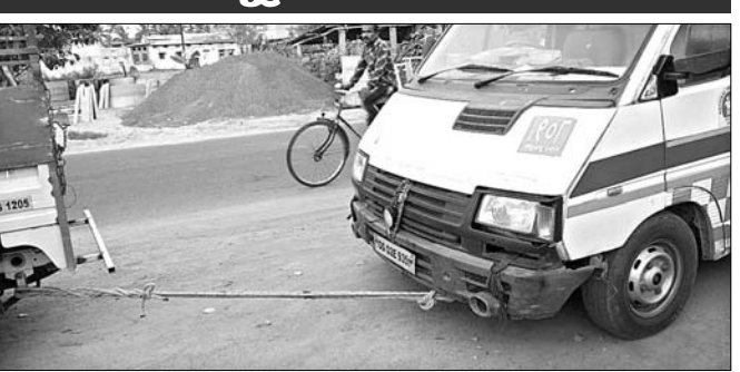
ଅଟଳ ୧୦୮ ଆତ୍ମଲୀଳାକୁ ଦଉଡ଼ିରେ ବାହି ଗଣି ଗଣି ନିଆଯାଇଛି । ଯେନତେନ ପ୍ରକାରେ ରୋଗୀ ସେବା ଚାଲିଥିଲା । ଏ ସମ୍ପର୍କରେ ଧରିତ୍ରୀରେ ଖବର ପ୍ରକାଶନ ପରେ ବିଭାଗୀୟ କର୍ତ୍ତୃପକ୍ଷଙ୍କ ନିଦ ଭାଙ୍ଗିଥିଲା । ଆତ୍ମଲୀଳା ପଛ ଡୋର ମରାମତ କରାଯାଇଥିଲା । ଶନିବାର ଏହି ୧୦୮ ଆତ୍ମଲୀଳାକୁ ଜଣେ