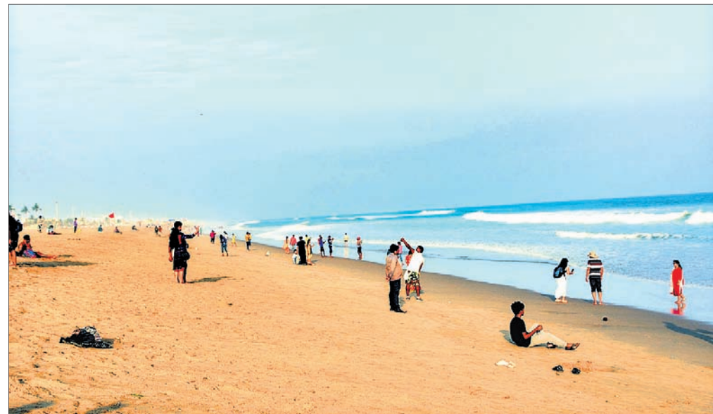
କରୋନା ଭୟରେ ଶନିବାର ପୁରୀ ବେଳାଭୂମି ପର୍ଯ୍ୟଟକଶୂନ୍ୟ ହୋଇପଡ଼ିଛି।