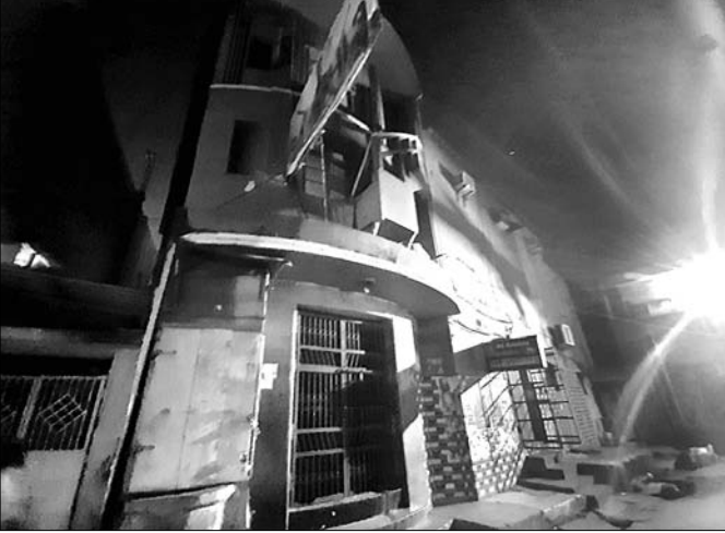
କରୋନା କଟକଣା ପରେ ପୁରୀ ସହରରୁ ଲକ୍ଷ୍ମୀ ଫିଲ୍ଡ୍ ହଲ ବନ୍ଦ ରହିଛି ।