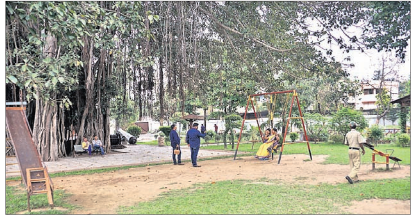
କଟକ ଯୋଡ଼ାସ୍ଥିତ ଷ୍ଟେଟ ମାରିଟାଇମ୍ ପ୍ୟୁଲିସିଟି ପରିସର ପାର୍କରେ ଗହଳି ନାହିଁ।