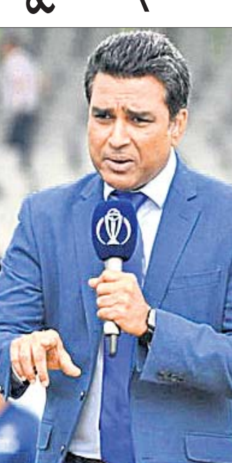
ପିକ୍ ବଲ୍ ଚେଷ୍ଟାବେଳେ ସହ ଭାଷ୍ୟକାର ହର୍ଷା ଭୋଗଲଙ୍କ ସହ ସୁଚ୍ଚିତର୍ଣ୍ଣ ମଧ୍ୟ ହୋଇଥିଲା। ଉଭୟ ଘଟଣା ପାଇଁ ପରବର୍ତ୍ତୀ ସମୟରେ ସଞ୍ଜୟ ମଞ୍ଜୁରେକରଙ୍କୁ କରାଯାଇଥିଲା।

ମୁମ୍ବାଇ, ୧୪ମାର୍ଚ୍ଚ: କରୋନା ଭାଇରସ୍ ଯୋଗୁ ଆଇପିଏଲ୍ ସ୍ଥଗିତ ଓ ଭାରତ- ଦକ୍ଷିଣ ଆଫ୍ରିକା ସିରିଜ୍ ବାଟିଲ ହୋଇଥିବା ବେଳେ ବିସିସିଆଇର ଏକ ଗୁରୁତ୍ୱପୂର୍ଣ୍ଣ ନିଷ୍ପତ୍ତି ପ୍ରତି କାହାରି ଧ୍ୟାନ ଆକର୍ଷିତ କରିନାହିଁ। ବିଶ୍ୱ କ୍ରିକେଟର ଅନୁତମ ଶ୍ରେଷ୍ଠ ଭାଷ୍ୟକାର ସଞ୍ଜୟ ମଞ୍ଜୁରେକରଙ୍କୁ ବିସିସିଆଇ ଭାଷ୍ୟକାର ପ୍ୟାନେଲରୁ ବାଦ୍ ଦେଇଛି। ଭାରତ-ଦକ୍ଷିଣ ଆଫ୍ରିକା ମ୍ୟାଚ୍ ବର୍ଷା ଯୋଗୁ ବାଟିଲ ହୋଇଯାଇଥିଲା। ଏହି ମ୍ୟାଚ୍ ଲାଗି ଅନ୍ୟ ବିସିସିଆଇ ପ୍ୟାନେଲ ଭାଷ୍ୟକାରଙ୍କ ଭଳି ଧର୍ମଶାଳାରେ ସେ ଉପସ୍ଥିତ ନ ଥିଲେ। ଏଠାରେ ସୁନାମ ଗାଭାସ୍କର, ଏଲ. ସିଭରାମକ୍ରିଷ୍ଣନ ଓ ମୁରଲୀ କାର୍ତ୍ତିକ ଉପସ୍ଥିତ ଥିଲେ। ମଞ୍ଜୁରେକର ଗତ ୩ ବିଶ୍ୱକପ୍‌ରେ ବିସିସିଆଇର ଭାଷ୍ୟକାର ପ୍ୟାନେଲରେ ଥିଲେ। ସେ ୧୯୯୬ରେ ଅନ୍ତର୍ଜାତୀୟ