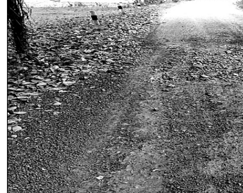
ଖାଲଖମାରେ ପୂରିଥିବା ରାସ୍ତା ।