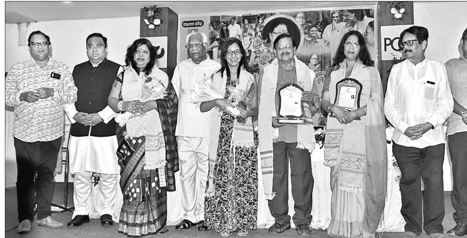
ପ୍ରେସ କ୍ଲବ୍ ଅଫ୍ ଓଡ଼ିଶାରେ ଶନିବାର ଆୟୋଜିତ ଚନ୍ଦ୍ରପ୍ରଭା ସ୍ମୃତି ସମ୍ମାନ-୨୦୨୦ କାର୍ଯ୍ୟକ୍ରମରେ ଉପସ୍ଥିତ ଅତିଥିକ ଗଣରେ ସମ୍ମାନିତ ବ୍ୟକ୍ତିଗଣମାନେ।

କରୋନା ଭାଇରସ୍ ସଂକ୍ରମଣରୁ ଦୂରରେ ରହିବା ପାଇଁ ପରସ୍ପର ହାତ ମିଳାଇବାକୁ ବିଭିନ୍ନ ଗଣମାଧ୍ୟମରେ ସରକାରଙ୍କ ପକ୍ଷରୁ ସଚେତନ କରାଯାଇଛି। ଯାହାକୁ ନେଇ ଚଳୁଛନ୍ତି ବର ଓ କନ୍ୟା। ସେମାନେ ବିବାହ ସମୟରେ ହାତ ଗଣ୍ଠି ପକେଇବେ କି ନାହିଁ ତାହାକୁ ନେଇ ତାଲୁକ ଫରାମର୍ଶ ନେଉଛନ୍ତି। ସେମାନେ ସକାଳୁ ଚା' ଦୋକାନରେ ବସି କଣେ ବର ନିଜ ନାମ ଗୋପନ ରଖି ବିଭିନ୍ନ ପ୍ରକାରର ଖଟି କରୁଥିଲେ। ଏବେ