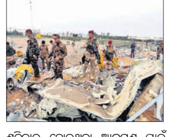
ଶନିବାର ହୋଇଥିବା ଆକ୍ରମଣ ପାଇଁ କୌଣସି ସଂଗଠନ ନିଜକୁ ଦାୟୀ କରି

ବାଗଦାଦ, ୧୫ମାର୍ଚ୍ଚ (ଏ.ଏ.ଏ.ସି) ଆମେରିକା ଓ ଯୁରୋପୀୟ ସୈନ୍ୟ ରହୁଥିବା ଜରାକର ଏକ ଘାଟି ଉପରେ ସାନିରକେଟ ମାଡ଼ ହୋଇଛି। ବାଗଦାଦର ଉତ୍ତର ପାର୍ଶ୍ୱରେ ଥିବା ଏହି ଘାଟି ଉପରେ ଦିନବେଳା ଆକ୍ରମଣ କରାଯାଇଛି। ଗତ ଅକ୍ଟୋବରଠାରୁ ଆମେରିକା ସୈନ୍ୟ ରହୁଥିବା ଜରାକର ବିଭିନ୍ନ ଘାଟି ଉପରେ ଏହା ୨୩ତମ ଆକ୍ରମଣ।