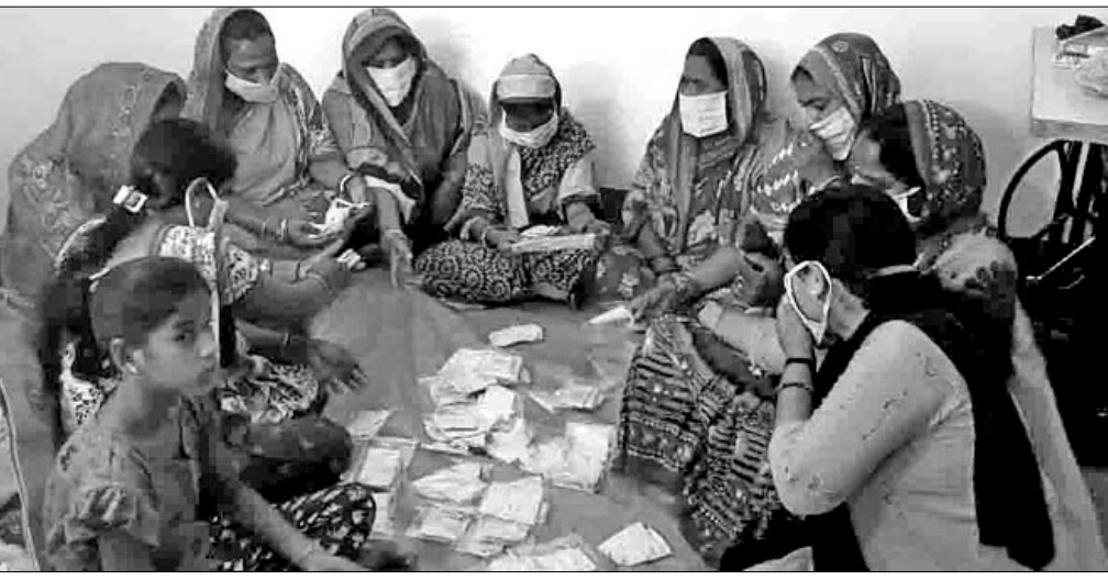
ମହିଳାମାନେ ମାଝ ତିଆରି କରୁଛନ୍ତି ।

କରୋନା ଭାଇରସ ବିଶ୍ୱରେ ଆତଙ୍କ ସୃଷ୍ଟି କରିଥିବା ବେଳେ ଏହାକୁ ରାଜ୍ୟ ବିପତ୍ତି ବୋଲି ସରକାର ଘୋଷଣା କରିଛନ୍ତି । କରୋନାକୁ ରକ୍ଷା ପାଇବା ପାଇଁ ମାଝ ଓ ସାନିଟାଇଜର ବ୍ୟବହାର କରିବା ଉପରେ ଗୁରୁତ୍ୱ ଦିଆଯାଉଥିବା ସରକାର ଏହାକୁ ଜରୁରୀ ସାମଗ୍ରୀରେ ସାମିଲ କରିଛନ୍ତି । ଲୋକେ ଅଧିକ ପରିମାଣରେ ମାଝ ବ୍ୟବହାର କରୁଥିବାରୁ ବଜାରରେ ସବୁ ସମୟରେ ଉପଲବ୍ଧ ହେଉନାହିଁ । ଏହାକୁ ଦୃଷ୍ଟିରେ ରଖି ବାଙ୍କୀ ବ୍ଲକ ଅନ୍ତର୍ଗତ ବ୍ରହ୍ମପୁରୀ ମା'ମଙ୍ଗଳା ସ୍ୱୟଂ ସହାୟିକା ଗୋଷ୍ଠୀର ୩୦ ଜଣ ମହିଳା ଏକତ୍ରିତ ହୋଇ ମାଝ ପ୍ରସ୍ତୁତ କରୁଛନ୍ତି । ଏହି ଗୋଷ୍ଠୀର ମହିଳାମାନେ ଦୈନିକ ୪ ଘଣ୍ଟା ପରିଶ୍ରମ କରି ହଜାରରୁ ଊର୍ଦ୍ଧ୍ୱ ମାଝ ତିଆରି କରୁଛନ୍ତି । ପ୍ରତି ମାଝର ମୂଲ୍ୟ ୧୦ ଟଙ୍କା ରଖାଯାଇଛି । ଏହା ସୂତା କପଡ଼ାରେ ପ୍ରସ୍ତୁତ ହୋଇଥିବା ବେଳେ ଗରମ ପାଣିରେ ଧୋଇ ବାରମ୍ବାର ବ୍ୟବହାର କରାଯାଇପାରିବ ବୋଲି ଏହି ସ୍ୱୟଂସହାୟିକା ଗୋଷ୍ଠୀ