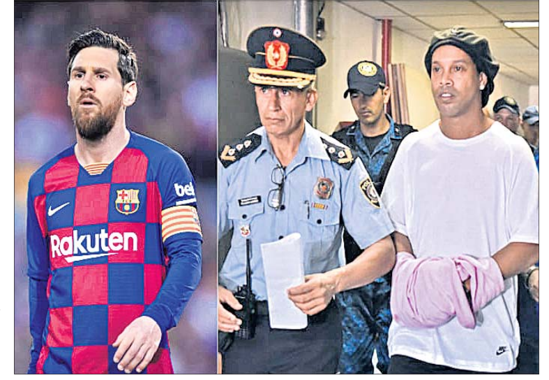
ଲିଓନେଲ୍ ମେସି ଓ ରୋନାଲ୍ଡିନୋ।

କାସିନୋ ମାଲିକଙ୍କ ଆମନ୍ତ୍ରଣରେ ପୂର୍ବତନ ସ୍ୱାଜିଲି ଓ ବାସିଲୋନା ଖୁବ୍ ରୋନାଲ୍ଡିନୋ ଫେବ ପାସପୋର୍ଟ ସହ ପାରାଗୁଏ ଗସ୍ତ କରିଥିଲେ। ୨୦୦୨ ଫିଫା ବିଶ୍ୱକପ୍ ଚାମ୍ପିୟନ ଦଳର ଏହି ସଦସ୍ୟଙ୍କୁ ସେଠାରେ ପୋଲିସ୍ ରିଟର୍ଣ୍ଣ କରି କେଲକ୍ ପଠାଇଛି। ତାଙ୍କୁ ସାହାଯ୍ୟ କରିବା ପାଇଁ ଆଗେଇ ଆସିଛନ୍ତି ପୁରୁଣା ବନ୍ଧୁ ଲିଓନେଲ୍ ମେସି। ସର୍ବାଧିକ ୬ଥର ବାଲୋନ୍ ଡ'ଅର ପୁରସ୍କାର ବିଜେତା ମେସି ୩୯ ବର୍ଷୀୟ ରୋନାଲ୍ଡିନୋଙ୍କୁ କେଲକୁ ବାହାରକୁ ଆଣିବା ଲାଗି ୪ ଓଲିକ୍‌କୁ ନିୟୁକ୍ତ କରିଛନ୍ତି। ଏଥିପାଇଁ ସେ ୪ ନିୟୁତ ଯୁରୋ ଖର୍ଚ୍ଚ କରିଛନ୍ତି, ଯାହା ଭାରତୀୟ ମୁଦ୍ରାରେ ସାତେ ୨୯ କୋଟି ଟଙ୍କାରୁ ଊର୍ଦ୍ଧ୍ୱ। ମେସି କୁନିୟର ପ୍ରଭରେ ଖୁବ୍ ହୋଇ ଉଭା ହେଉଥିବାବେଳେ