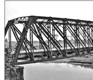
ପୂର୍ବରୁ ଥିବା ଲୌହସେତୁ ।