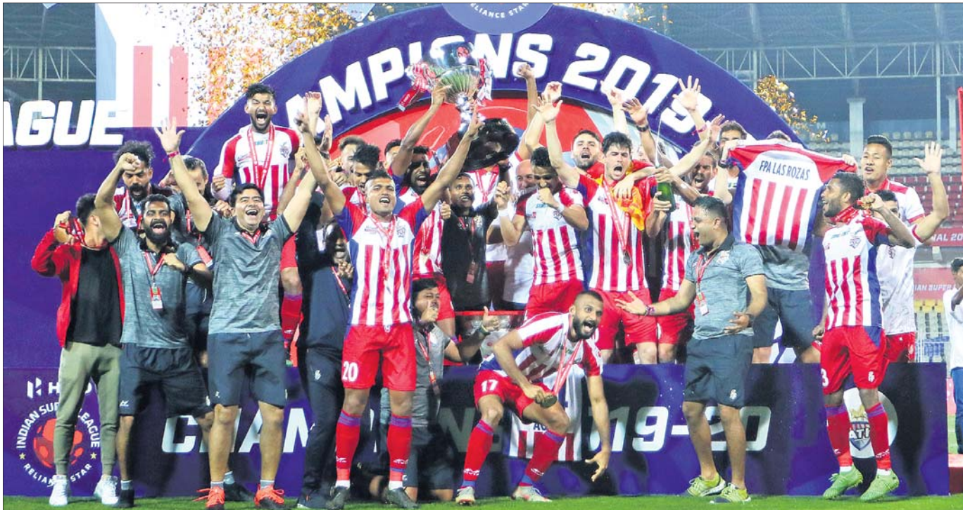
ରେକର୍ଡ଼ ତୃତୀୟ ଥର ପାଇଁ ଆଇଏସ୍‌ଏଲ୍ ଟ୍ରଫି ଜିତିବା ପରେ ଏଟିକେ ଦଳର ଖେଳାଳିମାନେ ଖୁସି ମନାଉଛନ୍ତି।

ମାନଗାଓ, ୧୪ମାର୍ଚ୍ଚ (ପି.ଟି.): ଏଟିକେ ପ୍ରଥମ ଦଳ ଭାବେ ତୃତୀୟଥର ପାଇଁ ଚାମ୍ପିୟନ ହେବାର ଗୌରବ ଅର୍ଜନ କରିଛି। ଗୁଆନ୍ଜୋ କ୍ୱାଡ୍ରାଣ୍ଟରେ ଶନିବାର ଅନୁଷ୍ଠିତ ଫାଇନାଲ ମ୍ୟାଚ୍ ଅର୍ଜନ କରିଛି। ଦେଶର ଏହି ସର୍ବବୃହତ ଯୁବକ ଲିଗ୍ରେ ଷଷ୍ଠ ସଂସ୍କରଣର ଫାଇନାଲରେ ଏଟିକେ ୩-୧ ଗୋଲରେ ଚେନାଇନ ଏସ୍‌ସିକୁ ପରାସ୍ତ କରିଛି। ଏଥିସହ ଆଇଏସ୍‌ଏଲ୍ ଇତିହାସରେ