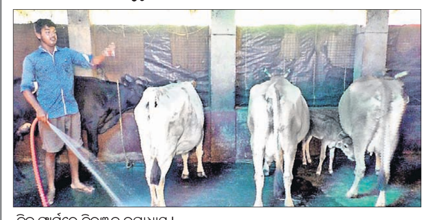
ନିଜ ଫାର୍ମରେ ନିରଞ୍ଜନ ଉପାଧ୍ୟାୟ।