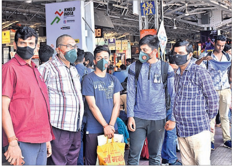
ଭୁବନେଶ୍ଵର ରେଳ ଷ୍ଟେସନରେ ଯାତ୍ରୀମାନେ ପୁହଁରେ ମାସ୍ ପିଛି ଟ୍ରେନକୁ ଅପେକ୍ଷା କରିଛନ୍ତି।