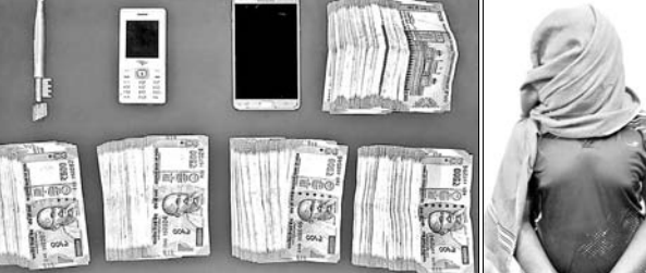
ଜବତ ମୋବାଇଲ୍, ଟଙ୍କା ଓ ଗିରଫ ଅଭିଯୁକ୍ତ।