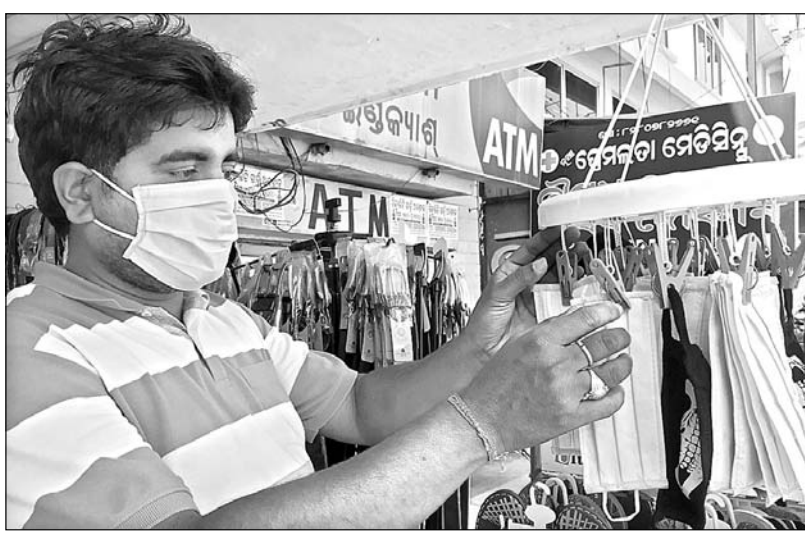
କରୋନା ଭୂତାଣୁରୁ ରକ୍ଷା ପାଇବା ପାଇଁ କଟକ ବାଦାମବାତି ଅଞ୍ଚଳର ଏକ ଦୋକାନରୁ ଜଣେ ମୁଦକ ମାସ୍କ କିଣୁଛନ୍ତି।