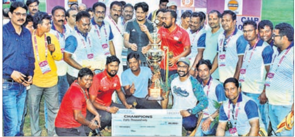
ଚ୍ରୁପି ସହ ଚାମ୍ପିୟନ ଓଡ଼ିଶା ପୋଷ୍ଟାଲ ଦଳ ।