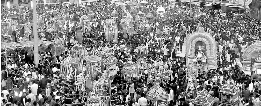
ପଲଟଣ ପତିଆରେ ଠାକୁରଙ୍କ ମେଳଣ ଦେଖିବାକୁ ଶ୍ରଦ୍ଧାଳୁଙ୍କ ଭିଡ଼।

ଖୋର୍ଦ୍ଧା ଅଫିସ୍, ୧୫୩୩-ବ୍ରହ୍ମପୁର ବଡ଼ ମେଡ଼ିକାଲରେ ଗତ ୧୪ ତାରିଖରେ ଜଣେ କରୋନା ସହିତ୍ୱ ଭାଙ୍ଗି ହୋଇଥିଲା। ଶନିବାର ବିଳମ୍ବ ରାତିରେ ସେ ଫେରାର ହୋଇଯାଇଛନ୍ତି।