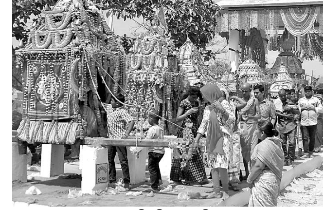
ଶ୍ରଦ୍ଧାଳୁମାନେ ଠାକୁରଙ୍କ ଉପରେ ଅଭିଷେକ କରୁଛନ୍ତି।

କଟଣା, ୧୫୩୩(ଡି.ଏନ.ଏ.): ଓଡ଼ିଶା ପ୍ରସିଦ୍ଧ ହରିରାଜପୁର ପଞ୍ଚୁଦୋଳ ମେଳଣ ଉପରେ କରୋନା ଚଳି ପଲଟଣ ହୋଇଛି। କଟଣା ନିକଟବର୍ତ୍ତୀ ଶ୍ରୀପତିଆଣ୍ଡା ସୋମନାଥ ଦେବଙ୍କ ଆରମ୍ଭ ହୋଇଥିବା ଏହି ପ୍ରସିଦ୍ଧ ମେଳଣର ଶନିବାର ଜଣାଶୁଣା ପ୍ରତିଷ୍ଠିତ ହୋଇଥିଲା।