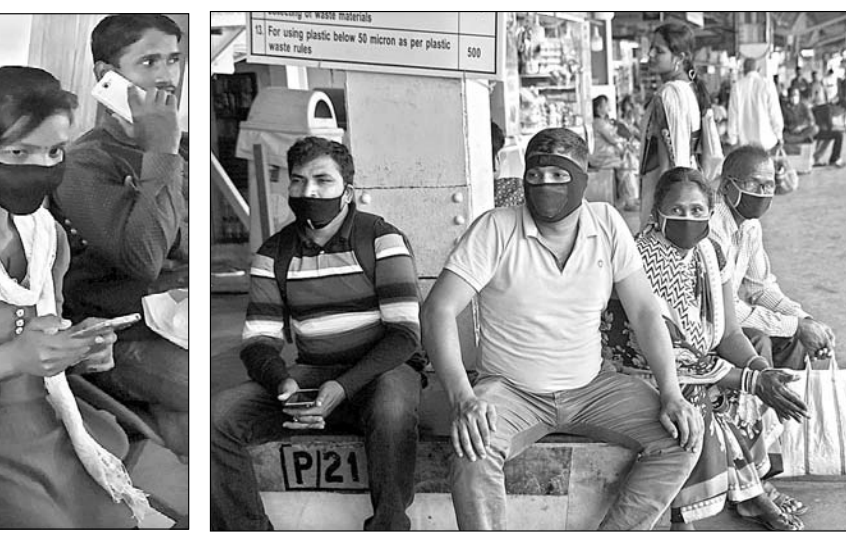
କରୋନା ଭୂତାଣୁରୁ ରକ୍ଷା ପାଇବା ପାଇଁ କଟକ ରେଳ ଷ୍ଟେସନ ପ୍ଲାଟଫର୍ମରେ ମାସ୍କ ପିନ୍ଧି ବସିଛନ୍ତି।