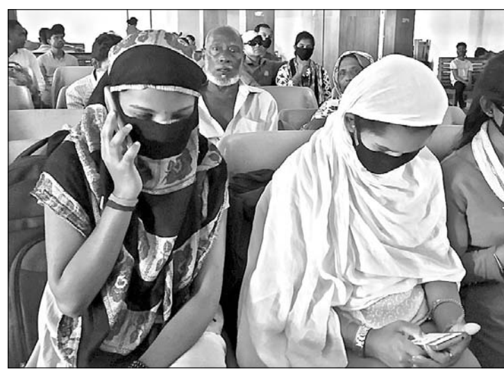
କରୋନା ଭୂତାଣୁରୁ ରକ୍ଷା ପାଇବା ପାଇଁ ବାଦାମବାତି ବସ୍ତାମାଗାର ଓ କଟକ ରେଳ ଷ୍ଟେସନ ପ୍ଲାଟଫର୍ମରେ ମାସ୍କ ପିନ୍ଧି ବସିଛନ୍ତି।