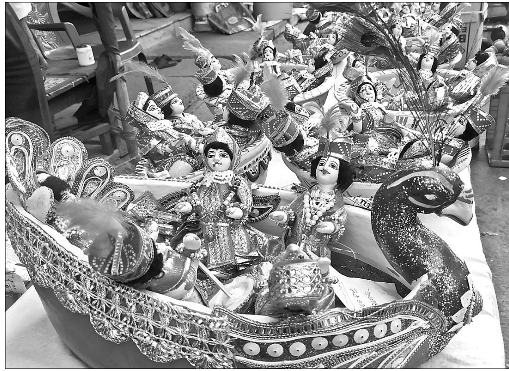
ମାରଣାନ୍ତ ପହଞ୍ଚାଇବା ପାଇଁ ହେବାକୁ ଥିବା ପାରମ୍ପରିକ ଗଣଗୌର ପୂଜା ଲାଗି କଟକ ନୟାସଡ଼କ ଅଞ୍ଚଳରେ ବିକ୍ରି ପାଇଁ ରଖାଯାଇଥିବା ଗଣଗୌର ମୂର୍ତ୍ତି।