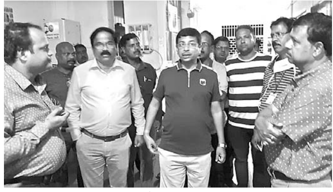
ଅଧିକାରୀମାନେ ସ୍ୱାସ୍ଥ୍ୟକେନ୍ଦ୍ର ପରିବର୍ତ୍ତନ କରୁଛନ୍ତି।