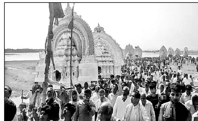
ଶୋଭାଯାତ୍ରାରେ ଠାକୁରଙ୍କୁ ଅଣାଯାଉଛି।

କୃଷ୍ଣପ୍ରସାଦ, ୧୫୩୩ (ଡି.ଏନ.ଏ.): ପୂରୀ ଜିଲ୍ଲା କୃଷ୍ଣପ୍ରସାଦ ବ୍ଲକ୍ ପ୍ରସିଦ୍ଧ ପଞ୍ଚୁଦୋଳ ଯାତ୍ରା କରୋନା ପ୍ରଭାବରେ ଖାଁ ଖାଁ ହୋଇପଡ଼ିଛି। ବକିତବର୍ଷ ବିନା ପାଟ ପଞ୍ଚୁଆର, ଆତସବାଦିରେ କେବଳ ପରମ୍ପରାକୁ ବଞ୍ଚାଇବା ପାଇଁ ସୁସଜ୍ଜିତ ବିମାନରେ ୨୩ ଠାକୁର ପଞ୍ଚୁଦୋଳ ପତିଆରେ ପହଞ୍ଚି ନିଜ ନିଜ ଆସନରେ ବସିଥିଲେ।