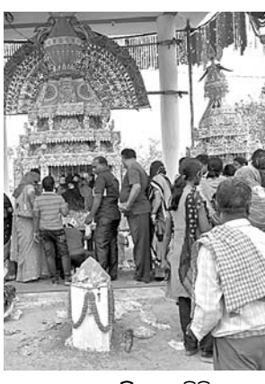
ମେଳଣ ପଡ଼ିଆରେ ବିଭିନ୍ନ ସାଂସ୍କୃତିକ କାର୍ଯ୍ୟକ୍ରମ ପରିବେଷଣ ହୋଇଥିଲା। ରଞ୍ଜିତ ଆଲୋକମାଳା ଓ ଚିତ୍ରକର୍ଷକ ବାଣ ପ୍ରଦର୍ଶନରେ ମେଳଣ ପଡ଼ିଆ ଖଲି ଉଠିଥିଲା। ପାରମ୍ପରିକ ଘୋଡ଼ା ନାଚ, ନାଗା ନୃତ୍ୟ, ବାଦ୍ୟ ବିତ୍ରା, ତୁରୀ ଓ ଶଙ୍ଖ, ହରିବୋଲ ହୁଳହୁଳି ଧ୍ୱନିରେ ମେଳଣ ପଡ଼ିଆରେ ଏକ ଆଧ୍ୟାତ୍ମିକ ପରିବେଷଣ ସୃଷ୍ଟି ହୋଇଥିଲା। ମେଳଣକୁ ଆସୁଥିବା ଲକ୍ଷାଧିକ ଲୋକଙ୍କ ସୁବିଧା ନିମନ୍ତେ ଅଗ୍ନିଶାଳ ସେବା, ପାନୀୟ ଜଳଯୋଗାଣ ବ୍ୟବସ୍ଥା, ସୂଚନା କେନ୍ଦ୍ର ଓ ଅସ୍ଥାୟୀ ସ୍ୱାସ୍ଥ୍ୟସେବା ସହିତ ଜରୁରୀକାଳୀନ ପାଇଁ ଆୟୁର୍ବିଦ୍ଧ ସୁବିଧା କରାଯାଇଥିଲା। ଶାନ୍ତିଶୃଙ୍ଖଳା ରକ୍ଷା ପାଇଁ ଯୁବକମାନଙ୍କୁ ନେଇ ଏକ କମିଟି ଗଠନ ହୋଇଥିଲା। ଡେଲାଙ୍ଗ ଥାନା ପକ୍ଷରୁ ସମସ୍ତ ସଦକ୍ଷେପ ନିଆଯାଇଥିବା ଆଇଆଇଏ

ଡେଲାଙ୍ଗ ବୁଦ୍ଧ ପ୍ରସିଦ୍ଧ ହରିରାଜପୁର ପଞ୍ଚୁଦୋଳ ମେଳଣ ଶନିବାର ବିକଳର ରାତ୍ରକୁ ଜମାଣ ହୋଇଛି। ମନ୍ଦିରରେ ସମସ୍ତ ଦେବନାତି ସମ୍ପର୍କରେ ଶ୍ରୀ ଶ୍ରୀ ପଣ୍ଡିମାଣ୍ଡୁ ସୋମନାଥ ଦେବ ସୁସଜ୍ଜିତ ବିମାନରେ ଶ୍ରୀକାଳୀ ଗଣେଶରେ ମେଳଣ ପଡ଼ିଆକୁ ବିଜେ କରିଥିଲେ। ଆଲୋକସଜ୍ଜା, ଚିତ୍ରାକର୍ଷକ ଆଡ଼ମ୍ବରୀ ପ୍ରଦର୍ଶନ, ଭଜନ କାର୍ତ୍ତନ, ଘଣ୍ଟଘଣ୍ଟା, ତୁରୀ, ଶଙ୍ଖନାଦ, ସଖାନୃତ୍ୟ ପ୍ରଭୃତି ଶୋଭାଯାତ୍ରାରେ ଦେଖିବାକୁ ମିଳିଥିଲା। ସ୍ଥାନାଧିପତି ପ୍ରଭୁ ଶ୍ରୀ ପଣ୍ଡିମାଣ୍ଡୁ ସୋମନାଥ ଦେବ, ଡେଲାଙ୍ଗର ଓ ବାଳପୁଣ୍ଡୁ ଦେବଙ୍କ ସହ ମିଶି ଏକ ସୁସଜ୍ଜିତ ବିମାନରେ ମନ୍ଦିରର ପଣ୍ଡିମାଣ୍ଡୁ ବାହାରି ଏକ ବିରାଟ ପଟୁଆରରେ ମେଳଣ ପଡ଼ିଆକୁ ଯାତ୍ରା କରିଥିଲେ। ସେହିପରି ରାଜାଙ୍କ ଦ୍ୱାରା ପ୍ରତିଷ୍ଠିତ ଦେବ ବିଗ୍ରହ ବୁଢ଼ାପଡ଼ାର ସୋମନାଥ ଦେବ, କୁମ୍ଭାମ୍ବରୀ ଛଣ୍ଡଘରର ଗତିଶୂରଦେବ, କିନ୍ତା ଗ୍ରାମର ବାଲୁକେଶ୍ୱରଦେବ ଏବଂ ଚାନ୍ଦିକିରୀ ଗ୍ରାମର ନାଳକଣ୍ଠେଶ୍ୱର ଦେବ ଏହି ମେଳଣରେ ଯୋଗଦେଇଥିଲେ। ବିଭିନ୍ନ ଗ୍ରାମରୁ ପ୍ରାୟ ୮୦ଟି ବିମାନ ଆସିଥିଲା। ମେଳଣର ପୁଖ୍ୟ ଆକର୍ଷଣ ହେଉଛି ଗୋପାଳନାଥ ଓ ବାଳପୁଣ୍ଡୁ ଦେବ, ଶ୍ରୀ ପଣ୍ଡିମାଣ୍ଡୁ ସୋମନାଥ ଦେବଙ୍କ ସୁସଜ୍ଜିତ ବିମାନ ସହିତ ସଲଜନ ଓ ଆଡ଼ମ୍ବରୀ ପ୍ରଦର୍ଶନ।