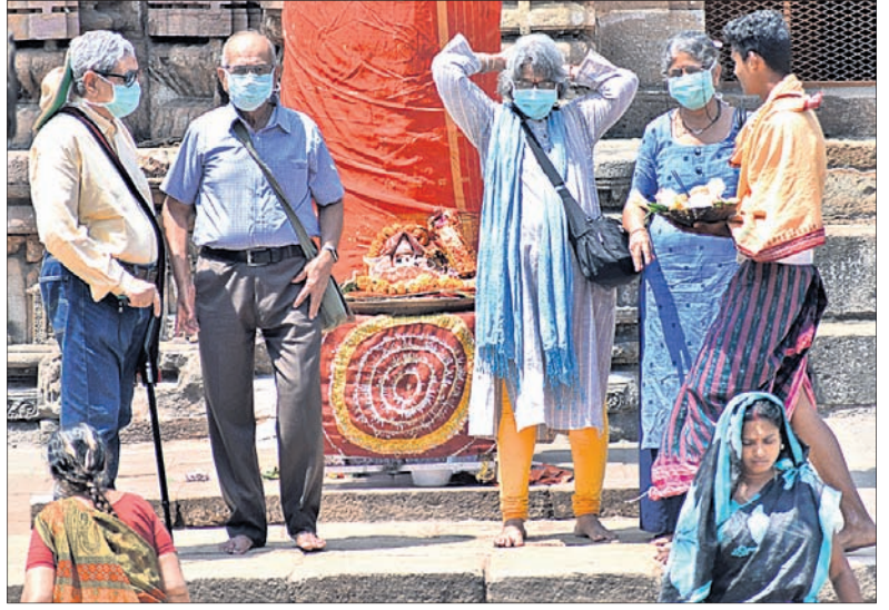
ଶ୍ରୀଲଙ୍କାରେ ମନିର ପରିସରରେ ଶ୍ରୀକାଳୁମାନେ ମାସ୍ ପିଛି ଠାକୁର ବର୍ଣ୍ଣନ କରୁଛନ୍ତି।