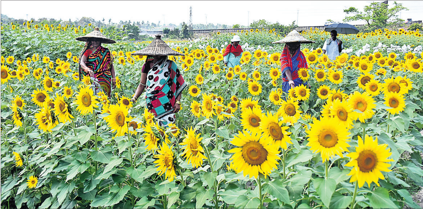
ଭୁବନେଶ୍ଵର ବରମୁଣ୍ଡାସ୍ଥିତ ଓୟୁଏଟି ଫାର୍ମରେ କୃଷି ଶ୍ରମିକମାନେ ସୂର୍ଯ୍ୟମୁଖୀ କ୍ଷେତରେ କାର୍ଯ୍ୟ କରୁଛନ୍ତି।