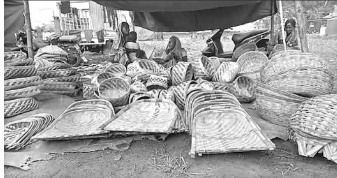
ଯାତ୍ରା ପତିଆକୁ ବିକ୍ରି କରିବା ଲାଗି ଜଣେ କାରିଗର ବାଉଁଶ ତିଆରି ସାମଗ୍ରୀ ଆଣିଛନ୍ତି।

ଝୁଞ୍ଚକାଣ୍ଡରେ ପରିବାର ପ୍ରତିପୋଷଣ କରୁଥିବା ଏହି କାରିଗରମାନେ କେବଳ ଯାତ୍ରା ପତିଆ ଆସିଲେ ସେମାନଙ୍କ ମନରେ ଦୟା ହେଇ ଚାଲିଯାଏ। ସେମାନେ ଗ୍ରାମାଞ୍ଚଳ ଓ ସହରାଞ୍ଚଳରେ ଆୟୋଜିତ ହେଉଥିବା ବିଭିନ୍ନ ଯାତ୍ରାପତିଆରେ ପସରା ମେଲି ବର୍ଷକର ଆହାର ପାଇଁ ବ୍ୟବସାୟରେ ନିଯୋଜିତ ହୁଅନ୍ତି।