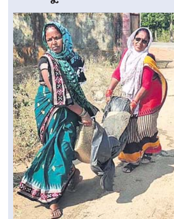
ମୃତଦେହକୁ ମହିଳାମାନେ ଆଣୁଛନ୍ତି ।