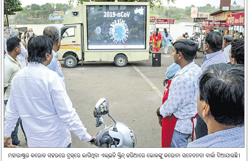
ମହାରାଷ୍ଟ୍ର କରୋନା ସହରରେ ଗୁଡ଼ିକ ଲାଗିଥିବା ଏଭଳି ଟ୍ରକ୍ ଦେଖିବାକୁ କରୋନା ସତରକ୍ଷା ବାର୍ତ୍ତା ଦିଆଯାଇଛି।