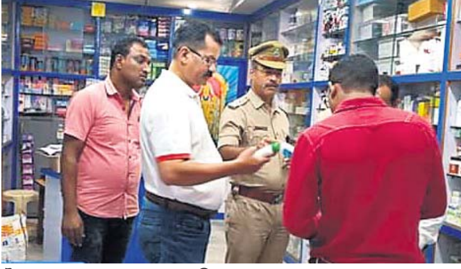
ଔଷଧ ଦୋକାନରେ ତତ୍ପରତା କରାଯାଉଛି ।

କରାଯିବ ବୋଲି ମାଜିଷ୍ଟ୍ରେଟ୍ ପ୍ରକାଶ କରିଥିଲେ । ରଣଶିଖା ବିଭାଗର ନିର୍ଦ୍ଦେଶ ଅନୁଯାୟୀ ବ୍ଲକରେ ଥିବା ସମସ୍ତ ସ୍କୁଲ କଲେଜର ପାଠପଢ଼ା ବନ୍ଦ କରିବା ଲାଗି ନିର୍ଦ୍ଦେଶ ଦିଆଯାଇଥିବା ବେଳେ ଘରୋଇ କୋଟିଂ ସେକ୍ଟର ଓ ଟ୍ରେଡିଂ ଅନୁଷ୍ଠାନଗୁଡ଼ିକ ମଧ୍ୟ ୩୧ ତାରିଖ ପର୍ଯ୍ୟନ୍ତ ବନ୍ଦ କରିବାକୁ ନିର୍ଦ୍ଦେଶ ଦିଆଯାଇଛି ବୋଲି ଗୋଷ୍ଠୀ ଶିକ୍ଷାଧିକାରୀ ରାଧାକାନ୍ତ ଛତ୍ରିୟ ପ୍ରକାଶ କରିଛନ୍ତି । କରୋନାକୁ ନେଇ ଭୟଭୀତ ନ ହୋଇ ଏହାର ମୁକାବିଲା ପାଇଁ ସଚେତନ ହେବାକୁ ବ୍ଲକ ପ୍ରଶାସନ ତରଫରୁ ନିର୍ଦ୍ଦେଶ କରାଯାଇଛି । ଏହି ବୈଠକକୁ ବ୍ଲକର କନିଷ୍ଠସମ୍ପା ଭ୍ରମରବର କିଶାନ ନିୟମ ଅନୁଯାୟୀ କାର୍ଯ୍ୟାଳୟ ଗ୍ରହଣ