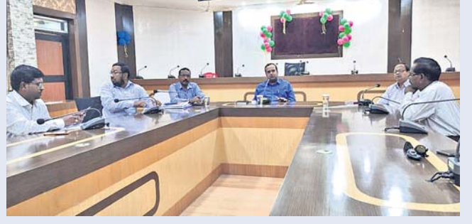
ଜିଲ୍ଲାପାଳଙ୍କ ଅଧିକାରୀଙ୍କ କରୋନା ମୁକାବିଲା ନେଇ ବସିଥିବା ବୈଠକ

ରାଜ୍ୟରୁ ଆସୁଥିବା ୨୨ ଜଣ ବ୍ୟକ୍ତିଙ୍କ ଉପରେ ନଜର ରଖି ଜିଲ୍ଲା ପ୍ରଶାସନକୁ ସୂଚନା ଦେବାକୁ କୁହାଯାଇଛି । ବିଭିନ୍ନ କର୍ମଶାଳା, ବୈଠକ, ଚାଲିମ ଶିବିରକୁ ବନ୍ଦ ରଖାଯାଇଛି ବୋଲି ଜିଲ୍ଲାପାଳ