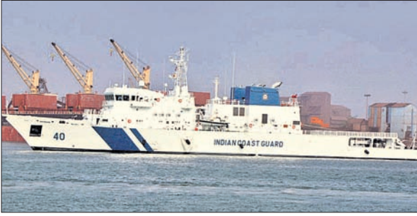
ପାରାବାପ ତଟରେ ଅତ୍ୟାଧୁନିକ ମୁକ୍ତକାରୀ 'ଭରଦ୍' ।

ଭରଦ୍-ପୂର୍ବ ଉପକୂଳ ସମୁଦ୍ର ସାମାରେ ପାଟ୍ଟୋଲି ପାଇଁ ବୁଧବାର ଭାରତୀୟ ତଟରକ୍ଷା ବାହିନୀ(କୋଷ୍ଠଗାର୍ଡ)ରେ ଅତ୍ୟାଧୁନିକ ମୁକ୍ତକାରୀ 'ଭରଦ୍' ସାମିଲ ହୋଇଛି । ବୁଧବାରଠାରୁ ଏହା ପାରାବାପସ୍ଥିତ ଓଡ଼ିଶା କୋଷ୍ଠଗାର୍ଡ ମୁଖ୍ୟାଳୟ-୭ରୁ ପାଟ୍ଟୋଲି ଆରମ୍ଭ କରିଛି ବୋଲି କୋଷ୍ଠଗାର୍ଡ ପକ୍ଷରୁ ସୂଚନା ଦିଆଯାଇଛି । ସ୍ୱଦେଶୀ ଜ୍ଞାନକୌଶଳରେ ନିର୍ମିତ ଏହି ଜାହାଜରେ ୩୦ ଏମ୍.ଏମ୍. ଗନ୍, ୧୨.୭ ଏମ୍.ଏମ୍. ଗନ୍ ସହ ଅନ୍ୟାନ୍ୟ ମୁକ୍ତକାରୀ ରହିଛି । ୯୮ମିଟର ଲମ୍ବ ଓ ୨୧୦୦ ଟନ୍ ବିଶିଷ୍ଟ ଓଜନର ଏହି ଜାହାଜରେ କେତେକ ସ୍ୱୟଂ ସୁବିଧା ରହିଛି । ବର୍ଥରେ ଲାଗିବା ବେଳେ ଏହା ପୋଲ ଭଳି ସ୍ୱୟଂ ଶିଫ୍ଟ କରିବ ଏବଂ ଏଥିରେ ପ୍ଲାଟଫର୍ମର ସୁବିଧା ମଧ୍ୟ ରହିଛି । ସ୍ୱୟଂ ବିଦ୍ୟୁତ୍ ପ୍ରଦ୍ୱାରଣର ବ୍ୟବସ୍ଥା ସହ ଭରଦ୍-ପାନର ଅଗ୍ନି ନିର୍ବାପକ ବ୍ୟବସ୍ଥା, ଦୁଇଟି ହେଲିକପ୍ଟର ଉଡ଼ାଣ ଭରିବା ଭଳି ବ୍ୟବସ୍ଥା, ୪ ହାଇସ୍ପିଡ୍ ବୋଟ, ଦୁଇଟି ଅଗ୍ନି