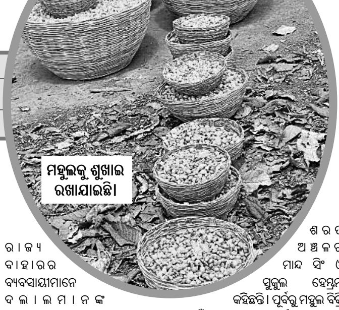
ମହୁଳକୁ ଶୁଖାଇ ରଖାଯାଇଛି।

ହୋଇଥାଏ। ଆଦିବାସୀମାନେ ଏହାକୁ ସଂଗ୍ରହ କରି ଯତ୍ନ ସହିତ ରଖିଥାନ୍ତି। ଜଙ୍ଗଲ ବିଭାଗ ତଥା ଜିଲ୍ଲା ପ୍ରଶାସନ ପକ୍ଷରୁ ସେପରି କିଛି ବିଧିବଦ୍ଧ ବ୍ୟବସ୍ଥା ନ ଥିବାରୁ ଉପରୋକ୍ତ ସଂଗ୍ରହକାରୀଙ୍କ ଆର୍ଥିକ ସ୍ଥିତିରେ କୌଣସି ସୁଧାର ଆସିବାର ସମ୍ଭାବନା ନାହିଁ। ଏପରି କି ମହୁଳ ସଂଗ୍ରହକାରୀମାନେ ୨କେଜି ଲୁଣକୁ ଏକ କେଜି ମହୁଳ ଦେଇ ବିଶୁ ଥିବାର