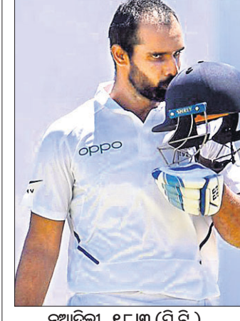
ନୂଆଦିଲ୍ଲୀ, ୧୮ ମାର୍ଚ୍ଚ (ପି.ଟି.)

ବିଶ୍ୱବ୍ୟାପୀ ଆତଙ୍କ ସୃଷ୍ଟି କରିଥିବା ମାମୁଲୀ କରୋନା ଭାଇରସ୍ ଲାଗି ପ୍ରାୟ ସମସ୍ତ ଖେଳ ବାତିଲ ହୋଇଯାଇଛି। ଏହି ଅବସରରେ ଖେଳାଳିମାନେ ଘରେ ରହି ସମୟ