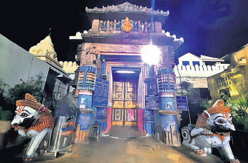
ରୁଧିର ରାତି ୭ଟା ୪୫ରେ ପୁରୀ ଶ୍ରୀମନ୍ଦିର ପହଞ୍ଚି ପଡ଼ିଯାଇଛି । (ବିପୋର୍ଟ: ପୃଷ୍ଠା-୯)