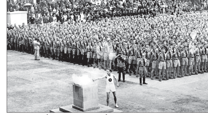
୧୯୩୬ ବଳିନ ଅଲିମ୍ପିକ୍‌ରେ ଲକ୍ଷ୍ମଣାଚେଟ୍‌ଠାରେ କୋମିଟି ପ୍ରକଳନ କରାଯାଇଛି।

ପରୋକ୍ଷରେ ଅଲିମ୍ପିକ୍ ମାଧ୍ୟମରେ ସେ କର୍ମୀମାନେ ଆଧିପତ୍ୟ, ସ୍ୱୟଂ ସମ୍ପୂର୍ଣ୍ଣତାକୁ ପ୍ରଦାନ ଓ ପ୍ରସାର କରିବାକୁ ଚାହୁଁଥିଲେ। ମଣାଲ ରିଲେର ପ୍ରତ୍ୟେକ ସୋପାନ, ପଥ, ପୁରାତନ ଗ୍ରୀକ୍ ସଭ୍ୟତାର ଆଥଲେଟିକ୍ ପ୍ରଦାନ ଓ ପ୍ରସାର ସୂଚିତ ଭାବେ କରାଯାଇଥିଲା। ତେବେ ଅଲିମ୍ପିକ୍ କୋମିଟି ପ୍ରକଳନ ପ୍ରଥମେ ୨୯୧୮ ଆମସ୍ତରରେ ରେପ୍‌ରେ ଆରମ୍ଭ ହୋଇଥିଲା। ଏହା ପରେ ପୁଣି ୧୯୩୨ ଲସ୍ ଏଞ୍ଜେଲ୍‌ସ୍‌ରେ ପ୍ରକଳିତ ହୋଇଥିଲା। ତେବେ ୧୯୨୮ ଓ ୧୯୩୨ କୋମିଟି ବାବଦରେ ସ୍ମୃତି କମ୍ ଲୋକ ଜାଣିଥିଲେ। ଏହା ଅଲିମ୍ପିଆ ବଦଳରେ ଘଟଣାସ୍ଥଳ ବା ସ୍ମୃତିସ୍ଥଳରେ ପ୍ରକଳିତ ହୋଇଥିଲା ବୋଲି ଇଣ୍ଟରନାଶନାଲ ସୋସାଇଟି ହେବାକୁ ଥିବା ୧୯୪୦ ଅଲିମ୍ପିକ୍ ଟେକ୍‌ସ୍ ବାତିଲ ହୋଇଥିଲା। ତେବେ ୧୯୪୮ରେ ପୁଣି ଥରେ ଅଲିମ୍ପିକ୍ ଆରମ୍ଭ ହୋଇଥିଲା ଓ ଏହାପରେ ମଣାଲ ରାଲିରେ ଆଧୁନିକତା ଆସିବା ସହ ଆହୁରି ଆକର୍ଷଣୀୟ ହୋଇଥିଲା।