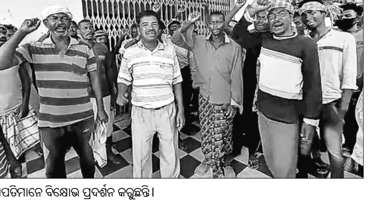
ବିସ୍ଫାପିତମାନେ ବିକ୍ଷୋଭ ପ୍ରଦର୍ଶନ କରୁଛନ୍ତି।

ମୟୂରଭଞ୍ଜ ଜିଲ୍ଲା ବାରିପଦା ବ୍ଲକ୍ ଲକ୍ଷ୍ମୀପୋଷିଠାରେ ସୁବର୍ଣ୍ଣରେଖା ଜଳସେଚନ ପ୍ରକଳ୍ପ ଯୋଗୁଁ ବିସ୍ଫାପିତ ହୋଇଥିବା ଶତାଧିକ ପରିବାରଙ୍କ ମଙ୍ଗଳବାରଠାରୁ ବିଦ୍ୟୁତ୍ କାଟ୍ କରାଯାଇଛି। ସୁବର୍ଣ୍ଣରେଖା ଜଳସେଚନ ପ୍ରକଳ୍ପ ବିଭାଗ ଗ୍ରାମବାସୀଙ୍କ ବିଦ୍ୟୁତ୍ କାଟ୍ କରି ଥିବାରୁ ସେମାନେ ଅସୁବିଧାର ସମ୍ମୁଖୀନ ହେଉଛନ୍ତି। ଏହାର ପ୍ରତିବାଦରେ ବୁଧବାର ବିସ୍ଫାପିତମାନେ ଲକ୍ଷ୍ମୀପୋଷିରେ ସୁବର୍ଣ୍ଣରେଖା ଜଳସେଚନ ପ୍ରକଳ୍ପଠାରେ ଧାରଣା ଦେବା ସହିତ ବିକ୍ଷୋଭ ପ୍ରଦର୍ଶନ କରିଥିଲେ। ହେଲେ କୌଣସି ଅଧିକାରୀମାନେ ଏ ଦିଗରେ କର୍ତ୍ତୃପତ୍ତ ନ କରିବାରୁ ଗ୍ରାମବାସୀ ଫେରି ଆସିଥିଲେ। ଆଗାମୀ ଦିନରେ ଏ ନେଇ ଆନ୍ଦୋଳନକୁ ଚାଳୁ କରିଯିବ ବୋଲି ଗ୍ରାମବାସୀ ଚେତାବନୀ ଦେଇଛନ୍ତି।