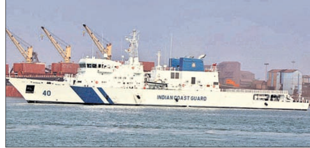
ପାରାଦୀପ ତଟରେ ଅତ୍ୟାଧୁନିକ ମୁକ୍ତାହାର 'ଭରଦ'।

ପାରାଦୀପ, ୧୮ମାର୍ଚ୍ଚ (ସ୍ୱ.ପ୍ର.) ଭରଦ-ପୂର୍ବ ଉପକୂଳ ସମୁଦ୍ର ସୀମାରେ ପାଟ୍ରୋଲିଂ ପାଇଁ ବୁଧବାର ଭାରତୀୟ ତଟରକ୍ଷା ବାହିନୀ(କୋଷ୍ଠଗାର୍ଡ)ରେ ଅତ୍ୟାଧୁନିକ ମୁକ୍ତାହାର 'ଭରଦ' ସାମିଲ ହୋଇଛି।