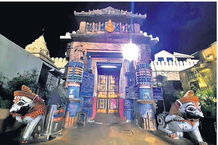
ରୁଧିର ରାତି ୭ଟା ୪୫ରେ ପୁରୀ ଶ୍ରୀମନ୍ଦିର ପହଞ୍ଚି ପଢ଼ିଯାଇଛି । (ବିପୋର୍ଟ: ପୃଷ୍ଠା-୯)