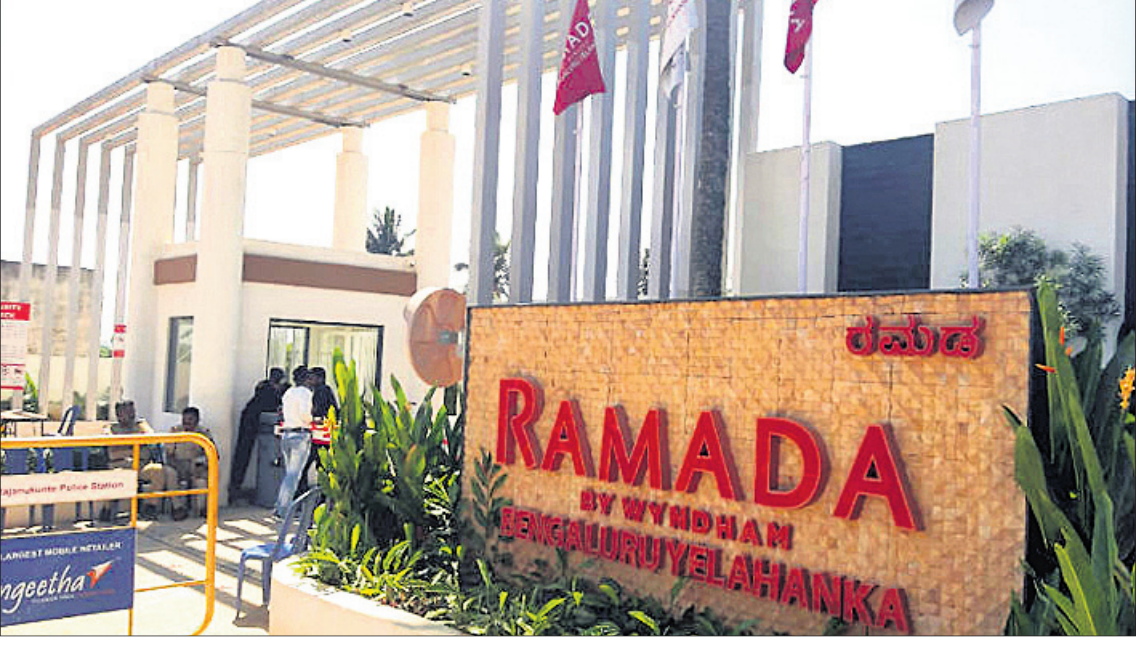
ମଧ୍ୟପ୍ରଦେଶର କଂଗ୍ରେସ ବିଧାୟକମାନେ ଥିବା ବେଙ୍ଗାଲୁରୁରୁ ରାମାଦା ହୋଟେଲ।

ରାଜ୍ୟଗୁଡ଼ିକରେ ଖଣିତ ଜନାଦେଶ ଯୋଗୁ ପୂର୍ଣ୍ଣ ହେଉଥିବା ଝୁଲି ବିଧାନସଭାର ପରବର୍ତ୍ତୀ ସ୍ଥିତି ହେଉଛି ଯୋଗାଡ଼ିଆ ସରକାର, ଯାହାକୁ କ୍ଷମତା ରାଜନୀତିରେ ମେଣ୍ଟି ବା ମହାମେଣ୍ଟ ସରକାର ବୋଲି କୁହାଯାଉଛି। ପରସ୍ପର ବିରୋଧାଭାସା ବିଚାରଧାରାର ଦଳଗୁଡ଼ିକକୁ ନେଇ ଗଠନ ହେଉଥିବା ଏପରି ସରକାର ପୂର୍ବା ୫ ବର୍ଷ ତିଷ୍ଠି ପାରୁନାହିଁ। ସରକାର ଗଠନର କିଛି ମାସ ପରେ ଦେଖାଦେଉଛି ଅତଳାବସ୍ଥା। ଅନେକ ସମୟରେ କ୍ଷମତା ପାଇଁ ବ୍ୟକ୍ତି ବିରୋଧୀ ଆପଣାଉଛନ୍ତି ଅସାଧୁ ଉପାୟ। ସଂଖ୍ୟାଗରିଷ୍ଠତା ନ ପାଇ କ୍ଷମତା ଦଖଲ କରିଥିବା ବଡ଼ ଦଳ ଓ ବିରୋଧୀ ଦଳ ମଧ୍ୟରେ ଦେଖିବାକୁ ମିଳୁଛି ଛକାପଞ୍ଚ। ବିଧାୟକମାନେ ବସ୍ ଓ ଚାର୍ଜିଡ଼ି ପୂର୍ବରୁ ବୁଝାହୋଇ ଅନ୍ୟ ରାଜ୍ୟର ରିସର୍ଚ୍ଚଗୁଡ଼ିକୁ ଯିବାର ଲକ୍ଷ୍ୟକର ଦୃଶ୍ୟ ବିଭିନ୍ନ ସମୟରେ ଦେଖି ପରଦାରେ ଦେଖିବାକୁ ମିଳିଥାଏ। କ୍ଷମତା ହାତେଇବା ପାଇଁ ଏହା ଏବେ ପାଇଁ ବିଧାୟକ ଶିକାରର ଏକ ନୂଆ ଗ୍ରହଣ।