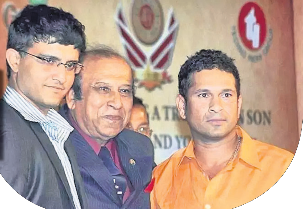
ସୌରଭ ଗାଙ୍ଗୁଲି ଓ ସଚିନ ଚେନ୍ନୁଲକରଙ୍କ ସହ ।