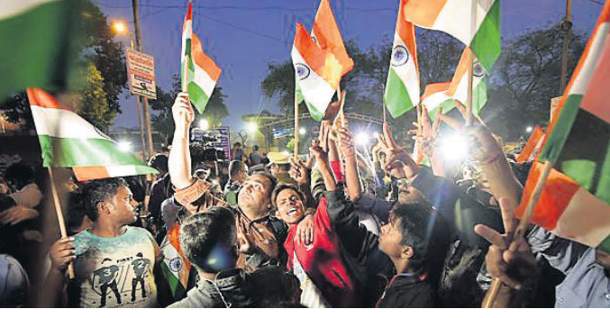
ଫାଶୀ ବେଳେ ଜେଲ ବାହାରେ ଉତ୍ସବ ମନାଇଛନ୍ତି ଲୋକେ ।