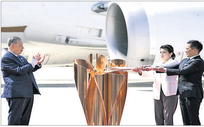
କାପାନ ଏୟାର ସେଲ୍-ଡିପେଟ୍ସ୍ ଫୋର୍ସ ମ୍ୟୁଖାମା ବେସ୍ରେ ପୂର୍ବତନ ଅଲିମ୍ପିକ୍ କ୍ରୀଡ଼ା ଚାମ୍ପିୟନ ସାଓରି ଯୋସିତା ଓ ତାତାହିରୋ ନୋମୁରା ଅଲିମ୍ପିକ୍ ଜ୍ୟୋତି ପ୍ରକଳନ କରୁଛନ୍ତି।

ଦିନିକିଆ ମ୍ୟୁଚିମା, ୨୦।୩ (ଏଏସପି) କରୋନା ଭାଇରସ୍ ସାଧାରଣତଃ ବିଶ୍ଵାସୀୟ ପ୍ରଭାବିତ କରିଥିବା ବେଳେ ଏବେ ଟୋକିଓରେ ଅଲିମ୍ପିକ୍ ଆୟୋଜନ ନେଇ ଆଶଙ୍କା ବୃଦ୍ଧିପାଇଛି।