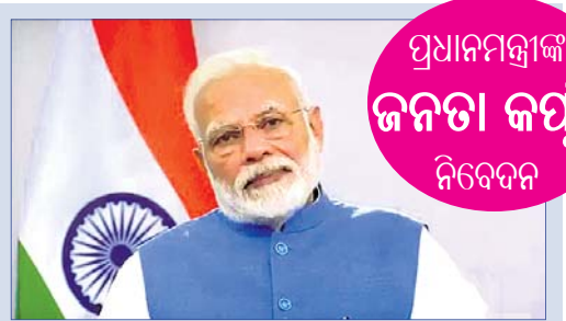
ପ୍ରଧାନମନ୍ତ୍ରୀଙ୍କ ଜନତା କର୍ମ୍ମ୍ୟ ନିବେଦନ

ଯଦି କରୋନା ନିୟନ୍ତ୍ରଣକୁ ଆସି ନ ଥାଏ ତେବେ ଏହାର ପ୍ରଭାବ ରଥଯାତ୍ରା ଉପରେ ପଡ଼ିବ । ରାଜ୍ୟ ସରକାର ରଥଯାତ୍ରା ପାଇଁ କୌଣସି ବଡ଼ ନିଷ୍ପତ୍ତି ନେଇପାରନ୍ତି ଏବଂ ସ୍ୱତନ୍ତ୍ର ରଥଯାତ୍ରା ହୋଇପାରେ ବୋଲି ଅନେକଙ୍କ ମଧ୍ୟରେ ଏବେ ଚର୍ଚ୍ଚା ହେଉଛି ।