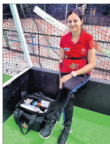
କ୍ୟାମ୍ପରେ ଉପସ୍ଥିତ ଭାରତୀୟ ମହିଳା ହକି ଟିମର ଫିଜିଓଥେରାପିଷ୍ଟ । ତାପମାତ୍ରାକୁ ମଧ୍ୟ ଚେକ୍ କରାଯାଉଛି । ଆମେ ଏକ ସୁରକ୍ଷିତ ପରିବେଶରେ ଅଭ୍ୟାସ କରୁଥିବା ନେଇ ସାଇ ପରିସରରେ ରହିଥିବା କ୍ରୀଡ଼ା ଅଧିକାରୀ

ବିଶ୍ୱରେ ଭୟଙ୍କର ପରିସ୍ଥିତି ସୃଷ୍ଟିକରିଥିବା କରୋନା ଭାଇରସ ସତ୍ତ୍ୱେ ଭାରତୀୟ ହକି ଦଳ 'ସୁରକ୍ଷିତ ପରିବେଶ'ରେ ଆରାମୀ ଅଲିମ୍ପିକ ପାଇଁ ସେମାନଙ୍କ ପ୍ରସ୍ତୁତି ଚଳାଇଛନ୍ତି । ଗୁମାସ୍ତା ଭାରତୀୟ କ୍ରୀଡ଼ା ପ୍ରାଧିକରଣ (ସାଇ) ସେକ୍ସର ପରିସରରେ ଆଇସୋଲେଶନରେ ରହି ଭାରତର ଉଭୟ ମହିଳା ଓ ପୁରୁଷ ହକି ଖେଳାଳି ଟୋକିଓ ଅଲିମ୍ପିକ୍ସ ପାଇଁ ନିଜକୁ ପ୍ରସ୍ତୁତ କରୁଛନ୍ତି । ଭାରତୀୟ ଖେଳାଳି ଏଠାରେ ଅଭ୍ୟାସ କରୁଥିବାରୁ ସାଇ ସେକ୍ସରକୁ ସମ୍ପୂର୍ଣ୍ଣ ଭାବେ ପ୍ରସ୍ତୁତ କରାଯାଇଛି । ଏଥିସହ ସେକ୍ସର ପରିସରକୁ ବାହାର ଲୋକଙ୍କ ପ୍ରବେଶ ଉପରେ କଟକଣା କାରି କରାଯାଇଛି । 'କରୋନା ଭାଇରସ ଆମର ଅଭ୍ୟାସ ସେସନକୁ ପ୍ରଭାବିତ କରିପାରିବ ନାହିଁ । ଆମେ ନିୟମିତ ଅଭ୍ୟାସରେ ସାତ ଘୋଡ଼ୁ ଏବଂ ଆମ ଖେଳାଳିଙ୍କ