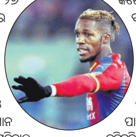
ମେଡିକାଲ ଷ୍ଟାଫ୍‌ଙ୍କ ସହାୟତା ଲାଗି ହୋଟେଲ ରୁମ୍ ଉପଲବ୍ଧ କରିଥିଲେ । ଜାହା ପ୍ରମିୟର କ୍ଲବ୍‌ରେ ପ୍ରତି ସପ୍ତାହରେ ଦେଢ଼ ଲକ୍ଷ ଆମେରିକୀୟ ଡଲାର ଆୟ କରନ୍ତି । ଭାରତୀୟ ପୁରୁଷରେ ଏହା ୧.୧୪ କୋଟି ଟଙ୍କା । ନ୍ୟାଶନାଲ ହେଲ୍‌ଥ ସର୍ଭିସ୍‌ସ୍‌ରେ (ଏନ୍‌ଏସ୍‌ଏସ୍‌)ରେ କାର୍ଯ୍ୟ କରୁଥିବା ମୋର କିଛି ବନ୍ଧୁ ଅଛନ୍ତି । ଏଭଳି ଘଟଣାରେ ପୁରୁଷରେ ନିଜ ଶିଫ୍ଟ ଶେଷ କରିବା ପରେ

ଯେଉଁମାନେ ଘରକୁ ଫେରି ପାରୁ ନାହାନ୍ତି, ସେମାନଙ୍କ ପାଇଁ ମାଗଣାରେ ରହଣି ବ୍ୟବସ୍ଥା କରିପାରିବ । ନିର୍ଦ୍ଦିଷ୍ଟ ସମେତ ହୋଟେଲରେ ମେଡିକାଲ ଷ୍ଟାଫ୍‌ଙ୍କ ପାଇଁ ମାଗଣାରେ ରହଣି ସୁଯୋଗ ଦେଇଛନ୍ତି । ୨୭ ବର୍ଷୀୟ ଆଇଭିଏଲ୍‌ସି କୋଷ୍ଠର ଅଭ୍ୟାସୀ ପୁରୁଷ ଖେଳାଳିଙ୍କ ପୂର୍ବରୁ ପୂର୍ବତନ ମାଷ୍ଟେଷ୍ଟର ଯୁନାଇଟେଡ୍ ଖେଳାଳି ଗ୍ୟାରି ନେଭିଲେ ଓ ଟେଲିଫୋନିକ ରୋମାନ ଆଡ୍ରାମୋଭିଚ ମେଡିକାଲ ଷ୍ଟାଫ୍‌ଙ୍କ ସହାୟତା ଲାଗି ହୋଟେଲ ରୁମ୍ ଉପଲବ୍ଧ କରିଥିଲେ । ଜାହା ପ୍ରମିୟର କ୍ଲବ୍‌ରେ ପ୍ରତି ସପ୍ତାହରେ ଦେଢ଼ ଲକ୍ଷ ଆମେରିକୀୟ ଡଲାର ଆୟ କରନ୍ତି । ଭାରତୀୟ ପୁରୁଷରେ ଏହା ୧.୧୪ କୋଟି ଟଙ୍କା । ନ୍ୟାଶନାଲ ହେଲ୍‌ଥ ସର୍ଭିସ୍‌ସ୍‌ରେ (ଏନ୍‌ଏସ୍‌ଏସ୍‌)ରେ କାର୍ଯ୍ୟ କରୁଥିବା ମୋର କିଛି ବନ୍ଧୁ ଅଛନ୍ତି । ଏଭଳି ଘଟଣାରେ ପୁରୁଷରେ ନିଜ ଶିଫ୍ଟ ଶେଷ କରିବା ପରେ