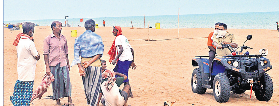
ପୁରୀ ବେଳାଭୂମିରେ ପ୍ରଚାର ଗାଡ଼ି ବୁଲି ଲୋକଙ୍କୁ ସଚେତନ କରୁଛି।

କୌଣସି ଦୋକାନ ନ ଖୋଲିବା, ୭ ଜଣରୁ ଅଧିକ ଲୋକଙ୍କ ଏକତ୍ରତା ବାରଣ କରାଯାଇଛି। ତେଣୁ ଏ ସବୁ ବିଷୟରେ ବ୍ୟବସାୟୀ ଏବଂ ଜନସାଧାରଣଙ୍କୁ ସଚେତନ କରିବା ଉଦ୍ଦେଶ୍ୟରେ ବୁଲୁଛି ପ୍ରଚାର ଗାଡ଼ି। ଶନିବାର ଉପଜିଲାପାଳଙ୍କ କାର୍ଯ୍ୟାଳୟରୁ ୪ଟି ଅଗୋ ବାହାରିଥିବା ବେଳେ ପୌରସଂସ୍ଥା ପକ୍ଷରୁ ମଧ୍ୟ ପ୍ରଚାର ଗାଡ଼ି ସହରରେ ବୁଲୁଛି। ରାଜ୍ୟ ସରକାରଙ୍କ ଦ୍ୱାରା ସମସ୍ତ ଧର୍ମାନୁଷ୍ଠାନକୁ କାରି କରାଯାଇଥିବା ମାର୍ଗଦର୍ଶିକାକୁ ଶୁଣାଇବା ସହ ପାଳନ କରନ୍ତୁ। ବାର, କଫି ଶପ, କ୍ୟାଢିନ ଇତ୍ୟାଦିକୁ ବୁଲୁଛ ବନ୍ଦ କରିବା ଲାଗି ସଚେତନ କରାଯାଇଛି। ସହରାଞ୍ଚଳରେ ବ୍ୟାଜି, ଅଗୋ ଦିନେ ଛତା ଦିନେ ଯାତାଯାତ କରିବାକୁ କୁହାଯାଇଛି। ଦୋକାନ, ହାଟ ଏବଂ ଶପିଂ ମଲରେ ଡାଲିଗାଢ଼କ, ପରିପରିବା, ଗ୍ରୋସରୀ, ମାଛ, ମାଂସ, ପ୍ୟାକେଟ ଷ୍ଟାର, ଔଷଧ ଓ ଦୈନନ୍ଦିନ ଆବଶ୍ୟକ ପଦାର୍ଥ ବିକ୍ରି କରାଯାଇପାରିବ। ଏହାଛଡ଼ା ଅନ୍ୟ ସମସ୍ତ ଦୋକାନ ବନ୍ଦ କରିବାକୁ ପ୍ରଶ୍ନାସନ ନିର୍ଦ୍ଦେଶ ଦେଇଛି। ଏହି ନିର୍ଦ୍ଦେଶମାନକୁ ପ୍ରାୟ ଦୋକାନ ମାନ୍ୟତା ବେଳେ ଅଳ୍ପ କିଛି ଦୋକାନ ରକ୍ଷାଧିନ କରିଥିବା ଦେଖିବାକୁ ମିଳୁଥିଲା।