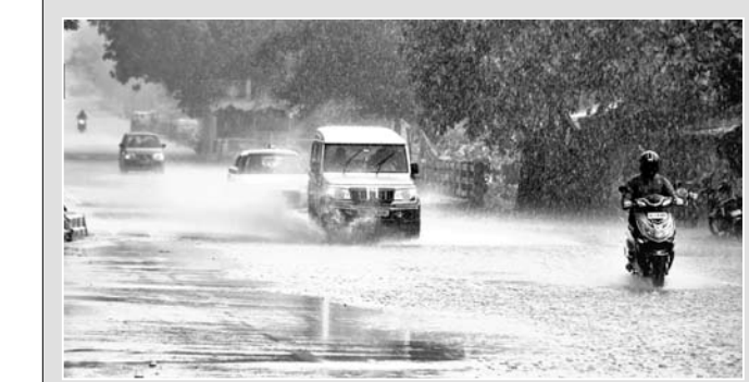
ଭୁବନେଶ୍ୱରରେ ଶନିବାର ହୋଇଥିବା ବର୍ଷା ସମୟର ଦୃଶ୍ୟ।

କରୋନା ଭୁତାଣୁ ପ୍ରକାଶିତ ପାଇଁ ଶନିବାର ଅପରାହ୍ଣକୁ ଜଣା ଅଞ୍ଚଳରେ ସମସ୍ତ ଲୋକଙ୍କୁ ଘରକୁ ଫେରିବାକୁ ନିର୍ଦ୍ଦେଶ ଦିଆଯାଇଛି।