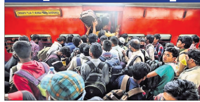
ମୁମ୍ବାଇରେ ଶନିବାର ଲୋକମାନଙ୍କୁ ଚଳିତ ବର୍ଷର ପ୍ରଥମ ଶ୍ରମିକମାନଙ୍କ ନିଜ ଅଞ୍ଚଳକୁ ଫେରିଯିବା ନିମନ୍ତେ ଭିଡ଼ ଲାଗାଇଛନ୍ତି ।