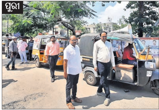
କରୋନା କଟକକଣା: ପୁରୀ ଉପଜିଲ୍ଲାପାଳଙ୍କ କାର୍ଯ୍ୟାଳୟ ନିକଟରୁ ଶନିବାର ବାହାରିଥିବା ୪ ସଚେତନତା ଗାଡ଼ି। ବନ୍ଦ ରହିଥିବା କଟକ ଦୋକମ୍ପୁରୀର ବାପାନାଟି ରାସ୍ତାପାର୍ଶ୍ୱ ଦୋକାନ ଓ ଭୁବନେଶ୍ୱର ବାପୁଜୀନଗର ବଜାର।

କଟକ ଅଫିସ, ୨୧ମା: କରୋନା ବିଶ୍ୱରେ ମହାମାରୀ ରୂପ ନେଇଛି। ପ୍ରଧାନମନ୍ତ୍ରୀଙ୍କ ଦ୍ୱାରା ଘୋଷଣା କରାଯାଇଥିବା ଜନତା କର୍ଫ୍ୟୁର ପ୍ରଭାବ ଏସ୍‌ସିରେ ମେଡିକାଲରେ ମଧ୍ୟ ପଡିବ। ଏହାକୁ ଦୃଷ୍ଟିରେ ରଖି ଏସ୍‌ସିରେ ମେଡିକାଲରେ ହେବାକୁ ଥିବା ସମସ୍ତ ନିୟମିତ ଅପରେସନ ସ୍ଥଗିତ ରଖାଯାଇଛି।