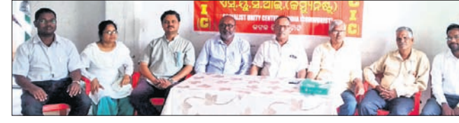
ବିଜ୍ଞାନର ବିଶେଷଜ୍ଞ, ଭେଷଜ ବିଜ୍ଞାନ ସହିତ ସଂଶ୍ଳିଷ୍ଟ ବୈଜ୍ଞାନିକ, ସରକାରୀ ଓ ଘରୋଇ ଅନୁଷ୍ଠାନର ସଂଘର ସହ ସମ୍ମିଳନୀ ତଦାଯାଇ ଆଲୋଚନା ହେବା ସହ ଏହାକୁ ଲୋକାଦି ଦିଗରେ ପଦକ୍ଷେପ ନିଆଯାଇ ବୋଲି ଦଳ ଦାବି କରିଛି।

କଟକ ଅଫିସ, ୨୧ମା: କରୋନା ଭୂତାଣୁ ପ୍ରଭାବରେ ବିଶ୍ୱବାସୀ ଆଡକ୍ଟିବ୍ ବେଶ ତଥା ରାଜ୍ୟରେ ମଧ୍ୟ ଏହାର ପ୍ରଭାବ ଦେଖିବାକୁ ମିଳୁଛି।