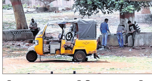
ତଳେ ବାଇକ ଓ ଚାରିଚକିଆ ଯାନ ଅଟୋ ରହିଥିବା ଦେଖିବାକୁ ମିଳିଥିଲା। ପ୍ରଶାସନ ପକ୍ଷରୁ କେବଳ ନିର୍ଦ୍ଦେଶନାମା ଜାରି କରାଯାଇଛି।

କରୋନା ଭୂତାଣୁ ସଂକ୍ରମଣ ମୁକାବିଲା ଲାଗି ଖୋର୍ଦ୍ଧା ଜିଲ୍ଲା ପ୍ରଶାସନ ପକ୍ଷରୁ ୧୪୪ ଧାରା ଜାରି କରାଯାଇଛି।