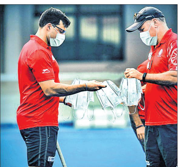
ପ୍ରଶିକ୍ଷକଙ୍କୁ ମାକୁ ପ୍ରଦାନ କରାଯାଉଛି । ସିଂ କହିଛନ୍ତି । ସେହିଭଳି ଏକ 'ସୁରକ୍ଷିତ ପରିବେଶ'ରେ ଅଭ୍ୟାସ କରିବାର ସୁଯୋଗ ପାଇଥିବାରୁ ଭାରତୀୟ ପୁରୁଷ ହକି ଦଳର ଅଧିନାୟକ ମନ୍‌ପ୍ରାଟ୍

ରାମପାଲ ଭାଗ୍ୟବାନ ମଣିଛନ୍ତି । 'ସାଇ କ୍ୟାମ୍ପ' ପରିସରରେ ଏଭଳି ସୁବିଧା ସୁଯୋଗ ପାଇଥିବାରୁ ଆମେ ବହୁତ ଭାଗ୍ୟଶାଳୀ । ଏଠାରେ ରହିଥିବା ସମସ୍ତ ଖେଳାଳି କଠିନ ରହିଥିବା କରୁଛନ୍ତି । ତେଣୁ ହକି ଟିମ୍ ଅଲିମ୍ପିକ୍ସ ପାଇଁ ପ୍ରସ୍ତୁତି କାରି ରଖିବା । ଆମର ସ୍ୱାସ୍ଥ୍ୟକୁ ପ୍ରତିବନ୍ଧିତ ଚେକ୍ କରାଯାଉଛି । ଆବଶ୍ୟକୀୟ ସମସ୍ତ ସାବଧାନତା ଆମେ ଅବଲମ୍ବନ କରୁଛୁ । ଆମର ପୁଖ୍ୟ ଲକ୍ଷ୍ୟ ଟୋକିଓ ଅଲିମ୍ପିକ୍ସରେ କିଭଳି ଭଲ ପ୍ରଦର୍ଶନ କରିପାରିବୁ ସେଥିନେଇ ସାଇ ଅଧିକାରୀ ସର୍ବଦା ସାହାଯ୍ୟ କରୁଛନ୍ତି ବୋଲି ରାଣା କହିଛନ୍ତି । ଉଲ୍ଲେଖଯୋଗ୍ୟ, ଟୋକିଓ ଅଲିମ୍ପିକ୍ସର ପୁରୁଷ ବିଭାଗ ହକିରେ ଟ୍ରେନିଂ ଯୋଗ୍ୟ ବିପକ୍ଷରେ ଖେଳି ଭାରତ ଏହାର ଅଭିଯାନ ଆରମ୍ଭ କରିବ । ସେହିଭଳି ରାଣାଙ୍କ ଦଳ ନେତୃତ୍ୱାଧିନ ବିପକ୍ଷରେ ଏହାର ପ୍ରଥମ ମ୍ୟାଚ ଖେଳିବ । ଉଭୟ ମ୍ୟାଚ୍ ଜୁଲାଇ ୨୫ରେ ଅନୁଷ୍ଠିତ ହେବ ।