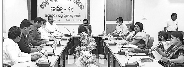
କରୋନା ଲାଗି ଖୋର୍ଦ୍ଧା ଜିଲ୍ଲାପରିଷଦ ବୈଠକରେ ଉପସ୍ଥିତ ବିଧାୟକ ଓ ଅଧିକାରୀ।

ଖୋର୍ଦ୍ଧା ଅଧିକାରୀ, ୨୧ମାର୍ଚ୍ଚ କରୋନା ସଂକ୍ରମଣ ପ୍ରକାଶିତ ପାଇଁ ଖୋର୍ଦ୍ଧା ଜିଲ୍ଲା ପରିଷଦର ଏକ ଜରୁରୀ ବୈଠକ ଶନିବାର ଜିଲ୍ଲା ପରିଷଦ ସମ୍ମିଳନୀ କକ୍ଷରେ ଅନୁଷ୍ଠିତ ହୋଇଥିଲା।