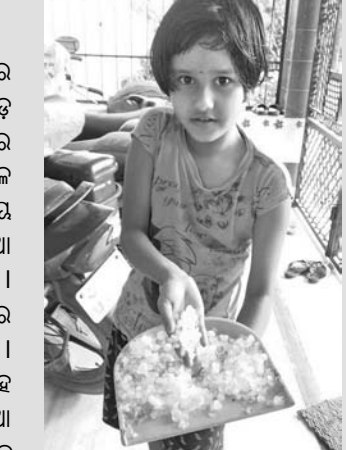
ପୁରୀ ଗୋପ ଅଞ୍ଚଳରେ ପଡ଼ିଥିବା କୁଆପଥର।

ଶନିବାର ମଧ୍ୟାହ୍ନରେ ଭୁବନେଶ୍ୱରରେ ପ୍ରବଳ ବର୍ଷା ସହ କୁଆପଥର ମାଡ଼ ହୋଇଥିଲା। ଏଥିରେ କେତେକ ଘରରେ ବଜ୍ରପାତ ମଧ୍ୟ ହୋଇଥିଲା।