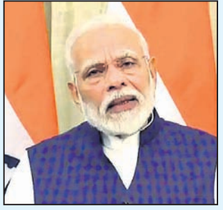
ଘରେ ରହିବା ଲାଗି ଉପରାଷ୍ଟ୍ରପତି ଏମ୍. ଭେଙ୍କାୟା ନାଭୁକୁ ଜନସାଧାରଣଙ୍କୁ ନିବେଦନ କରିଛନ୍ତି। ଆକ୍ରାନ୍ତକ ଶରୀରରୁ ଏହି ଭୂତାଣୁ ଅନ୍ୟ ଦେହକୁ

କେପିଏ ଯୋଡ଼ି ଭଳି ଉଦ୍ୟମ ଦ୍ଵାରା କରୋନା ବିରୋଧରେ ଆମେ ଲଢ଼ିପାରିବା ବୋଲି ମୋଦି କହିଛନ୍ତି। କରୋନା ସଂକ୍ରମଣ ବିରୋଧରେ ପ୍ରଧାନମନ୍ତ୍ରୀଙ୍କ ଜନତା କର୍ମ୍ମ ଡାକରାକୁ ବିଭିନ୍ନ ମହଲକୁ ସ୍ଵୀକାର କରାଯାଇଛି।