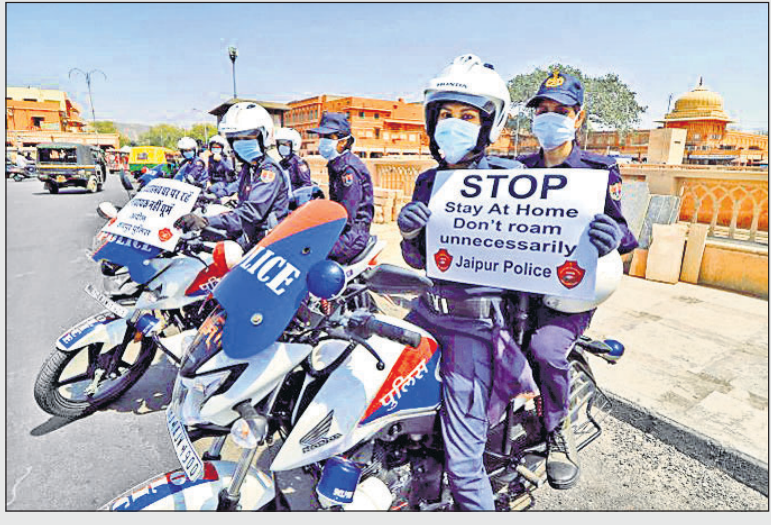
କରୋନା ଭୁଟାଣୁର ଭୟାବରତା ସମ୍ପର୍କରେ ଜୟପୁରରେ ପୋଲିସ୍ ସଚେତନତା ସୃଷ୍ଟି କରୁଛି।