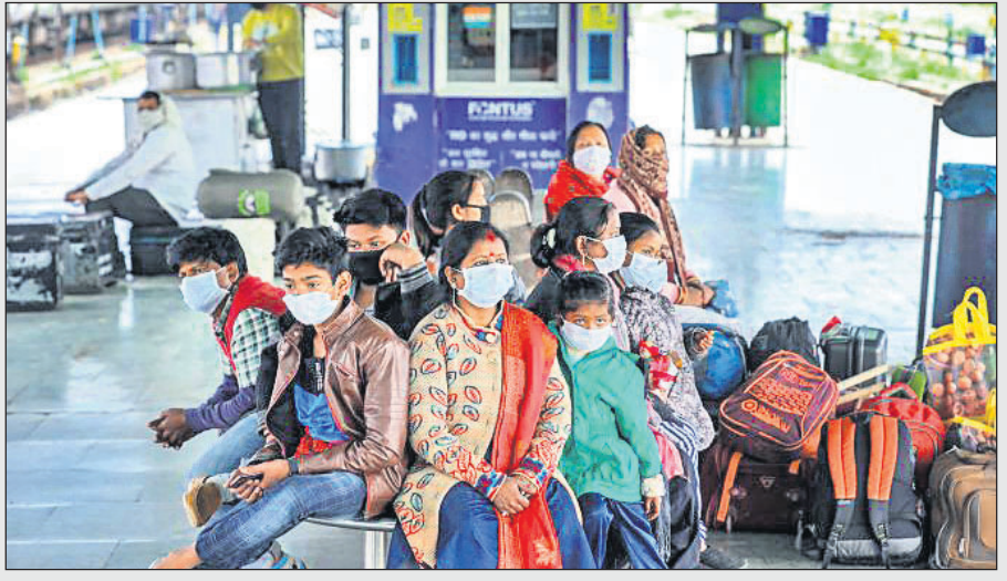
ଟ୍ରେନ୍ ବାତିଲ ଯୋଗୁ ଜଣ୍ଡର ଏକ ରେଳଷ୍ଟେଶନରେ ପ୍ରତୀକ୍ଷାରତ ଯାତ୍ରୀମାନେ ମାତ୍ର ପଛରେ ରହିଛନ୍ତି।