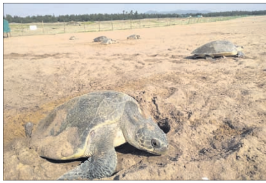
ବେଳାଭୂମିରେ ଅଲିଭ୍‌ରିଡ୍‌ଲେଙ୍କ ଗଣ ଅଣ୍ଡାଦାନ ।

■ କରୋନା ପାଇଁ ■ ଭୋରୁ ନିଷିଦ୍ଧାଞ୍ଚନ ଯୋଗ୍ୟା ଅଣ୍ଡାଦେଲେ ହେଲା ବେଳାଭୂମି ୨୨୪୮ରୁ ଉର୍ଦ୍ଧ୍ୱ କରୁଛି