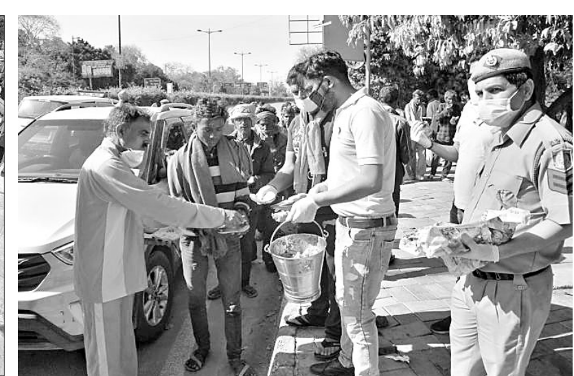
ନୂଆଦିଲ୍ଲୀର କଶ୍ମୀର ଗେଟ୍‌ଠାରେ ପୋଲିସ୍ ଦିନ ମରୁଡ଼ିଆକୁ ଖାଦ୍ୟ ବାଣ୍ଟୁଛି।