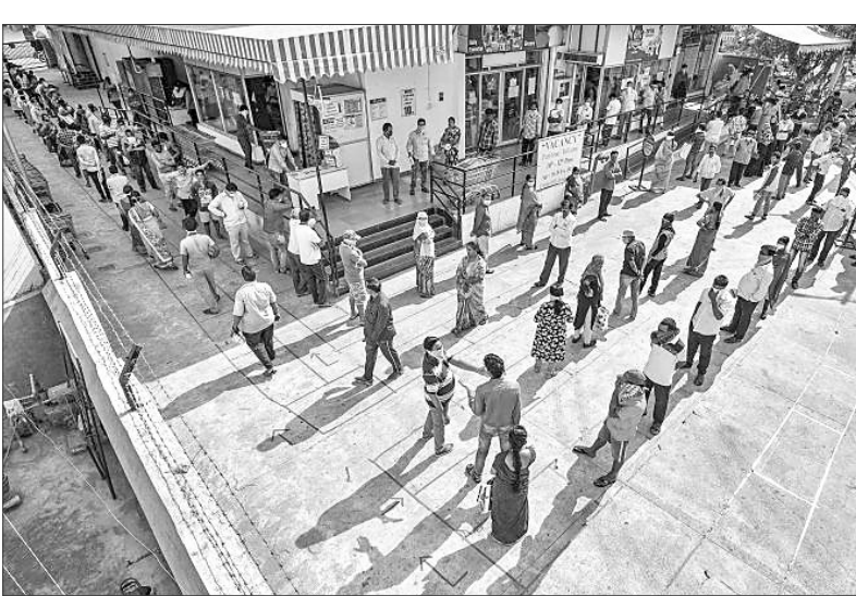
ବିଜୟପୁରଠାରେ ଏକ ସୁପରମାର୍କେଟ ବାହାରେ ଲୋକେ ଜିନିଷ କିଣିବାକୁ ଧାଡ଼ିରେ ଛିଡା ହୋଇଛନ୍ତି।