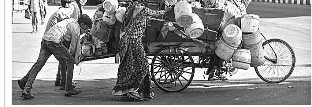
ଲକ୍ଷ୍ମୀନଗର ହୋଇଥିବା ଦାଦନ ଶ୍ରମିକ ସେମାନଙ୍କ ଜିନିଷପତ୍ର ଗ୍ରହଣେ ଲଦି ନୂଆଦିଲ୍ଲୀ ଛାଡ଼ୁଛନ୍ତି।