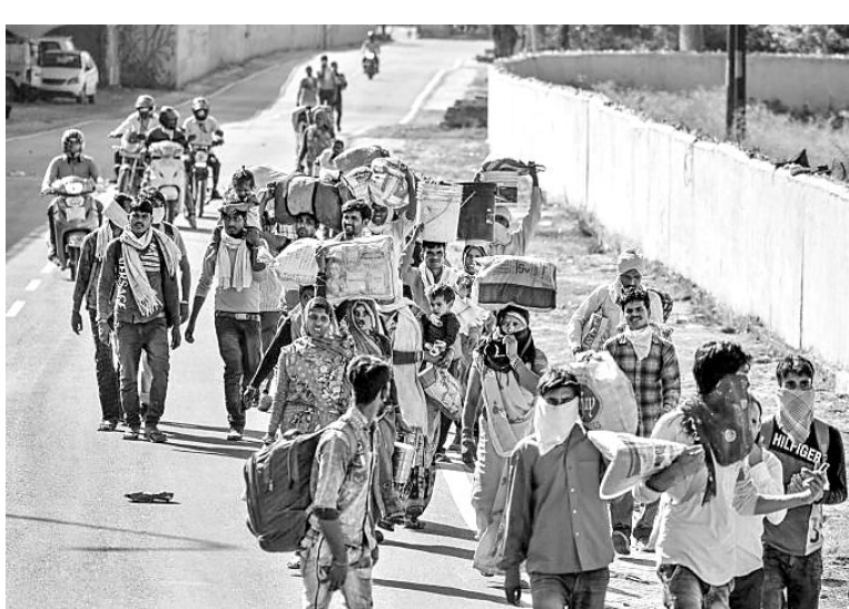
ପ୍ରଧାନମନ୍ତ୍ରୀଙ୍କ ଦାଦନ ଶ୍ରମିକମାନେ ଚାଲିଚାଲି ନିଜ ରାଜ୍ୟକୁ ଫେରୁଛନ୍ତି।