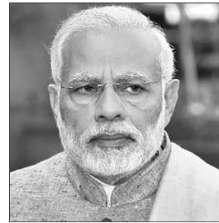
ଦାନ କରିବା ଲାଗି ଜନସାଧାରଣଙ୍କୁ ଅନୁରୋଧ

କରୋନା ସଂକ୍ରମଣ ରୋକିବା ସହ ପରିସ୍ଥିତିର ମୁକାବିଲା ପାଇଁ ପ୍ରଧାନମନ୍ତ୍ରୀ ନରେନ୍ଦ୍ର ମୋଦି ଏକ ଜରୁରୀକାଳୀନ ସହାୟତା ପାଣ୍ଠି ଗଠନ ଲାଗି ଶନିବାର ଘୋଷଣା କରିଛନ୍ତି। ସୁସ୍ଥ ଭାରତ ଗଠନରେ ପ୍ରଧାନମନ୍ତ୍ରୀଙ୍କ ନାଗରିକ ସହାୟତା ଓ ଜରୁରୀ ସ୍ଥିତିରେ ରିଲିଫ୍ ପାଣ୍ଠି (ପିଏମ୍-କେୟାଏ ଫଣ୍ଡ) ସହାୟକ ହେବ ବୋଲି ସେ ଘୋଷଣା କରିଛନ୍ତି। କୋଭିଡ୍-୧୯ ବିରୋଧରେ ଭାରତର ଲକ୍ଷ୍ମଣ ଲାଗି ଦାନ କରିବାକୁ ଚାହୁଁଥିବା ଯେକୌଣସି ବ୍ୟକ୍ତି ଏ ସମ୍ପର୍କରେ ଜଣାଇପାରିବେ। ଏହି ପାଣ୍ଠିକୁ ମଧ୍ୟ ଅନ୍ୟ ବିପର୍ଯ୍ୟୟ ସମୟରେ ଉପଯୋଗ କରାଯାଇପାରିବ ବୋଲି ପ୍ରଧାନମନ୍ତ୍ରୀ କହିଛନ୍ତି। ପ୍ରଧାନମନ୍ତ୍ରୀ ଏହି ନୂଆ ଦାନବ୍ୟ ଗ୍ରନ୍ଥର ଅଧ୍ୟକ୍ଷ ରହିବାକୁ ଥିବାବେଳେ ପ୍ରତିରକ୍ଷାମନ୍ତ୍ରୀ ରାଜନାଥ ସିଂ, ସ୍ୱରାଷ୍ଟ୍ର ମନ୍ତ୍ରୀ ଅମିତ ଶାହା ଏବଂ ଅର୍ଥମନ୍ତ୍ରୀ ନିର୍ମଳା ସୀତାରାମନ୍ ଏହାର ସଦସ୍ୟ ରହିବେ ବୋଲି ଜଣାପଡ଼ିଛି। ଏହି