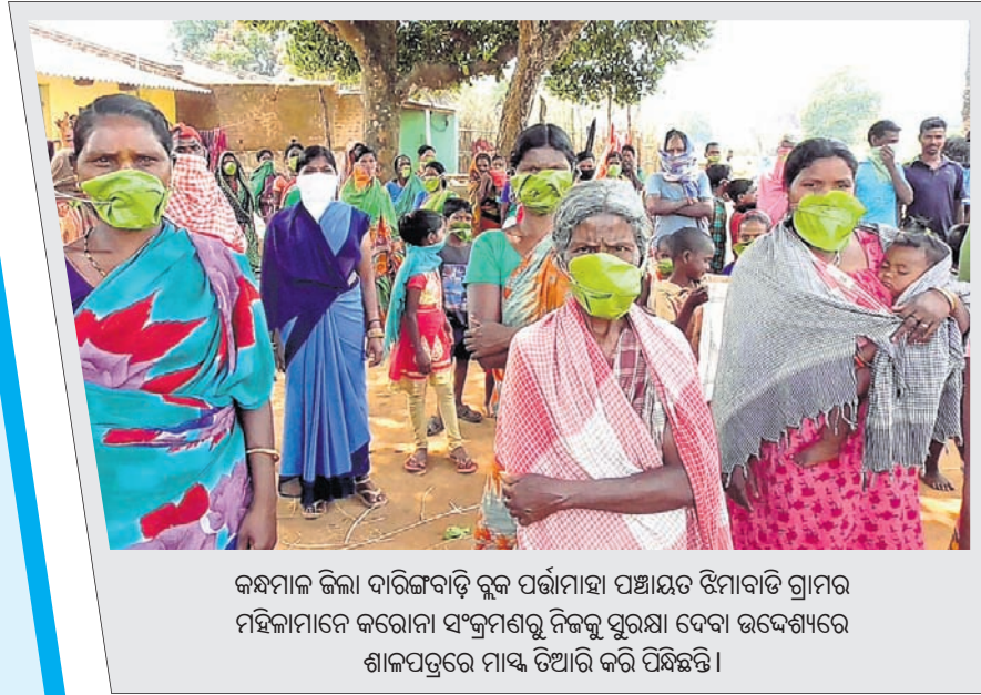
କର୍ମଚାରୀ ଜିଲ୍ଲା ଦାରିଦ୍ର୍ୟବାଦୀଙ୍କୁ ବୁକ ପର୍ଯ୍ୟାୟ ପଞ୍ଚାୟତ ଉପାଦାନ ଗ୍ରାମର ମହିଳାମାନେ କରୋନା ସଂକ୍ରମଣରୁ ନିଜକୁ ସୁରକ୍ଷା ଦେବା ଉଦ୍ଦେଶ୍ୟରେ ଶାଳପତ୍ରରେ ମାସ୍କ ତିଆରି କରି ପିନ୍ଧିଛନ୍ତି।

ମହାରାଷ୍ଟ୍ରରେ ଚାପମାତ୍ରା ଅଧିକ ଥିବାରୁ ଅଳ୍ପ କିଛି ସମୟ ପରେ ଏହା ଖରାପ ହୋଇପାରେ। ଆମେ ଏବେ ଅନ୍ୟ ଉପାୟ ନ ପାଇଁ ଲିଟର ୩୨ ଟଙ୍କାରୁ ୨୦ ଟଙ୍କାକୁ ଖସାଇ ଦେଇଛୁ।