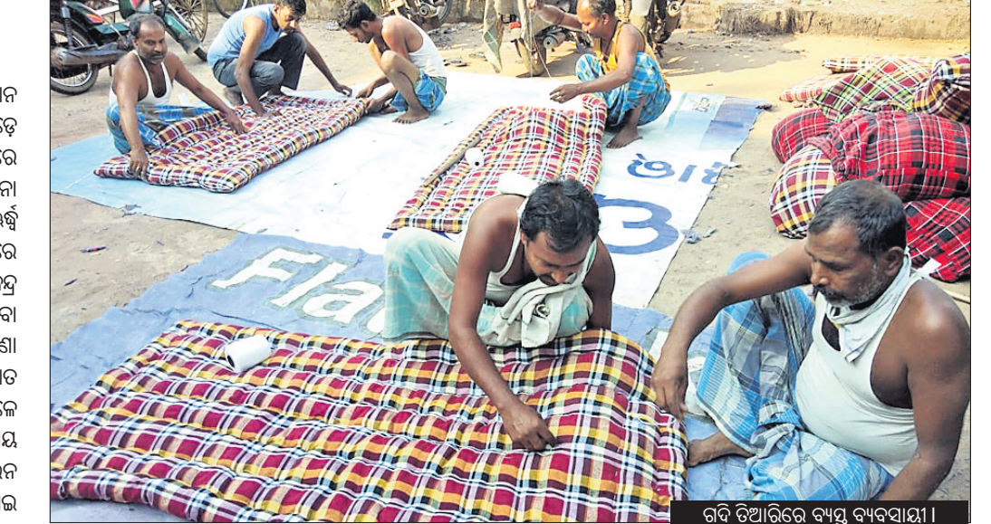
ରାତି ତିଆରିରେ ବ୍ୟସ୍ତ ବ୍ୟବସାୟୀ।

କରୋନା ପାଇଁ ସମଗ୍ର ବିଶ୍ୱ ବର୍ତ୍ତମାନ ଆତଙ୍କିତ ଅବସ୍ଥାରେ। ଏହା ଚାରିଆଡ଼େ ଚାହାର କାୟା ବିସ୍ତାର କରିବାରେ ଲାଗିଛି।