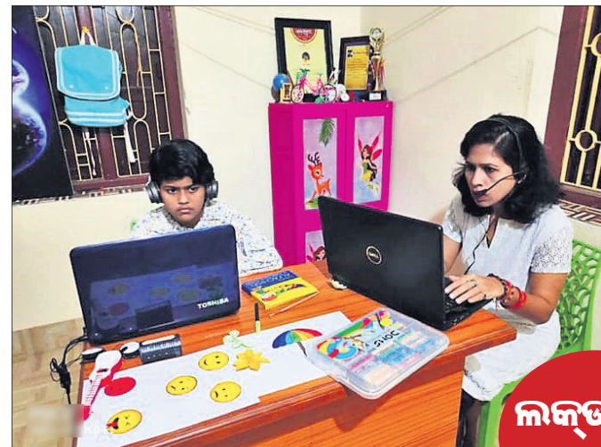
ଅନ୍ଧାରରେ ଦୀପା ଶିକ୍ଷା ଦିଆଯାଇଛି।

ମହାମାରୀ କରୋନାକୁ ଦୂଷ୍ଟରେ ରଖି ଲକ୍ଷ୍ମୀବର ଯୋଗ୍ୟ ହେବା ପରେ ଛାତ୍ରାଛାତ୍ରୀଙ୍କ ପାଠ ପଢ଼ା ଆପାତତଃ ୦୯ ହୋଇଯାଇଛି। ଲକ୍ଷ୍ମୀବର ବେଳେ ଘରେ ବସି ଦିନ ବିତାଉଥିବା ଛାତ୍ରାଛାତ୍ରୀଙ୍କୁ ଶିକ୍ଷାରେ ମନେନିବେଶ ପାଇଁ କଳାସଂସ୍କୃତି ଅନୁଷ୍ଠାନ 'ନାବ' ପକ୍ଷରୁ ଅନ୍ଧାରରେ ୨୧ ଦିନିଆ ଲକ୍ଷ୍ମୀବର କ୍ୟାମ୍ପ ଆରମ୍ଭ ହୋଇଛି।