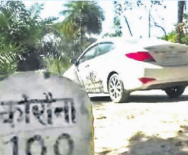
କରୋନା ଗାଁ ନାମ କରୋନା ଏଠି କୌଣସି କରୋନା ସଂକ୍ରମଣ ବ୍ୟକ୍ତି ନାହିଁ। ଏନେଇ ଏକ ଘୁମୁକ୍ତ ଏକେଡ଼ି ଗାଁର ଶୁଣ୍ଠାନ୍ତ ପଟେ ଛାଡିବା ପରେ ଯୁକ୍ତସମାଜ ପୂର୍ଣ୍ଣାୟା ଯୋଗାଣ ଆଦିତ୍ୟନାଥଙ୍କୁ କହି ନାମ ବଦଳାଇବାକୁ ପ୍ରସ୍ତାବ ଦେଇଛନ୍ତି।

ଭରତପୁର, ୩୦ ମାର୍ଚ୍ଚ: ସାରା ଦୁନିଆଁରେ ଏବେ କରୋନାକୁ ନେଇ ଭୟର ବାତାବରଣ ସୃଷ୍ଟି ହୋଇଛି। ବିଶ୍ୱରେ ୩୫ ହଜାରରୁ ଅଧିକ ମୃତ୍ୟୁ ହୋଇଛି। ଏପରିସ୍ଥିତିରେ ଭରତ ପୁରରେ ଥିବା କରୋନା ଗାଁ ଏବେ ଚର୍ଚ୍ଚାର କେନ୍ଦ୍ରବିନ୍ଦୁ ପାଲଟିଛି।