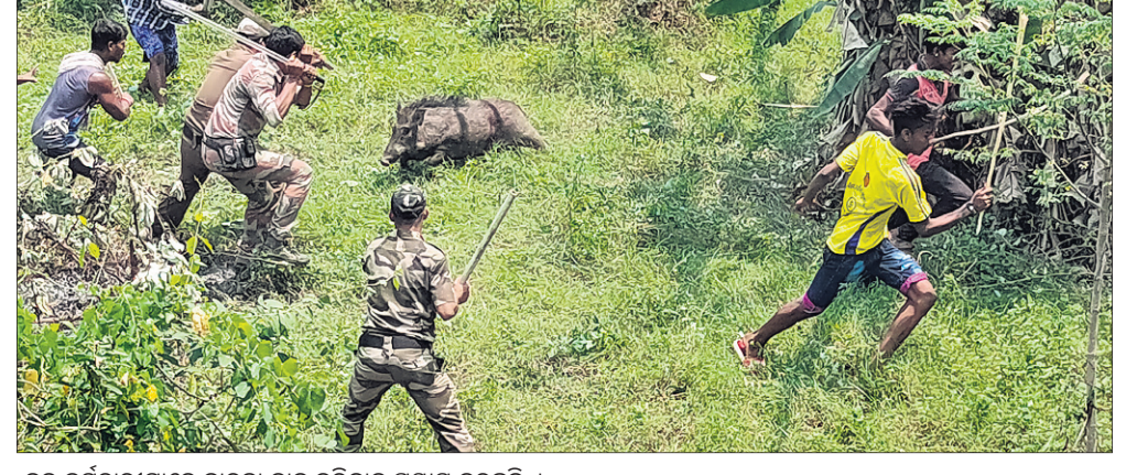
ବନ କର୍ମଚାରୀମାନେ ବାର୍ଦ୍ଧା କାରୁ କରିବାକୁ ପ୍ରୟାସ କରୁଛନ୍ତି ।

କରୋନା ଭୁତାଣୁ ସାରା ବିଶ୍ୱବାସୀଙ୍କୁ ଆତଙ୍କିତ କରିଥିବା ବେଳେ ସେମାନଙ୍କୁ ବ୍ରହ୍ମପୁର ହରିଡ଼ାଖଣ୍ଡରେ ଏକ ବାର୍ଦ୍ଧା ଉପବ୍ରତ କରିଥିଲା।