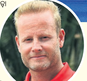
କୋଚ୍ ମାରିକ୍ ଡେନ

ମହମ୍ମଦ ମୁସ୍ତାକ ପ୍ରକାଶ କରିଛନ୍ତି। ଭାରତୀୟ ପୁରୁଷ ହକି ଦଳର କୋଚ୍ ଗ୍ରାହମ ରିଡ୍ଙ୍କ ମତରେ ଟେନିସ୍ ଅଲିମ୍ପିକ୍ ପାଇଁ ନୂଆ ତାରିଖ ଧାର୍ଯ୍ୟ ହୋଇଥିବାରୁ ଆମେ ଆସନ୍ତା ବର୍ଷ ଜୁଲାଇକୁ ଦୃଷ୍ଟିରେ ରଖି ଯୋଜନା ପ୍ରସ୍ତୁତ କରିବା।