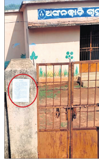
ଅଙ୍ଗନୱାଡ଼ି ପାଠଶାଳାରେ ଲାଗିଥିବା ପୋଷ୍ଟର ।

ମାଓବାଦୀମାନେ ବିଭିନ୍ନ ରାଜ୍ୟରୁ ଆସୁଥିବା ସେମାନେ କରୋନା ସଂକ୍ରମଣ ହେବାର ସମ୍ଭାବନା ରହିଛି।