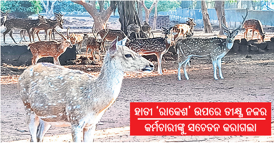
ହାତୀ 'ରାକେଶ' ଉପରେ ତୀକ୍ଷ୍ଣ ନଜର କର୍ମଚାରୀଙ୍କୁ ସତର୍କତା କରାଗଲା