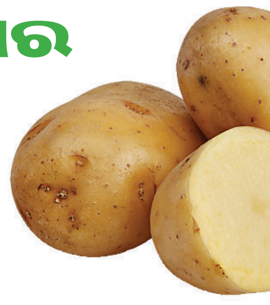
ଚାହୁଁଥିଲେ ୩-୪ଟି ଆଳୁକୁ ବାଟି ତା'ର ରସ ବାହାର କରି ମୁଣ୍ଡରେ ଲଗାନ୍ତୁ। ୨୦ ମିନିଟ ପରେ ମୁଣ୍ଡ ଧୋଇ ଦିଅନ୍ତୁ।

ତାହେଲେ ଅଣ୍ଡାର ଧଳା ଅଂଶକୁ ମୁହଁରେ ଲଗାଇ ଶୁଖିବା ପାଇଁ ଛାଡ଼ି ଦିଅନ୍ତୁ। ଏହାପରେ ବରଫ କିମ୍ବା ଥଣ୍ଡା ପାଣିରେ ମୁହଁ ଧୋଇ ଦିଅନ୍ତୁ। - ଏକ ଗାମଚ ଅଳ୍ପ ଗୁଣ୍ଡକୁ ଶିକାକାଳ ଓ ରାଠା ପାଉଁର ସହିତ ଅଣ୍ଡାକୁ ମିଶାଇ ହେୟାର ପ୍ୟାକ୍ ଭଳି ଲଗାନ୍ତୁ। ଅଧରାତ୍ନ ପରେ ଧୋଇ ଦିଅନ୍ତୁ। ଅଳ୍ପ -ବଟା ହୋଇଥିବା ଏକ ବଡ଼ ଆଳୁରେ ଦୁଇ ଗାମଚ କ୍ଷୀର, ୩-୪ ଚୁଆ ଗୁଣ୍ଡବିନ୍ଦୁ ମିଶାଇ ମୁହଁରେ ଲଗାନ୍ତୁ। ଶୁଖିଗଲାପରେ ଏହାକୁ ଧୋଇ ଦିଅନ୍ତୁ। ଏପରି କରିବା ଦ୍ୱାରା ହୃଦର ଉଜ୍ଜ୍ୱଳତା ବୃଦ୍ଧି ପାଇବ। - କେଶକୁ ମଜଭୁତ କରିବାକୁ