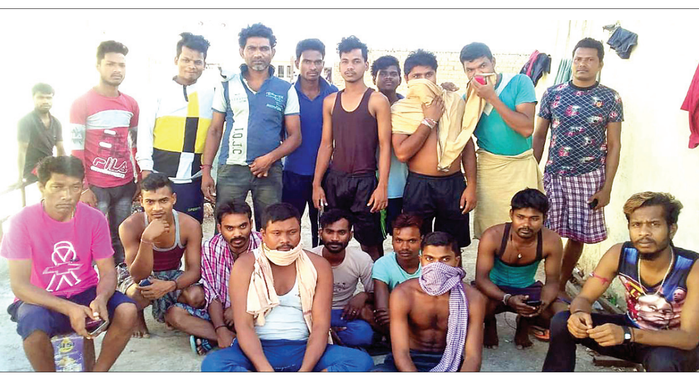
ଗୁଜରାଟରେ ଫସି ରହିଥିବା ବରଗଡ଼ର ଶ୍ରମିକମାନେ ।

ରାଜ୍ୟ ବାହାରକୁ କର୍ମ ଅନ୍ତେଷଣରେ ଯାଇ କିଛି ରୋଜଗାର ଆଶା ରଖିଥିଲେ । ମାତ୍ର ଲକ୍ଷ୍ମୀନାଥ ଚନ୍ଦ୍ରଶିଖର କଟକଣା ଲାଗୁ ହେବାକୁ ଗୁଜରାଟର ଜାମନଗର ଦାରେଦ୍ ଅଞ୍ଚଳରେ ବରଗଡ଼ ଜିଲାର ଶ୍ରମିକମାନେ ଫସି ରହି ପୁରୁସ୍କାର ଜାବନ ଅତିବାହିତ କରୁଥିବା ସୂଚନା ମିଳିଛି । ସେମାନଙ୍କ ପାଖକୁ ସେଠାକାର ପ୍ରଶାସନ ପକ୍ଷରୁ କିଛି ସହାୟତା ପହଞ୍ଚି ନ ଥିବା ଯୋଗୁଁ ସେମାନେ ଭୋକ, ଉପାସରେ ଦିନ କାଟୁଛନ୍ତି । ସୂଚନା ଅନୁଯାୟୀ, ବରଗଡ଼ ଜିଲାର ବରିକେଳ ଅଞ୍ଚଳର ୨୮ଜଣ ଶ୍ରମିକ କିଛିମାସ ଆଗରୁ ଗୁଜରାଟକୁ