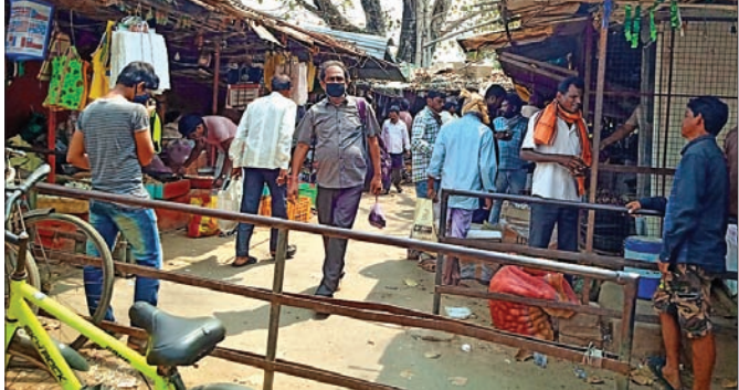
ବଳାଙ୍ଗୀର ଡେଲିମାର୍କେଟରେ ଲୋକଙ୍କ ଭିଡ଼ ।

ବଳାଙ୍ଗୀର ସହରର ଡେଲିମାର୍କେଟ, କୋଶଳ କଳାମଣ୍ଡଳ ପଡିଆକୁ ହୋଇଥିବା ଡେଲିମାର୍କେଟ, ବିଭିନ୍ନ କିରାନୀ ଦୋକାନରେ ଅଧିକ ଭିଡ଼ ପରିଲକ୍ଷିତ ହେଉଛି । ଏଠାରେ ସାମାଜିକ ଦୂରତ୍ୱ ପାଳନ କରାଯାଉନାହିଁ । ଡେଲିମାର୍କେଟ ପଛପଟ କିରାନୀ ଦୋକାନ, ସମ୍ପୂର୍ଣ୍ଣ ମିଠା ଦୋକାନ, ଖାଉଟି ସମୟରେ କେନ୍ଦ୍ର, କଳାମଣ୍ଡଳ ପରିବା ମାର୍କେଟରେ ସମାନ ଅବସ୍ଥା ଦିନକୁ ଦିନ ବୃଦ୍ଧି ପାଇଁ ଡେଲିମାର୍କେଟ, କିରାନୀ ଦୋକାନ, ଓପେଟେଟ ଦୋକାନ ଖୋଲିବାକୁ ନିୟମ କରାଯାଇଛି । ତେବେ ଏହି ସମୟରେ କେତେକ ଲୋକ ପ୍ରତ୍ୟହ ଘରୁ ବାହାରି ବଜାର କରିବା ବାହାମା କରୁଛନ୍ତି । ଏହାକୁ ନେଇ ଉଦ୍‌ବେଗ ପ୍ରକାଶ ପାଇଛି ।