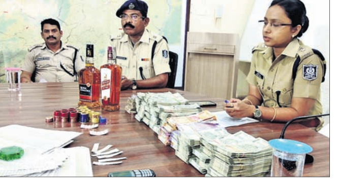
ଖବରଦାତା ସମ୍ମିଳନୀରେ ବରଗଡ଼ ସର୍ବି ସୂଚନା ଦେଉଛନ୍ତି ।