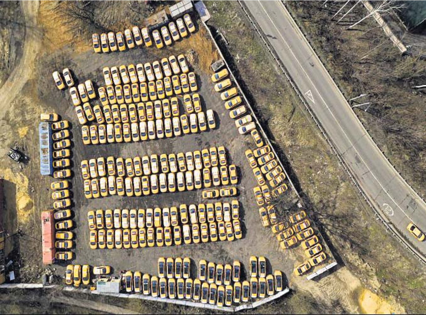
ଭୂଆଁସିଆ ରାଜଧାନୀ ମସ୍ୟାଦାନୀ ଏକ ପାର୍କିଂ ଯୋଗ୍ୟରେ ଲକ୍ଷତାଳୟ ହେବୁ ଖ୍ୟାତିଗୁଡ଼ିକ ଅଟକି ରହିଛି।

ଜାପାନର ଅଧିକାରୀଙ୍କୁ ଏହାପରେ କରୋନା ଭୂତାଣୁ ସଂକ୍ରମଣ ବଢ଼ିବାକୁ ସୂଚନା ଦେବାକୁ କରୁଛି। ସ୍ଥିତି ଯୋଗ୍ୟ କରିବାକୁ ପ୍ରଧାନମନ୍ତ୍ରୀ ସିଂହେ ଆବେ ପ୍ରସ୍ତାବ ଦେଇଛନ୍ତି। କରୋନା ଯୋଗୁଁ କ୍ଷତିଗ୍ରସ୍ତ ହୋଇଥିବା ବିଶ୍ୱର ତୃତୀୟ ବୃହତ୍ ଅର୍ଥବ୍ୟବସ୍ଥାକୁ ସୁଧାରିବା ଲାଗି ୧ ଟ୍ରିଲିୟନ ଡଲାରର ପ୍ରୋତ୍ସାହନ ପଦକ୍ଷେପ ଗ୍ରହଣ କରିବା ପାଇଁ ପ୍ରସ୍ତାବ ଦେଇଛନ୍ତି।