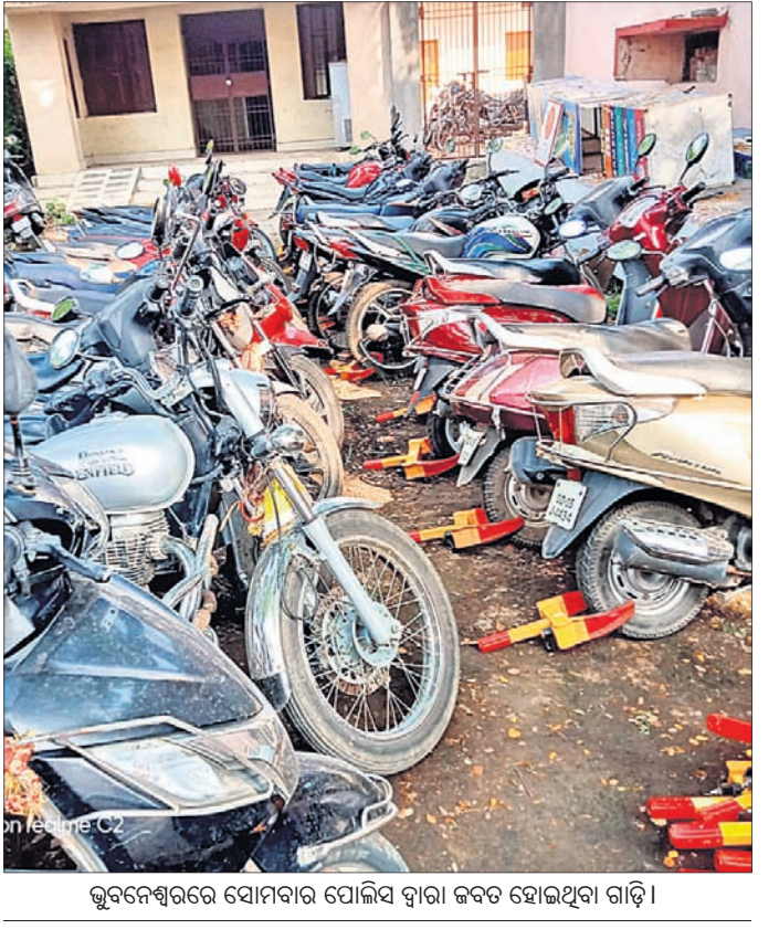
ଭୁବନେଶ୍ୱରରେ ସୋମବାର ପୋଲିସ ଦ୍ୱାରା ଜବତ ହୋଇଥିବା ଗାଡ଼ି ।

ପ୍ରବର୍ତ୍ତାନ୍ତୁ । ରୂପ କାର୍ଯ୍ୟକର୍ତ୍ତାମାନେ ୪୦ଜଣ ପରିବାରକୁ ସମ୍ପର୍କ କରି ୫ଟି ଧନ୍ୟବାଦ ପତ୍ରର ହସ୍ତାକ୍ଷର ସଂଗ୍ରହ କରି ଏହାକୁ ପୋଲିସ, ସେପ୍ଟେ, ଡାକ୍ତର, ନର୍ସ, ବ୍ୟାଙ୍କ ଏବଂ ପୋଷ୍ଟାଲ ଏବଂ ସରକାରୀ କର୍ମଚାରୀଙ୍କୁ ପ୍ରଦାନ କରି ଧନ୍ୟବାଦ ଜଣାଇବେ । ଦଳର ବରିଷ୍ଠ ନେତାମାନଙ୍କ ସହଯୋଗରେ ଜାଣିବା ପାଇଁ ନିଜ ଘରେ ଥିବା ପୁସ୍ତକକୁ ଅଧ୍ୟୟନ କରିବାକୁ ମହାନ୍ତି ନିବେଦନ କରିଛନ୍ତି । କ୍ୱାରାଣ୍ଟାଇନରେ ରହୁଥିବା ଲୋକଙ୍କୁ ଫୋନକରି ସେମାନଙ୍କ ମନୋବଳକୁ ବୃଦ୍ଧି କରିବେ ।