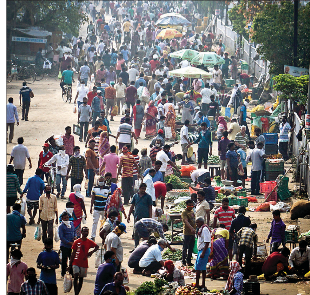
କଟକ ଛତ୍ରବଜାର ପରିବା ହାତରେ ସୋମବାର ଲୋକଙ୍କ ଗହଳି ।

ସାମାଜିକ ଦୂରତା ପାଳନ କରିବାକୁ ଜିଲ୍ଲାପାଳ ଚନ୍ଦ୍ରୀୟା ଆହ୍ୱାନ ଦେଇଛନ୍ତି । ଶୁକ୍ରବାର ରାତି ୮ଟାରୁ ରବିବାର ରାତି ୮ଟା, ୪୮ ଘଣ୍ଟା ପାଇଁ କଟକ, ଭୁବନେଶ୍ୱର ଓ ଭଦ୍ରକ ସହରରେ ଶରତାଭଙ୍ଗ ଜାରି କରାଯାଇଥିଲା । ହେଲେ ରବିବାର ରାତିରେ ପରିବା କିମ୍ବା ଅତ୍ୟାବଶ୍ୟକ ସାମଗ୍ରୀ କିଣିବା ଉପରେ ପୋଲିସ୍ କମିଶନର ସ୍ୱତନ୍ତ୍ରୀ କଟକଣା ଜାରି କରିଥିଲେ । ସୋମବାର ସକାଳ ପ୍ରାୟ ୭ଟା ବେଳେ ଛତ୍ରବଜାର(ବାବାମ୍ବାଡ଼ିଠାରୁ ଲିକରୋଡ଼) ଖୋଲିଥିଲା । ହେଲେ ଚିତ୍ର ସମ୍ପୂର୍ଣ୍ଣ ଭିକ୍ଷୁ ଥିଲା । ରାସ୍ତାର ଉଭୟ ପାର୍ଶ୍ୱରେ ନାହିଁ ନ ଥିବା ଭିଡ଼ ବିନୋଦ ବିହାରୀ ପରିବା ବଜାର କେତେକ ଅଂଶକୁ ନୟାସଡ଼କ ପାଖକୁ ଉଠାଯିବ । ସିଡିଏ-ବିହାରୀସାହିତ କୃଷକ ବଜାରର କିଛି ଅଂଶକୁ ସିଡିଏ ଭିତରକୁ ନିଆଯିବ ବୋଲି ସେ ପ୍ରକାଶ କରିଛନ୍ତି । ଅତ୍ୟାବଶ୍ୟକ ସାମଗ୍ରୀ କିଣିବା ବେଳେ