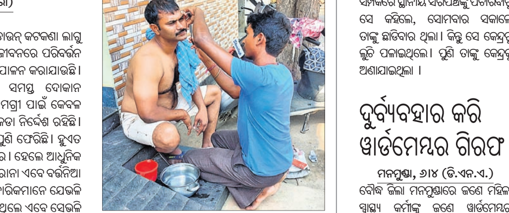
ସମ୍ବଲପୁର ମହାନଗର ନିଗମ ଅଞ୍ଚଳରେ ବାରିକ ଜଣେ ବ୍ୟକ୍ତିଙ୍କୁ ଖୁଆଇ କରୁଛନ୍ତି ।