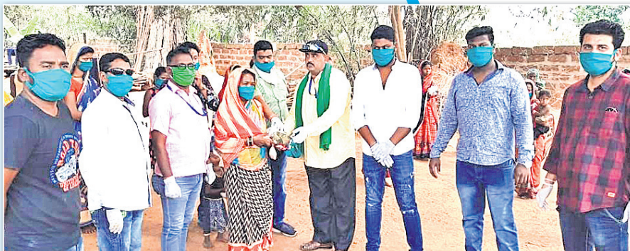
ବିଜେଡି ପକ୍ଷରୁ ରକ୍ଷାଖାଦ୍ୟ ବଣ୍ଟନ କରାଯାଇଛି।