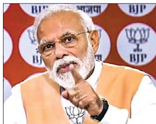
ଭାରତୀୟ ପ୍ରତିଷ୍ଠା ଦିବସରେ ମୋଦିଙ୍କ ଆହ୍ୱାନ

ନୂଆଦିଲ୍ଲୀ, ୬୪(ପି.ଟି.): କରୋନା ଭୂତାଣୁ ମହାମାରୀ ବିରୋଧରେ ଆମକୁ ଏକ ଦୀର୍ଘଯୁଦ୍ଧ ଲଢ଼ିବାକୁ ପଡ଼ିବ। ଏଥିପାଇଁ ନିରନ୍ତର ମୋଦି ଦେଶବାସୀଙ୍କୁ ଆହ୍ୱାନ ଦେଇଛନ୍ତି। ଭାରତ ଏହି ଲଢ଼େଇରେ ନିଶ୍ଚୟ ଜିତିବ ବୋଲି ସେ ଦୃଢ଼ତା ପ୍ରକାଶ କରିଛନ୍ତି। ଲକ୍ଷତାଳୟ ବେଳେ ଦେଶବାସୀ ଯେଉଁକି ଗମ୍ଭୀରତା ଓ ପରିପକ୍ୱତା ପ୍ରଦର୍ଶନ କରିଛନ୍ତି ତାହା ଅତୁଟପୂର୍ବ। ଭାରତ ଭଳି ବିଶାଳ ଦେଶରେ ଏଭଳି ଶୃଙ୍ଖଳା ଓ ସେବା ମନୋଭାବ ପ୍ରଦର୍ଶନ କଳ୍ପନାତୀତ। ରବିବାର ରାତିରେ ୧୩୦ କୋଟି ଦେଶବାସୀ ଦୀର୍ଘ କାଳି ରାଷ୍ଟ୍ରର ସାମୂହିକ ଶକ୍ତିକୁ ପ୍ରଦର୍ଶନ କରିଛନ୍ତି ବୋଲି ପ୍ରଧାନମନ୍ତ୍ରୀ କହିଛନ୍ତି। ଦେଶବାସୀଙ୍କର ଏହି ସାମୂହିକ ଶକ୍ତି ଆମକୁ କରୋନା ଭୂତାଣୁ ବିରୋଧରେ ଲଢ଼େଇକୁ ଆହୁରି ମଜବୁତ କରିଛି। ଭାରତୀୟ ୪୦ତମ ପ୍ରତିଷ୍ଠା ଦିବସ ଅବସରରେ ଦଳୀୟ କର୍ମୀମାନଙ୍କୁ ଉଦ୍‌ବୋଧନ ଦେଇ ପ୍ରଧାନମନ୍ତ୍ରୀ କୋଭିଡ୍-୧୯ ବିରୋଧରେ ସରକାର ନେଇଥିବା ପଦକ୍ଷେପ ଓ ବିରୋଧୀ ଦଳଗୁଡ଼ିକର ସମାଲୋଚନାର ଉତ୍ତର ରଖିଥିଲେ। ଭାରତର ଉତ୍ତମ ବିଶ୍ୱ ସମୃଦ୍ଧରେ ଦୃଷ୍ଟାନ୍ତ ସୃଷ୍ଟି କରିବା ସହ ଗ୍ରହଣ କରିଥିବା ମୋଦି କହିଛନ୍ତି।