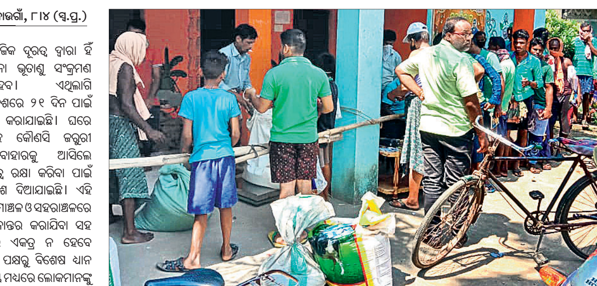
ରାଶନ ସାମଗ୍ରୀ ନେବାବେଳେ ଲୋକେ ସାମାଜିକ ଦୂରତା ପାଳନ କରୁନାହାନ୍ତି।

ସାମାଜିକ ଦୂରତା ବାହା ହିଁ କରୋନା ଭୂତାଣୁ ସଂକ୍ରମଣ ରୋକିହେବ। ଏଥିଲାଗି ସାରା ଦେଶରେ ୨୧ ଦିନ ପାଇଁ ଲକ୍ଷ୍ମୀଭୂମି କରାଯାଇଛି। ଘରେ ରହିବା ସହ କୌଣସି କରୁଣା କାର୍ଯ୍ୟରେ ବାହାରକୁ ଆସିଲେ ସାମାଜିକ ଦୂରତା ରକ୍ଷା କରିବା ପାଇଁ ସରକାରୀ ନିର୍ଦ୍ଦେଶ ଦିଆଯାଇଛି। ଏହି ପରିପ୍ରେକ୍ଷାରେ ଗ୍ରାମାଞ୍ଚଳ ଓ ସହରାଞ୍ଚଳରେ ବସୁଥିବା ହାଟ ସ୍ଥାନାନ୍ତର କରାଯିବ। ସହ ଲୋକମାନେ କିପରି ଏକତ୍ର ନ ହେବେ ସେ ନେଇ ପ୍ରଶାସନ ପକ୍ଷରୁ ବିଶେଷ ଧ୍ୟାନ ଦିଆଯାଇଛି। ଏହି ସମୟ ମଧ୍ୟରେ ଲୋକମାନଙ୍କୁ ରାଶନ ସାମଗ୍ରୀ ଯୋଗାଇ ଦିଆଯିବା ସହ ଲୋକମାନେ ଯେପରି ସାମାଜିକ ଦୂରତା ରକ୍ଷା କରିବେ, ସେ ଦିଗରେ ମଧ୍ୟ ଧ୍ୟାନ ଦେବାକୁ ନିର୍ଦ୍ଦେଶ ଦିଆଯାଇଛି। ହେଲେ ନାଉରୀ ବ୍ଲକ୍ ଅଞ୍ଚଳରେ ଏହାର ବ୍ୟତିକ୍ରମ ଦେଖିବାକୁ ମିଳିଛି। ହାଟରଗଣି କେତେକ ଡିଲରଙ୍କୁ ଛାଡ଼ିଦେଲେ, ଅଧିକାଂଶ ଡିଲର ପଏଣ୍ଟରେ ଲୋକମାନେ ସାମାଜିକ ଦୂରତା ରୁହୁଡ଼ ଦେଖାହାନ୍ତି। ଏ ନେଇ ସ୍ଥାନୀୟ ଅଞ୍ଚଳରେ ଅସନ୍ତୋଷ ଦେଖାଦେଇଛି। ରୋହିଆ ପଞ୍ଚାୟତରେ