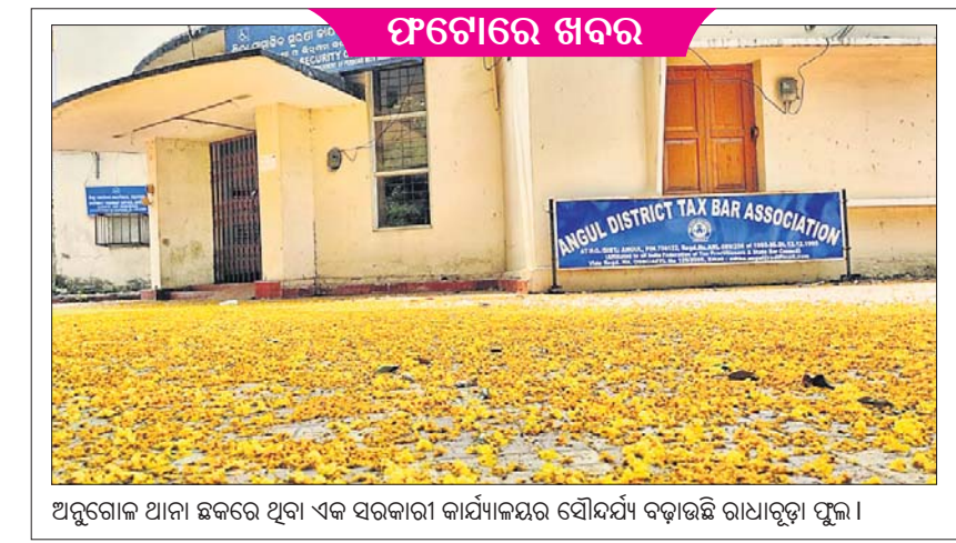
ଅନୁଗୋଳ ଥାନା ଛକରେ ଥିବା ଏକ ସରକାରୀ କାର୍ଯ୍ୟାଳୟର ସୌନ୍ଦର୍ଯ୍ୟ ବଢ଼ାଇବା ପାଇଁ ଫୁଲ ଫୋଟାରେ ଖବର।