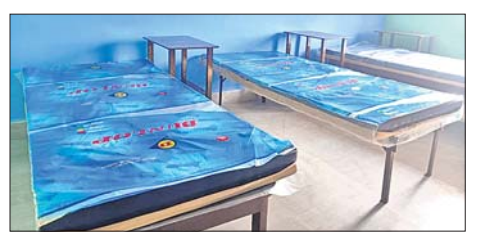
ଅଲ୍ଲାୟ ମେଡିକାଲ କ୍ୟାମ୍ପରେ ପକାଯାଇଥିବା ବେଡ୍।

ରାଜ୍ୟରେ କରୋନା ସଂକ୍ରମଣ ସଂଖ୍ୟା ବହୁଥିବାରୁ ଏହାକୁ ଦୃଷ୍ଟିରେ ରଖି ଅନୁଗୋଳ ଜିଲା ପ୍ରଶାସନ ପକ୍ଷରୁ ବିଭିନ୍ନ ପ୍ରସ୍ତୁତି କାର୍ଯ୍ୟ ହାତକୁ ନିଆଯାଇଛି। ଜିଲାର ୨୦ଟି ବେଡ୍ ଆବଶ୍ୟକ ଥିବାବେଳେ ମୋଟ ୨୨୫୫ଟି ଅଲ୍ଲାୟ ମେଡିକାଲ କ୍ୟାମ୍ପ (ଡିଏମ୍‌ସିଏସ୍) ଖୋଲାଯାଇଛି। ୮ଟି ବ୍ଲକ୍‌ର ପ୍ରତି ପଞ୍ଚାୟତରେ ଏହି ଡିଏମ୍‌ସିଏସ୍ ଥିବାବେଳେ ୯ ହଜାର ୪୦୦ଟି ବେଡ୍ ଆବଶ୍ୟକ ରହିଛି। କିନ୍ତୁ ଅଧ୍ୟାବ୍ୟୁତାହତାର ୪୨୨ ବେଡ୍ ପ୍ରସ୍ତୁତ କରାଯାଇପାରିବ। ସେହିପରି ଖୋଲାଯାଇଥିବା ଡିଏମ୍‌ସିଏସ୍ ରୂପରେ ବିଦ୍ୟୁତ୍, ପାନୀୟ ଜଳ, ଅନ୍ୟାନ୍ୟ ଆବଶ୍ୟକ ବ୍ୟବସ୍ଥା ଉପଲବ୍ଧ ଥିବା ପ୍ରଶାସନ ପକ୍ଷରୁ ସୂଚନା ଦିଆଯାଇଛି। କେବଳ ଅନୁଗୋଳ ବ୍ଲକ୍‌ର ୩୪୨୨ଟି ପଞ୍ଚାୟତରେ ୧ ହଜାର