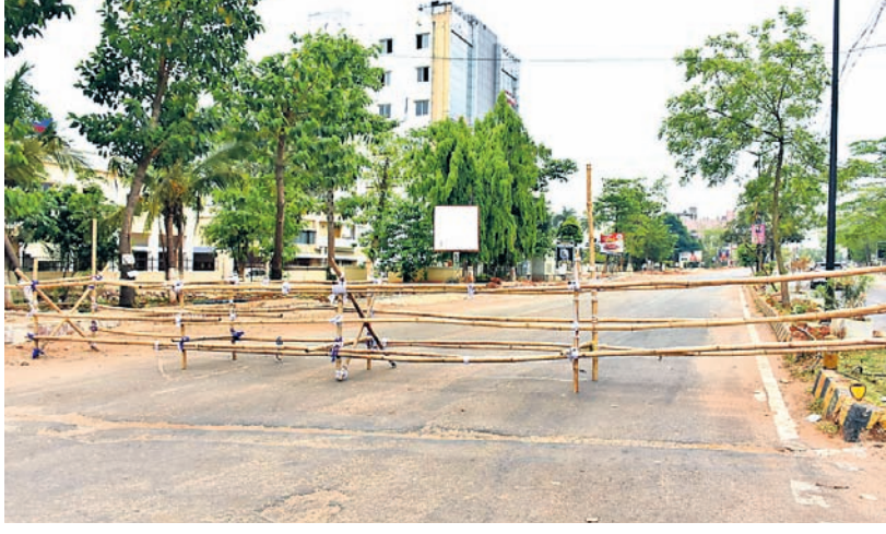
ଭୁବନେଶ୍ୱର ମହାନଗର ନିଗମ (ବିଏମ୍‌ସି) ପକ୍ଷରୁ ସତ୍ୟନଗରକୁ ଆବକ୍ଷ ଅଞ୍ଚଳ ଘୋଷଣା କରାଯିବା ପରେ ବୁଧବାର ବାଉଁଶ ବ୍ୟାରିକେଡ୍ ଦ୍ୱାରା ସିଲ୍ କରାଯାଇଛି।