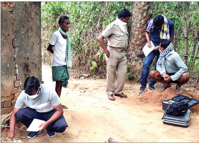
ଅଡ଼ାପଡ଼ା ଗ୍ରାମରେ ହତ୍ୟାକାଣ୍ଡ ଘଟଣାରେ ସାକ୍ଷ୍ୟପୂର୍ଣ୍ଣ ଟିମ୍ ନମୁନା ସଂଗ୍ରହ କରୁଛନ୍ତି