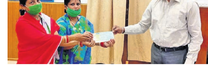
ସିଆଡ଼ି ମଙ୍ଗଳା ଏସ୍ଏସ୍ଡି ତରଫରୁ ଜିଲ୍ଲାପାଳଙ୍କୁ ଟଙ୍କା ପ୍ରଦାନ କରାଯାଇଛି।