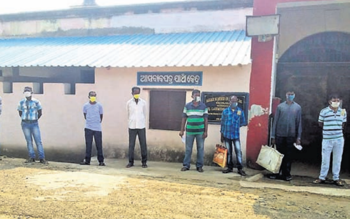
କର୍ମଚାରୀମାନେ ଛୁଟିରେ ଯିବାକୁ ପ୍ରସ୍ତୁତ ହୋଇ ରହିଛନ୍ତି।

କେନ୍ଦୁଝର ଜେଲରେ କର୍ମଚାରୀ ସଂଖ୍ୟା ଅଧିକ ଥିବାରୁ ଏହା କରୋନା ମୁକାବିଲା ଦିନରେ ସମସ୍ୟା ସୃଷ୍ଟି କରିବା ଆଶଙ୍କା କରି ସରକାର ବିଚାରାଧିନ ବନ୍ଦୀଙ୍କୁ ଅନ୍ତରାଳ ଜାମିନ ଓ ପାଲୋଲରେ ଛାଡ଼ିବାକୁ ନିଷ୍ପତ୍ତି ନେଇଥିଲେ। ନିଶା କାରବାର, ବଳାହାର, ଯୌନ ନିର୍ଯାତନା, ଏସିଡ୍ ମାଡ଼ ମାମଲାରେ ଅଭିଯୁକ୍ତ କିମ୍ବା ଦଣ୍ଡିତ ବ୍ୟକ୍ତିଙ୍କୁ ବାଦ ଦେଇ ଅନ୍ୟ କର୍ମଚାରୀଙ୍କୁ ଛାଡ଼ିବାର ନିଷ୍ପତ୍ତି ହୋଇଥିଲା। ସେହି ଅନୁସାରେ ବିଭିନ୍ନ ଅପରାଧରେ କାରାଦଣ୍ଡ ଭୋଗୁଥିବା ୩୨ଜଣ କର୍ମଚାରୀ ୨୧ ଦିନିଆ ସ୍ୱତନ୍ତ୍ର ଛୁଟିରେ (ଫେଲୋ) ଛଟା ଯିବା ପାଇଁ ନିଷ୍ପତ୍ତି ହୋଇଥିଲା। କେନ୍ଦୁଝର ମୁଖ୍ୟ କାରାଗାର କର୍ତ୍ତୃପକ୍ଷ ମଙ୍ଗଳବାର ୩ ଏବଂ ବୁଧବାର ୮ଜଣ କର୍ମଚାରୀ ୨୧ ଦିନିଆ ସ୍ୱତନ୍ତ୍ର ଛୁଟିରେ ଛାଡ଼ିଛନ୍ତି। ଏହି କର୍ମଚାରୀମାନେ ପୂର୍ବରୁ ମଧ୍ୟ ସ୍ୱତନ୍ତ୍ର ଛୁଟିରେ ଯାଇ ଠିକ୍ ସମୟରେ ଫେରି ଆସିଥିଲେ। ବୁଧବାର କାରାଗାର କର୍ତ୍ତୃପକ୍ଷ କର୍ମଚାରୀମାନଙ୍କ