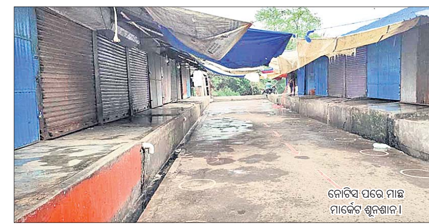
ନୋଟିସ୍ ପରେ ମାଛ ମାର୍କେଟ୍ ଶୁନିଗଲା।