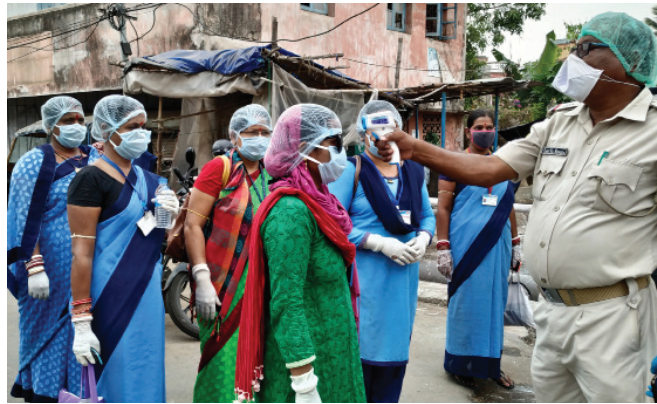
ସାକ୍ଷ୍ୟ ପରୀକ୍ଷା ପାଇଁ ଯାଉଥିବା ଆଶାକର୍ମୀଙ୍କୁ ପୋଲିସ୍ ଧ୍ୟାନ କରୁଛି।

ଅଧିକ ଯତ୍ନଶୀଳ ହେବା ପରିବର୍ତ୍ତେ ଏଭଳି ମେମ୍ବରଙ୍କୁ ପଠାଇ ଆଇନଜୀବୀଙ୍କୁ ବିଭ୍ରାନ୍ତ ପାଇଁ ଉଦ୍ୟମ କରାଯାଇଛି। ପରିଷଦ ନିଷ୍ପତ୍ତିର ମଧ୍ୟ ଅବମାନନା ହୋଇଛି। ଏହା ଆଡ଼େଇଥିବା ଆକୃତ ଧାରା ୩୫ର ଉଲ୍ଲଙ୍ଘନ। ଏଣୁ ସାଧାରଣ ସମ୍ପାଦକ ବେହେରା ଏବଂ କାର୍ଯ୍ୟକାରୀ କମିଟି ସଦସ୍ୟ ମହାପାତ୍ରଙ୍କୁ କାରଣ ଦର୍ଶାଏ ନୋଟିସ୍ ଜାରି କରାଯାଇଛି। ଦୁଇ ସପ୍ତାହ ମଧ୍ୟରେ ଉତ୍ତର ରଖିବାକୁ ନିର୍ଦ୍ଦେଶ ଦିଆଯାଇଥିବା ଓଡ଼ିଶା ରାଜ୍ୟ ଆଇନଜୀବୀ ପରିଷଦର ସମ୍ପାଦକ ସାମନ୍ତସିଂହାର ସୂଚନା ଦେଇଛନ୍ତି।