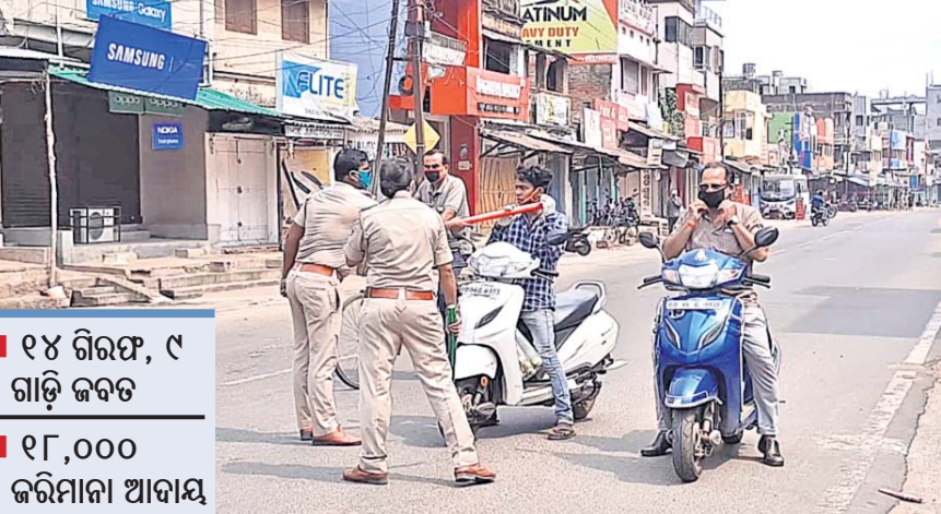
୧୪ ଗିରଫ, ୯ ଗାଡ଼ି ଜବତ

ଡେକାନାଲ ଅଫିସ୍, ୮୪: ରାଜ୍ୟରେ କରୋନା କାୟା ବିସ୍ଫାର କରିବାରେ ଲାଗିଛି। ଖୋର୍ଦ୍ଧା, ଭୁବନେଶ୍ଵର, କଟକ, କେନ୍ଦ୍ରାପଡ଼ା, ପୁରୀ, କଳାହାଣ୍ଡି, ଯାଜପୁର ଜିଲାରେ ସଂକ୍ରମଣ ଦେଖାଦେଇଛି। ସାମାଜିକ ଜିଲାର କୋଭିଡ୍-୧୯ର ପଦ୍ଧତି ପରେ ସର୍ବତ୍ର ହୋଇଉଠିଛି ଡେକାନାଲ ଜିଲା ପ୍ରଶାସନ। ଜିଲାର ଲକ୍ଷ୍ମୀନଗର ଏବଂ ସାମାଜିକ ଦୂରତା ନିୟମକୁ ଅଧିକ କଡ଼ାକଡ଼ି କରାଯାଇଛି। ଲୋକମାନଙ୍କୁ ସଚେତନ କରାଯିବା ସହ ସେମାନଙ୍କ ଜୀବନକୁ ସୁରକ୍ଷିତ ରଖିବା ଲାଗି କଠୋର ଆଭିମୁଖ୍ୟ ଗ୍ରହଣ କରାଯାଇଛି। ସହରରେ ରୁଧିରୀରୁ ବୁଲୁଥିବା ଯାନ ଚଳାଚଳ ଉପରେ କଟକଣା ଜାରି କରାଯାଇଛି। ତଥାପି ବିଭିନ୍ନ ଆଲ ଦେଖାଇ ଲକ୍ଷ୍ମୀନଗର କଟକଣା ଉଲ୍ଲଂଘନ କରୁଛନ୍ତି ଅମାନିଆ ଯୁବକ। ସମ୍ପୂର୍ଣ୍ଣ ନିୟମ ଉଲ୍ଲଂଘନକାରୀଙ୍କ ଉପରେ କାର୍ଯ୍ୟାନୁଷ୍ଠାନ ଗ୍ରହଣ କରିଛି ପୋଲିସ୍। ସମସ୍ତଙ୍କୁ ୯ ଗାଡ଼ି ଜବତ କରାଯିବା ସହ ୧୪ ଜଣଙ୍କୁ ଗିରଫ କରାଯାଇଛି। ୧୪ ହଜାର ଟଙ୍କା ଜରିମାନା ଆଦାୟ କରାଯାଇଥିବା ଚାନ୍ଦନ ଥାନା ପୋଲିସ୍ ପକ୍ଷରୁ ସୂଚନା ଦିଆଯାଇଛି। ଏଥିପ୍ରତି ଅନୁପମା ଜେମ୍‌ସ୍ ପ୍ରତ୍ୟକ୍ଷ ଚତ୍ଵାବଧାନରେ ପୋଲିସ୍