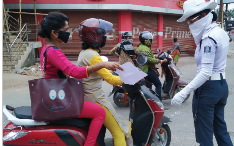
କଟକ ବକ୍ସିବଜାର ଛକଠାରେ ସୁଟିରେ ଯାଉଥିବା ଦୁଇଜଣ ମହିଳାଙ୍କୁ ଗ୍ରାମିକ ପୋଲିସ୍ ଯାଞ୍ଚ କରୁଛନ୍ତି।