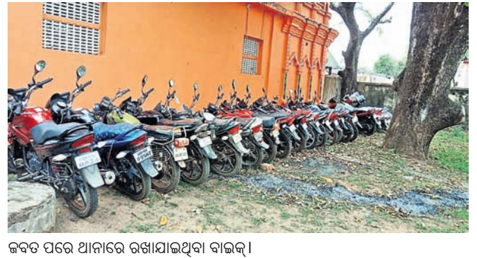
ବନ୍ଧୁ ପରେ ଥାନାରେ ରଖାଯାଇଥିବା ବାଇକ୍।