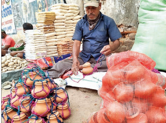
କଟକ ଚାନ୍ଦିନୀଚୌକ ରାସ୍ତା ପାଖରେ ଜଣେ ବ୍ୟକ୍ତି ପଣା ସଂକ୍ରମିତ ପାଇଁ ଶିକାଲବା ଘଡ଼ି ବନ୍ଦୁ କରୁଛନ୍ତି।