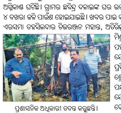
ପ୍ରଶାସନିକ ଅଧିକାରୀ ତଦନ କରୁଛନ୍ତି।