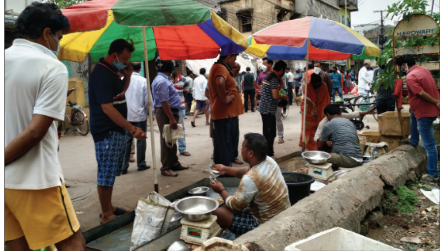
କଟକ ସହିଦ ସେନିମାର ଛକ ନିକଟରେ ଥିବା ମାଛ ଦୋକାନରେ ରୁଧିରୀର ଲୋକଙ୍କ ଭିଡ଼।