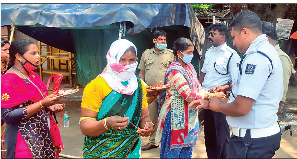
ସେମିଲିଗୁଡ଼ାରେ ବିଭିନ୍ନ ସଂଘର ମହିଳାମାନେ ପୋଲିସ୍ କର୍ମଚାରୀଙ୍କ ହାତରେ ରକ୍ଷାକବଚ ବାଣ୍ଟୁଛନ୍ତି ।