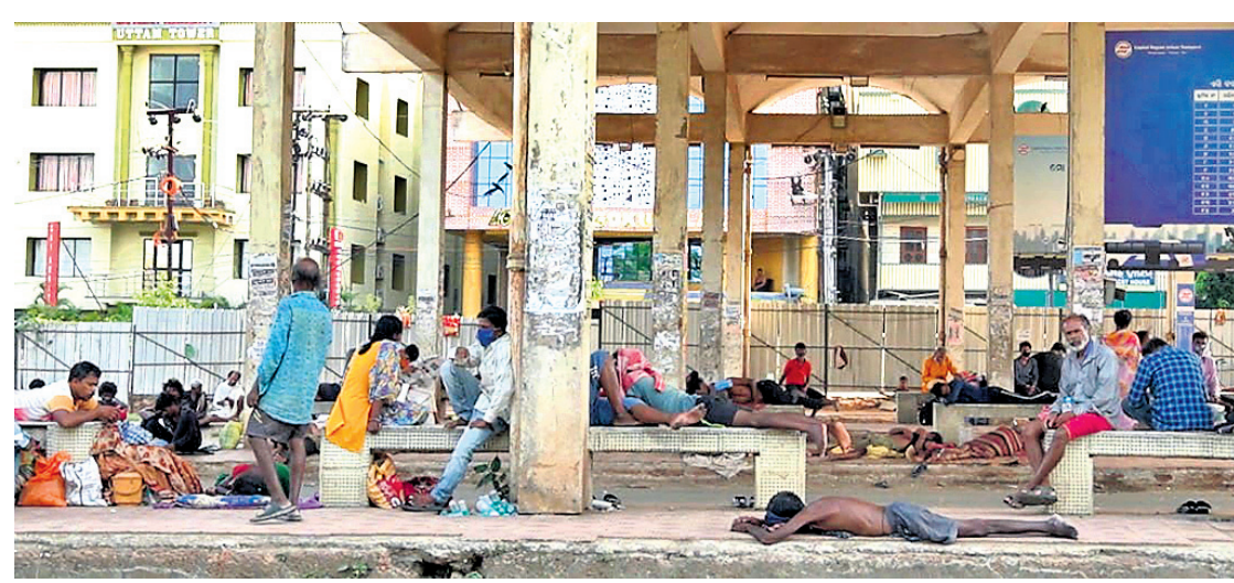
ନିଜ ଅଞ୍ଚଳକୁ ଯାଇ ନ ପାରି ଅଟକି ରହିଥିବା ଲୋକେ ଓ ଆଉଁସି ଅସହାୟ ଭୁବନେଶ୍ୱର ମାଷ୍ଟରକ୍ୟାଣ୍ଟିନ୍ ବସ୍‌ଷ୍ଟାଣ୍ଡ୍ରେ ଆଶ୍ରୟ ନେଇଛନ୍ତି।

ଭୁବନେଶ୍ୱର, ୮୪(ବୁଧବେ): ସାମାଜିକ ଦୂରତା ବଜାୟ ରଖିବା ସହ ସଂକ୍ରମଣକୁ ଏଡ଼ାଇବା ପାଇଁ ଭୁବନେଶ୍ୱର ମହାନଗର ନିଗମ (ବିଏମ୍‌ସି) ଲୋକଙ୍କ ପାଇଁ ନୂଆ ବ୍ୟବସ୍ଥା କରିଛି। ଭୁବନେଶ୍ୱର ପ୍ରାୟ ସମସ୍ତ ମୋ ବସ୍ ଷ୍ଟାଣ୍ଡ୍ ପରିବା ଦୋକାନ ଭାବେ ବ୍ୟବହାର କରାଯାଇଛି। ଭୁବନେଶ୍ୱରରେ ଥିବା ପରିବା ଦୋକାନୀମାନଙ୍କୁ ବିଭିନ୍ନ ବସ୍ ଷ୍ଟାଣ୍ଡ୍ରେ ଅଧିକାରୀମାନେ ସହ ସାମାଜିକ ଦୂରତା କପାଳି ବଜାୟ ରଖି ଲୋକମାନେ ପରିବା କିଣିବେ ସେଥିପ୍ରତି ଧ୍ୟାନ ରଖିବାକୁ ବିଏମ୍‌ସି ପକ୍ଷରୁ ପରାମର୍ଶ ଦିଆଯାଇଛି। ସେହିପରି ମୋ ବସ୍ ଓ ଷ୍ଟାଣ୍ଡ୍ ପରିଚାଳନା ଦାୟିତ୍ୱରେ ଥିବା କ୍ୟାପିଟାଲ ରିଭିଅର୍ ଅର୍ବାନ ଟ୍ରାନ୍ସପୋର୍ଟ (କ୍ଲଟ) ନିଜ ରୁଲ୍‌ବୁକ୍ରେ ହିଁ ଉଲ୍ଲେଖ କରୁଛି ଯେ, ମୋ ବସ୍ ଏବେ ଲୋକଙ୍କୁ ସେବା ଯୋଗାଇ ପାରୁନି। ଏପରି ସମୟରେ ମୋ ବସ୍ ଷ୍ଟାଣ୍ଡ୍ ଲୋକେ ପରିବା କିଣିବାର ସୁଯୋଗ ପାଇଥିବାରୁ ବେଶ୍ ଧ୍ୟାନ ଅନୁଭବ କରୁଛି ବୋଲି କ୍ଲଟ କହିଛି।