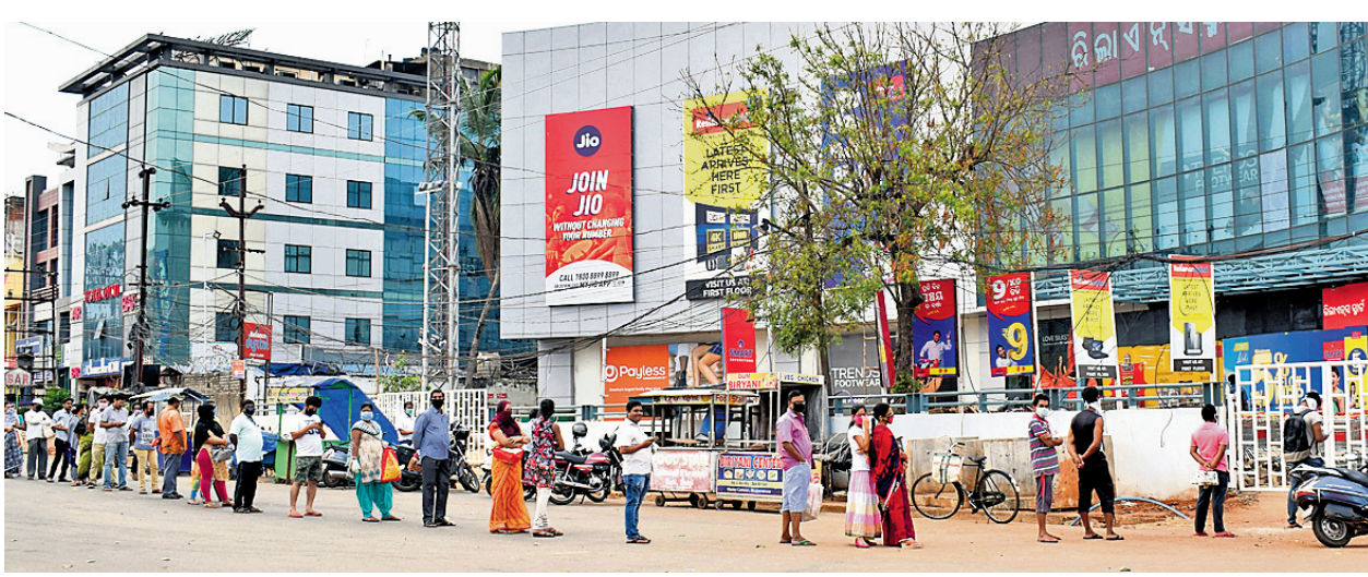
ଭୁବନେଶ୍ୱର ମାଷ୍ଟରକ୍ୟାଣ୍ଟିନ୍‌ସ୍ଥିତ ରିଲାଏଣ୍ଟ ମଲ୍‌ରୁ ଅତ୍ୟାବଶ୍ୟକ ସାମଗ୍ରୀ କିଣିବା ପାଇଁ ଲୋକେ ଲମ୍ବା ଧାଡ଼ିରେ ଅପେକ୍ଷା କରି ରହିଛନ୍ତି।