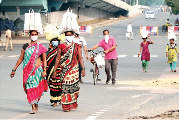
ଲୋକେ ବଜାରରୁ ପରିବା କିଣି ମୁଣ୍ଡ ଓ ସାଇକେଲରେ ଧରି ଭୁବନେଶ୍ୱର ରାଜମହଲ ଓ ଭରତକୁଠା ପର୍ଯ୍ୟନ୍ତ ଦେଇ ଘରକୁ ଫେରୁଛନ୍ତି।