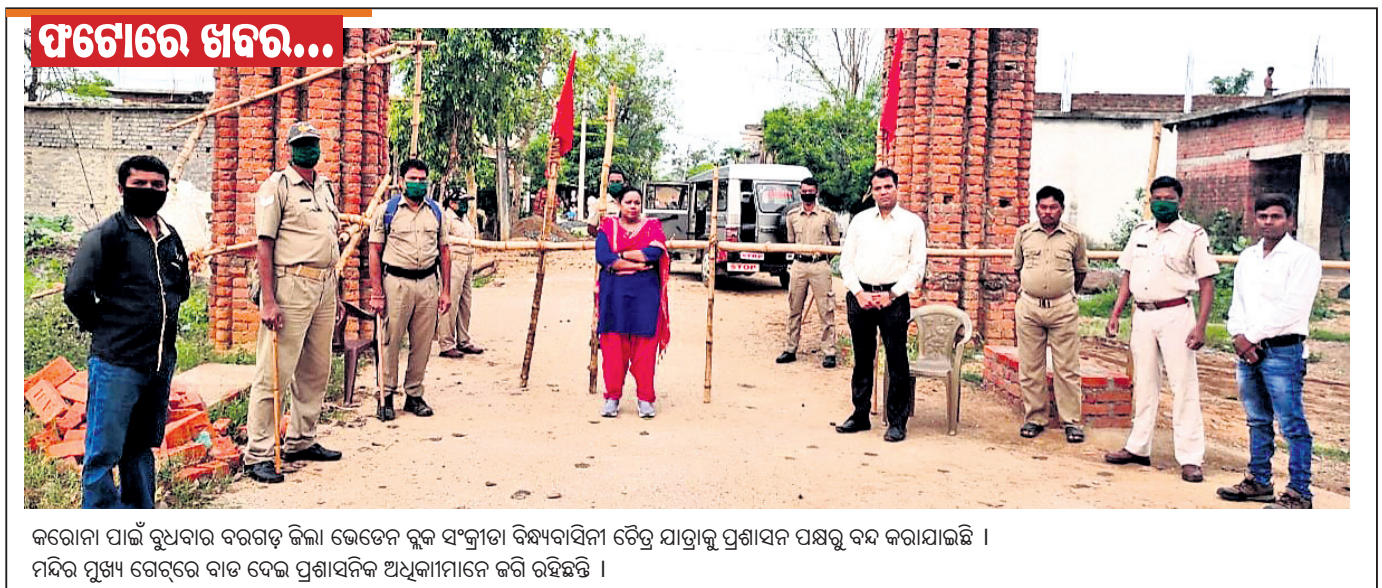
କରୋନା ପାଇଁ ରୁଧିବାର ବରଗଡ଼ ଜିଲ୍ଲା ଭେଡେନ ବ୍ଲକ ସଂକ୍ରମଣ ବିନ୍ଧ୍ୟାବିନା ଚୈତ୍ର ଯାତ୍ରାକୁ ପ୍ରଶାସନ ପକ୍ଷରୁ ବନ୍ଦ କରାଯାଇଛି । ମନ୍ଦିର ମୁଖ୍ୟ ଗେଟ୍‌ରେ ବାଟ ଦେଇ ପ୍ରଶାସନିକ ଅଧିକାରୀମାନେ ଜରି ରହିଛନ୍ତି ।