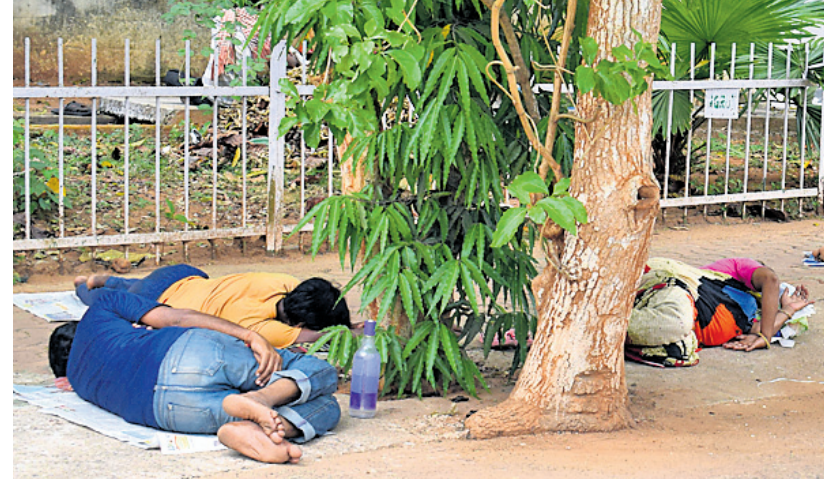
ଲକ୍ଷ୍ମୀଭଙ୍ଗ ଯୋଗୁ ଭୁବନେଶ୍ୱର ରାସ୍ତାକଡ଼ରେ ଆଶ୍ରୟ ନେଇଥିବା ଲୋକେ ବୁଧବାର ଖରାବେଳେ ପୁରୁପାଥ ଗନ୍ଧମୂଳେ ବିଶ୍ରାମ ନେଉଛନ୍ତି।