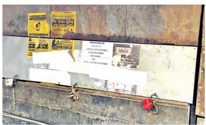
ଜିଲ୍ଲା ପ୍ରଶାସନ ପକ୍ଷରୁ ସିଲ୍ ହୋଇଥିବା ଦୋକାନ।