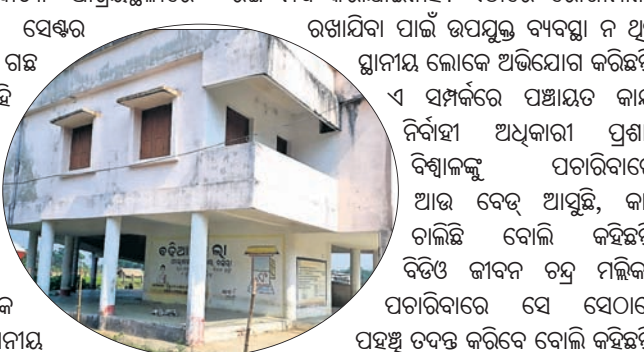
କ୍ୱାରାଣ୍ଡାଇନ୍ ସେଣ୍ଟରରେ ନାହିଁ ଆବଶ୍ୟକ ସୁବିଧା

ସାରା ଦିଗରେ କରୋନା ମହାମାରୀର ରୂପ ନେଇଥିବା ବେଳେ ଏହି ଭୂତାଣୁ ପ୍ରତିହତ କରିବା ପାଇଁ ସାରା ଦେଶରେ ଲକ୍ଷ୍ମୀଭୂମି କରାଯାଇଛି। ଏହି କ୍ରମର ସମସ୍ତ ପଞ୍ଚାୟତରେ ଗୋଟିଏ କ୍ୱାରାଣ୍ଡାଇନ୍ ସେଣ୍ଟର ଖୋଲିବାକୁ ସରକାର ପ୍ରତି ପଞ୍ଚାୟତକୁ ୫ଲକ୍ଷ ଲେଖାଏ ଟଙ୍କା ପ୍ରଦାନ କରିଛନ୍ତି। ପଞ୍ଚାୟତ ଅଧୀନ ଏକ ସ୍ଥଳରେ କ୍ୱାରାଣ୍ଡାଇନ୍ ସେଣ୍ଟର କରାଯିବା ସହ ସେଠାରେ ବେଡ୍ ପକାଇବା, ସାନିଟାଇଜ୍ କରିବା, ପାନୀୟ ଜଳ ଓ ଶୌଚାଳୟ ଆଦି ବ୍ୟବସ୍ଥା କରିବା ଦାୟିତ୍ୱ ସରକାରଙ୍କୁ ଦିଆଯାଇଛି। ହେଲେ ବିଭିନ୍ନ ବ୍ଲକ୍ ବାସନ୍ଦୀ ପଞ୍ଚାୟତରେ