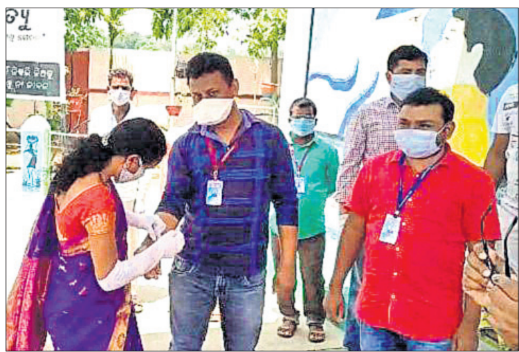
ଡାକ୍ତର, ପୋଲିସ୍‌ଙ୍କ ହାତରେ ରକ୍ଷାକବଚ ବାଣ୍ଟୁଛନ୍ତି ।