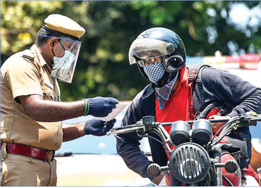
ଚେନାଇରେ ଲକ୍ଷ୍ମୀନଗର ବେଳେ ପୋଲିସ ଜଣେ ବାଇକ୍ ଆରୋହୀଙ୍କ କାଗଜପତ୍ର ଯାଞ୍ଚ କରୁଛି।