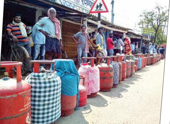
ପାଲଲହଡ଼ା ନୂଆ ବସ୍ଷ୍ଟାଣୁଗୁଡ଼ିକ ଗଣ୍ୟ ଏକେଡୁରେ ଉପଯୋଗୀମାନେ ସାମାଜିକ ଦୂରତା ରକ୍ଷା କରି ଧାଡ଼ିରେ ଠିଆ ହୋଇଛନ୍ତି।