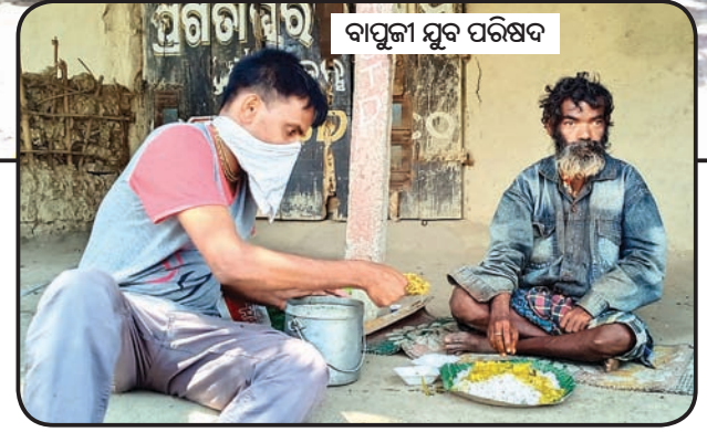
ବାପୁଜୀ ମୁବ ପରିଷଦ