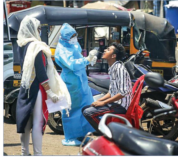
ପୁୟାଇର କୁଲୀ ଅଞ୍ଚଳରେ ଜଣେ ସ୍ୱାସ୍ଥ୍ୟକର୍ମୀ ପରାସା ଲାଗି ଯୁବକଙ୍କଠାରୁ ସ୍ୱାବ ନମୁନା ସଂଗ୍ରହ କରୁଛନ୍ତି।