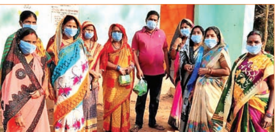
ମହିଳାମାନେ ଶୁଖିଲା ଖାଦ୍ୟ ବଣ୍ଟନ କରୁଛନ୍ତି।

ଢେଙ୍କାନାଳ ସଦର ବ୍ଲକ୍ ଗୋବିନ୍ଦପୁର ମଝିଆସି ଶକ୍ତି ଓମ୍ ସାଜ ସ୍ୱୟଂ ସହାୟକ ଗୋଷ୍ଠୀ ପକ୍ଷରୁ ଶୁଖିଲା ଖାଦ୍ୟ ବଣ୍ଟନ କରାଯାଇଛି।