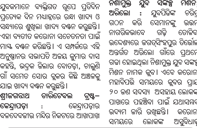
ନିଶାପୁତ୍ର ମୁବ ସଂକଳ୍ପ ମିଶନ

ବାପୁଜୀ ମୁବ ପରିଷଦର ଗରିବ ପିଲାଙ୍କୁ ପାଠ୍ୟ ଉପକରଣ ଯୋଗାଇଥାନ୍ତି । ଏବେ ମହାମାରୀ କରୋନା କଟକଣା ଥାଇ ମଧ୍ୟ ପାଠ୍ୟ ଆଣି ଏହି ସେବାରେ ଲାଗିଛନ୍ତି ସୁବିଧାକାରୀମାନେ । ହାତଗଣତି ୫ରୁ ୭ ଜଣ ସୁବିଧିକାରୀ, ଖିରିଆ, ଦିନ ମରୁଣିଆଙ୍କ ନିକଟରେ ଦୈନିକ ପହଞ୍ଚିବା ସହାୟତା ପାଇଁ ଯୋଜନା କରାଯାଇଛି । ୨୦୧୭ ସେପ୍ଟେମ୍ବର ୩ ତାରିଖରେ ମାତ୍ର ୭ ଜଣ ସଦସ୍ୟ ସହରରେ ସେବା କାର୍ଯ୍ୟ କରିବାକୁ ଲକ୍ଷ୍ୟ ରଖି ଭଦ୍ରକ ସୋସିଆଲ ସର୍ଭିସ ସେଣ୍ଟର ଆରମ୍ଭ କରିଥିଲେ । ବର୍ତ୍ତମାନ ଏହାର ସଦସ୍ୟ ସଂଖ୍ୟା ଶତାଧିକ ହୋଇଛି । ସେମାନଙ୍କ ମଧ୍ୟରେ ପ୍ରାୟ ୩୦ ସକ୍ରିୟ ଲୋକଙ୍କୁ ସେମାନେ ଖାଦ୍ୟ ସାମଗ୍ରୀ ସହ ସାଧାରଣ ଥଣ୍ଡା ଓ ଅନ୍ୟ କେତେକ