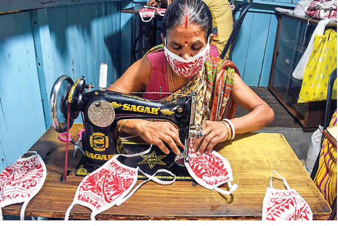
ନୂଆଦିଲ୍ଲୀରେ ଜଣେ ମହିଳା ଆସାମୀୟ ପାରମ୍ପରିକ ଡିଜାଇନ୍‌ର ମାସ୍କ ତିଆରି କରୁଛନ୍ତି।

୨୨, ପଞ୍ଜାବରେ ୧୨, କର୍ଣ୍ଣାଟକରେ ୪, ପଶ୍ଚିମବଙ୍ଗରେ ୫, କର୍ନାଟକରେ ୬, ରାଜସ୍ଥାନରେ ୩, କେରଳ ଓ ହରିୟାଣାରେ ୨ ଲେଖାଏଁ ଜୀବନ ହୋଇଥିବା ଜଣାପଡୁଛି।