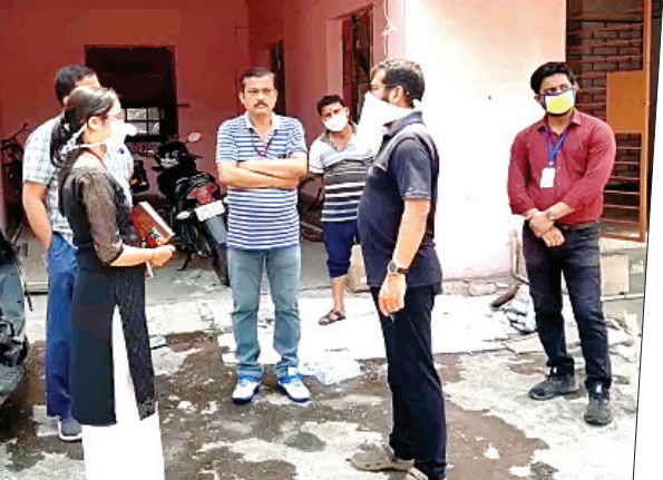
ଢେଙ୍କାନାଳ ଜିଲ୍ଲା ବାକିଗୋବିନ୍ଦପୁର ପୁରୁଣା ଜିଲ୍ଲା ଚିକିତ୍ସାଳୟରେ କୋଭିଡ-୧୯ ହସ୍ପିଟାଲ ପ୍ରସ୍ତୁତି ଚିରଫ କରୁଛନ୍ତି ପ୍ରଶାସନିକ ଅଧିକାରୀମାନେ।