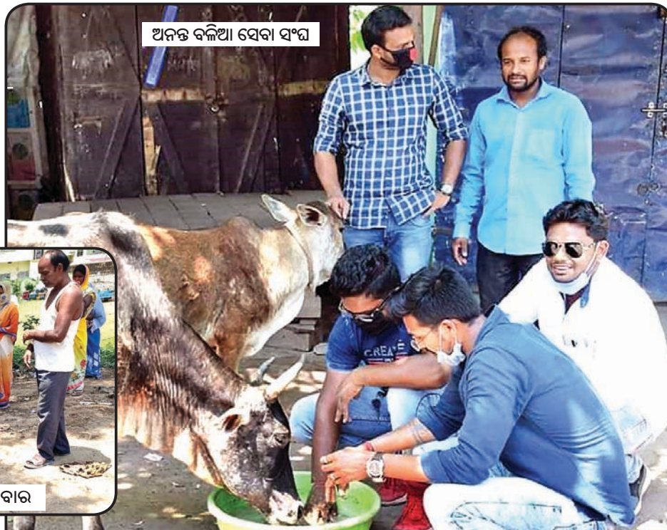
ଅନନ୍ତ ବଳିଆ ସେବା ସଂଘ