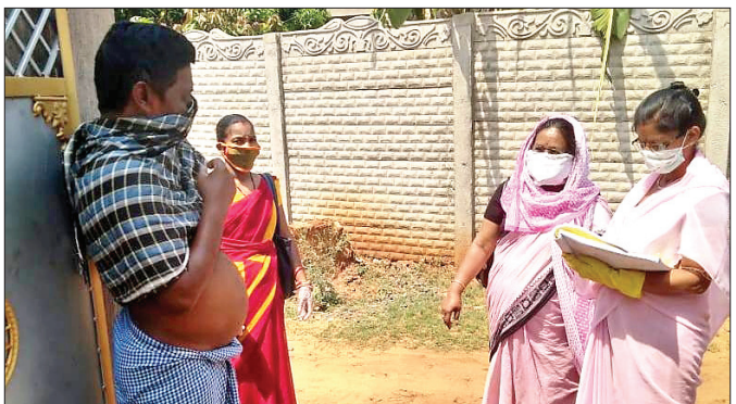
ଜଣେ ଲୋକଙ୍କ ନିକଟରୁ ତଥ୍ୟ ସଂଗ୍ରହ କରାଯାଇଛି।

ଢେଙ୍କାନାଳ ସହରର ଜଣେ ମହିଳାଙ୍କ ସ୍ୱାସ୍ଥ୍ୟ କରୋନା ଭୂତାଣୁ ଚିହ୍ନଟ ହେବା ପରେ ଚୈତ୍ୟାଳୟରେ ଘର ଘର ବୁଲି ସାମ୍ପ୍ରାୟ ସର୍ବେ କରାଯାଇଛି। ଶୁକ୍ରବାରଠାରୁ ଆରମ୍ଭ ହୋଇଥିବା ଏହି ସର୍ବେ ରବିବାର ଦୁଇା ଶେଷ ହେବ ବୋଲି ଚୈତ୍ୟାଳୟ ପକ୍ଷରୁ ସୂଚନା ଦିଆଯାଇଛି।