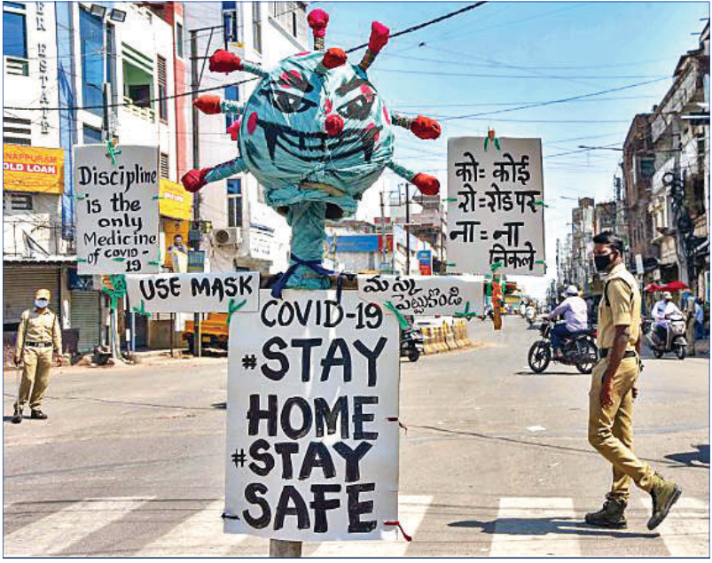
ସାଲଦ୍ୱାରାଦ୍ୱାରା ମୋଡାଲିଫୁରା ଏକ୍ସ ରୋଡରେ ସଚେତନତା ପାଇଁ କରୋନା ପ୍ରତିକୃତି