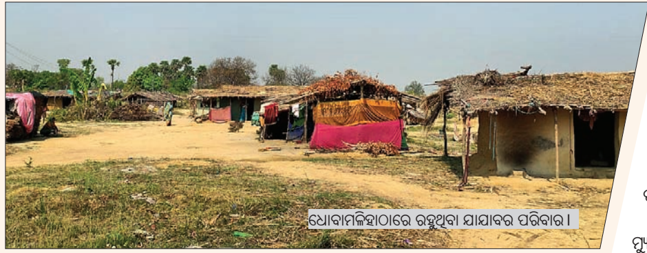
ଧୋବାମଳିହାଠାରେ ରହୁଥିବା ଯାଯାବର ପରିବାର।

ଲକ୍ଷ୍ମୀଦେବୀ ସମୟରେ ସରକାରୀ ସହାୟତା ନେବାକୁ ବହୁ ଥିଲାବାଲିକା ହାତ ଲାଘି ଆସୁଥିବା ବେଳେ ଖାଦ୍ୟ ସାମଗ୍ରୀ ଧରି ଘରକୁଆସେ ପହଞ୍ଚିଥିବା ପ୍ରଶ୍ନାସନକୁ ଫେରାଇ ଦେଇଛି ୧୩ ଯାଯାବର ପରିବାର।