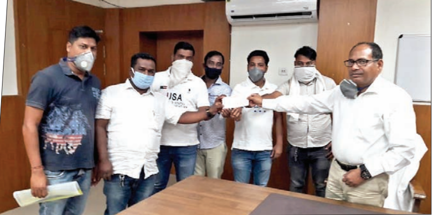
ଚାକଟେର ବକରାମ ସେକ୍ଟରର ଅର୍ଥୀ ଚୁକ୍ ମାଲିକ ସଂଘ ପକ୍ଷରୁ ମୁଖ୍ୟମନ୍ତ୍ରୀଙ୍କ ଚିଲିଫ ପାଠିକୁ ୨ ଲକ୍ଷ ଟଙ୍କା ଦାନ କରାଯାଇଛି।