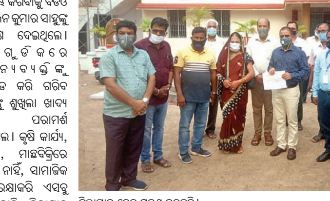
ଜିଲ୍ଲାପାଳ ତେଜ ଗ୍ରହଣ କରୁଛନ୍ତି।

ଲକ୍ଷ୍ମୀଭଦ୍ର ଯୋଗୁ ଲୋକେ ଅସୁବିଧାରେ ଅଛନ୍ତି। ସରକାର ରାଶିନକାଠି, ଲୋକବିକାଶ ଧାରା ଓ ଗରିବଙ୍କ ପାଇଁ ବହୁ ଯୋଜନା କରୁଛନ୍ତି।