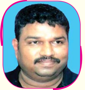
ଭିଜନ-୨୦୨୪ ଉପରେ ଆଞ୍ଚ ଆସିବ

କଟକ ଅଧିକ, ୧୩୩୪: କରୋନା ପ୍ରଭାବକୁ ମୁହଁକିନି ଜ୍ୱାଡ଼ା ଜଗତା ରାଜ୍ୟ ସମେତ ସମଗ୍ର ଦେଶ ଓ ବିଶ୍ୱର ଜ୍ୱାଡ଼ା ସାମ୍ରାଜ୍ୟ ମଧ୍ୟ କରୋନା ଭାଇରସ୍ ଯୋଗୁଁ ପ୍ରଭାବିତ ହୋଇଛି। ଅନେକ ପ୍ରମୁଖ ଦୁର୍ଗମେଷୁ ଇତି ମଧ୍ୟରେ ବାତିଲ କରାଯାଇଛି। ଭାରତୀୟ ଘରୋଇ ଜିଜ୍ଞେଷୁ ପ୍ରମୁଖ ସେବାଦାର ଦୁର୍ଗମେଷୁ ଇତିଆନ ପ୍ରମିୟର ଲିଭି(ଆଇପିଏଲ) ମଧ୍ୟ ଅନିର୍ଦ୍ଦିଷ୍ଟ କାଳ ପର୍ଯ୍ୟନ୍ତ ସ୍ଥଗିତ। ସ୍ଥିତି ନ ସୁଧୁରିବା ପର୍ଯ୍ୟନ୍ତ ଜ୍ୱାଡ଼ାର ଭବିଷ୍ୟତକୁ ନେଇ ଆକଳନ କରିବା କଷ୍ଟକର। ତେବେ ଚଳିତ ବର୍ଷ ତଥା ଆଗାମୀ ଜିଜ୍ଞେଷୁ ସିଜନରେ ରାଜ୍ୟ ଜିଜ୍ଞେଷୁର ସ୍ଥିତି କିପରି ରହିବ ତାହାକୁ ନେଇ ମତାମତ ଭିଜନ-୨୦୨୪ ଉପରେ ଆଞ୍ଚ ଆସିବ ସବୁ କିଛି ଭଲଭାବେ ଚାଲିଥିଲା। ଆମେ କ୍ଲବ ସ୍ତରୀୟ ଦୁର୍ଗମେଷୁ ଉପରେ ଆୟୋଜନ କରିଛୁ। ଏଥିରୁ ଅନେକ ନୂତନ ପ୍ରତିଭା ସମ୍ବୃଦ୍ଧି ଆସିବ। ହେଲେ ପରବର୍ତ୍ତୀ କୌଣସି ପଦକ୍ଷେପ ପୂର୍ବରୁ ଆମ ହାତ ବାନ୍ଧି ହୋଇ ଗଲା। କରୋନା ଭାଇରସର ପ୍ରଭାବ ଯୋଗୁଁ ଏବେ ଭାରତୀୟ