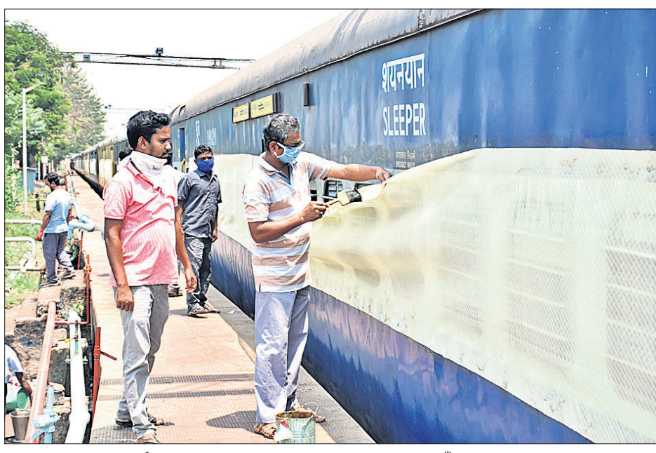
ସୋମବାର ପଣା ସଂକ୍ରାନ୍ତିରେ ଲିଙ୍ଗରାଜ ମନ୍ଦିର ସମ୍ମୁଖ ଖାଁ ଖାଁ ହନୁମାନ ଜୟନ୍ତୀ ଅବସରରେ ଭୁବନେଶ୍ଵର ବିବେକାନନ୍ଦ ମାର୍ଗସ୍ଥିତ ଏକ ହନୁମାନ ମନ୍ଦିରରେ ପୂଜାର୍ଚ୍ଚନା। ଭୁବନେଶ୍ଵର ସମ୍ପର୍କରେ ପାର୍ଶ୍ଵ ରେଲୱେ ସ୍ଟାନ୍ସିଓନରେ ଟ୍ରେନ୍ ବରିରେ କରୋନା ସମ୍ପର୍କ ପାଇଁ ସାବଧାନତା ସେତେ ପ୍ରସ୍ତୁତ କରାଯାଇଛି।