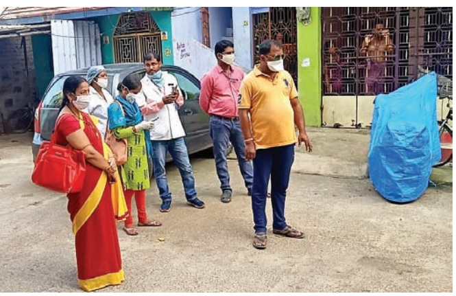
ଭୁବନେଶ୍ଵରରୁ ଫେରିଥିବା ବ୍ୟକ୍ତିଙ୍କ ଘର ନିକଟରେ ଯାଞ୍ଚ ପାଇଁ ପହଞ୍ଚିଥିବା ସ୍ଵାସ୍ଥ୍ୟ ଟିମ୍।

ବ୍ରହ୍ମପୁର ମହାନଗର ନିଗମ ୩୧ ନଂ. ଖାତ ଅନ୍ତର୍ଗତ କୋପରେଟିଭ କଲୋନୀ ୩ୟ ଲେନ୍ ଅଞ୍ଚଳର ଭୁବନେଶ୍ଵରରୁ ଫେରିଥିବା ଜଣେ ବ୍ୟକ୍ତିଙ୍କୁ ଯୋଗଦାନ ହୋଇ କ୍ଵାରାଣ୍ଡାଇନ୍ରେ ରହିବାକୁ ନିର୍ଦ୍ଦେଶ ଦିଆଯାଇଛି।