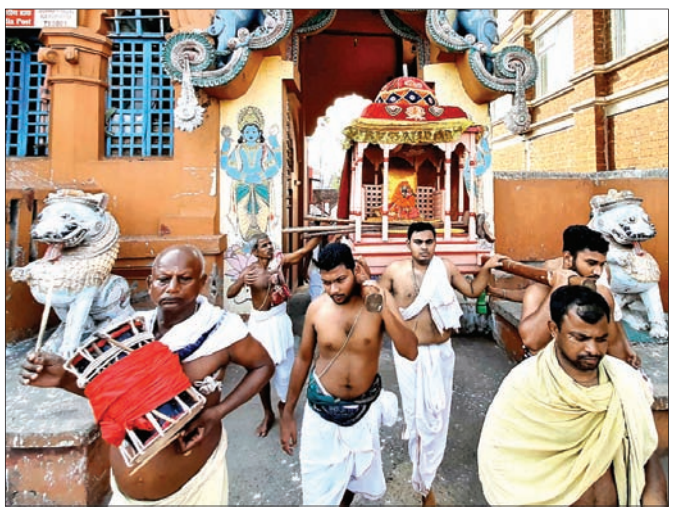
ଶ୍ରୀମନ୍ଦିରରୁ ଶ୍ରୀହନୁମାନଙ୍କୁ ଜରନାଥବଳଭଦ୍ର ବିଜେ କରାଯାଉଛି।