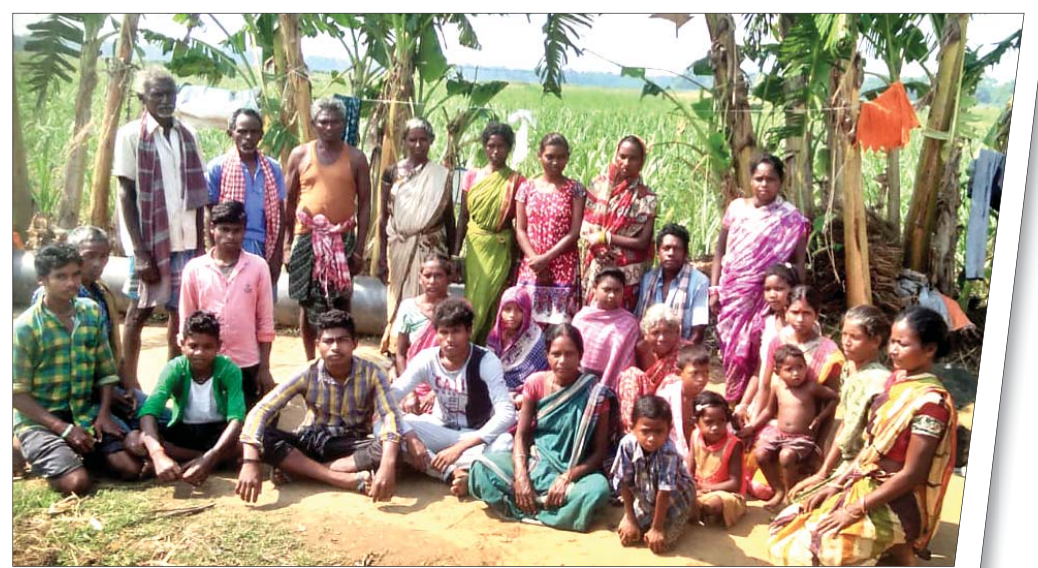
୨୭ ଜଣ ବହିରାଗତ ଶ୍ରମିକ ।