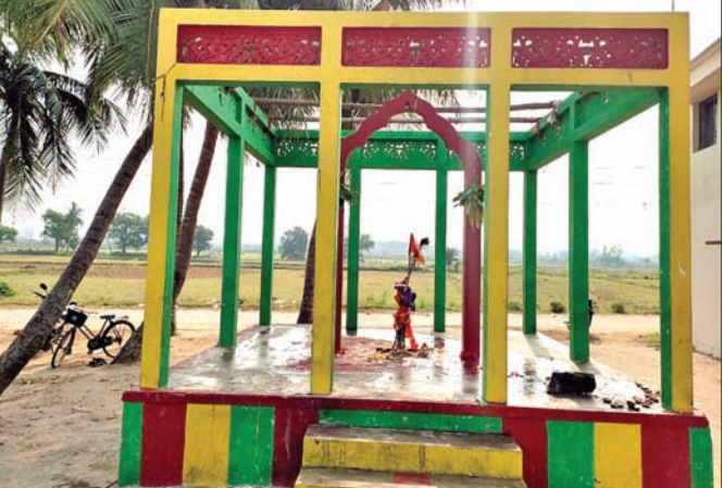
ଶୂନ୍ୟମାନ ହେଉଛି ଦଣ୍ଡକାଳୀ ମନ୍ଦିର ଛାଡ଼ି ମେରୁ କୁଣ୍ଡ।

କରୋନା ସଂକ୍ରମଣ ତଥା ଜନଗହଳ ସ୍ଥାନରୁ ଲୋକଙ୍କୁ ଦୂରରେ ରଖିବା ନେଇ ଗଞ୍ଜାମ ଜିଲ୍ଲା ପ୍ରଶାସନ ପକ୍ଷରୁ ମେରୁ ଯାତ୍ରା ବନ୍ଦ ନିର୍ଦ୍ଦେଶ ଦିଆଯାଇଛି।