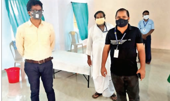
ଉପଜିଲ୍ଲାପାଳ ଅନୁଧ୍ୟାନ କରୁଛନ୍ତି। ୭୪୯ ବିଦେଶ ଫେରନ୍ତାଙ୍କ ହୋମ୍ କ୍ଵାରାଣ୍ଡାଇନ୍ ସରିଲା

ଗଞ୍ଜାମ ଜିଲ୍ଲାକୁ ବିଦେଶ ଓ ଅନ୍ୟ ରାଜ୍ୟରୁ ଫେରିଥିବା ଲୋକଙ୍କୁ ହୋମ୍ କ୍ଵାରାଣ୍ଡାଇନ୍ରେ ଅଛନ୍ତି। ଅନ୍ୟ କେତେକଙ୍କୁ ପ୍ରତି ପଞ୍ଚାୟତରେ ଖୋଲିଥିବା ଆଇସୋଲେଶନ କେନ୍ଦ୍ରରେ ରଖାଯାଇଛି।