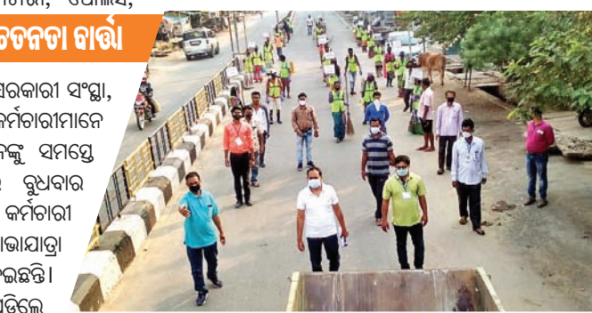
ସଫେଇ କର୍ମଚାରୀମାନେ ସଫେଇକାରୀ ଶୋଭାଯାତ୍ରାରେ ଯାଉଛନ୍ତି।