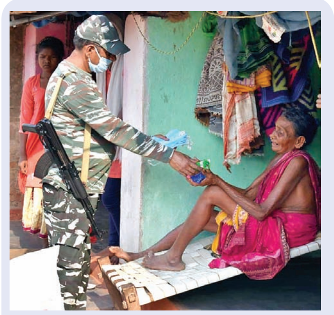
ରାୟଗଡ଼ା ଜିଲ୍ଲା ଚନ୍ଦ୍ରପୁର ବ୍ଲକ୍ ଡାକ୍ତରଖାନାରେ ଚିକିତ୍ସା ପାଇଁ ଆସିଥିବା ଏକ ସ୍ତ୍ରୀଙ୍କୁ ସାମାଜିକ ଦୂରତା ବଜାୟ ରଖିବା ପାଇଁ ସୁରକ୍ଷା ଦେବା ପାଇଁ ସୂଚନା ଦିଆଯାଇଛି।