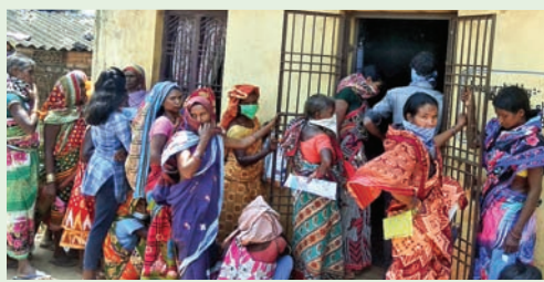
ବିକିରି, ୧୫୪୪(ଡି.ଏନ୍.ଏ.)- ରାୟଗଡ଼ା ଜିଲ୍ଲା କାଶୀପୁର ବ୍ଲକ୍ ବିକିରିରେ ମଧ୍ୟ ସମାନ ସ୍ଥିତି ବାରମ୍ବାର ଚାରିବ ସତ୍ତ୍ୱେ ଲୋକେ ସର୍ବସାଧାରଣ ସ୍ଥାନରେ ସାମାଜିକ ଦୂରତା ରଖିନାହାନ୍ତି। ଉତ୍କଳ ଗ୍ରାମ୍ୟବ୍ୟାଙ୍କ, କିଓଏ ବ୍ୟାଙ୍କିଙ୍ଗ୍, ଗ୍ରାହକ ସେବା କେନ୍ଦ୍ରରେ ଉପଭୋକ୍ତା ଓ ହିସାବକାରୀଙ୍କ ଭିଡ଼ ଲାଗୁଛି। ସେହିପରି ପରିବା ବଜାର, ଡେକୋରାଟି ବୋକାଳ, ମାଛ, ମାଂସ ଦୋକାନରେ ମଧ୍ୟ ଗ୍ରାହକମାନେ ଗହଳି ଲଗାଉଛନ୍ତି। ପୋଲିସ ଉପସ୍ଥିତ ଥାଇ ମଧ୍ୟ ସେମାନଙ୍କୁ ଲୋକେ ବେଶାନ୍ତି କରୁଛନ୍ତି।