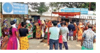
ଠାଉଳବା ପାଇଁ ବ୍ୟାଙ୍କ ସମ୍ମୁଖରେ ଭିଡ଼ ଅଭାବ ଯୋଗୁଁ ଏପରି ଭିଡ଼କୁ ନିୟନ୍ତ୍ରଣ କରିବା କଷ୍ଟକର ହୋଇଥିଲା। ଖବର ପାଇ ଲୋକେ ଦୂରତା ବଜାୟ ରଖିବାକୁ ସାମାଜିକ ଦୂରତା ରଖି ଛିଡ଼ା ହେବାକୁ ଅନୁରୋଧ ହୋଇଥିବାବେଳେ ଲୋକେ ଯେତେବେଳେ ଦୂରତା ବଜାୟ ରଖି ଛିଡ଼ା ହେବାକୁ ଅନୁରୋଧ ହୋଇଥିଲା ତେବେ ସେମାନେ ତାହା ଧ୍ୟାନ ନଦେଇ ଠାଉଳବା ପାଇଁ ବ୍ୟାଙ୍କ ସମ୍ମୁଖରେ ଭିଡ଼ ହେବାକୁ ଦେଖିବାକୁ ମିଳିଥିଲା।