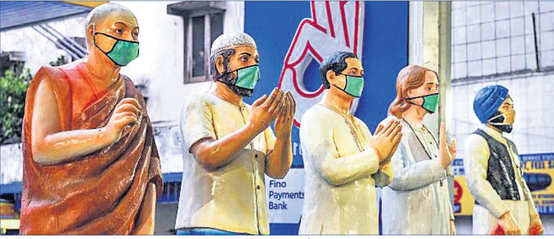
କରୋନା ସଂକ୍ରମଣ ବିରୋଧରେ ସଚେତନତା ସୃଷ୍ଟି ଲାଗି କୋଲକାତାରେ ପ୍ରତିମୂର୍ତ୍ତିକୁ ମାଧ୍ୟମରେ ପ୍ରଦର୍ଶନ କରାଯାଇଛି ।