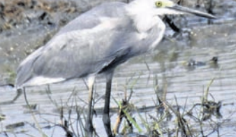
ଭୁବନେଶ୍ୱର, ୨୧୪ (ବୁଧବାର)

ଓଡ଼ିଶାରେ ପ୍ରଥମ କରି ଠାବ କରାଯାଇଛି ବିରଳ ଷ୍ଟେସ୍‌ରିଡ୍‌ଲଗ୍‌ଗ୍‌ସ୍ ପକ୍ଷୀ। ଖୋର୍ଦ୍ଧା ଜିଲ୍ଲା ଅନ୍ତର୍ଗତ ଚିଲିକାର ମଙ୍ଗଳାଯୋଡ଼ିରେ ଏହି ପକ୍ଷୀକୁ ଚିହ୍ନ କରିଛନ୍ତି ବୀର୍ଷ ଗାଙ୍ଗୁଲି ଓ ସମ୍ପର୍କୀୟ ଡିପ୍‌ଲୋମାଟ୍‌ସ୍।