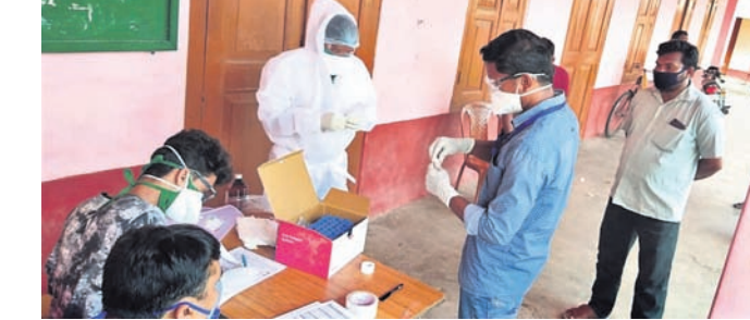
ଏକ ସ୍କୁଲ ପରିସରରେ ଉଚ୍ଚନମୁନା ସଂଗ୍ରହ କରାଯାଇଛି।