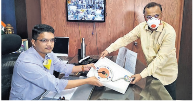
ଆଇଟିଆଇ ଅଧିକାରୀ ଉପଜିଲ୍ଲାପାଳଙ୍କୁ ସ୍ୱାସ୍ଥ୍ୟ ଖାର୍ ପ୍ରଦାନ କରୁଛନ୍ତି।