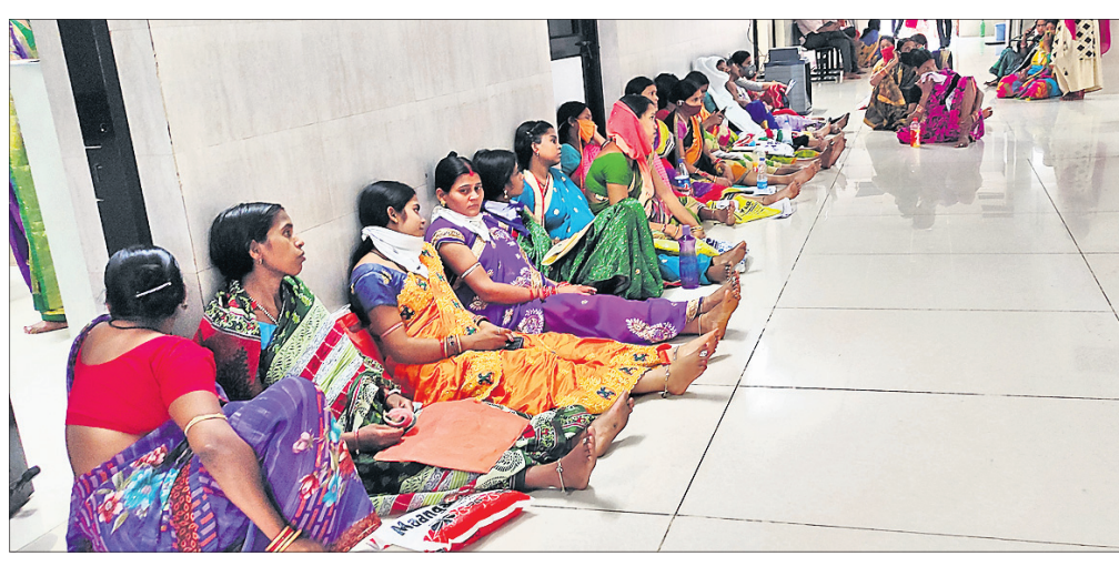
ଅଲଗା-ଅଲଗା ପାଇଁ ଅପେକ୍ଷାରତ ମହିଳାମାନେ ନିୟମ ପାଳନ କରିନାହାନ୍ତି।

ଲକ୍ଷ୍ମୀପୁର ଯୋଗଣା ପରଠାକୁ ଅନୁଗୋଳ ଜିଲ୍ଲା ମୁଖ୍ୟ ଚିକିତ୍ସାଳୟରେ ରୋଗୀ ସଂଖ୍ୟା ହ୍ରାସ ପାଇଥିଲା। ହେଲେ ୨୦ ଚାରିଖରୁ କିଛିଟା କୋହଳ ହୋଇଥିବା ଶୁଣିବା ମାତ୍ରେ ମଙ୍ଗଳବାର ହଠାତ୍ ରୋଗୀ ସଂଖ୍ୟା ବେଶ୍ ବଢ଼ିଯାଇଥିଲା। ବହୁ ସଂଖ୍ୟକ ରୋଗୀ ଓ ସମ୍ପର୍କୀୟ ଆଉଟଡୋରରେ ଭିଡ଼ ଜମାଇଥିବା ବେଳେ ଅଲଗା-ଅଲଗା ପାଇଁ ଗର୍ଭବତୀ ଓ ଅନ୍ୟ ମହିଳାମାନେ ବାରଣ୍ଡାରେ ବସି ରହିଥିଲେ। ତେବେ ସେମାନଙ୍କ ମଧ୍ୟରୁ ଅନେକେ ସାମାଜିକ ଦୂରତା ରକ୍ଷା କରି ନ ଥିଲେ କି ମାଷ୍ଟ ମଧ୍ୟ ପିନ୍ଧି ନ ଥିଲେ। ଏସବୁ ନିୟମ ବାଧ୍ୟତାମୂଳକ ହୋଇଥିଲେ ବି ମେଡିକାଲ କର୍ତ୍ତୃପକ୍ଷ କଟକଣାକୁ କଡ଼ାକଡ଼ି କରିବା ପରିବର୍ତ୍ତେ ହାତ ଟେକିଦେଇଥିବା ଦେଖାଯାଇଥିଲା।