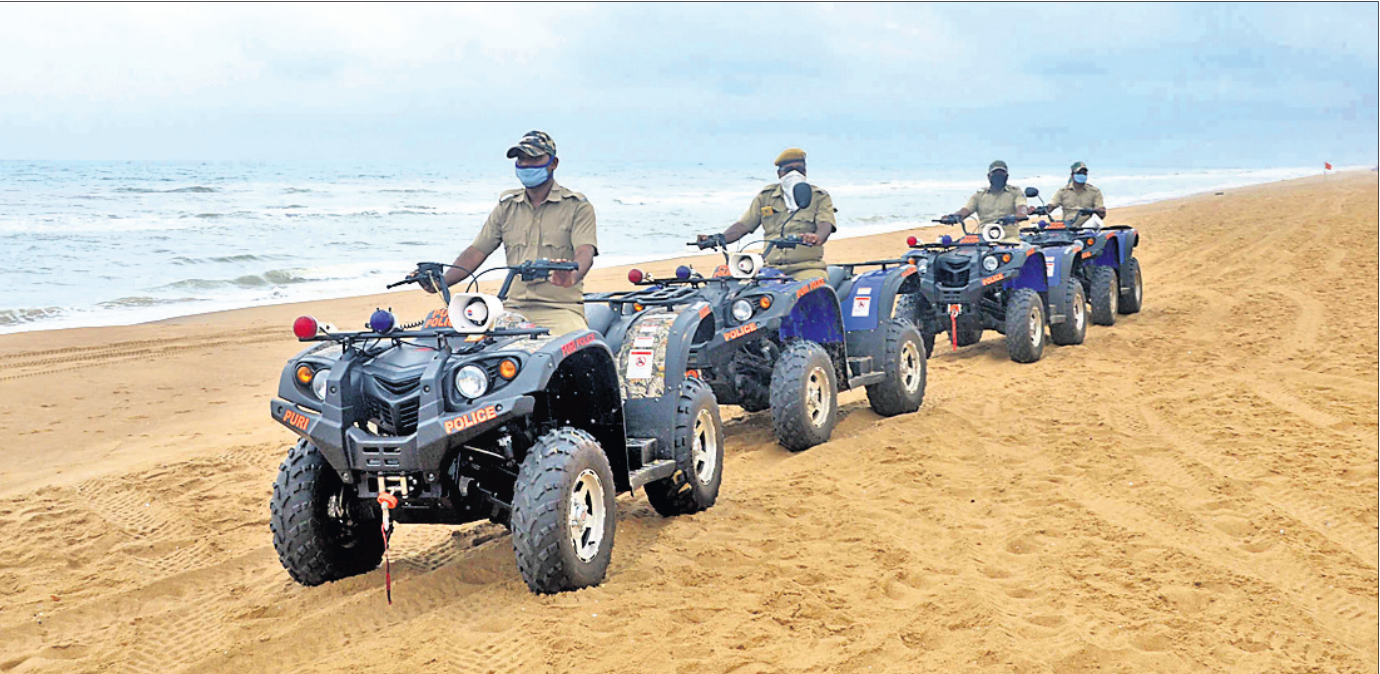
ପୁରୀ ବେଳାଭୂମିରେ ମଙ୍ଗଳବାର ଅଲଟୋଲାଇଟ୍ ଭେହିକଲ୍ରେ ପୋଲିସ୍ ପାଟ୍ରୋଲିଂ କରୁଛି।