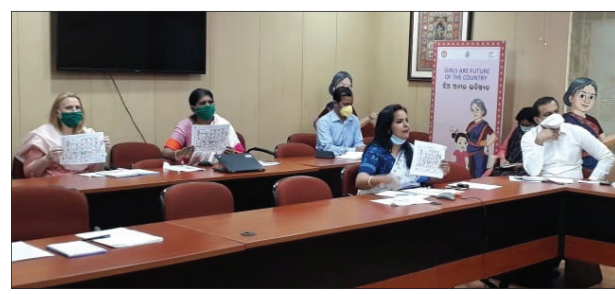
କ୍ୟାମ୍ପେନ୍ସର ଉନ୍ମୋଚନ କାର୍ଯ୍ୟକ୍ରମରେ ମହିଳା ଶିଶୁ ବିକାଶ ଓ ମିଶନ ଶକ୍ତି ବିଭାଗ ପ୍ରମୁଖ ଶାସନ ସଚିବ ଅନୁ ଗର୍ଗି ଓ ଅନ୍ୟମାନେ।