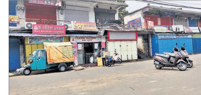
ଅନୁଗୋଳ ବଜାରରେ ଖୋଲାଥିବା ଏକ ଦୋକାନ।

ଓଡ଼ିଶା ସରକାରଙ୍କ ରାଜ୍ୟ ଓ ବିପର୍ଯ୍ୟୟ ପରିଚାଳନା ବିଭାଗ ପକ୍ଷରୁ ଜାରି ହୋଇଥିବା ନିର୍ଦ୍ଦେଶନାମାକୁ ଅନୁଗୋଳ ଜିଲ୍ଲା ପ୍ରଶାସନ ପକ୍ଷରୁ ପାଳନ କରାଯାଇଛି। ଲକ୍ଷ୍ମୀପୁର ପରଠାକୁ ଅତ୍ୟାବଶ୍ୟକ ସାମଗ୍ରୀ ଦୋକାନ ଖୋଲାବନ୍ଧୁଛି। ତେବେ କଟକଣାରେ ସାମାନ୍ୟ କୋହଳ କରାଯାଇଥିବାରୁ ଏବେ ବାର ଅନୁଯାୟୀ ବଜାରରେ ଥିବା ଅନ୍ୟ ଦୋକାନଗୁଡ଼ିକ ଖୋଲା ରହିବ। ପୂର୍ବରୁ ପନିପରିବା, ଫଳ, ଟେକରାଡି ସାମଗ୍ରୀ, କ୍ଷୀର, ମାଛ ଓ ମାଂସ ଦୋକାନ ଖୋଲି ରହୁଥିବା ବେଳେ ଆଗାମୀ ଦିନରେ ବହି, ହାତ୍ତଫୋନ୍, ଇଲେକ୍ଟ୍ରିକ୍ ଦୋକାନ ଆଦି ଖୋଲାଯିବ। ପୂର୍ବ ନିର୍ଦ୍ଧାରିତ ସମୟ ଯଥା ସକାଳ ୬ଟାରୁ ଅପରାହ୍ଣ ୧ଟା ପର୍ଯ୍ୟନ୍ତ ଲୋକେ ସାମାଜିକ ଦୂରତା ରଖି ଓ ମାଷ୍ଟ ପିନ୍ଧି ସାମଗ୍ରୀ ଜିଣାଜିଣି କରିପାରିବେ ବୋଲି ଜିଲ୍ଲାପାଳ ମନୋଜ