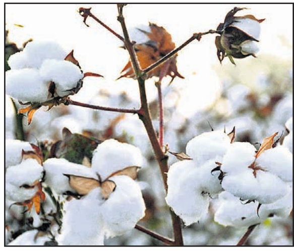
ଦେଖାଗଲେ ପ୍ରତି ଲିଟର ପାଣିରେ ୨ମିଲି ମିଥାଇଲ୍ ଅକ୍ସିଡେମିଟନ ମିଶାଇ ସଂଖ୍ୟାରେ ଚୁକ୍ତି ପାଟ ବେସ୍ ସିଞ୍ଚନ କରନ୍ତୁ।

କପା ଗଛ ଉଠିବାର ୬ ସପ୍ତାହ ହୋଇଯାଇଥିଲେ କୋଡ଼ାଖୁଆ କରି ଛୁଡ଼ା ଟେକି ଦିଅନ୍ତୁ। ଏହାପରେ ଗଛ ସିଧା ରହିବ ଓ ମୂଳରେ ପାଣିରେ ଜମିବ ନାହିଁ କି ଘାସ ମଧ୍ୟ ଅଧିକ ରହିବ ନାହିଁ। କୋଡ଼ାଖୁଆ ସାରି ଉନ୍ନତ କିସମରେ ଏକର ପ୍ରତି ୧୬କିଗ୍ରା ଯବକ୍ଷାରଜାନ ଏବଂ ହାଇଡ୍ରୋକ୍ସିକିସମରେ ଏକର ପ୍ରତି ୨୪କିଗ୍ରା ଯବକ୍ଷାରଜାନ ପ୍ରୟୋଗ କରନ୍ତୁ। ଗଛ ୪୫ଦିନର ହୋଇଯାଇଥିଲେ ସାତ୍ତେ ୪ଲିଟର ପାଣିରେ ୧ମିଲି ହିସାବରେ ପ୍ଲାନୋଫିକ୍ସି ସିଞ୍ଚନ କରନ୍ତୁ। ଜଳ ପୋକ, ପତ୍ରତୀର୍ଣ୍ଣ ପୋକ ଭଳି ଶୋଷକ ପୋକ ତଥା ଘୋଡ଼ା ପୋକ, ପତ୍ରମୋଡ଼ା ପୋକ ଏବଂ ସିଂଗୁଆ ପୋକର ଆକ୍ରମଣ ଏହି ସମୟରେ ଫସଲର ବିଶେଷ କ୍ଷତି କରିପାରନ୍ତି ନାହିଁ। ପତ୍ରପ୍ରତି ଚୁକ୍ତି ପୂର୍ଣ୍ଣାଙ୍ଗ ପତ୍ରତୀର୍ଣ୍ଣ ପୋକ ବା ୫୦ଟି ପତ୍ରରେ ୫୦-୧୦୦ଅର୍ଭକ ସଂଖ୍ୟାରେ ପ୍ରତି ଲିଟର ପାଣିରେ ୨ମିଲି ମିଥାଇଲ୍ ଅକ୍ସିଡେମିଟନ ମିଶାଇ ସଂଖ୍ୟାରେ ଚୁକ୍ତି ପାଟ ବେସ୍ ସିଞ୍ଚନ କରନ୍ତୁ।