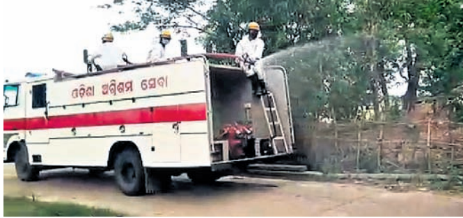
ଅଗ୍ନିଶମ ବିଭାଗ ପକ୍ଷରୁ ରାସ୍ତାଘାଟ ବିଶୁଦ୍ଧୀକରଣ କରାଯାଇଛି।

ବାଲେଶ୍ୱର ଜିଲ୍ଲା ନୀଳଗିରି ବ୍ଲକ୍ ବରହମ୍ପୁର ଥାନା ଅଞ୍ଚଳରେ ସୋମବାର ଏକ ୨ ବର୍ଷର ଶିଶୁକନ୍ୟା କରୋନା ଆକ୍ରାନ୍ତ ହୋଇଥିବା ଜଣାପଡ଼ିବା ପରେ ପ୍ରଶାସନ ପକ୍ଷରୁ ତତ୍ପରତା ପ୍ରକାଶ ପାଇଛି। ଚିହ୍ନଟ ହୋଇଥିବା ଶିଶୁକନ୍ୟାଙ୍କ ସଂସ୍ପର୍ଶରେ ଆସିଥିବା ଲୋକ ଏବଂ ପୂର୍ବରୁ ଚିକିତ୍ସା ଯୋଗାଇଥିବା ସ୍ୱାସ୍ଥ୍ୟକର୍ମୀଙ୍କୁ ଠାବ କରାଯାଇଛି। ମଙ୍ଗଳବାର ଜିଲ୍ଲା ସ୍ୱାସ୍ଥ୍ୟ ବିଭାଗ ପକ୍ଷରୁ ମଙ୍ଗଳବାର ଏକ ଚିଠି ବରହମ୍ପୁରରେ ପହଞ୍ଚି ବରହମ୍ପୁର ସ୍ୱାସ୍ଥ୍ୟକେନ୍ଦ୍ରର ଡାକ୍ତର ସୁରୋଜ କେନାକ ନେତୃତ୍ୱରେ ଅନ୍ୟ କର୍ମଚାରୀଙ୍କ ସହ ରୋଗୀଙ୍କ ସଂସ୍ପର୍ଶରେ ଆସିଥିବା