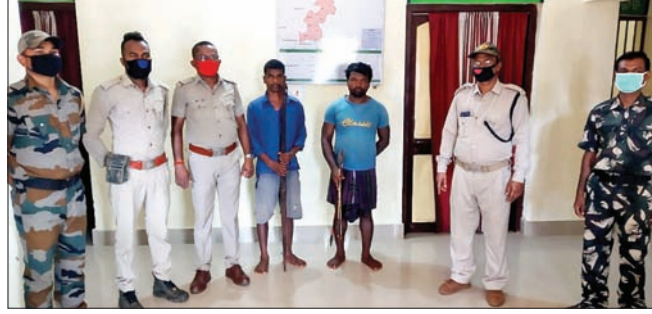
ବନ କର୍ମଚାରୀଙ୍କ ସହ ଗିରଫ ୨ ଶିକାରୀ

ନେତୃତ୍ଵରେ ଅନ୍ୟ କର୍ମଚାରୀମାନେ ଉକ୍ତ ରେଞ୍ଜି ଅଧୀନ କମ୍ପାର୍ଟମେଣ୍ଟ ସଞ୍ଜ-୫ ଅଞ୍ଚଳରେ ପାଟୋଲିଂ କରୁଥିଲେ । ରାତ୍ରି ପ୍ରାୟ ୧୦ଟା ସମୟରେ ଅଭିଯୁକ୍ତ ସୁସ୍ଥ ବିଭିନ୍ନ ଶିକାର ସରଞ୍ଜାମ ଧରି ଶିମିଳିପାଳ ଅଭୟାରଣ୍ୟ ମଧ୍ୟକୁ ସୁବେଶ କରିଥିବା ବେଳେ ବନ କର୍ମଚାରୀଙ୍କ ହାବୁଡ଼ରେ ପଡ଼ିଥିଲେ । ବନ କର୍ମଚାରୀମାନେ ସେମାନଙ୍କଠାରୁ ୨ଟି ଚର୍ଚ୍ଚ, ୨ଟି ଧଳ, ୧୦ଟି ତାର , ଗୋଟିଏ ଫାସ , ଗୋଟିଏ କରୁର ଓ ଗୋଟିଏ ବସ୍ତା ଜବତ କରିଛନ୍ତି ।