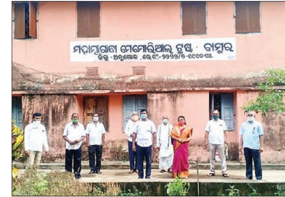
ସ୍ମୃତିସଭାରେ ଉପସ୍ଥିତ ବିଧାୟକଙ୍କ ସହ ଟ୍ରଷ୍ଟ କର୍ମକର୍ମୀମାନେ ।