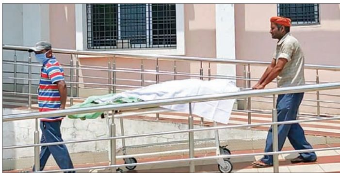
ମୃତ ମହିଳାଙ୍କୁ ଶ୍ମଶାନକୁ ନିଆଯାଉଛି ।

ଆଖି ବୁଜିଲେ ମହିଳାଙ୍କୁ ଶ୍ମଶାନକୁ ନିଆଯାଉଛି । ଝାରସୁଗୁଡ଼ା ଅପିଏ, ୫୫୫: ଝାରସୁଗୁଡ଼ା ଜିଲ୍ଲା ମୁଖ୍ୟ ଡାକ୍ତରଖାନାରେ ଚିକିତ୍ସାଧୀନ ଜଣେ ମହିଳାଙ୍କ ରକ୍ତ ଅଭାବରୁ ମୃତ୍ୟୁ ଘଟିଛି ।