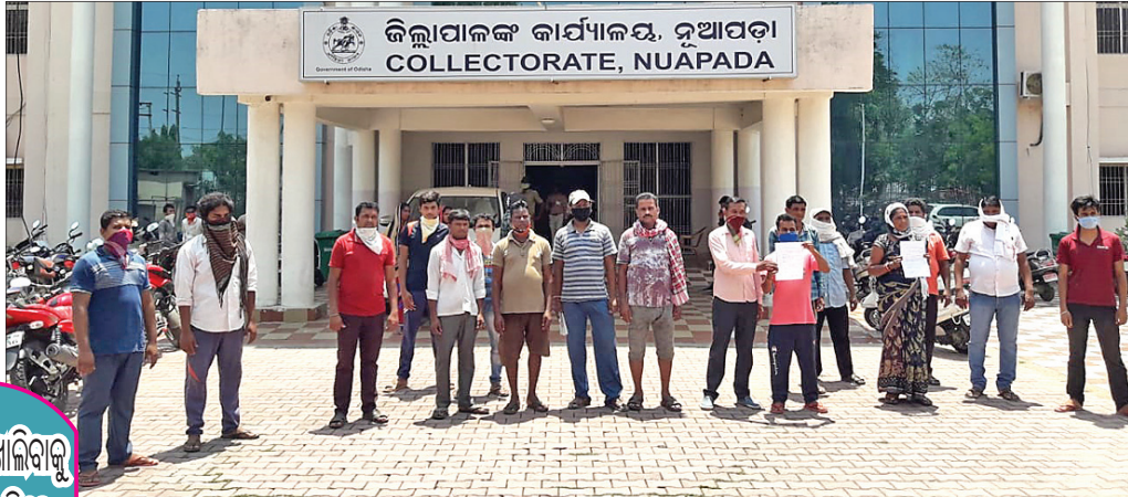
ଦୋକାନ ଖୋଲିବାକୁ ଅନୁମତି ମାଗିଲେ

କରୋନା ମହାମାରୀକୁ ସାମ୍ବଳି କରିବାକୁ ହେଲେ ସମସ୍ତଙ୍କୁ ଘରେ ରହିବାକୁ ହେବ। ଏଥିପାଇଁ ସରକାର ଘୋଷଣା କରିଥିବା ଲକଡାଉନକୁ ସମସ୍ତେ ଅନୁପାଳନ କରୁଥିବାବେଳେ ଏଥିରେ ନିମ୍ନ ମଧ୍ୟବିତ୍ତ, କ୍ଷୁଦ୍ର ବ୍ୟବସାୟୀ, ଉଠା ଦୋକାନୀମାନେ ସ୍ତବ୍ଧ ହୋଇଛନ୍ତି। ଲକଡାଉନ ୬ ସପ୍ତାହକୁ ଉର୍ଦ୍ଧ୍ୱ ସମୟ ବିତିଯାଇଥିବା ବେଳେ ନିମ୍ନ ଅନୁସାରେ ଅର୍ଦ୍ଧାଧିକ ଦୋକାନୀ ବନ୍ଦ ହୋଇଛନ୍ତି।