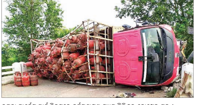
ରୁଞ୍ଜୁଡା ମାର୍ଗେଟ୍ ମାର୍ଗେଟ୍ ନିକଟରେ ବୁର୍ଲାଗାଗ୍ରାମ ଗ୍ୟାସ୍ ସିଲିଣ୍ଡର ବୋଧେଇ ଟ୍ରକ୍ ।

ବରଗଡ଼ ଜିଲ୍ଲା ଭେଡେନ ଥାନା ରୁଞ୍ଜୁଡା ଫାଟି ଅଧୀନସ୍ଥ ୫୪ ନମ୍ବର ରାଜ୍ୟ ରାଜପଥ ଉପରେ ସୋମବାର ବିଳମ୍ବିତ ରାତିରେ ଏକ ରଞ୍ଜନ ଗ୍ୟାସ୍ ସିଲିଣ୍ଡର ବୋଧେଇ ଟ୍ରକ୍ ଓଲଟି ପଡ଼ିଛି ।