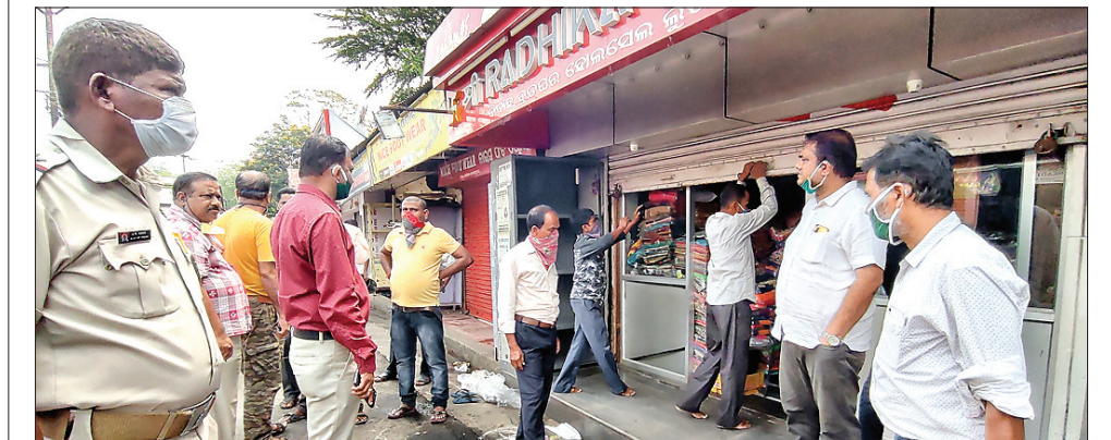
ପୋଲିସ୍ ଉପସ୍ଥିତିରେ ପୌର ପ୍ରଶାସନ ପକ୍ଷରୁ ଦୋକାନ ବନ୍ଦ କରାଯାଇଛି ।