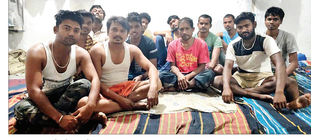
ମଧ୍ୟପ୍ରଦେଶରେ ଫସି ରହିଥିବା ଶ୍ରମିକମାନେ ।

ବରଗଡ଼ ଅଫିସ, ୫:୫ ଲକ୍ଷ୍ମୀ ଭାଗନ ଯୋଗୁ ପ୍ରତ୍ୟାସା ଶ୍ରମିକଙ୍କ ଦୁଃଖ ବଢ଼ିଯାଇଛି । କାମଧରା ବନ୍ଦ ହୋଇପଡ଼ି ଥିବାବେଳେ ସେମାନେ ନିକ ଘରକୁ ମଧ୍ୟ ଫେରି ପାରୁନାହାନ୍ତି । ବରଗଡ଼ ଏବଂ ସୁନ୍ଦରଗଡ଼ ଜିଲ୍ଲାର ୧୪ ଜଣ ଶ୍ରମିକ ଏକ ଭାବେ ମଧ୍ୟପ୍ରଦେଶରେ ଅଟକି ରହିଛନ୍ତି । ସେମାନଙ୍କୁ ଉଦ୍ଧାର କରିବା ସହିତ ଘରକୁ ପହଞ୍ଚାଇବା ଦିଗରେ ବିଚିତ୍ର ପଦକ୍ଷେପ ନେବା ପାଇଁ ଶ୍ରମିକମାନେ ଉଦ୍ଧେଷ୍ଟ ଓଡ଼ିଶା ଏବଂ ମଧ୍ୟପ୍ରଦେଶ ସରକାରଙ୍କୁ ନିବେଦନ କରିଛନ୍ତି ।