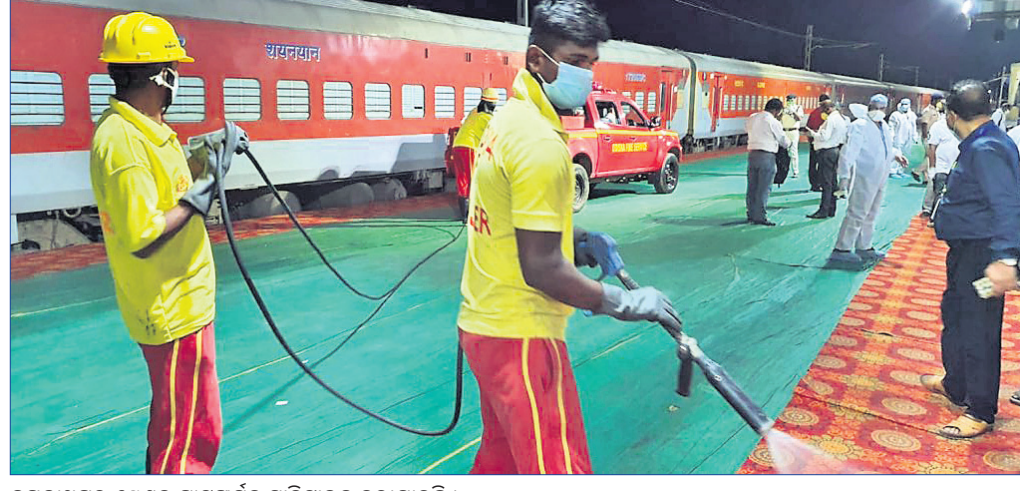
ଜଗନ୍ନାଥପୁର ସ୍ଟେଶନ ପ୍ଲାଟଫର୍ମକୁ ସାମାଜିକ କରାଯାଇଛି ।

ଗଞ୍ଜାମ ସମେତ ଓଡ଼ିଶାର ବିଭିନ୍ନ ଜିଲ୍ଲାକୁ ୩ ଦିନ ହେଲା ଟ୍ରେନ୍ ଯୋଗେ ସୁରତରୁ ପ୍ରବାସୀ ଓଡ଼ିଆ ଫେରିବାରେ ଲାଗିଛନ୍ତି । ଗଞ୍ଜାମ ଜିଲାର ଜଗନ୍ନାଥପୁର ଜଳସନ୍ତର ଟ୍ରେନ୍ ଲାଗିବା ପରେ ଲୋକ ଓହ୍ଲାଇଛନ୍ତି । ମଙ୍ଗଳବାର ତୃତୀୟ ଦିନରେ ଏଠାରେ ୩ଟି ଟ୍ରେନ୍ ଲାଗିଥିବା ବେଳେ ମୋଟ ୩,୫୩୧ ଜଣ ଗଞ୍ଜାମ ଜିଲ୍ଲାକୁ ଫେରିଛନ୍ତି । ସୁରତ ଛାଡିଥିବା ଆଉ ୩ଟି ଟ୍ରେନ୍ ବୁଧବାର ପହଞ୍ଚିବ ବୋଲି ସୂଚନା ମିଳିଛି । ସୁରତରୁ ଆସୁଥିବା ଏକ ଟ୍ରେନ୍ ମଙ୍ଗଳବାର ମଧ୍ୟାହ୍ନ ପ୍ରାୟ ୧୨ଟା ୧୦ ମିନିଟରେ ଜଗନ୍ନାଥପୁର ଜଳସନ୍ତରରେ ପହଞ୍ଚିଥିଲା । ସେଥିରେ ୬ ଜିଲାର ୧୨୧୬ ଜଣ ପ୍ରବାସୀ ଓଡ଼ିଆ ଆସିଥିବା ବେଳେ କେବଳ ଗଞ୍ଜାମ ଜିଲାର ୧୨୧୬ ଜଣ ଥିବା ଜଣାପଡିଛି । ସେହିପରି ଉକ୍ତ ଟ୍ରେନ୍ରେ ଖୋର୍ଦ୍ଧାର ୨୦, ପୁରୀର ୨୦, ନୟାଗଡ଼ର