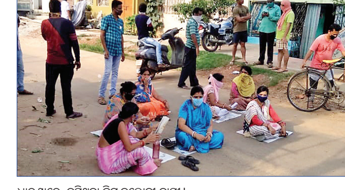
ଧାରଣାରେ ବସିଥିବା ବ୍ରିଟ କଲୋନୀ ବାସୀ।

ପରିବାର ଲକ୍ଷ୍ମୀନର ପୂର୍ବରୁ ପଶ୍ଚିମବଙ୍ଗ ଯାଇଥିଲେ। ସେଠାର ପ୍ରଶାସନିକ ଅନୁମତି ନେଇ ଏକ କାର୍ଯ୍ୟରେ ପରିବାର ମିଳିଛି। ଏପରିକି ଉକ୍ତ ପରିବାରକୁ ସରକାରୀ କ୍ୱାରାଣ୍ଟାଇନ ସେଣ୍ଟରକୁ ନେବା ଦାବିରେ ସ୍ଥାନୀୟ ଲୋକେ ରାସ୍ତାଚାରୀକୋ କରିଥିଲେ। ଖବରପାଇ ହେଉଛନ୍ତି ରାଜନଗର ଓ ପକାପୁଷ୍ପାଳ ଅଞ୍ଚଳର। ସେମାନେ ସେଠାରେ ଟେଲିଫି କାର୍ଯ୍ୟ କରନ୍ତି। ଏବେ ସେମାନଙ୍କୁ ନବରବଦୀ ରଖାଯାଇ ବିନା ପାରିଶ୍ରମିକରେ ବିଭିନ୍ନ କାର୍ଯ୍ୟରେ ନିୟୋଜିତ କରାଯାଉଛି। ଭୋକ ଉପାସରେ ରହି ସେମାନେ ଉଦ୍ଧାର ପାଇଁ ନିଜ ପରିବାର ଲୋକଙ୍କୁ କାନ୍ଦିକାନ୍ଦି ଜଣାଇଛନ୍ତି। ଏ ସମ୍ପର୍କରେ ମଙ୍ଗଳବାର ଦୈନିକ 'ଧରନ୍ତା'ରେ ଖବର ପ୍ରକାଶ ପାଇବା ପରେ ଭାଜପା ରାଷ୍ଟ୍ରୀୟ ଉପସଭାପତି ଦୈତ୍ୟଜିତ ପଣ୍ଡା କେରଳ ମୁଖ୍ୟମନ୍ତ୍ରୀଙ୍କୁ ପତ୍ର ଲେଖି ସହାୟତା ଲୋଡ଼ିଛନ୍ତି। ଉକ୍ତ ମହିଳା ଶ୍ରମିକଙ୍କୁ ଉଦ୍ଧାର କରି ସେମାନଙ୍କୁ ରହିବା, ଖାଇବା ବ୍ୟବସ୍ଥା ସହ ଓଡ଼ିଶା ଫେରାଇବାକୁ ନିବେଦନ କରିଛନ୍ତି।