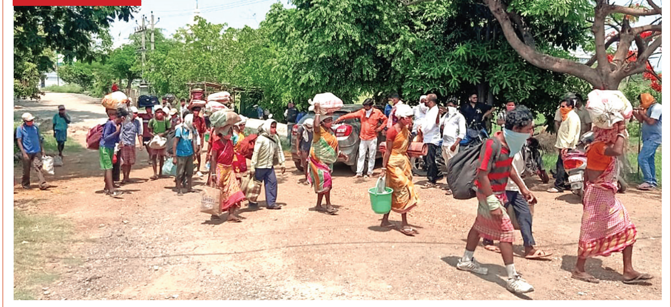
ହାଇଦ୍ରାବାଦରୁ ପଶ୍ଚିମବଙ୍ଗର ମାଲଦା ଅଭିଯୁକ୍ତ ଚାଲି ଚାଲି ଯାଉଥିବା ଶ୍ରମିକ ମଙ୍ଗଳବାର ସମ୍ବଲପୁର ଜିଲ୍ଲା ଧନକଉଡା ବ୍ଲକ୍ ନିକଟରେ ପହଞ୍ଚିଛନ୍ତି ।