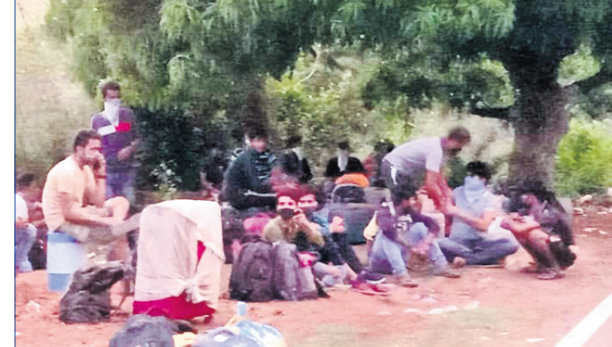
ସୁରଟରୁ ଫେରିଥିବା ପ୍ରବାସୀ ରାମେଶ୍ୱର ନିକଟରେ ଅଟକି ରହିଛନ୍ତି।

ରାମେଶ୍ୱର ଜଳରେ ବସରୁ ଓହ୍ଲାଇ ଚାଲି ଯାଉଥିଲେ ୨ ବସରେ ପ୍ରଶାସନ ପୁରୀ ପଠାଇଲା