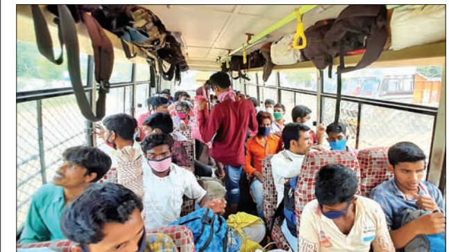
ଅନୁଗୋଳ ଜିଲ୍ଲାରେ ଅଟକିଥିବା ଶ୍ରମିକମାନଙ୍କୁ ଝାଡ଼ଖଣ୍ଡ ପଠାଯାଇଛି ।