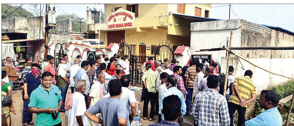
ଆର୍ମି କ୍ୟାଣ୍ଟିନ୍ ସମ୍ମୁଖରେ ଭିଡ଼ ।