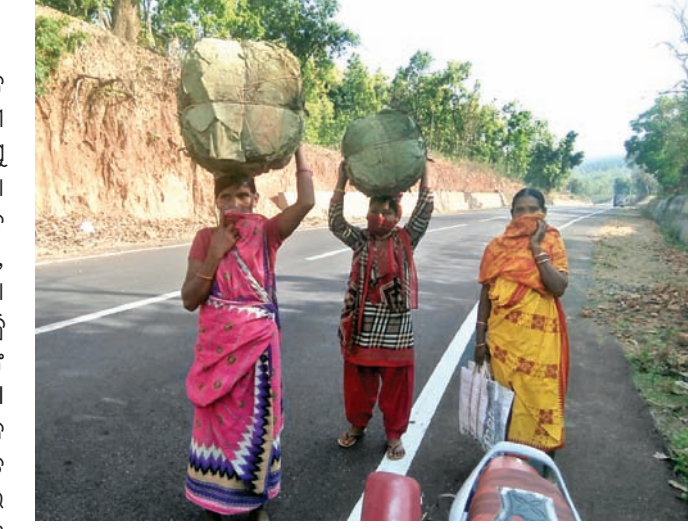
ଜଙ୍ଗଲଜାତ ବ୍ରହ୍ମ ମୁଣ୍ଡାଇ ମହିଳାମାନେ ଯାଉଛନ୍ତି।

ଜଙ୍ଗଲ ସାମାବର୍ତ୍ତୀ ଜନଜାତି ଗରିବ ପରିବାରର ମହିଳାମାନେ ଦିନ ମଜୁରୀ ଠାରୁ ଆରମ୍ଭ କରି ଜଙ୍ଗଲକୁ ଲାଠି ବନଜାତ ବ୍ରହ୍ମ ସଂଗ୍ରହ କରି ଜୀବିକା ନିର୍ବାହ କରିଥାନ୍ତି। ତେଣୁ ପ୍ରତିଦିନ ଜଙ୍ଗଲକୁ ଯାଇ ଜାଳେଣି କାଠ, ଶାଳପତ୍ର, ଶିଆଳିପତ୍ର ଆଣି ସହାକୁ ବିତା କରିବା ପରେ ଗାଡ଼ିରେ ସହରକୁ ନେଇ ବିକ୍ରି କରିଥାନ୍ତି। ମାତ୍ର ଲକ୍ଷ୍ମଣନ ଏମାନଙ୍କ ଜୀବନ ଜୀବିକା ଉପରେ ଦାଢ଼ ସାଧୁଛି। କାମଧାରୀ ବନ୍ଦ ହୋଇଯାଇଥିବା ବେଳେ ଗାଡ଼ି ଚଳାଚଳ ବନ୍ଦ ଯୋଗୁ ବନଜାତ ବ୍ରହ୍ମ ବିକ୍ରୟ ସହରକୁ ଯିବା ଯାଇ ପ୍ରାୟନାହାନ୍ତି। ବାଧ୍ୟ ହୋଇ ଖଣି ଓ ଶାଳପତ୍ର ବିତା ମୁଣ୍ଡାଇ ଚାଲିଗଲା ଯାଇ ସହରରେ ବ୍ୟବସାୟକୁ ବିକ୍ରିକରି ଟଙ୍କା ଧରି ଘରକୁ ଫେରୁଛନ୍ତି। କଳମାଳ ଜିଲାର ଖଲୁରିପଡ଼ା ବ୍ଲକର ବଣ ପାହାଡ଼ ଘେରା