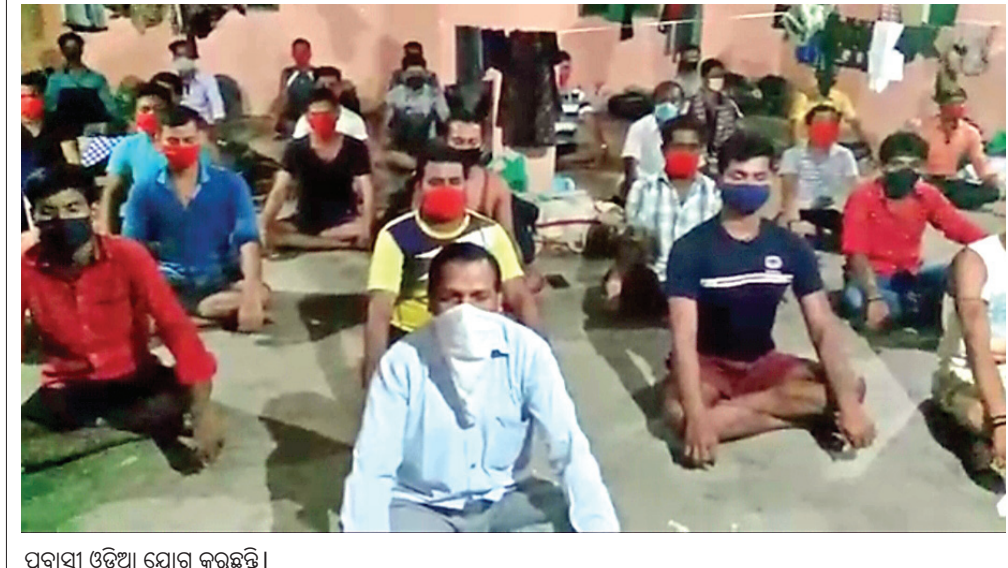
ପ୍ରବାସୀ ଓଡ଼ିଆ ଯୋଗ କରୁଛନ୍ତି ।

ପଶ୍ଚିମବଙ୍ଗରୁ ଫେରୁଥିବା ବେଳେ ସାମାନ୍ତରେ ଧରାପଡ଼ି ଭୋଗରାଇରେ କ୍ଵାରାଣ୍ଡାଇନ୍ରେ ରହିଥିଲେ । ସେ ସଂକ୍ରମିତ ଟିକ୍ସ ହୋଇଥିଲେ । ଖଜର ରୁକ୍ ଚରିଣା ପଞ୍ଚାୟତର ଜଣେ ୩୪ ବର୍ଷୀୟ ବ୍ୟକ୍ତି ପଶ୍ଚିମବଙ୍ଗରୁ ଫେରି କ୍ଵାରାଣ୍ଡାଇନ୍ରେ ଥିବା ବେଳେ ଟିକ୍ସ ହୋଇଥିଲେ । ପୁଣି ୩ଜଣ ପଶ୍ଚିମବଙ୍ଗ ଫେରନ୍ତା ଟିକ୍ସ ହୋଇ ପରେ ଜିଲ୍ଲାରେ ପରିସ୍ଥିତି ଗଣନା ହୋଇଛି । ଅନ୍ୟପକ୍ଷରେ ଜିଲ୍ଲାରେ ପ୍ରଥମ କରୋନା ସଂକ୍ରମିତ ନେଲିଆବାଗର ଜଣେ ୫୮ ବର୍ଷୀୟ ବ୍ୟକ୍ତି ଟିକ୍ସ ହେବା ପରେ ଉକ୍ତ ଅଞ୍ଚଳକୁ ଗତ ଏପ୍ରିଲ ୧୯ ତାରିଖରୁ ୨୬ ତାରିଖ ପର୍ଯ୍ୟନ୍ତ ଆବଶ୍ୟକ ଭାବେ ଘୋଷଣା କରାଯାଇଥିଲା । ପରେ ଉକ୍ତ ଅଞ୍ଚଳରେ ଲାଗାତାର ୨ଜଣ ସଂକ୍ରମିତ ଟିକ୍ସ ହେବା ଯୋଗୁ ଆବଶ୍ୟକୀୟ ସ୍ଥାନୀୟ ପ୍ରଶାସନ ସେମାନଙ୍କୁ ଗ୍ରାମରେ ପହଞ୍ଚି କୋଭିଡ୍-୧୯ ହସ୍ପିଟାଲକୁ ନେବା ପାଇଁ ପ୍ରସ୍ତୁତ ଆରମ୍ଭ କରିଛି । ପଶ୍ଚିମବଙ୍ଗରୁ ଫେରିଥିବା କୋଭିଡ୍-୧୯ କରୋନା ଭୁଟାଣୁ ଟିକ୍ସ ହେବା ପରେ ସେମାନଙ୍କ ସଂଖ୍ୟା ଦିନକୁ ଦିନ ବଢ଼ିବାରେ ଲାଗିଛି । ଗତ କିଛିଦିନ ତଳେ ସୋର ମ୍ୟୁନିସିପାଲିଟି ଅଞ୍ଚଳରୁ ୨ଜଣ ଏବଂ ଖଜରା ରୁକ୍ ଅନ୍ତରା ପଞ୍ଚାୟତ କନ୍ଦୁ ଗ୍ରାମରୁ ଜଣେ ସଂକ୍ରମିତ ହୋଇଥିଲେ । ଏଥିରୁ ଜିଲାର ପ୍ରଥମ କୋଲକାତା ଲିଙ୍କ୍ ଥିବା ଜଣାପଡିଥିଲା । ପରେ ବାହାନଗା ରୁକ୍ ବିଷ୍ଣୁପୁର ଅଞ୍ଚଳରେ ଜଣେ ୩୨ ବର୍ଷୀୟ ଏବଂ ସିମୁଲିଆ ଅଞ୍ଚଳର ଜଣେ ଲୋକ