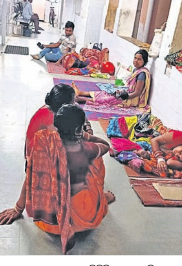
ପ୍ରସୂତାମାନେ ବାରଣ୍ଡାରେ ଚିକିତ୍ସିତ ହେଉଛନ୍ତି ।