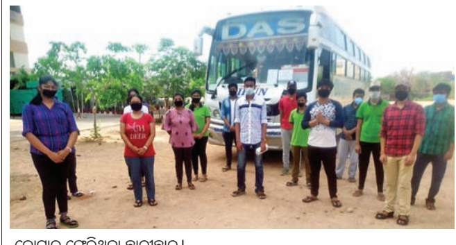
କୋଟାରୁ ଫେରିଲେ ୧୭ ଛାତ୍ରାଛାତ୍ରୀ

ସକାଳ ଜଳଖିଆରେ ମତର ଚରକା କିମ୍ବା ଚରକା ସହ ପୁରୀ, ଭୂଇଁ ଉପମା ଓ ଚୁଡ଼ା, ଦହି, ଚୁଡ଼ ଏବଂ ସନ୍ଧ୍ୟା ଜଳଖିଆରେ ଚା ସହ ଚୁଣି ବିଷ୍ଣୁ, ଆରିଷା ପିଠା, ସିଙ୍ଗୁ ଉପଲବ୍ଧ ଅନୁଯାୟୀ ଦେବା ପାଇଁ ବ୍ୟବସ୍ଥା ରହିଛି। ଶିଶୁମାନଙ୍କ ପାଇଁ ମଧ୍ୟ ସ୍ୱଚ୍ଛ ଖାଦ୍ୟ ବ୍ୟବସ୍ଥା କରାଯାଇଥିବା ଜିଲ୍ଲାପାଳ ଚୁକ୍ତିଚର୍ ମାଧ୍ୟମରେ ସୂଚନା ଦେଇଛନ୍ତି।