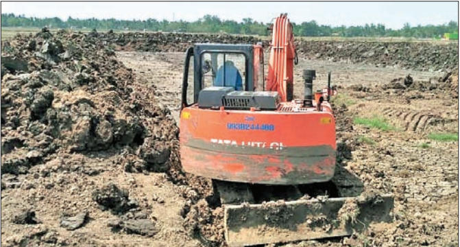
ପେଟଛେଲାଠାରେ ନିର୍ମାଣାଧୀନ ଚିଲୁଡ଼ି ଘେରି।

କେନ୍ଦ୍ରାପଡ଼ା ଅଫିସ, ୭।୫ କରୋନା ଭୂତାଣୁ ସଂକ୍ରମଣ ରୋକିବା ପାଇଁ ଦେଶରେ ଗତ ମାର୍ଚ୍ଚ ମାସରୁ ତାଲାବନ୍ଦ କାରି ରହିଛି। କେନ୍ଦ୍ରାପଡ଼ା ଜିଲ୍ଲାରେ ଏହାର ସୁଯୋଗ ନେଉଛନ୍ତି କରୋନା ଦେଇଛି ସୁଯୋଗ