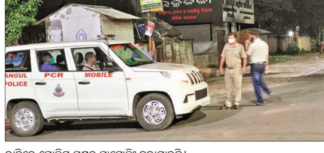
ରାତିରେ ପୋଲିସ୍ ପକ୍ଷରୁ ପାଟ୍ରୋଲିଂ କରାଯାଉଛି।