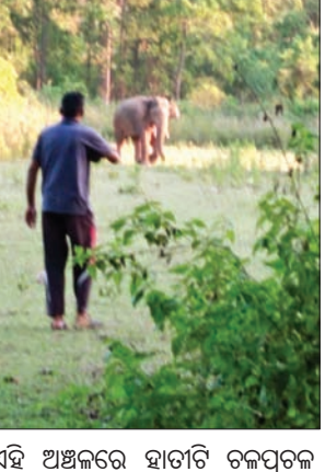
ଏହି ଅଞ୍ଚଳରେ ହାତୀଟି ଚଳପ୍ରଚଳ କରୁଛି। ଖବରପାଇ ବନବିଭାଗ କର୍ମଚାରୀମାନେ ପହଞ୍ଚି ପୁଟଗାଡିଆ ଜଙ୍ଗଲକୁ ଘଉଡାଇବା ସହ ଗତିବିଧି ଉପରେ ନଜର ରଖିଛନ୍ତି।

ଅନୁଗୋଳ ଜିଲା ଛେଡ଼ିପଦା ଓ ଜରପଡା ବନାଞ୍ଚଳ ସାମାନ୍ତରେ ଥିବା କୋରଡା, ପୁଟଗାଡିଆ ଗ୍ରାମ ମଧ୍ୟରେ ଗୁରୁବାର ଏକ ନରହତ୍ୟା ଦନ୍ତା ବୁଲୁଥିବା ଦେଖିବାକୁ ମିଳିଛି। ଏଥିପାଇଁ ଅଞ୍ଚଳବାସୀ ଆତଙ୍କିତ ହୋଇପଡିଛନ୍ତି। ଅନେକ ଲୋକଙ୍କ ଜୀବନ ନେଇ ସାରିଥିବା ଉକ୍ତ ଦନ୍ତା ଛେଡ଼ିପଦା-ଜରପଡା-ରାସ୍ତାର ପୁଟଗାଡିଆ ଓ କୋରଡା-କୋଶଳା ରାସ୍ତାର କୋରଡା ଗ୍ରାମ ମୁଣ୍ଡରେ ବହୁସମୟ ଧରି ବୁଲୁବୁଲି କରିଥିଲା। ଫଳରେ ଉକ୍ତ ରାସ୍ତାରେ ବହୁ ସଂଖ୍ୟାରେ ଯାନବାହନ ଅଟକି ରହିଥିଲା। ପ୍ରାୟ ୪/୫ଦିନ ହେବ