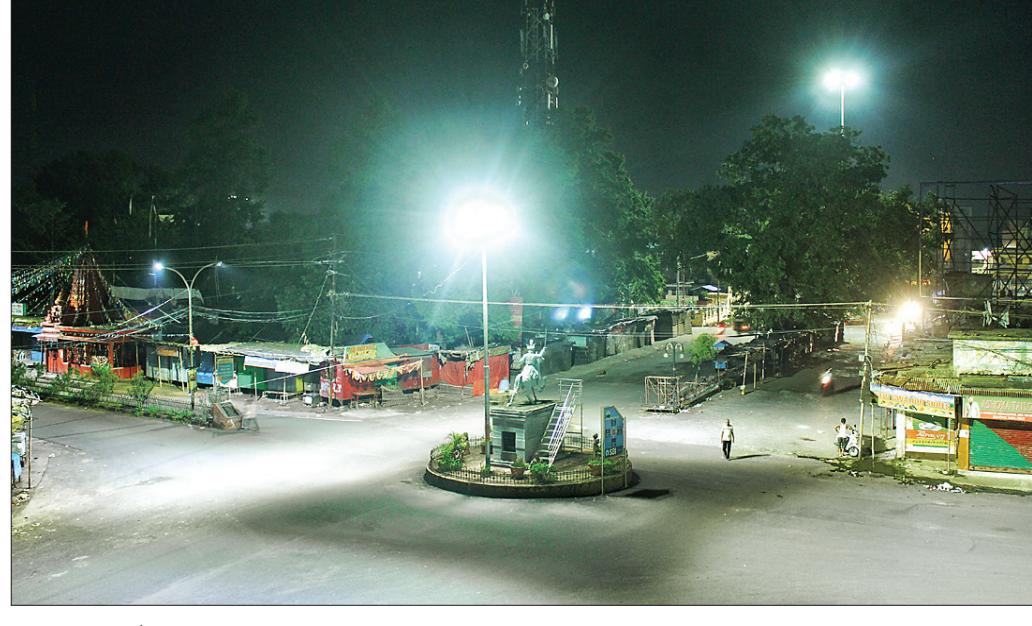
୧୨ ଘଣ୍ଟା କର୍ପ୍ୟୁ ଯୋଗୁ ସମ୍ପା ୨ଟା ପରେ ରାଜା ଛକ ଜନଗହ୍ଣ ହୋଇପଡ଼ିଛି।