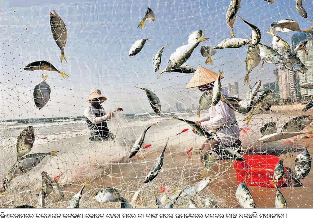
ଭିଏତନାମରେ ଲକ୍ଷ୍ମଣୀ କୋଷ୍ଠକର ହେବା ପରେ ତା ନାହିଁ ସହର ଉପକୂଳରେ ସମୁଦ୍ର ମାଛ ଧରୁଛନ୍ତି ମତ୍ୟଜୀବୀ।