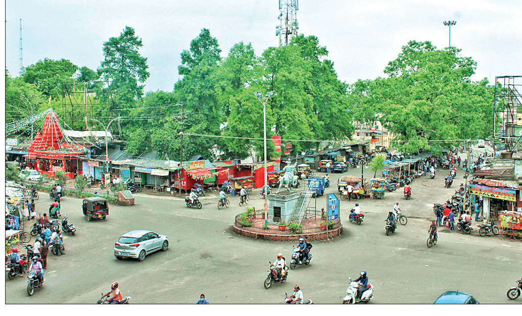
ଅନୁଗୋଳ ରାଜା ଛକଠାରେ ଗୁରୁବାର ଦିନ ସମୟରେ ଲୋକଙ୍କ ଗହଳି।