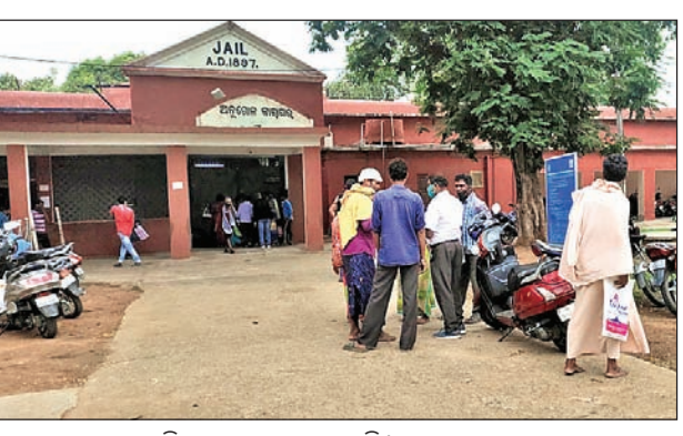
ଅନୁଗୋଳ ଜେଲ ପରିସରରେ ଲୋକଙ୍କ ଗହଳି।

ବୁଦ୍ଧି ପାଉଥିବା କରୋନା ସଂକ୍ରମଣକୁ ଦୃଷ୍ଟିରେ ରଖି ରାଜ୍ୟ ଜେଲ ବିଭାଗ ନିର୍ଦ୍ଦେଶକଙ୍କ ପକ୍ଷରୁ ଜାରି କରାଯାଇଥିବା କଟକଣାକୁ ଅନୁଗୋଳ ଜେଲରେ କଡ଼ାକଡ଼ି ପାଳନ କରାଯାଉ ନ ଥିବା ଅଭିଯୋଗ ହେଉଛି। ସ୍ଥାନୀୟ କର୍ତ୍ତୃପକ୍ଷଙ୍କ ଉଦାହରଣତାର ସୁଯୋଗ ନେଇ କିଛିଦିନ ହେଲା ହଠାତ୍ ଜେଲ ପରିସରରେ ସମସ୍ତ ନାଟି ନିୟମ ଯେପରି କୋହଳ ହୋଇଯାଇଥିବା ଚର୍ଚ୍ଚା ହେଉଛି। ଫଳରେ ଅନୁଗୋଳ କାରାଗାର ସମ୍ମୁଖରେ ଗହଳି ବହୁଥିବା ବେଳେ ବାହାର ଖାଦ୍ୟ ମଧ୍ୟ ଭିତରକୁ ଯାଉଥିବା ଦେଖାଯାଉଛି। ଅନୁଗୋଳର ଜଣେ ମଦ ବ୍ୟବସାୟୀଙ୍କୁ ପୋଲିସ୍ ଗିରଫ କରି ଜେଲ ପଠାଇବା ପରେ କଟକଣା ଏପରି ଡିଲା ପଡ଼ିଯାଇଥିବା କୁହାଯାଉଛି।