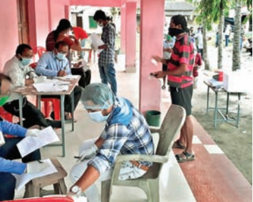
୫୦ଜଣଙ୍କ ସ୍ଵାବ ନମୁନା ପଠାଯାଇଛି।