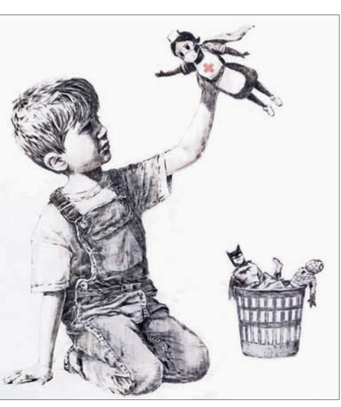
ପର୍ଯ୍ୟନ୍ତ ରହିବ ଏବଂ ତା'ପରେ ସେ ତାଙ୍କର ସମସ୍ତ କରୋନା ପେଣ୍ଠକୁ ନିଲାମ କରିବେ ବୋଲି କହିଛନ୍ତି।

ନୂଆଦିଲ୍ଲୀ: କରୋନା ରୋଗୀଙ୍କୁ ଚିକିତ୍ସା କରୁଥିବା ନର୍ସ ବି ସୁପର ହିରୋ। ନିଜର କଳା ମାଧ୍ୟମରେ ସାମ୍ବନ୍ଧକର୍ମୀମାନଙ୍କୁ ଏଭଳି ସମ୍ମାନ ଜଣାଇଛନ୍ତି ଲକ୍ଷ୍ମଣ ଷ୍ଟିଭ୍ ଆର୍ଟିଷ୍ଟ ବାଙ୍କସି। ତାଙ୍କର ଏହି ପେଣ୍ଠ ଏବେ ଲକ୍ଷ୍ମଣ ସାଉଥାସ୍‌ଟର୍ ମ୍ୟୁଜିକ୍‌ସିଟି ହସ୍ପିଟାଲରେ ଅନାବରଣ କରାଯାଇଛି। ବାଙ୍କସିଙ୍କ ପେଣ୍ଠ ଏତେ ପ୍ରଭାବଶାଳୀ ହୋଇଛି ଯେ, ତାହା ଖୁବ୍ କମ୍‌ଦିନରେ ଲୋକଙ୍କ ମନକୁ ଛୁଇଁପାରିଛି। ଏହି ପେଣ୍ଠକୁ ବାଙ୍କସି ତାଙ୍କ ଲକ୍ଷ୍ମଣଗ୍ରାମ ପୋଷ୍ଟରେ ଗେମ୍ ଚେଞ୍ଜର ନାଁରେ ପୋଷ୍ଟ କରିଛନ୍ତି। ଏଭଳି ଏକ ସୁନ୍ଦର ପେଣ୍ଠ ମାଧ୍ୟମରେ ତାତ୍ପର୍ୟାନ୍ତର ସମସ୍ତ ସାମ୍ବନ୍ଧକର୍ମୀଙ୍କୁ ସମ୍ମାନ ପ୍ରଦାନ କରାଯାଇପାରିଛି ବୋଲି ତାତ୍ପର୍ୟାନ୍ତର ପକ୍ଷରୁ କୁହାଯାଇଛି। ଚିତ୍ରରେ ଜଣେ ବାଙ୍କ ସୁପର ହିରୋ ଓ ସ୍ତ୍ରୀଲିଙ୍ଗମାନଙ୍କ ଭଳି ନର୍ସଙ୍କ ସହିତ ବି ଖେଳିବାକୁ ଚାହୁଁଛି। ବାଙ୍କସିଙ୍କ ଏହି ପ୍ରତୀକାତ୍ମକ ଚିତ୍ରଟି କରୋନା ସମୟରେ ସାମ୍ବନ୍ଧକର୍ମୀଙ୍କ ପ୍ରତି ଉପହାସକୁ ତେବେ କରୋନା ପାଇଁ ତାଙ୍କର ଏହି ପେଣ୍ଠଟି ପ୍ରଥମ କଳା ନୁହେଁ ଏହା ପୂର୍ବରୁ ବି ସେ ଏଭଳି ଅନେକ ପେଣ୍ଠ ସୋସିଆଲ ମିଡିଆରେ ପୋଷ୍ଟ କରିଛନ୍ତି। ତେବେ ତାଙ୍କର ଏହି ନୂଆ ପେଣ୍ଠଟି ଏବେ ତାତ୍ପର୍ୟାନ୍ତର ଲକ୍ଷ୍ମଣ ଷ୍ଟିଭ୍ ଉଠିବା