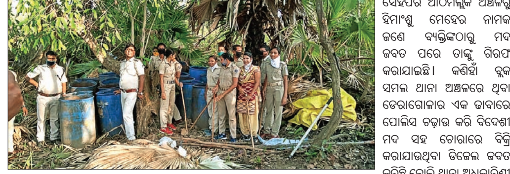
ଜଙ୍ଗଲରେ ଚାଲିଥିବା ଭାଟି ଉପରେ ପୋଲିସ୍ ଚଢ଼ାଉ କରୁଛି।