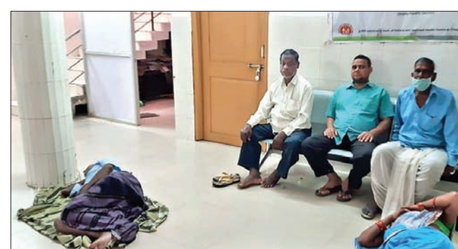
ସେବା ଅପେକ୍ଷାରେ ରୋଗୀ।