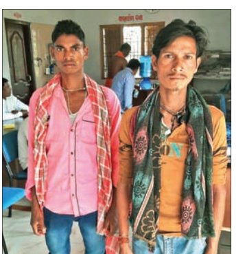
ଗିରଫ ୨ ଅଭିଯୁକ୍ତ।