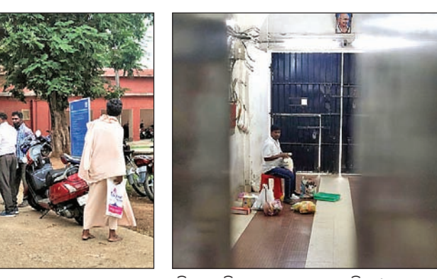
ଭିତରକୁ ନିଆଯାଇଥିବା ଖାଦ୍ୟ ପୁଡ଼ିଆ।

ଦେବାକୁ କୁହାଯାଇଛି। ଆବଶ୍ୟକ ପଡ଼ିଲେ କେବଳ ଭିଡ଼ି ଓ କନଫରେନ୍ସ କରିଆରେ ପରିବାର ଲୋକଙ୍କୁ କଥା ପରିସରକୁ ବାହାର ଖାଦ୍ୟ ଓ ବାହାର ଲୋକଙ୍କ ଯିବାକୁ ବାରଣ କରାଯାଇଛି। ଏପରିକି କ୍ୟାଦାକ୍ ସହ ସିଧାସଳଖ କାହାର ସାକ୍ଷାତକୁ ମଧ୍ୟ ଅନୁମତି ନ