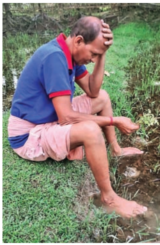
ପୁଣ୍ୟରେ ହାତ ଦେଇ ବସିଛନ୍ତି ମୂଳ ଚାଷୀ।