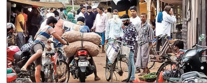
ତାରିଖା ଛକ ହାଟରେ ଲୋକଙ୍କ ଭିଡ଼। ବସ୍ତୁଲପ୍ତ, ୭।୫ (ଡି.ଏନ.ଏ.)

ରସୁଲପୁର ବ୍ଲକରେ କରୋନା ସଂକ୍ରମିତଙ୍କ ସଂଖ୍ୟା ବଢ଼ିବାରେ ଲାଗିଛି। ଗୁରୁବାର ପୁଞ୍ଜ ୪ ସଂକ୍ରମିତଙ୍କୁ ଚିକିତ୍ସା କରାଯାଇଥିବା ବେଳେ ଅନେକ ସମ୍ପର୍କୀୟ ଚିକିତ୍ସା ଆସିବାକୁ ବାଧି ଅଛି। ଯାଜପୁର ଜିଲ୍ଲାର ପ୍ରଥମ କରୋନା ପଜିଟିଭ୍ ବ୍ରହ୍ମବରଦାକୁ ଚିକିତ୍ସା ହୋଇଥିବା ବେଳେ ସେ ପୁଣ୍ଡ ହୋଇ ଘରକୁ ଫେରିଛନ୍ତି। ତେବେ ଉକ୍ତ ଅଞ୍ଚଳରୁ କରୋନା ସଂକ୍ରମିତ ହେବା ପରେ ପ୍ରଶାସନ ପକ୍ଷରୁ ବ୍ରହ୍ମବରଦା ଅଞ୍ଚଳକୁ ସିଲ୍ କରିଦିଆଯିବା ସହ ଏଠାରେ ବସୁଥିବା ସାମ୍ବାହିକ ହାଟକୁ ପ୍ରଶାସନ ଅନିୟନ୍ତ୍ରଣ କରି ପର୍ଯ୍ୟନ୍ତ ବନ୍ଦ କରିଦିଆଯାଇଥିଲା। ହେଲେ ଏବେ ସ୍ଥାନୀୟ ଲୋକେ ଲକ୍ଷ୍ମୀଭଙ୍ଗ କଟକଣା ନ ମାନି ବଜାର ଘାଟରେ ବୁଲୁଥିବା ଦେଖାଯାଇଛି। ତାରିଖା ଛକରେ ସେଠାକୁ ବସୁଥିବା ପରିବାହୀତର ଲୋକମାନେ ସାମାଜିକ ଦୂରତା ରକ୍ଷା କରୁନ ଥିବା ବେଳେ ଅଧିକାଂଶ ମୁହଁରେ ମାସ୍କ ପିନ୍ଧି ନ ଥିବା ଦେଖାଯାଇଛି। ଅନେକ ଲୋକ ହାଟ ଭିତରେ ବାଜକରେ ବୁଲିବା ସହ ଜନଗହଳ ସ୍ଥାନ, ରାସ୍ତାକଡ଼ରେ ଗୁଡ଼ାଖା, ପାନ ଛେପ ପକାଇ ଲକ୍ଷ୍ମୀଭଙ୍ଗ ନିୟମ ଦେବାକୁ ଉପେକ୍ଷା ଗୋଷ୍ଠୀ ସ୍ଵାସ୍ଥ୍ୟକେନ୍ଦ୍ରର