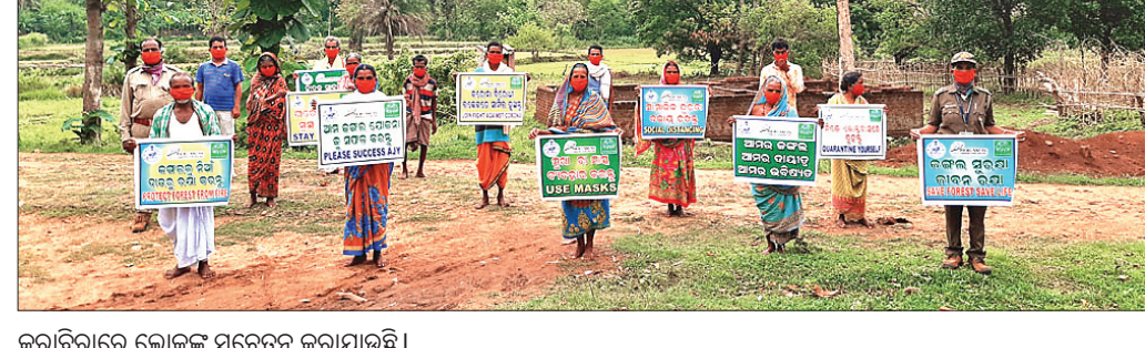
କରାବିରାରେ ଲୋକଙ୍କୁ ସଚେତନ କରାଯାଉଛି।

ଅନୁଗୋଳ ଅଫିସ, ୨୫ ଅନୁଗୋଳ ଜିଲାର ଉପାନ୍ତ ଗ୍ରାମ କରାବିରାରେ କରୋନା ଏବଂ ଏହାର ପ୍ରତିକାର ପାଇଁ ସଚେତନତା କର୍ମଶାଳା ଅନୁଷ୍ଠିତ ହୋଇଯାଇଛି। ପ୍ରକୃତ ପରିବେଶ ଲକ୍ଷ୍ୟଭିନ୍ନ କଟକଣା ଉଲ୍ଲୁଘିନ କରିଥିବା ୯୪୫ ଜଣଙ୍କ ନାମରେ ୨୮୮ ମାମଲା କରାଯାଇ ୩୫୪ ମୋଟର ସାଇକେଲ ଜବତ କରାଯାଇଛି।