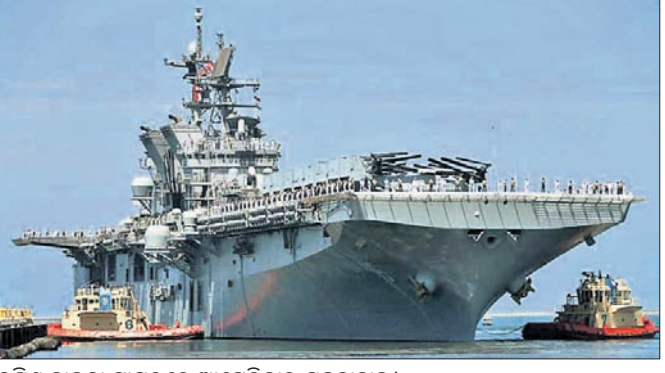
ଦକ୍ଷିଣ ଚାଇନା ସାଗରରେ ଆମେରିକାର ସୁବକାହାଜ।

ନୂଆଦିଲ୍ଲୀ, ୭୫: ଦକ୍ଷିଣ ଚାଇନା ସାଗର (ଏସିଏସିଏସ)ରେ ଏପ୍ରିଲ ମାସ ଉତ୍ତରୀୟ ଋତୁରେ ଚାଇନା ନିଜ ଏକଚାଟିଆ ଆଧିପତ୍ୟ ଜାହିର କରୁଥିବାବେଳେ ସାବିତ୍ରୀପୁର ପ୍ରଦେଶକୁ ନେଇ ଛଦି ହୋଇଯାଇଥିବା ଛୋଟ ଛୋଟ ଦେଶଗୁଡ଼ିକ ଏହା ସହ ମୁହାଁମୁହିଁହୋଇଛନ୍ତି। ପ୍ରଶାନ୍ତ ମହାସାଗରର ପଶ୍ଚିମାଞ୍ଚଳରେ ଥିବା ଏହି ସାଗର ପାରମ୍ପରିକ ମାଛଧରାକୁ ନେଇ ମଧ୍ୟ ବିବାଦୀୟ ହୋଇଯାଇଛି। ଏସିଏସିଏସ ଭିତରକୁ କ୍ଷେତ୍ରୀୟ ବହିର୍ଭୂତ ଶକ୍ତି ଆମେରିକା ଓ ଏହାର ସାମରିକ ସହଯୋଗୀମାନେ ମଧ୍ୟ ଚାଣି ହୋଇଯାଇଛନ୍ତି। ଚାଇନା ସହ ବିବାଦରେ ଭିଏତନାମ, ମାଲେସିଆ, ଇଣ୍ଡୋନେସିଆ ଓ ଫିଲିପାଇନ୍ସ ଭଳି ଭଲ ଭାବେ ଛଦି ହୋଇଯାଇଛନ୍ତି। ଏପ୍ରିଲ ଆରମ୍ଭରେ ଚାଇନାର ଏକ କୋଷ୍ଠ ଗାଡ଼ି ଜାହାଜ ଭିଏତନାମର ପାରାସେଲ ଆଇଲାଣ୍ଡସ୍ ଉପକୂଳରେ ଭୁବଲଭେଇଥିଲା। ସେତେବେଳେ ବେଙ୍ଗ ବିପକ୍ଷରେ ଭିଏତନାମକୁ ସମର୍ଥନ କରିଥିଲା ଫିଲିପାଇନ୍ସ। ହାନୋଇ ପାଇଁ ମାନିଲା ପୂର୍ବରୁ କେବେ ଦ୍ୱିପାର୍ଶ୍ୱିକ ସମ୍ପର୍କ ଆକରେ ଏପରି ସହଯୋଗ କରି ନ ଥିଲା। ମହାମାରି କରୋନାର ଭୟାବହତା ଓ କ୍ଷେତ୍ରୀୟ ରାଷ୍ଟ୍ରଗୁଡ଼ିକ ମଧ୍ୟରେ ପାରମ୍ପରିକ ସହଯୋଗର ଆବଶ୍ୟକତା ନେଇ ଅନ୍ତର୍ଜାତୀୟ ସମୁଦାୟ ଧାରେ ଧାରେ