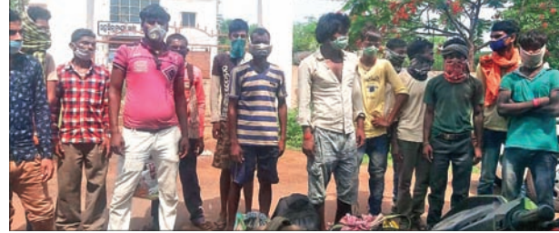
ବାହାର ରାଜ୍ୟକୁ ଚାଲି ଚାଲି ଯାଉଥିବା ଶ୍ରମିକ।

କରୋନା ଯୋଗୁ ବାହାର ରାଜ୍ୟରେ ଫସି ରହିଥିବା ଶ୍ରମିକମାନଙ୍କୁ ଫେରାଇ ଆଣିବାକୁ ରାଜ୍ୟ ସରକାର ଅନୁମତି ଦେଇଛନ୍ତି। ଏହାପରେ ଗଞ୍ଜାମ ଜିଲ୍ଲାରେ ଦିନକରେ ୨୪୭ ଜଣ ସୁରତ ଫେରାଇ ଶ୍ରମିକଙ୍କୁ କରୋନା ସଂକ୍ରମଣ ଥିବା ଚିହ୍ନଟ ହେବାପରେ ଚିକିତ୍ସା ଦିଆଯାଇଛି। ଏହି କ୍ରମରେ ଗୁରୁବାର ଦୁଃଖୀ ୨୨୦ ଜଣ ଶ୍ରମିକ ଦେଶର ବିଭିନ୍ନ ରାଜ୍ୟକୁ ଯାଜପୁର ଜିଲ୍ଲାକୁ ଫେରିଥିବା ଜିଲ୍ଲା ସୁରତା ଓ ଲୋକ ସମ୍ପର୍କ ବିଭାଗରୁ ମିଳିଥିବା ତଥ୍ୟରୁ ଜଣାପଡ଼ିଛି। ସେମାନଙ୍କ ମଧ୍ୟରେ ଗୁରୁବାର ସୁରତରୁ ସର୍ବାଧିକ ୨୭୭ ଶ୍ରମିକ ରହିଛନ୍ତି। ଏଥିରେ ଯାଜପୁର ବ୍ଲକର ସର୍ବାଧିକ ୭୭ ଜଣ। ଏହାବାଦ ତାମିଲନାଡୁର ଜଣେ, ତେଲଙ୍ଗାନାରୁ ୬୯, କର୍ଣ୍ଣଟକରୁ ୯୨, ପଶ୍ଚିମବଙ୍ଗରୁ ୫୬, ମହାରାଷ୍ଟ୍ରରୁ ୨, ଆନ୍ଧ୍ରପ୍ରଦେଶରୁ ୨୦, କେରଳରୁ ୩୬, ଦିଲ୍ଲୀରୁ ୨, ଉତ୍ତରପ୍ରଦେଶରୁ ୧୪, ଝାରଖଣ୍ଡରୁ ୧୬, ଛତିଶଗଡ଼ରୁ ୧୫, ରାଜସ୍ଥାନରୁ ୧୬, ମଧ୍ୟପ୍ରଦେଶରୁ ୧୪, ବିହାରରୁ ୩ ଜଣ ଶ୍ରମିକ ଯାଜପୁର ଜିଲ୍ଲାକୁ ପଞ୍ଜୀକୃତ ହୋଇ ଫେରିଛନ୍ତି। ତେବେ ପଶ୍ଚିମବଙ୍ଗରୁ ଅଣାଯାଇଥିବା ପ୍ରାୟ ୭୦୦ରୁ ଊର୍ଦ୍ଧ୍ୱ ଶ୍ରମିକ ଜିଲ୍ଲାକୁ ଆସିଥିବା ପୂର୍ବରୁ ଅନୁମତି କରାଯାଇଛି। ଜିଲ୍ଲାର ୧୦୦୦ରୁ ଏଯାବତ୍ ୬୦୦ରୁ ୫୫୫ ଜଣ କରୋନା ସଂକ୍ରମିତ ଚିହ୍ନଟ ହୋଇଛନ୍ତି। ସେଥିରୁ ୫୪ ଜଣ ପଶ୍ଚିମବଙ୍ଗ ଫେରାଇ। ଏଭଳିସ୍ଥିତିରେ ଜିଲ୍ଲାରେ କରୋନା ସଂକ୍ରମଣ ଆହୁରି ବ୍ୟାପିବା ସମ୍ଭାବନା ରହିଥିବା ମତପ୍ରକାଶ ପାଇଛି। ଅନ୍ୟପକ୍ଷେ ଅଲଗା ବିଭିନ୍ନ କାରଖାନାରେ କାର୍ଯ୍ୟରତ ବାହାର ରାଜ୍ୟର ଶ୍ରମିକମାନେ ନିଜ ଜିଲ୍ଲାକୁ ଯାଇ ନ ପାରି ହତସ୍ତ ହେଉଛନ୍ତି। ଗୁରୁବାର ଜଣେ ଠିକାଦାର ପ୍ରାୟ ୪୦ ଜଣ ଶ୍ରମିକଙ୍କୁ ବାହାର କରିଦେଇଥିବା ବେଳେ ସେମାନେ ଚାଲିଚାଲି ନିଜ ରାଜ୍ୟକୁ ଫେରିଥିବା ଦେଖାଯାଇଥିଲା। ଏହାବାଦ ଅନ୍ୟାନ୍ୟ କାରଖାନାର ଶ୍ରମିକମାନେ ସୁଦ୍ଧା ଅଞ୍ଚଳକୁ ଠାବ ହୋଇଥିବା ସୁଚନା ମିଳିଛି।