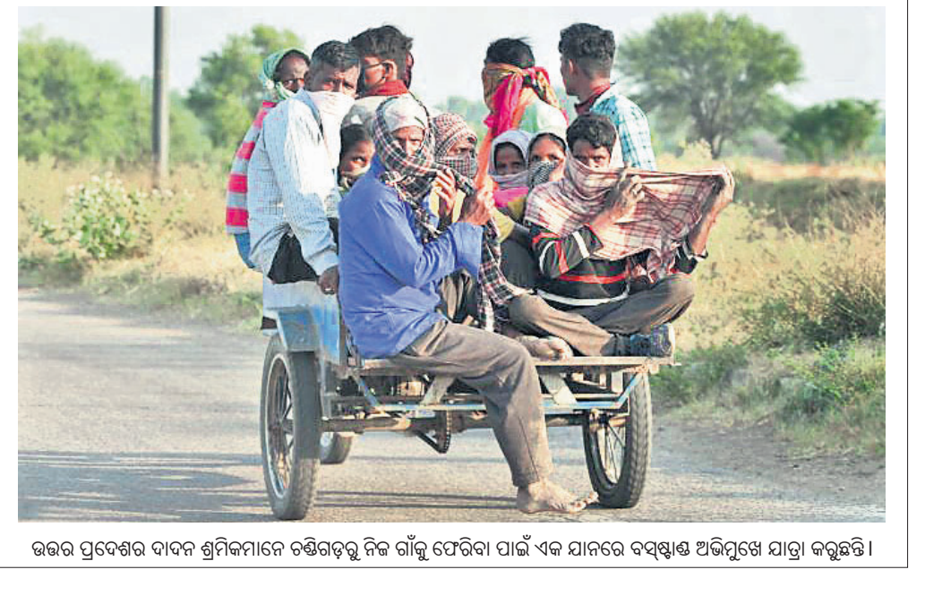
ଉତ୍ତର ପ୍ରଦେଶର ଦାବନ ଶ୍ରମିକମାନେ ଚଣ୍ଡିଗଡ଼କୁ ନିଜ ଗାଁକୁ ଫେରିବା ପାଇଁ ଏକ ଯାନରେ ବସଷ୍ଟାଣ୍ଡ ଅଭିମୁଖେ ଯାତ୍ରା କରୁଛନ୍ତି।

ଏକ ବିମାନ ଛାଡ଼ିଛି। ଭାରତୀୟମାନେ ହାତରେ ଟ୍ରେନ୍ଧା ଧରି ବିମାନବନ୍ଦୀରେ ପହଞ୍ଚିଥିବାବେଳେ ରାଷ୍ଟ୍ରପତି ପଦ୍ମନ କପୁର ଯାତ୍ରାଳ ଫେରିବାର ସବୁ ବ୍ୟବସ୍ଥା କରିଥିଲେ। ବିଦେଶରେ ଅଟକି ରହିଥିବା ପାଖାପାଖି ୧୪,୮୦୦ ଭାରତୀୟଙ୍କୁ ଚଳିତ ମାସରେ ଫେରାଇ ଆଣିବ ବୋଲି ଦୁଇଦିନ ପୂର୍ବରୁ ବହିର୍ବାପାର ମନ୍ତ୍ରୀ ଏସ୍. ଜୟଶଙ୍କର କହିଥିଲେ। ଏଥିପାଇଁ ୬୪ଟି ବିମାନକୁ ନିୟୋଜିତ କରାଯାଇଛି। ଏଥିସହିତ ମାଲଦ୍ୱୀପ ଏବଂ ସୁଏଜରେ ଅଟକି ରହିଥିବା ଭାରତୀୟଙ୍କୁ ଫେରାଇ ଆଣିବା ଲାଗି ନୌସେନା ଗତି ଜାହାଜ ପଠାଇଛି।