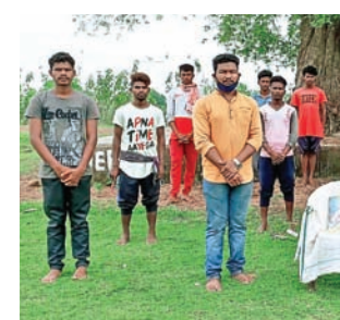
ଜୟନ୍ତୀ ଉତ୍ସବରେ ଯୋଗ ଦେଇଥିବା ମାସା ଆର୍ମୀର କାର୍ଯ୍ୟକର୍ତ୍ତାମାନେ।