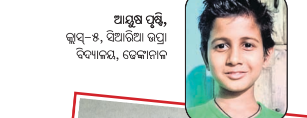
ଆସୁଷ ପୃଷ୍ଠି, କ୍ଲାସ୍-୫, ସିଆରିଆ ଉପ୍ରା ବିଦ୍ୟାଳୟ, ଢେଙ୍କାନାଳ