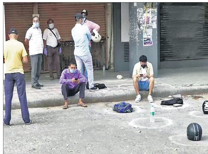
ଲୋକମାନେ ନିଜର ସମସ୍ତ ଚାଷ ଦେଇ ଏହାପରେ ସେମାନଙ୍କୁ ମୋବାଇଲ୍‌ରେ ମଦ କିଣିବାର ସମସ୍ତ ଧାର୍ଯ୍ୟ କରିବେ । ଏହାପରେ ସେମାନଙ୍କୁ ମୋବାଇଲ୍‌ରେ ଏକ ଇ-କ୍ରପ୍‌ସ ସୂତନା ଦିଆଯିବ ।

ଚଣାଯାଇଥିବା ବୁଲ ଭିତରେ ସେମାନଙ୍କ ସାମଗ୍ରୀକୁ ରଖିଥିବା ଦେଖିବାକୁ ମିଳିଛି । ସୂତନା ମୁତାବକ ଦିଲ୍ଲୀର ବିଭିନ୍ନ ଅଞ୍ଚଳରେ ଲୋକମାନେ ମଦଦୋକାନ ସମ୍ମୁଖରେ ହେଲ୍‌ମେଟ୍, ବୋତଲ, କୋଡା ଓ ଅନ୍ୟ ସାମଗ୍ରୀକୁ ଲାଇନ୍‌ରେ ରଖିଥିବା ଦୃଶ୍ୟ ସାମ୍ନାକୁ ଆସିଛି । ଅପରପକ୍ଷେ ମଦବିକ୍ରି ପାଇଁ ଦିଲ୍ଲୀ ସରକାର ଏବେ ଇ-ଗୋକନର ବ୍ୟବସ୍ଥା କରିଥିବା ଜଣାପଡ଼ିଛି । ମଦ ଦୋକାନରେ ଲାଗୁଥିବା ଭିଡ୍ ଏବଂ ସୁରକ୍ଷା ଦୃଷ୍ଟିରୁ ସରକାର ଏଭଳି ବ୍ୟବସ୍ଥା ଗ୍ରହଣ କରିଛନ୍ତି । ଯାହାଦ୍ୱାରା ଦୋକାନରେ ନିୟମ ଅନୁସାରେ ସାମାଜିକ ଦୂରତ୍ୱ ରକ୍ଷା କରାଯାଇପାରିବ । ଏଥିପାଇଁ ସରକାର ଏକ ଫ୍ଲେବ୍ ଲିଙ୍କ୍ ଜାରି କରିଛନ୍ତି । ଏହି ଲିଙ୍କ୍‌କୁ କ୍ଲିକ୍‌କରି