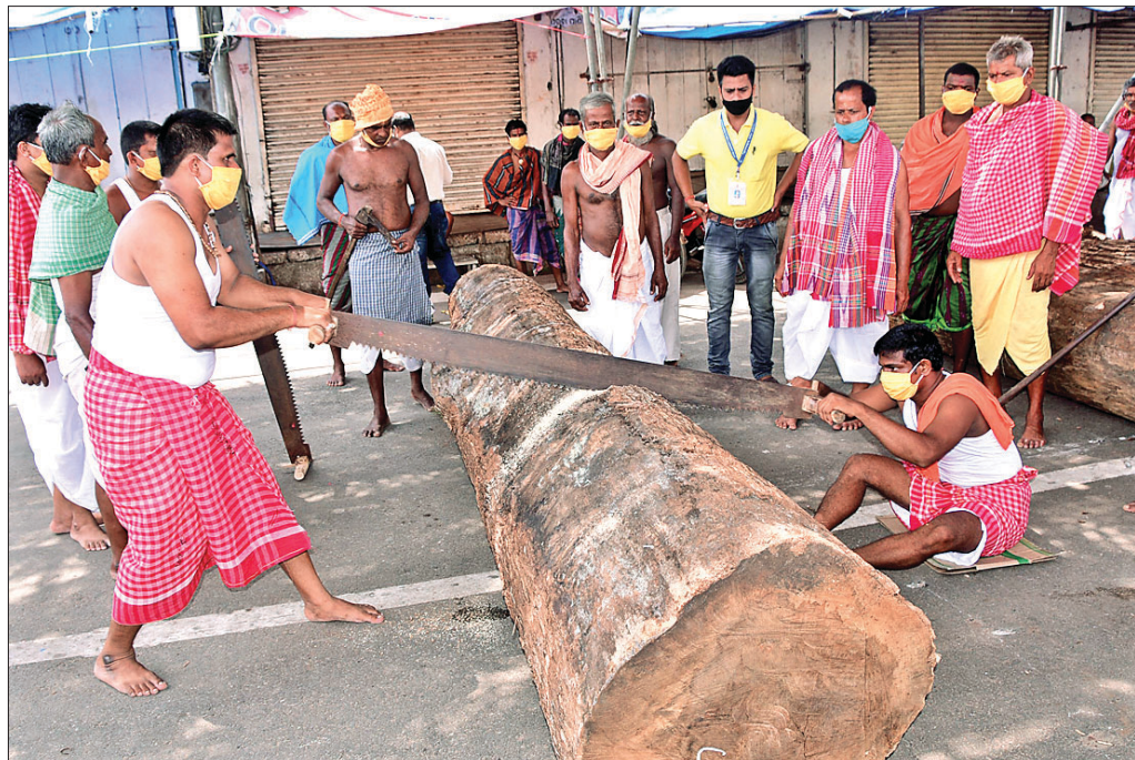
ପୁରୀ ରଥଖଳାରେ ଶୁକ୍ରବାର କରତି ସେବକଙ୍କ ଦ୍ୱାରା ରଥକାଠ ତିରତ କରାଯାଇଛି ।

ପିପିଲି, ୮୫ (ସ.ପ୍ର.): ପିପିଲି ବ୍ଲକ୍ ପିପିଲି ବ୍ଲକ୍ ପିପିଲି ବ୍ଲକ୍