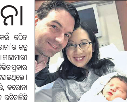
ଲକ୍ଷ୍ମୀଭିତ୍ତରେ ମା' ହେଲେ ଏମ୍‌ପି ଡାକ୍ତର ଏକ ୬ ବର୍ଷର ପୁତ୍ର ରହିଛି । ୨୦୧୭ରେ ତାଙ୍କର ବିବାହ ହୋଇଥିଲା ।

ଦେବାକୁ ଚାହଁଛନ୍ତି ଯେ କେଉଁ କଠିନ ସାରା ବିଷ୍ଣୁ ଚିନ୍ତାରେ ପକାଇଥିବା ବେଳେ ଛତିସଗଡ଼ରେ କେତେକଟି ଦମ୍ପତି ତାଙ୍କ ନବଜାତକଙ୍କ ନାଁ ଭାଇରସ୍ ନାଁ ଅନୁସାରେ ରଖିଥିବା ଦେଖାଯାଇଛି । ଏଥିରେ ପଶ୍ଚିମବଙ୍ଗର ଚୁଗୁର୍ତ୍ତ କଂଗ୍ରେସ୍(ଟିଏମ୍‌ସି)ଏମ୍‌ପି ଅପରୁପା ପୋଦାରକ ନାଁ ଯୋଡ଼ି ହୋଇଯାଇଛି । ଏଥିରେ ପଶ୍ଚିମବଙ୍ଗର ଚୁଗୁର୍ତ୍ତ କଂଗ୍ରେସ୍(ଟିଏମ୍‌ସି)ଏମ୍‌ପି ଅପରୁପା ପୋଦାରକ ନାଁ ଯୋଡ଼ି ହୋଇଯାଇଛି । ଏଥିରେ ପଶ୍ଚିମବଙ୍ଗର ଚୁଗୁର୍ତ୍ତ କଂଗ୍ରେସ୍(ଟିଏମ୍‌ସି)ଏମ୍‌ପି ଅପରୁପା ପୋଦାରକ ନାଁ ଯୋଡ଼ି ହୋଇଯାଇଛି ।