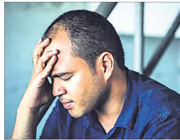
ଲେଖା ପ୍ରକାଶ ପାଇଛି । ଏଥିରେ ଦର୍ଶାଯାଇଛି ଯେ, ରିଭର୍ଚ୍ଚ ଟିମ୍ ୧୯୯୫ରେ ୧,୪୯୯ ବୟସ୍କ ଓ ୨୦୧୨ରେ ୭୮୨ ଜଣ ବିଭିନ୍ନ ବୟସ୍କଙ୍କୁ ନେଇ ଅଧ୍ୟୟନ କରିଥିଲେ । ଏ ସମସ୍ତଙ୍କୁ ଦୈନିକ ୮ ପ୍ରତିଶତ ଅଧିକ ଅସ୍ୱାସ୍ଥ୍ୟରେ ନିଆଯାଇଥିଲା । ଏଥିରେ ପ୍ରତ୍ୟେକ ଅଂଶଗ୍ରହଣକାରୀଙ୍କୁ ଦିନ ୨୪ ଘଣ୍ଟା ଚାପଗ୍ରସ୍ତ ଅଭିଜ୍ଞତା ଦର୍ଶାଣିବାକୁ କୁହାଯାଉଥିଲା । ପରିବାର କିମ୍ବା ସାଙ୍ଗସାଥୀଙ୍କ ମଧ୍ୟରେ ଉଚ୍ଚତା