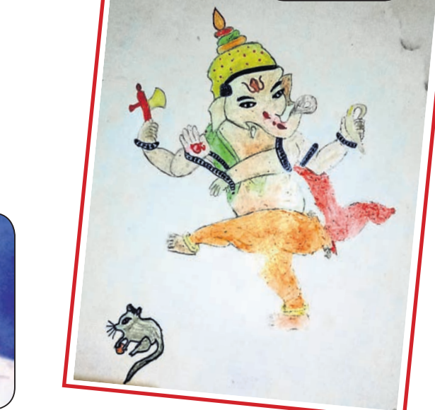
ପ୍ରମିଳା ନାୟକ, କେନ୍ଦ୍ରୀୟ ପଢ଼ା ପିଲାଙ୍କ ପ୍ରତିଯୋଗିତା