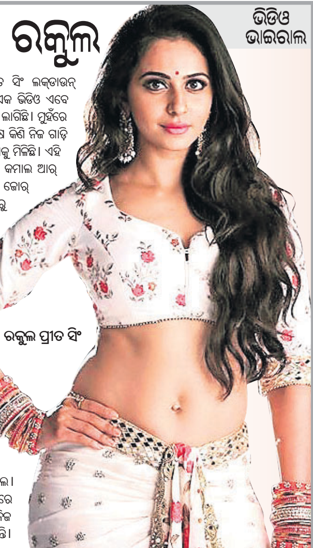
ରକ୍ତୁଳା ପ୍ରୀତ ସିଂ

ମୁମ୍ବାଇ: ବଲିଉଡ୍ ଅଭିନେତ୍ରୀ ରକ୍ତୁଳା ପ୍ରୀତ ସିଂ ଲକ୍ଷ୍ମୀଙ୍କୁ ବେଳେ ମଦ ଦୋକାନରୁ ମଦ କିଣିଥିବାର ଏକ ଭିଡିଓ ଏବେ ସୋସିଆଲ୍ ମିଡ଼ିଆରେ ଭାଇରାଲ୍ ହେବାରେ ଲାଗିଛି । ମୁମ୍ବାଇରେ ମାଧ୍ୟ ପିନ୍ଧିବା ସହ ସେ ଦୋକାନରୁ କିଣି ଜିନିଷ କିଣି ନିଜ ଗାଡ଼ି ଆଡ଼କୁ ଆସୁଥିବାର ଦୃଶ୍ୟ ଭିଡିଓରେ ଦେଖିବାକୁ ମିଳିଛି । ଏହି ଭିଡିଓକୁ ବଲିଉଡ୍ ଅଭିନେତା ତଥା ନିର୍ଦ୍ଦେଶକ କମାଳ ଆର୍ ଖାନ୍ ପୋଷ୍ଟ କରିଛନ୍ତି । ଏହାକୁ ନେଇ ଚର୍ଚ୍ଚା ଛୋଟ ଧରିବାରେ ଲାଗିଛି । ରକ୍ତୁଳା ମଦଦୋକାନରୁ ମଦ କିଣୁଛି କି ? ବୋଲି ଗୁଜ୍ଜର ଯୋଗେ କମାଳ ପ୍ରଶ୍ନ ମଧ୍ୟ କରିଥିଲେ । ରିକ୍ତୁଲା କି ରକ୍ତୁଳା ଉତ୍ତର ଦେଇଥିଲେ ଯେ, ଔଷଧ ଦୋକାନରେ ମଦ ମିଳୁଥିବା କଥା ସୁଁ ଜାଣି ନ ଥିଲି । ତାଙ୍କର ଏଭଳି ବ୍ୟଙ୍ଗାତ୍ମକ ଉତ୍ତର ଦର୍ଶାଇଥିଲା ଯେ, ମଦ କିଣିବାକୁ ସେ ଯାଇ ନ ଥିଲେ ବରଂ ଔଷଧ ଦୋକାନରୁ କିଛି ଔଷଧ ସେ କିଣି ଗାଡ଼ିକୁ ଫେରୁଥିଲେ । ଭାଇରାଲ୍ ହୋଇଥିବା ଭିଡିଓରେ କିଛି ସତ୍ୟତା ନାହିଁ । ପ୍ରକାଶନୀୟ ଡି, କମାଳ ଅନେକ କଳ୍ପ ଫିଲ୍ମରେ ଅଭିନୟ କରିଛନ୍ତି । ପରେ ଫିଲ୍ମ ନିର୍ଦ୍ଦେଶନା ଦେବା ଆରମ୍ଭ କରିଥିଲେ । ରକ୍ତୁଳା ମଧ୍ୟ ଏକାଧିକ ଟାଲିମ୍ ଓ ଟେଲୁଗୁ ଫିଲ୍ମରେ ଅଭିନୟ କରିଛନ୍ତି । ପରେ ସେ ବଲିଉଡ୍‌ରେ ନିଜ ବଦଳ୍‌ବା ଜାହିର କରିବାରେ ସଫଳ ହୋଇଛନ୍ତି ।