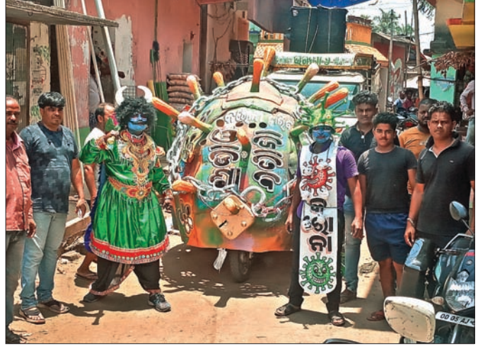
କରୋନା ସତେତନତା ରଥ ସହ ଅଭୟ ଯମ ରୂପରେ ଲୋକଙ୍କୁ ସତେତନ କରୁଛନ୍ତି ।