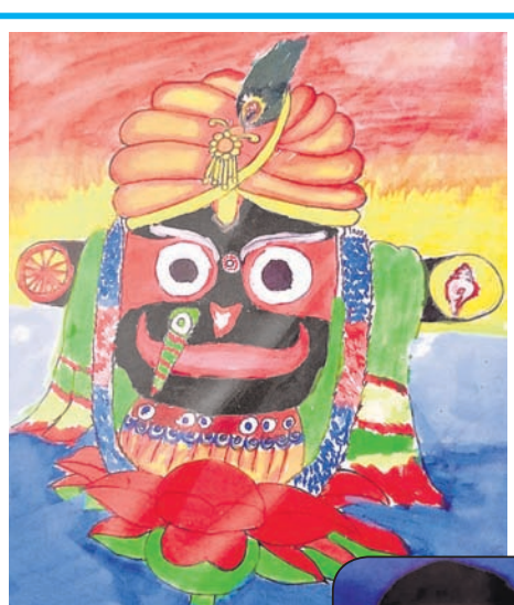
ତ୍ରିନାଥ ନନ୍ଦା, କ୍ଲାସ୍-୮, ଜଳେଶ୍ୱର ସରକାରୀ ଉଚ୍ଚ ବିଦ୍ୟାଳୟ, ଜଳେଶ୍ୱର, ବାଲେଶ୍ୱର