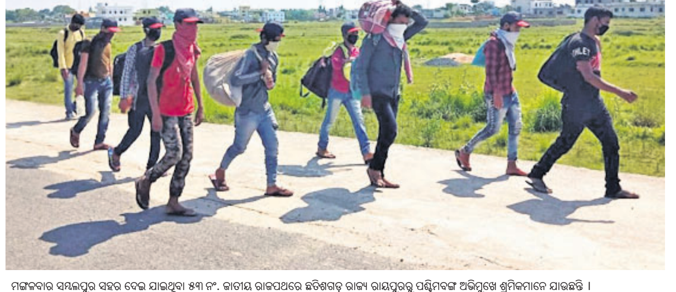
ମଙ୍ଗଳବାର ସମ୍ବଲପୁର ସହର ଦେଇ ଯାଇଥିବା ୫୩ ନଂ. କାଟାଓ ରାଜପଥରେ ଛତିଶଗଡ଼ ରାଜ୍ୟ ରାୟପୁରରୁ ପଶ୍ଚିମବଙ୍ଗ ଅଭିଯୁକ୍ତ ଶ୍ରମିକମାନେ ଯାଉଛନ୍ତି ।