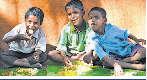
ବ୍ୟଞ୍ଜନ ସଂଖ୍ୟା କମାଇଲେଣି ୬୮%

ନୂଆଦିଲ୍ଲୀ, ୧୩୫(ପି.ଟି.) କରୋନା ମହାମାରୀ ଜନିତ ଲକ୍ଷ୍ମତାରଣ ଯୋଗୁ ଗ୍ରାମାଞ୍ଚଳ ଜନସାଧାରଣ ଖାଇବା କମାଇଦେଇଥିବା ଏକ ସର୍ବେକ୍ଷେପ ଜଣାପଡ଼ିଛି। ଲକ୍ଷ୍ମତାରଣ ସମୟରେ ୧୨ଟି ରାଜ୍ୟରୁ ୫୦୦୦ରୁ ଊର୍ଦ୍ଧ୍ୱ ଗ୍ରାମାଞ୍ଚଳ ପରିବାର ଉପରେ ଏକ ସର୍ବେକ୍ଷେପ କରାଯାଇଥିଲା। ସେମାନଙ୍କ ମଧ୍ୟରୁ ଅଧା ପରିବାର ଲକ୍ଷ୍ମତାରଣ ବେଳେ ଖାଇବା କମାଇଦେଇଥିବା କହିଛନ୍ତି। ସେହିପରି ୬୮ ପ୍ରତିଶତ ପରିବାର ବ୍ୟଞ୍ଜନ ସଂଖ୍ୟା କମାଇଥିବା ସର୍ବେକ୍ଷେପ ଜଣାପଡ଼ିଛି। ସାଧାରଣ ବ୍ୟଞ୍ଜନ ବ୍ୟବସ୍ଥା କରିଆରେ ୮୪ ପ୍ରତିଶତ ପରିବାରକୁ ଖାଦ୍ୟଶସ୍ୟ ମିଳିଥିବାବେଳେ ୩୭%ଙ୍କ ଘରେ ରାଶନ ସାମଗ୍ରୀ ପହଞ୍ଚିଛି। ୨୪ ପ୍ରତିଶତ ଖାଦ୍ୟଶସ୍ୟ ଗାଁର ଅନ୍ୟ ଲୋକଙ୍କଠାରୁ ଉଧାର ନେଉଥିବାବେଳେ ୧୨%ଙ୍କୁ ମାରଣୀ ଖାଦ୍ୟ ମିଳୁଛି। ରୁଧିରୀର ଏକ ଇଣ୍ଟରନେଟ ସେମିନାରରେ ଏହି ରିପୋର୍ଟ ପ୍ରକାଶ ପାଇଛି। ସର୍ବେକ୍ଷେପ ଅନୁଯାୟୀ ପରିବାରଗୁଡ଼ିକ ରିଟି ଅପେକ୍ଷା ଖରିଦ୍ ଶସ୍ୟ ଉପରେ ଅଧିକ ନିର୍ଭର କରିଥିଲେ। ଏବେ ସେମାନଙ୍କ ପାଖରେ ଗଭିର ଶସ୍ୟ ସରି ସରି ଆସିଲାଣି। ତେଣୁ ସେମାନେ ଦିନକୁ କମ୍ ଥର ଖାଇବା ସହ ଅଳ୍ପ ଖାଇବାକୁ ବାଧ୍ୟ ହେଉଛନ୍ତି। ଅଧିକାଂଶ ପିତୃ-ସ୍ତ୍ରୀ ଉପରେ ନିର୍ଭର କରୁଛନ୍ତି। ଚଳିତ ବର୍ଷ ଲକ୍ଷ୍ମତାରଣ ଯୋଗୁ ଖରିଦ୍ ଚାଷ ପାଇଁ ପ୍ରସ୍ତୁତି କମିଯାଇଛି। ଏଥିପାଇଁ ଚାଷୀଙ୍କୁ ସରକାରଙ୍କ ପକ୍ଷରୁ ବିହନ, ସାର ଓ କୃଷିରଣ ଯୋଗାଇଦିଆଯିବା ଜରୁରୀ। ବହୁସଂଖ୍ୟାରେ ପ୍ରବାସୀ ଶ୍ରମିକ ନିଜ ରାଜ୍ୟକୁ ଫେରୁଥିବାରୁ ଗ୍ରାମାଞ୍ଚଳ ସ୍ଥିତି ଆହୁରି ଖରାପ ହେବ। ସହାରେ କଳକାରଖାନାରେ କାମ କରୁଥିବା ଏହି ଲୋକମାନେ