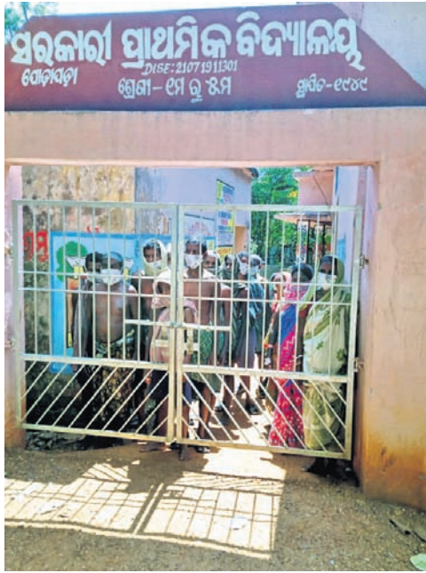
ବିଦ୍ୟାଳୟରେ ଥିବା ଶ୍ରମିକମାନେ।

ଜିଲ୍ଲାର ଅନେକ ଶ୍ରମିକ ବାଲେଶ୍ୱର, ଯାଜପୁର, ଭଦ୍ରକ ଆଦି ଅଞ୍ଚଳକୁ କାମ କରିବାକୁ ଯାଇଥିଲେ। ଲକ୍ଷ୍ମୀର ଯୋଗୁଁ କାର୍ଯ୍ୟ ବନ୍ଦ ହେବା ପରେ କିଏ ଚାଲି ଚାଲି ତ ଆଉ କିଏ ସାଇକେଲରେ ଫେରି ଆସୁଛନ୍ତି। ସରକାର ରାଜ୍ୟ ଭିତରେ ଥିବା ଶ୍ରମିକମାନଙ୍କ ପାଇଁ କୌଣସି ବ୍ୟବସ୍ଥା କରି ନ ଥିବାରୁ ଗ୍ରାମକୁ ଆସିଲା ପରେ ଗ୍ରାମବାସୀ ସେମାନଙ୍କୁ ଗାଁରେ ପୂରାଇ ଦେଇ ନାହାନ୍ତି। ଜିଲ୍ଲାର ରାସଗୋବିନ୍ଦପୁର ବ୍ଲକ୍ ଅଧୀନ ନଳଗଜା ପଞ୍ଚାୟତ ପୋଡ଼ାପୋଡ଼ା ଗ୍ରାମର ୧୬ ଜଣ ବ୍ୟକ୍ତି ଯାଜପୁର ଜିଲ୍ଲା