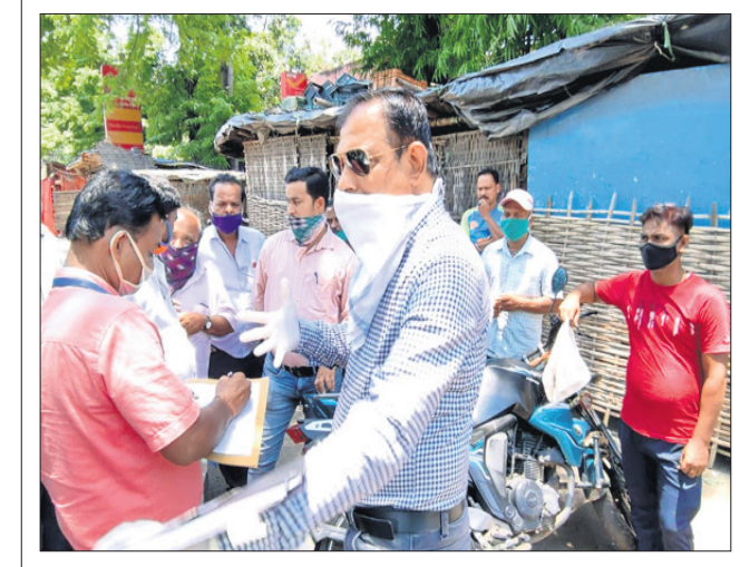
ଫଳ ଦୋକାନୀଙ୍କ ସହ ନିର୍ବାହୀ ଅଧିକାରୀ ଆଲୋଚନା କରୁଛନ୍ତି।

ବିକ୍ରି କରାଯାଇଛି। ରାତିରେ ଚାଲାଣ ହେଉଛି ଚୋରା ମଦ ଅନୁକାଳ, ଓସ୍ତରହାଟ, ଚିକରପଙ୍ଗା ଆଦି ସ୍ଥାନରେ ସରକାରୀ ସ୍ୱୀକୃତିପ୍ରାପ୍ତ ମଦ ବ୍ୟବସାୟୀମାନେ ରାତିରେ ଦୋକାନଗୁଡ଼ିକ ସିଲ୍ ଭାଙ୍ଗି ସେଠାରେ ଗଢ଼ିତ ମଦକୁ ଚାଲାଣ କରୁଥିବା ନେଇ ଅଭିଯୋଗ ହୋଇଛି। ସେହିପରି ଅନ୍ୟ କିଛି ସ୍ଥାନରେ ଦେଶୀ ମଦ ପ୍ରସ୍ତୁତି କରାଯାଉଥିବା ସୂଚନା ମିଳିଛି। ୨ ମାସରେ ୮ ମଦ ବ୍ୟବସାୟୀ ଗିରଫ