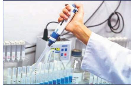
ଚନ୍ଦ୍ରାୟନ-୨ ପରେ ଏବେ କରୋନା ଟେଷ୍ଟିଂ ମେଶିନ ଯନ୍ତ୍ରାଂଶ ନିର୍ମାଣ

ଭାରତର ମହାକାଶ ଅଭିଯାନ 'ମଙ୍ଗଳାୟନ' ଏବଂ 'ଚନ୍ଦ୍ରାୟନ-୨' ପ୍ରଯୁକ୍ତିରେ ଗୁରୁତ୍ୱପୂର୍ଣ୍ଣ ଭୂମିକା ନିର୍ବାହ କରିବାପରେ ଏବେ କୋଭିଡ୍-୧୯ ଲଢ଼େଇରେ ଗୁରୁତ୍ୱପୂର୍ଣ୍ଣ ନେଇଛି ଭୁବନେଶ୍ୱରସ୍ଥିତ ସେଣ୍ଟ୍ରାଲ୍ ଟୁଲ୍ ଟୁଲ୍ ଆଣ୍ଡ ଟ୍ରେନ୍ସ ସେକ୍ଟର(ସିଟିସି)।