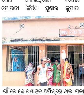
ଗାଁ ଲୋକେ ପଞ୍ଚାୟତ ଅଫିସରେ ତାଲା ପକାଇଛନ୍ତି।