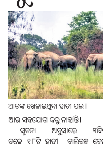
ଆତଙ୍କିତ ହୋଇଥିବା ହାତୀ ପଲ। ଆଉ ସହଯୋଗ କରୁ ନାହାନ୍ତି। ସୂଚନା ଅନୁସାରେ ୩ଦିନ ତଳେ ୧୮ଟି ହାତୀ ବାଲିକଷ ଦେଇ

କେନ୍ଦୁଝର ଜିଲ୍ଲା ଚମ୍ପୁଆ ରେଞ୍ଜିରେ ହାତୀପଲ ଉପୁତ ଚଳାଇଛନ୍ତି। ଏହି ପଲରେ ଥିବା ୧୮ହାତୀ ଯୋଡ଼ା ସେକ୍ଟରରୁ ଚମ୍ପୁଆ ସେକ୍ଟରରେ ପଶି ବ୍ୟାପକ କ୍ଷୟକ୍ଷତି କରିବା ସହ ବନବିଭାଗକୁ ନାକେଦମ କଲେଣି। ବନବିଭାଗର ହାତୀ ଘରଡ଼ାଭବା କୌଶଳ ଫେଲ ମାରିଥିବା ବେଳେ ଗ୍ରାମବାସୀ ଆତଙ୍କିତ ଅବସ୍ଥାରେ ରହୁଛନ୍ତି। ପୂର୍ବରୁ ବନବିଭାଗକୁ ଏହି ହାତୀ ଘରଡ଼ାଭବା କାର୍ଯ୍ୟରେ ଗ୍ରାମବାସୀ ସହଯୋଗ କରୁଥିବା ବେଳେ ବର୍ତ୍ତମାନ