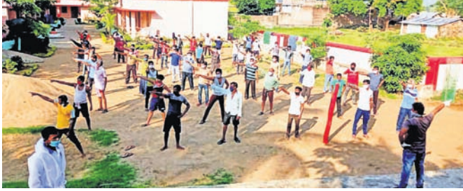
ସଙ୍ଗରୋଧ ଗୃହରେ ଯୋଗ କରୁଛନ୍ତି ପ୍ରବାସୀ।

ସାନଖେମୁଣ୍ଡି ବ୍ଲକ ବିଭିନ୍ନ ସଙ୍ଗରୋଧ ଗୃହରେ ୨୦୫୩ ଜଣ ସୁରଟ ଫେରନ୍ତା ରହିଛନ୍ତି। ତେବେ ଅନ୍ୟ ବ୍ଲକ ଅଞ୍ଚଳର ସଙ୍ଗରୋଧ କେନ୍ଦ୍ରମାନଙ୍କରେ ସୁବନ୍ଧନାରେ ପାଟିବୁଦ୍ଧ ସହ ବିଶ୍ୱଖିଳା