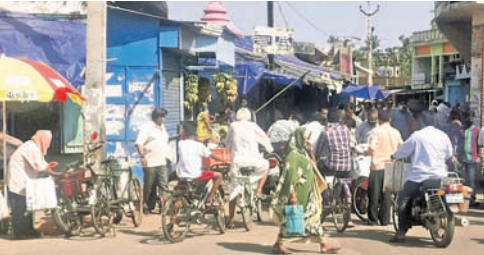
ବ୍ରହ୍ମପୁରରେ ଲୋକେ ସାମାଜିକ ଦୂରତ୍ୱ ନ ମାନି ସାମଗ୍ରୀ କିଣୁଛନ୍ତି।

ଗଞ୍ଜାମ ଜିଲ୍ଲାରେ ବୁଧବାର କରୋନା ପଜିଟିଭ ସଂଖ୍ୟା ୨୦୦ରୁ ଉର୍ଦ୍ଧ୍ୱକୁ ଚଢ଼ିଛି। ପ୍ରାୟ ସମସ୍ତ ଆକ୍ରାନ୍ତ ସୁରଟ ଫେରନ୍ତା।