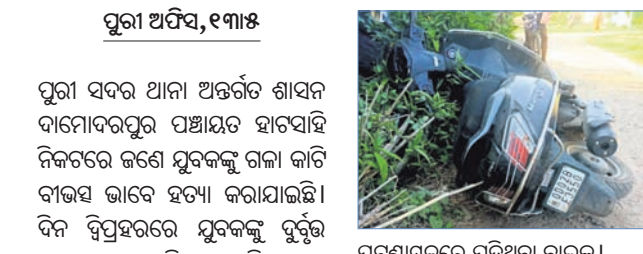
ପୁରୀ ଅଫିସ୍, ୧୩୫: ପୁରୀ ସଦର ଥାନା ଅନ୍ତର୍ଗତ ଶାସନ ଦାମୋଦରପୁର ପଞ୍ଚାୟତ ହାତସାହି ନିକଟରେ ଜଣେ ଯୁବକଙ୍କୁ ଗଳା କାଟି ବାଜାଇ ଭାବେ ହତ୍ୟା କରାଯାଇଛି।

ଚନ୍ଦ୍ରାୟନ ଅଭିଯାନରେ ସିଟିସି ଭୁବନେଶ୍ୱରର ଗୁରୁତ୍ୱପୂର୍ଣ୍ଣ ଭୂମିକା ରହିଥିଲା। 'ଚନ୍ଦ୍ରାୟନ-୨' ପାଇଁ ଏଠାରେ ବିଭିନ୍ନ କମ୍ପୋନେଣ୍ଟ ତଥା ଉପକରଣ ସହ ଲଢ଼ି ଭେଜିକିଙ୍ଗ୍ ପାଇଁ ୨୨ ପ୍ରକାରର ସାମଗ୍ରୀ ତିଆରି କରାଯାଇଥିଲା।