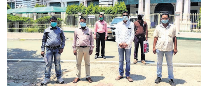
ଜିଲ୍ଲାପାଳଙ୍କ କାର୍ଯ୍ୟକ୍ରମକୁ ଅଭିଯୋଗ କରିବାକୁ ଆସିଥିବା ମଲଦା ଗ୍ରାମବାସୀ।

କେନ୍ଦୁଝର, ୧୩।୫(ସ.ପ୍ର.) ପ୍ରଦୂଷଣ ହେଉଥିବାରୁ ଲୋକମାନେ ବନ୍ଧୁ ଅସୁବିଧାରେ ସମ୍ମୁଖୀନ ହେଉଥିବା କହିଛନ୍ତି। ବନ୍ଧୁ ସଂଖ୍ୟାରେ ଲୁହାପଥର ଓ ପିଲେଟ ଏକ ପିଲେଟ କାରଖାନା ବିରୋଧରେ ଅସନ୍ତୋଷ ଚେତନା ରୁଧିରୀ ମଲଦା ପଞ୍ଚାୟତର ଗ୍ରାମବାସୀ ପ୍ରଦୂଷଣ ରୋକିବା ସହ କମ୍ପାନୀ ଦେଇଥିବା ପ୍ରତିଷ୍ଠିତ ପାଳନ କରିବା ଦାବିରେ ସାମାଜିକ ଦୂରତ୍ୱ ରକ୍ଷା କରି ଓ ମାଝ ପିନ୍ଧିଲେ। ପ୍ରଶାସନ ନିକଟରେ ଦାବିପତ୍ର ଦେଇଛନ୍ତି। ପୁଲିସ୍ରେ ପଞ୍ଚାୟତରେ ଏହି କାରଖାନା ସ୍ଥାପିତ ହୋଇଥିଲେ ହେଁ ଏହାକୁ ଲାଗି ଥିବା ମଲଦା ପଞ୍ଚାୟତର ମଲଦା ଗ୍ରାମ ବେଳ କାରଖାନାର କଞ୍ଚାମାଲ ଓ ପିଲେଟ ପରିବହନ ହେଉଛି। ଏଣୁ ରାସ୍ତା ଅସୁରକ୍ଷିତ ହୋଇପଡ଼ିବା ସହ ଧୂଳିଧୂଆଁ