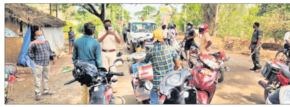
ଭୁବନ ପୋଲିସ ପକ୍ଷରୁ ଯାନବାହନ ଯାଞ୍ଚ କରାଯାଇଛି।

ଏସିଆ ମହାଦେଶ ସର୍ବବୃହତ୍ ଗାଁ ଭୁବନକୁ ଗୋଡ଼ାଉଛି କରୋନା ଡର। ସାମାଜିକ ଯାକପୁର ଜିଲ୍ଲାରେ ଆକ୍ରାନ୍ତଙ୍କ ସଂଖ୍ୟାବୃଦ୍ଧି ଅଞ୍ଚଳବାସୀଙ୍କ ଚିନ୍ତା ବଢ଼ାଇଛି। ଅନ୍ୟପଟେ ଅଞ୍ଚଳକୁ ପ୍ରବାସୀ ଓଡ଼ିଆଙ୍କ ଆଗମନ ପରେ ସଂକ୍ରମଣ ରୋକିବା ପ୍ରଶାସନ ଲାଗି ବ୍ୟାଲେଞ୍ଜ ପାଲଟିଛି। ଏଭଳି ସ୍ଥିତିରେ ଅଞ୍ଚଳକୁ କୋଭିଡ଼ କବଳରୁ ରକ୍ଷା କରିବାକୁ ପୋଲିସ, ପ୍ରଶାସନ ପକ୍ଷରୁ ନୂତନ ରଣନୀତି ପ୍ରସ୍ତୁତ କରାଯାଇଛି। ଭୁବନରୁ ଯାକପୁରକୁ ସଂଯୋଗ କରୁଥିବା ରାସ୍ତାକୁ ସିଲ୍ କରାଯାଇଛି। ସାମାଜିକ ଅଞ୍ଚଳରେ ପାଟ୍ରୋଲିଂ ବଢ଼ାଇ ଦିଆଯାଇଥିବାବେଳେ ଅମାମିଆଙ୍କ ଉପରେ ଅଧିକ କଠୋର ହେଉଛି ପୋଲିସ।