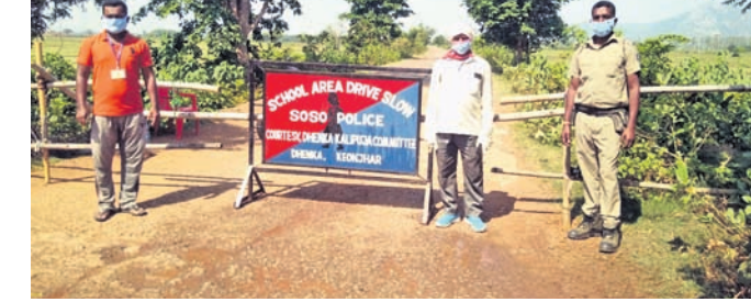
ପୋଲିସ୍ ପ୍ରଶାସନ ପକ୍ଷରୁ ରାସ୍ତା ସିଲ୍ କରାଯାଇଛି। ହାଟଡିହା, ୧୩।୫(ଡି.ଏନ.ଏ.)