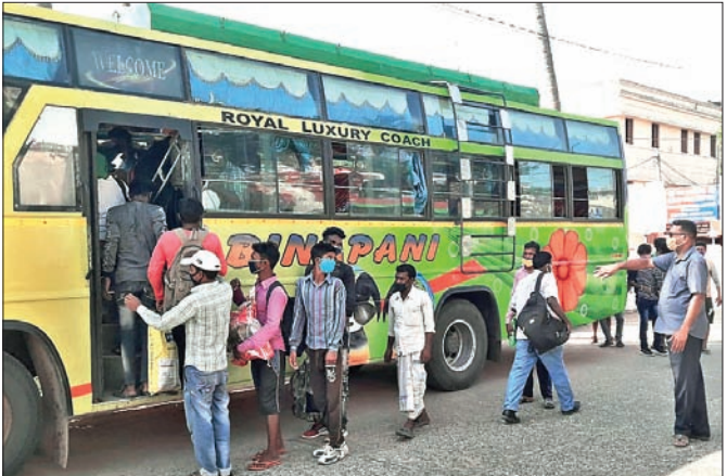
ନିଜ ରାଜ୍ୟକୁ ଯିବାପାଇଁ ପ୍ରବାସୀମାନେ ବସ୍ରେ ଚଳୁଛନ୍ତି।