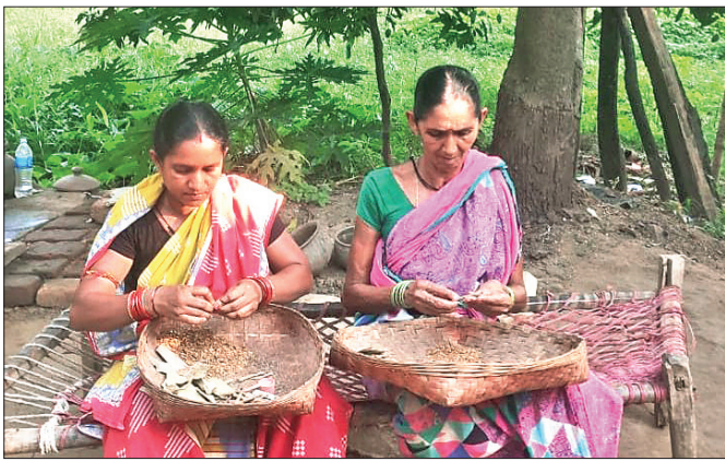
ସମ୍ବଲପୁର ଜିଲାର ବିଡ଼ିକାରିଗର ମାନେ ବିଡ଼ି ତିଆରି କରୁଛନ୍ତି ।