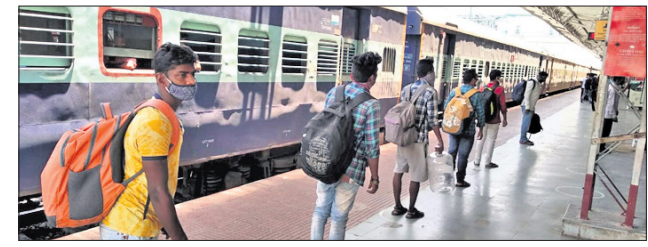
ଖୋର୍ଦ୍ଧା ଅତିଥି, ୧୫୫୫

ତାମିଲନାଡୁରୁ କୋଭିଡ଼ରୁ ଉଦ୍ଧୃତ କରାଯାଇଥିବା ୬୮୧ ପ୍ରବାସୀଙ୍କୁ ଖୋର୍ଦ୍ଧାରେ ପହଞ୍ଚାଇବା ପାଇଁ ଖୋର୍ଦ୍ଧା ଟ୍ରାନ୍ସପୋର୍ଟ କର୍ମାଳୟରେ ପ୍ରସ୍ତୁତି କରାଯାଇଥିଲା।