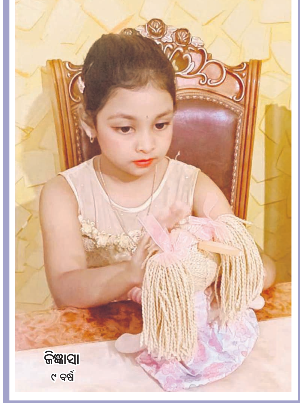
ଜିଙ୍କାସା ୯ ବର୍ଷ