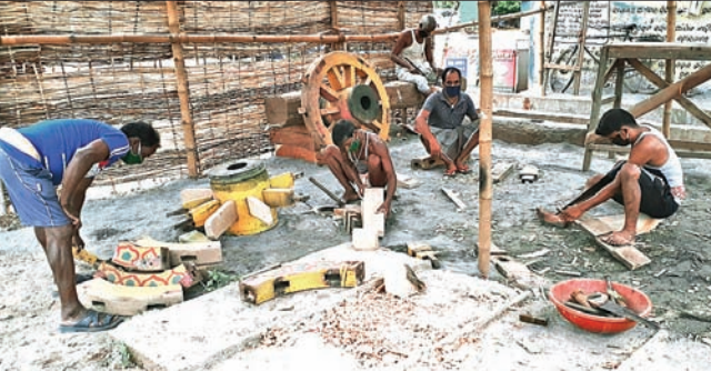
ରଥଗଢ଼ାରେ ରଥ ନିର୍ମାଣ କାର୍ଯ୍ୟ ଚାଲିଛି।