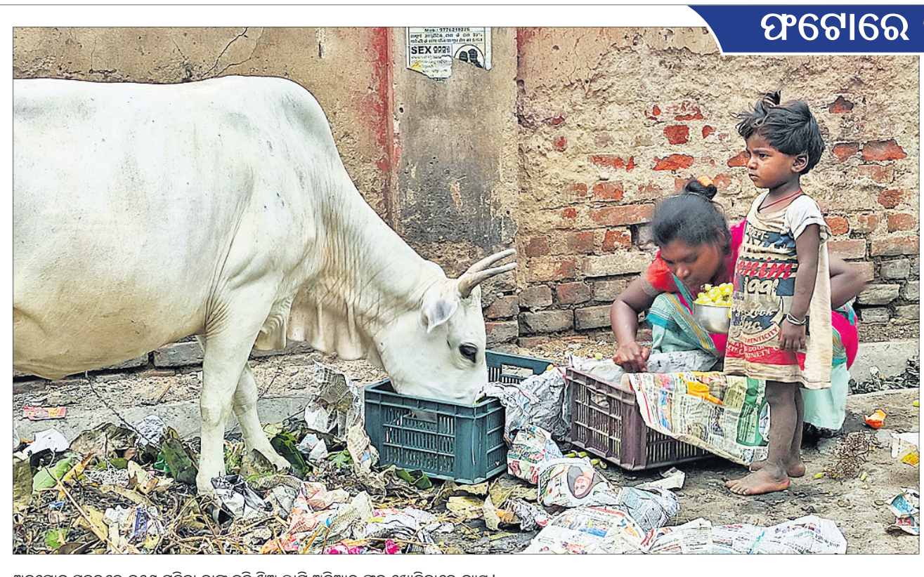
ଅନୁଗୋଳ ସହରରେ ଜଣେ ମହିଳା ତାଙ୍କ କୁନି ଝିଅ ଲାଗି ଅଳିଆକୁ ପକ୍ଷ ଖୋଜିବାରେ ବ୍ୟସ୍ତ।

ଛେଡ଼ିପଦା, ୧୯୮୫(ସ୍ୱ.ପ୍ର.): ଛେଡ଼ିପଦା ନିର୍ବାଚନମଣ୍ଡଳ ଗାଳୁଡ଼ିଆ ପଞ୍ଚାୟତରେ ଦିବେକ ପକ୍ଷରୁ ମଙ୍ଗଳବାର ଆୟୋଜିତ ଜାବନ ବିନ୍ଦୁ କାର୍ଯ୍ୟକ୍ରମରେ ୮୫ ଯୁନିଟ୍ ରକ୍ତ ସଂଗ୍ରହ କରାଯାଇଛି। ଅନୁଗୋଳ ଜିଲ୍ଲା ଯୁବ ବିଜେତ ସଭାପତି ଦୀନେଶ ପ୍ରଧାନ ଓ ଛେଡ଼ିପଦା ନିର୍ବାଚନମଣ୍ଡଳ ଯୁବ ବିଜେତ ସଭାପତି ସତ୍ୟକ୍ରମ ଦେହୁରାଙ୍କ ନେତୃତ୍ୱରେ ଅନୁଷ୍ଠିତ ଏହି ଶିବିରରେ ପୁଞ୍ଜିଅତି ଡାବେ ଛେଡ଼ିପଦା ବିଧାୟକ ପୁଶାନ୍ତ ବେହେରା ଜାବନ ବିନ୍ଦୁ କାର୍ଯ୍ୟକ୍ରମରେ ୮୫ ଯୁନିଟ୍ ରକ୍ତ ସଂଗ୍ରହ କରାଯାଇଛି। ଅନୁଗୋଳ ଜିଲ୍ଲା ଯୁବ ବିଜେତ ସଭାପତି ଦୀନେଶ ପ୍ରଧାନ ଓ ଛେଡ଼ିପଦା ନିର୍ବାଚନମଣ୍ଡଳ ଯୁବ ବିଜେତ ସଭାପତି ସତ୍ୟକ୍ରମ ଦେହୁରାଙ୍କ ନେତୃତ୍ୱରେ ଅନୁଷ୍ଠିତ ଏହି ଶିବିରରେ ପୁଞ୍ଜିଅତି ଡାବେ ଛେଡ଼ିପଦା ବିଧାୟକ ପୁଶାନ୍ତ ବେହେରା ଜାବନ ବିନ୍ଦୁ କାର୍ଯ୍ୟକ୍ରମରେ ୮୫ ଯୁନିଟ୍ ରକ୍ତ ସଂଗ୍ରହ କରାଯାଇଛି।