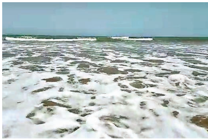
ବାଘା ବେଳାଭୂମିରେ ଅଶାନ୍ତ ସମୁଦ୍ର।