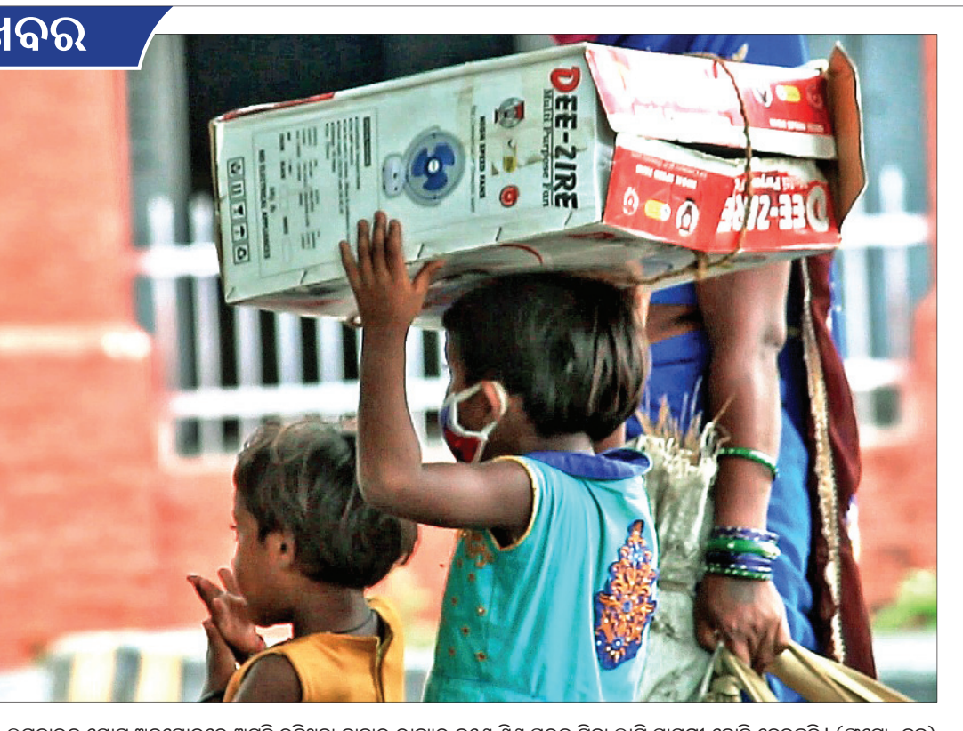
ଲକଡ଼ାଉନ୍ ଯୋଗୁ ଅନୁଗୋଳରେ ଅନିଚ୍ଛା ରହିଥିବା ବାହାର ରାଜ୍ୟର ଜଣେ ଶିଶୁ ଘରକୁ ଯିବା ଲାଗି ସାମଗ୍ରୀ ବୋହି ନେଉଛନ୍ତି।