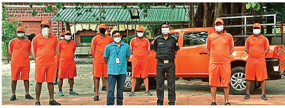
ବାରିପଦାରେ ପହଞ୍ଚିଥିବା ଏନଡିଆରଏଫ୍ ଟିମ୍।