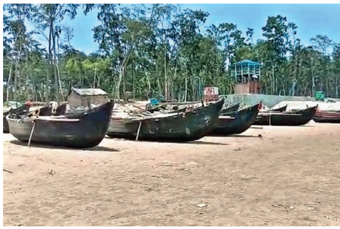
ବାତ୍ୟା ପୂର୍ବରୁ ତାଳସାହା ବେଳାଭୂମିରେ ମହାଜାବାମାନେ ତଳାଗୁଡ଼ିକୁ ବନ୍ଧି ରଖିଛନ୍ତି।