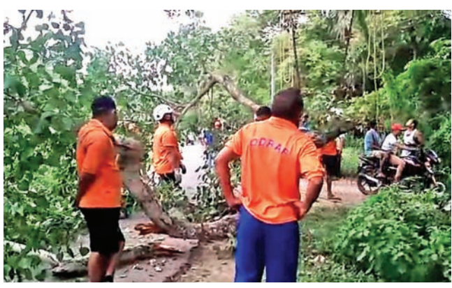
ଓଡ୍ରାଫ୍ ଟିମ୍ ପକ୍ଷରୁ ଗଛ କଟାଯାଇ ରାସ୍ତା ସଫା କରାଯାଇଛି।