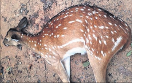
ଆସିଥିଲା। ଖବରପାଇ କସ୍ତିପଦା ରେଞ୍ଜର ମହେଶ୍ଵର ସିଂ, ବନରକ୍ଷା ଜଙ୍ଗଲରେ ଛାଡ଼ି ଦିଆଯାଇଛି। ହରିଣଟି ଶିମିଳିପାଳରୁ ବାଟବଣା ହୋଇ ଗ୍ରାମ ଭିତରକୁ ପଶି