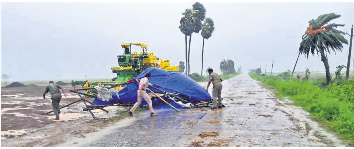
ମୟୂରଭଞ୍ଜ ଜିଲ୍ଲା ରାସଗୋବିନ୍ଦପୁର ରୁକ୍ତ ଅଞ୍ଚଳ ଏକ ରାସ୍ତାକୁ ପୋଲିସ ସଫା କରୁଛି।