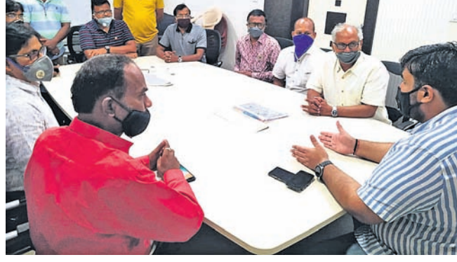
କମିଶନର ସହ ବ୍ୟବସାୟୀମାନେ ଆଲୋଚନା କରୁଛନ୍ତି।

ଅଫ କମର୍ସ ପକ୍ଷରୁ ନିର୍ଦ୍ଧା କରାଯାଇଥିଲା। ଏନେଇ ସମସ୍ତ ବ୍ୟବସାୟୀ ଓ ଶୋପୁ ମାଲିକଙ୍କୁ ଗାୟର ପକ୍ଷରୁ ଅବଗତ କରାଯିବ। ସହ ଆଗାମୀ ଦିନରେ କେହି ବ୍ୟବସାୟୀ ମହାସଭା ସଭାପତି ବି. ବିଏମ୍ସିକୁ ଅବଗତ କରାଇବା ନେଇ