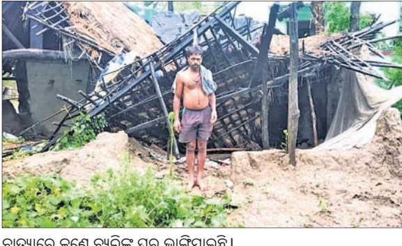
ବାତ୍ୟାରେ ଜଣେ ବ୍ୟକ୍ତିଙ୍କ ଘର ଭାଙ୍ଗିଯାଇଛି ।

ପାରାଦୀପ, ୨୦୧୫ (ସ.ପ୍ର.) ବଜୋପ ସାଗରରୁ ବୃଷ୍ଟ ବାତ୍ୟା ଅଞ୍ଚଳ ପାରାଦୀପରେ ତାଣ୍ଡବ ରଚିଛି । ଏହାଦ୍ୱାରା ଅଞ୍ଚଳରେ ବ୍ୟାପକ କ୍ଷତିଗ୍ରସ୍ତ ହୋଇଛି । ଘଣ୍ଟାପ୍ରତି ୧୦୬ କି.ମି. ବେଗରେ ପବନ ବହିବା ସହ ବୁଧବାର ଦିନ ୧୦ଟା ସୁଦ୍ଧା ୨୦୮ ମି.ମି. ବର୍ଷା ହୋଇଥିବା ରେକର୍ଡ କରାଯାଇଛି । ମଙ୍ଗଳବାର ମଧ୍ୟାହ୍ନ ୧୨ଟା ୩୦ରୁ ବର୍ଷାପବନ ଆରମ୍ଭ ହୋଇଥିଲା । ବୁଧବାର ଅପରାହ୍ନ ୫ଟା ପର୍ଯ୍ୟନ୍ତ ବର୍ଷାପବନ ଲାଗି ରହିଥିଲା । ପ୍ରାୟ ୨୪ ଘଣ୍ଟାରୁ ଉର୍ଦ୍ଧ୍ୱ ବାତ୍ୟା ପବନରେ ଲୋକେ ଆତଙ୍କିତ ହୋଇ ପଡ଼ିଥିଲେ । ବିଭିନ୍ନ ସ୍ଥାନରେ ଗଛ ଉପୁଡ଼ି ପଡ଼ିବା ସହ କେତେକ କଳାଘର, ଚିଣି ଛପର ବୋକାନ ଆଦି ଭାଙ୍ଗିଯାଇଛି । କେତେକ ସ୍ଥାନରେ ବର୍ଷା ପାଣି ଜମି ରହିବା ସହ ଖାଲୁଆ ଅଞ୍ଚଳରେ ଥିବା ଘର ଗୁଡ଼ିକରେ ପାଣି ପଶିଥିଲା । ଅପରପକ୍ଷେ ବାତ୍ୟା ଯୋଗୁ ପାରାଦୀପ ବନ୍ଦରରେ ପଶ୍ୟ କାରବାର ବନ୍ଦ ରହିଛି । ଅନ୍ୟ ସମସ୍ତ ଶିଳ୍ପ ସଂସ୍ଥାର ପଶ୍ୟ କାରବାର ଆଂଶିକ ପ୍ରଭାବିତ ହୋଇଛି । ବନ୍ଦରାଞ୍ଚଳକୁ ବାଦ୍‌ଦେଲେ ଅନ୍ୟ ଅଞ୍ଚଳରେ ବିଦ୍ୟୁତ୍ ସେବା ବାଧାପ୍ରାପ୍ତ ହୋଇଛି । ଚେଳିକମ୍ପ, କେନ୍ଦୁଲ ସେବା ୦ପ ହୋଇଯାଇଛି । ପାରାଦୀପ ମାଛଧରା ବନ୍ଦରରେ ଏକ ମାଛ ଧରା ଟ୍ରଲର ପବନରେ ପିଟିହୋଇ କ୍ଷତିଗ୍ରସ୍ତ ହୋଇଛି । ବାତ୍ୟା ପରେ ଭାଙ୍ଗି ପଡ଼ିଥିବା ଗଛଗୁଡ଼ିକୁ ଏନ୍‌ଡିଆର୍‌ଏଫ୍ ଓ ଅଗ୍ନିଶମ ବିଭାଗର କର୍ମଚାରୀ କାଟି ସଫା କରିଛନ୍ତି । ବେଳାଭୂମିରେ ଥିବା ଝାଉଁଶଛକୁ ଷ୍ଟେକ୍‌ସର କେତେକ ଲୋକେ କାଟି ନେବାରେ ଲାଗିଛନ୍ତି । ପାରାଦୀପର