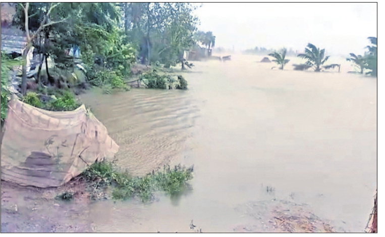
ମହାକାଳପଡ଼ା ବ୍ଲକ ଖରିନାସୀ ପଞ୍ଚାୟତର ୧୨ ନଂ ଆଦିବାସୀ ଗାଁର ଚାଷ ଜମିରେ ନଦୀ ଜଳ ପଶିଛି।