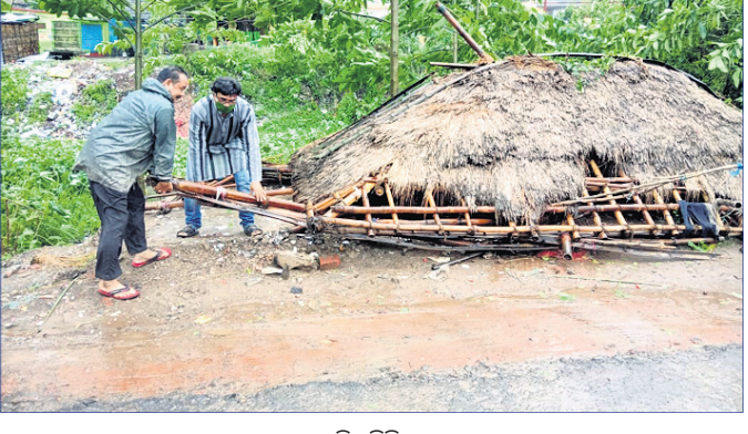
କେନ୍ଦ୍ରାପଡ଼ା ସହରରେ ଏକ ଚାଳଘର ଭାଙ୍ଗିପଡ଼ିଛି ।

ସାମୁଦ୍ରିକ ଝଡ଼ ଅଞ୍ଚଳ କେନ୍ଦ୍ରାପଡ଼ା ଜିଲ୍ଲାରେ ପ୍ରଭାବ ପକାଇଛି । ଗତ ସନ୍ଧ୍ୟାରୁ ଆରମ୍ଭ ହୋଇଥିବା ସାମାନ୍ୟ ବର୍ଷା ପବନ ବୁଧବାର ଉଗ୍ରରୂପ ଧାରଣ କରିଛି । ଘଣ୍ଟାକୁ ୧୦୦ରୁ ୧୨୦ କିଲୋମିଟର ବେଗରେ ପବନ ବହିବା ସହ ତୁହାଳୁ ତୁହା ବର୍ଷା ହୋଇଛି । ଫଳରେ ଜିଲ୍ଲାର ହାଲ ଆଲର୍ଟରେ ଥିବା ରାଜନଗର ଓ ମହାକାଳପଡ଼ା ବୁକ ଅଞ୍ଚଳରେ ଲୁଣି ଘେରି ଭାଙ୍ଗି ସମୁଦ୍ର ପାଣି ନିକଟସ୍ଥ ଗ୍ରାମର କ୍ଷେତରେ ମାଡିଯାଇଛି । ପାଟଣାଳା ନଦୀ ଘେରି ଭାଙ୍ଗି ଲକ୍ଷ୍ମୀପୁର ପଞ୍ଚାୟତ ପୁରୁଷୋତ୍ତମପୁର ଗ୍ରାମକୁ ପାଣି ପଶିଛି । ଏଠାରେ ଥିବା ଗ୍ରାମବାସୀ ଜଳବନ୍ଦୀରେ ଅଛନ୍ତି । ଖରିନାସୀ ନଦୀ ଉତ୍ତୁଳ ନିକଟସ୍ଥ ଗ୍ରାମରେ ପାଣି ପଶିଛି । ଚାଳତୁଆ ଥାନା ମଧ୍ୟକୁ ପାଣି ପଶିଛି ।