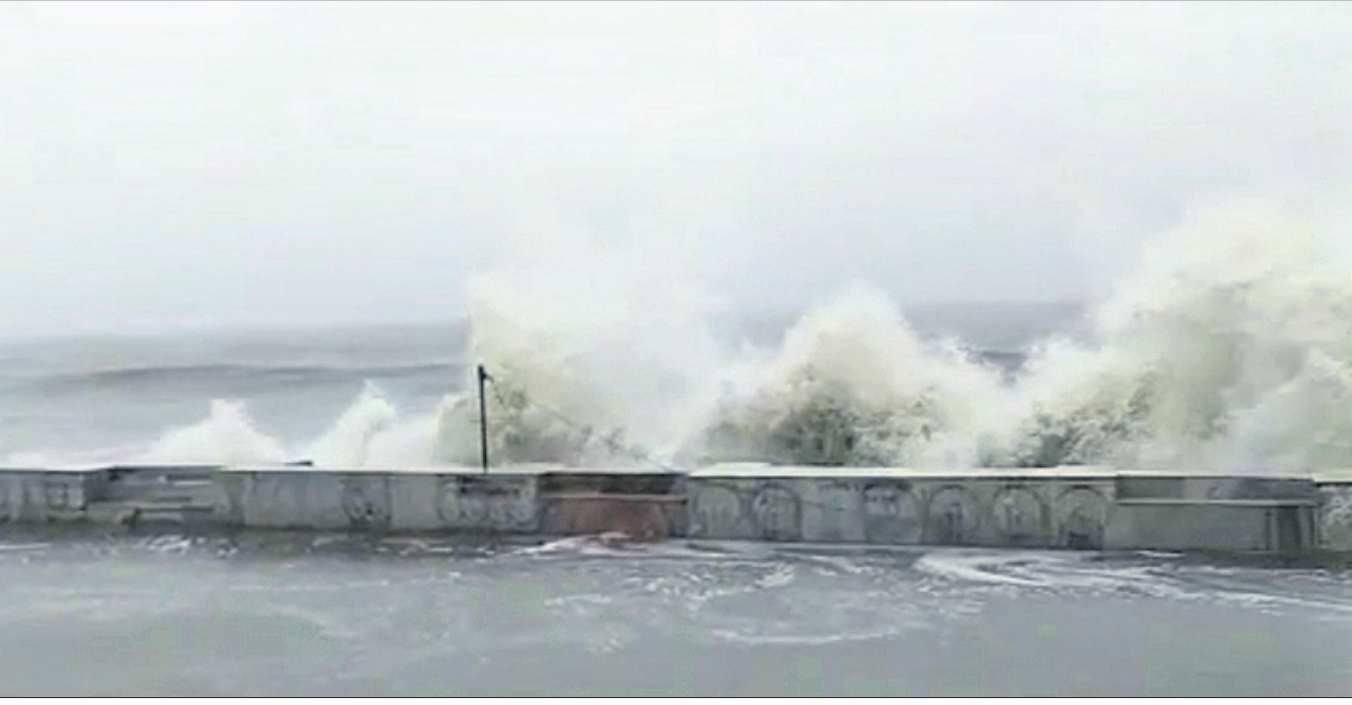
ବାପା ବେଳାଭୂମିରେ ସମୁଦ୍ର କୁଆର ପୁରସା ବନ୍ଧରେ ମାଡ଼ ହେଉଛି।

ବଙ୍ଗୋପସାଗରରେ ମହାବାତ୍ୟାର ରୂପ ନେଇଥିବା ଅଞ୍ଚଳ ବୃଧିବାର ଅପରାହ୍ଣରେ ପଶ୍ଚିମବଙ୍ଗର ସୁନ୍ଦରବନ ନିକଟରେ ସ୍ଥଳଭାଗ ଅତିକ୍ରମ କରିଛି। ସ୍ଥଳଭାଗ ଛୁଇଁବା ପୂର୍ବରୁ ଏହା ଓଡ଼ିଶାର ଉପକୂଳବର୍ତ୍ତୀ ଜିଲ୍ଲାଗୁଡ଼ିକରେ ବ୍ୟାପକ କ୍ଷତି ଘଟାଇଛି। କଳାପାଟଣା ଭାଙ୍ଗିଯିବା ସହ ଅନେକ ଗଛ ଉପୁଡ଼ି ମାଟିରେ ଲୋଟିଛି। ବିଦ୍ୟୁତ୍ ଖୁଣ୍ଟ, ଟେଲିଫୋନ ଟାପ୍ପାର ମଧ୍ୟ କ୍ଷତିଗ୍ରସ୍ତ ହୋଇଛି। ଝଡ଼ ପ୍ରଭାବରେ ବିଭିନ୍ନ ସ୍ଥାନରେ ପ୍ରବଳରୁ ଅତିପ୍ରବଳ ବର୍ଷା ହୋଇଛି। କେତେକ ସ୍ଥାନରେ ହଜାର ହଜାର ହେକ୍ଟର ଚାଷଜମି ଜଳମଗ୍ନ ହୋଇଛି। ବାତ୍ୟା ଆଶଙ୍କା କରି ତଳିଆ ଅଞ୍ଚଳରୁ ବହୁ ଲୋକ ନିକଟସ୍ଥ ବାତ୍ୟା ଆଶ୍ରୟସ୍ଥଳରେ ରହିଥିବା ଦେଖିବାକୁ ମିଳିଥିଲା।