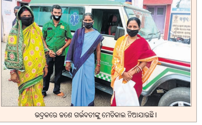
ଭଦ୍ରକରେ ଜଣେ ଗର୍ଭବତୀଙ୍କୁ ମେଡିକାଲ ନିଆଯାଇଛି।

ଅମ୍ଫନ ମୁକାବିଲାକୁ ଆଗ୍ରାସରେ ରଖି ୧୫୮ ଜଣ ଗର୍ଭବତୀଙ୍କୁ ସୁରକ୍ଷିତ ପ୍ରସବ ପାଇଁ ପ୍ରଶାସନ ବିଭିନ୍ନ ମେଡିକାଲରେ ଭର୍ତ୍ତି କରିଛି। ସର୍ବାଧିକ ବାସୁଦେବପୁରରେ ୪୫ଜଣଙ୍କୁ ଭର୍ତ୍ତି କରାଯାଇଥିବା ଜଣାପଡ଼ିଛି। ସେହିଭଳି ବରପଦା, ଭଣ୍ଡାରିପାଖରୀ, ବଡ଼, ଚାନ୍ଦବାଲି, ଧାମନଗର, ତିହଡ଼ି ଭଦ୍ରକ ଜିଲ୍ଲା ବିଶାଳସ୍ତରେ ମଧ୍ୟ ଗର୍ଭବତୀଙ୍କୁ ଭର୍ତ୍ତି କରାଯାଇଛି।