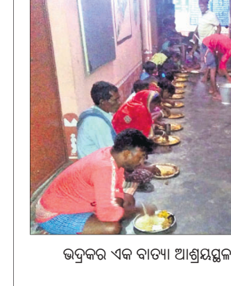
ଭଦ୍ରକର ଏକ ବାତ୍ୟା ଆଶ୍ରୟସ୍ଥଳରେ ଲୋକଙ୍କୁ ରକ୍ଷାଖାତ୍ୟ ଦିଆଯାଇଛି।

ବାତ୍ୟା ଅମ୍ଫନ ପ୍ରଭାବରେ ଭଦ୍ରକ ଜିଲ୍ଲାରେ ଭୋରରେ ପବନ ବହିବା ସହ ବର୍ଷା ହୋଇଥିଲା। ମୁଖ୍ୟତଃ ସମୁଦ୍ରକୂଳୀ ବୁଲଟି ରୁକ୍ତ ବାସୁଦେବପୁର ଓ ଚାନ୍ଦବାଲିରେ ଏହାର ପ୍ରଭାବ ଅଧିକ ଅନୁଭୂତ ହୋଇଥିଲା। ଏଣୁ ପ୍ରଶାସନ ଏହି ବୁଲଟି ରୁକ୍ତରେ ହାଇଥାଇଲଟ୍ କାରି କରିଥିଲା। ସକାଳୁ ସକାଳୁ ପର୍ଯ୍ୟନ୍ତ ବର୍ଷା ଲାଗି ରହିଥିଲା। ସକାଳୁ ମଧ୍ୟାହ୍ନ ପର୍ଯ୍ୟନ୍ତ ପବନର ବେଗ ପ୍ରାୟ ୧୦୦ କି.ମି. ରହିଥିବା ବେଳେ ମଧ୍ୟାହ୍ନରୁ ପ୍ରାୟ ୩ଟା ପର୍ଯ୍ୟନ୍ତ ପବନର ବେଗ ବଢ଼ିଥିଲା। ପରେ ପୁଣି କମିଯାଇଥିଲା। ଲଗାଣ ବର୍ଷା କାରଣରୁ ବାସୁଦେବପୁର, ଚାନ୍ଦବାଲି, ଧାମରା ଓ ତିହଡ଼ିର କିଛି ଅଂଶରେ ଚାଳଛପର ଘର, ଆକବେଷ୍ଟ୍ୟ ଦୋକାନ ଘରଗୁଡ଼ିକ ଭୂଇଁରେ କ୍ଷୟକ୍ଷତି ହୋଇଥିବା ପ୍ରାଥମିକ ଆକଳନ କରାଯାଇଛି। ବିଦ୍ୟୁତ ଖୁଣ୍ଟଗୁଡ଼ିକ ଭାଙ୍ଗି ପଡ଼ିଛି। ଗ୍ରାହ୍ୟମାନଙ୍କୁ ଚୁଇଁରେ ଲୋଡ଼ିଯାଇଛି। ଯଦିଓ ବିପଦ ଚଳି