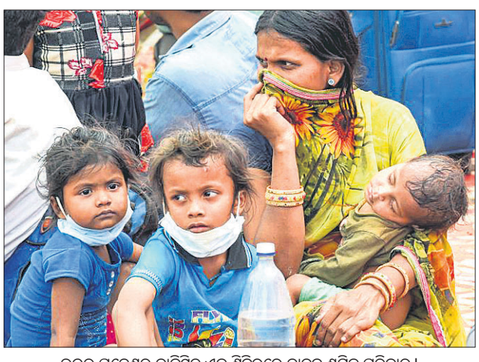
ଉତ୍ତର ପ୍ରଦେଶର ଦାଦନ ଶ୍ରମିକ ପରିବାର।