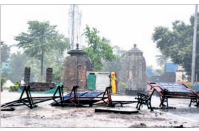
ଭୁବନେଶ୍ୱର, ୨୦୧୫ (ବ୍ୟବସାୟ)

ଭୁବନେଶ୍ୱରରେ ବାତ୍ୟା ଅଖନ୍ ପ୍ରଭାବ ସାମାନ୍ୟ ଅନୁଭୂତ ହୋଇଛି। ଏହା ପ୍ରଭାବରେ ମଙ୍ଗଳବାରଠାରୁ ଝିପିଝିପି ବର୍ଷା ହୋଇଥିବାବେଳେ ବିକଳିତ ରାତିରୁ ରୁଧିରା ମଧ୍ୟାହ୍ନ ଯାଏ ବର୍ଷିଥିଲା। ୪୦ରୁ ୫୦ କି.ମି. ବେଗରେ ପବନ ବହିଥିଲେ ମଧ୍ୟ ରାଜଧାନୀରେ ସେପରି କିଛି କ୍ଷୟକ୍ଷତି ଘଟି ନ ଥିବା ଜଣାପଡ଼ିଛି। ଆଞ୍ଚଳିକ ପାଣିପାଗ ବିଭାଗର ସୂଚନାମୁତାୟୀ, ୨୪ ଘଣ୍ଟା ମଧ୍ୟରେ ସହରରେ ସ୍ୱାଭାବିକ ବର୍ଷା ହୋଇଛି। ରୁଧିରା ପ୍ରାୟ ୩୩ ମି.ମି. ବର୍ଷା ରେକର୍ଡ କରାଯାଇଛି। ଫଳରେ ଭୁବନେଶ୍ୱରର ବିଭିନ୍ନ ସମ୍ବେଦନଶୀଳ ଅଞ୍ଚଳଗୁଡ଼ିକରେ ଜଳବନ୍ଧା ସମସ୍ୟା ନଜରକୁ ଆସିନାହିଁ। ଏହାସତ୍ତ୍ୱେ ଭୁବନେଶ୍ୱର ମହାନଗର ନିଗମ (ବିଏମ୍‌ସି) ପକ୍ଷରୁ ସମ୍ବେଦନଶୀଳ ଅଞ୍ଚଳଗୁଡ଼ିକ ଉପରେ ନଜର ରଖାଯାଇ ଜଳ ନିଷ୍କାସନ ପାଇଁ ମୋଟର ପମ୍ପ ବ୍ୟବସ୍ଥା କରାଯାଇଥିଲା ବୋଲି କମିଶନର ପ୍ରେମଚନ୍ଦ୍ର ଚୌଧୁରୀ ସୂଚନା ଦେଇଛନ୍ତି। ସେହିପରି ବାତ୍ୟା ବିପତ୍ତିକୁ ଦୃଷ୍ଟିରେ ରଖି