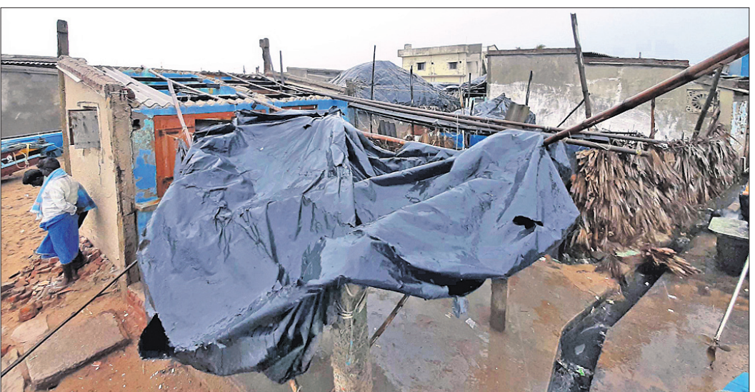
ପୁରୀ: ବାତ୍ୟା ପବନରେ ଭାଙ୍ଗିଯାଇଥିବା ବସ୍ତୁ।