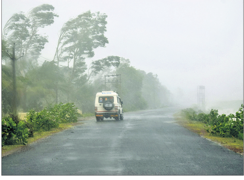
ଧାମରା ରୋଡ଼ରେ ବହୁଥିବା ପବନ।