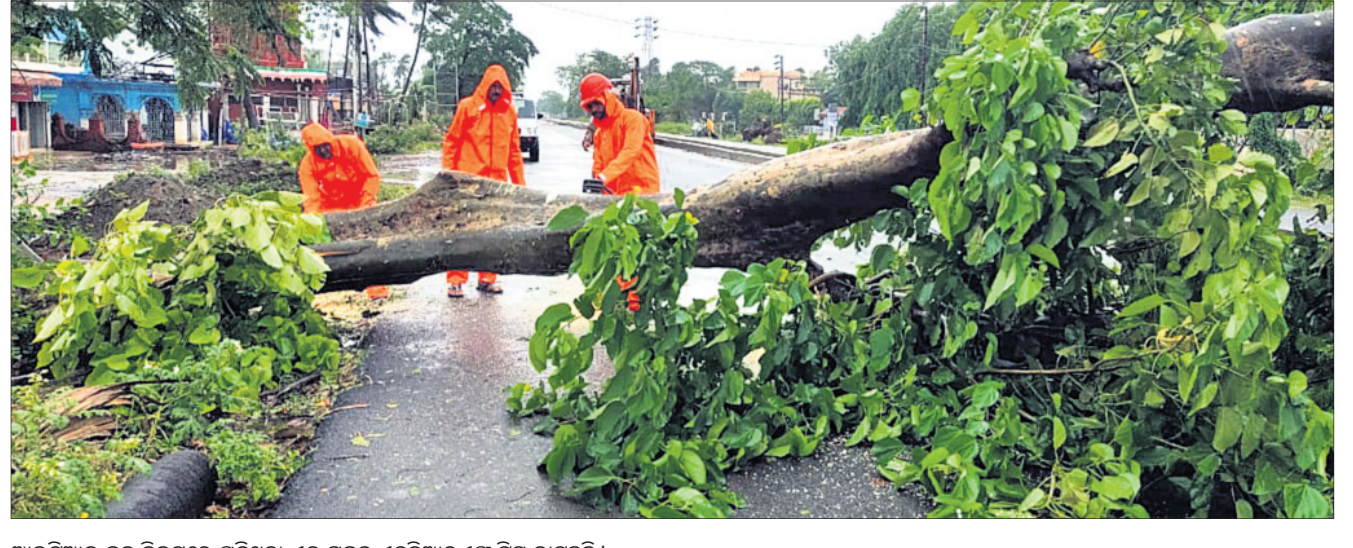
ଆଇଟିଆଇ ଛକ ନିକଟରେ ପଡ଼ିଥିବା ଏକ ଗଛକୁ ଏନ୍‌ଡିଆର୍‌ଏଫ୍ ଟିମ୍ କାଟୁଛନ୍ତି ।

ପଠାଣମହଲ ଆଞ୍ଚଳରେ ୩ଟି ଗଛ ୩ଟି ଆଜବେଷ୍ଟସ ଘର ଉପରେ ଉପୁଡ଼ି ପଡ଼ିବାରୁ ୩ଜଣଙ୍କୁ ଗୁରୁତର ଆହତ ହୋଇ ସୋର ଚିକିତ୍ସାଳୟରେ ଚିକିତ୍ସିତ ହେଉଛନ୍ତି । ପ୍ରଶାସନ ପକ୍ଷରୁ ଜିଲ୍ଲାର ୪୯୫ଜାର ଲୋକଙ୍କୁ ସ୍ଥାନାନ୍ତରିତ କରାଯାଇଥିବା ବେଳେ ୪୦୦ ବାତ୍ୟା ଆଶ୍ରୟସ୍ଥଳୀରେ ଆଶ୍ରୟ ଦିଆଯାଇଛି । ସେମାନଙ୍କ ଖାଦ୍ୟ, ପାନୀୟକ ଏବଂ ରହିବା ବ୍ୟବସ୍ଥା କରାଯାଇଛି । ଗୃହପାଳିତ ପ୍ରାଣୀମାନଙ୍କ ପାଇଁ ମଧ୍ୟ ଖାଦ୍ୟ ବ୍ୟବସ୍ଥା କରାଯାଇଥିବା ଜିଲ୍ଲା ପ୍ରଶାସନ ପକ୍ଷରୁ କୁହାଯାଇଛି ।