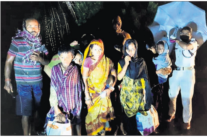
ଚାନ୍ଦବାଲି ଅଞ୍ଚଳର କେତେକ ଲୋକଙ୍କୁ ପୋଲିସ୍ ବାତ୍ୟା ଆଶ୍ରୟସ୍ଥଳକୁ ନେଉଛି।