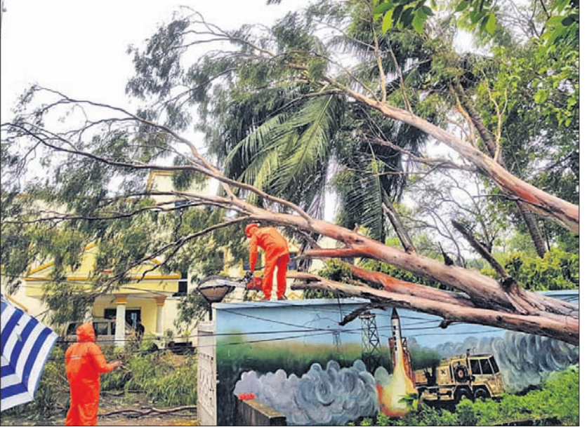
ବାଲେଶ୍ୱର ସହର ଆଇକି ଅଫିସ ସମ୍ମୁଖରେ ପଡ଼ିଥିବା ଗଛକୁ ଏନ୍ଡିଆରଏମ୍ ଟିମ୍ ସଫା କରୁଛନ୍ତି।