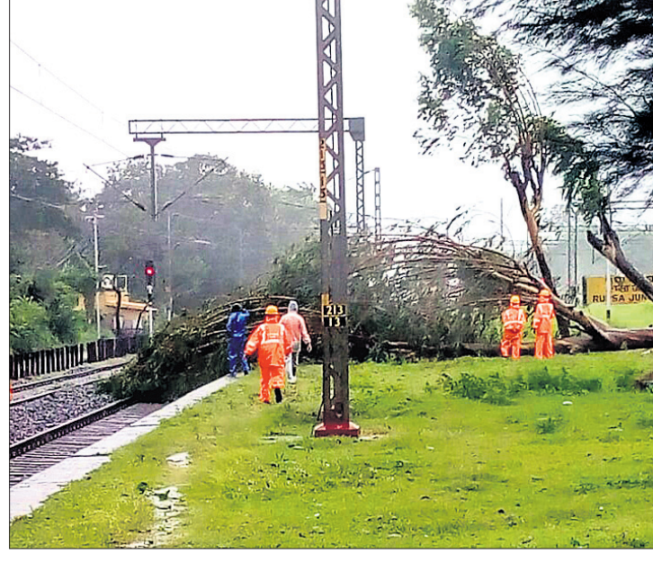
ବାଲେଶ୍ୱର ରୂପବା-ସାରଥ ଇଷ୍ଟ ଖତଗପୁର ଡିଭିଜନର ରେଳଧାରଣରେ ଉପୁଡ଼ି ପଡ଼ିଥିବା ଗଛ।