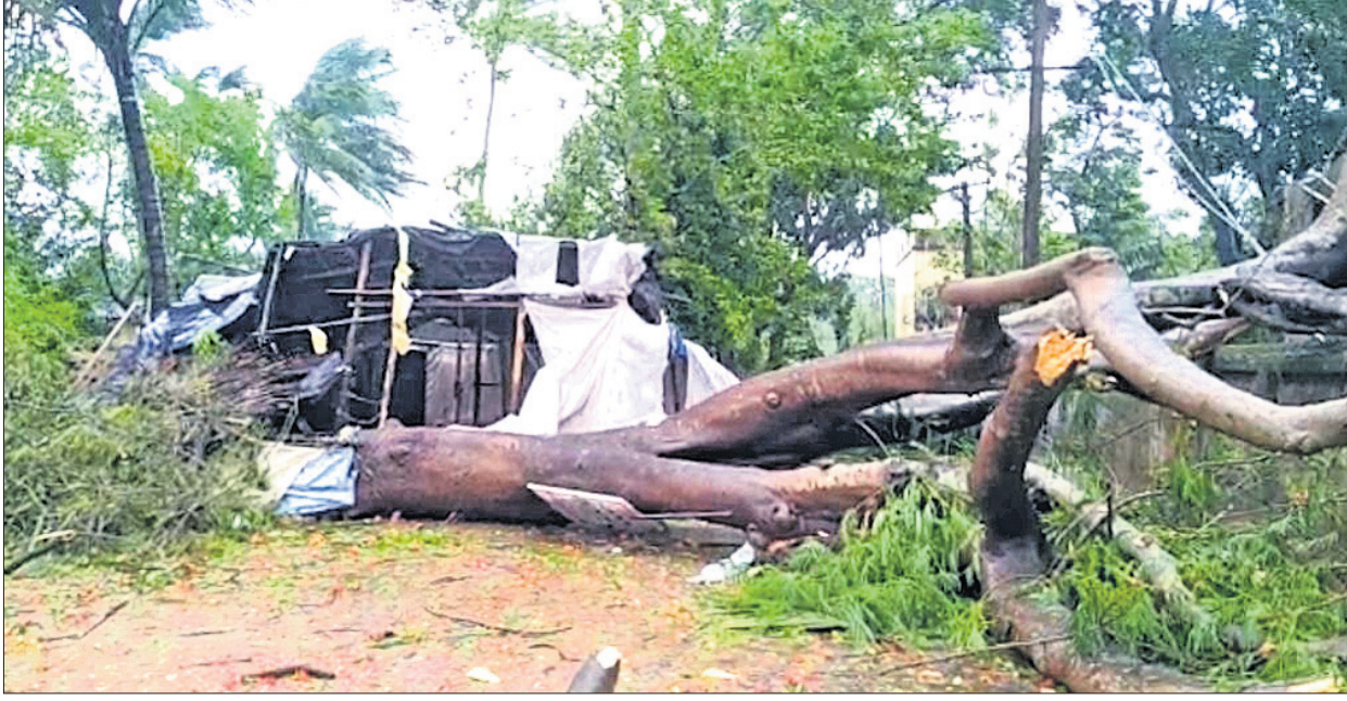
ପାରାଦୀପରେ ପ୍ରବଳ ପବନ ଯୋଗୁ ଏକ କୁଡ଼ିଆ ଉପରେ ଭାଙ୍ଗି ପଡ଼ିଥିବା ଗଛ।