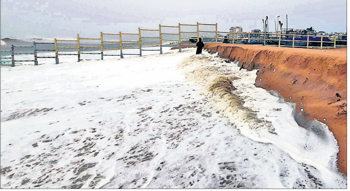
ପୁରୀ ବେଳାଭୂମି ଆଡ଼କୁ ମାଡ଼ି ଆସିଥିବା ସମୁଦ୍ର କୁଆର।