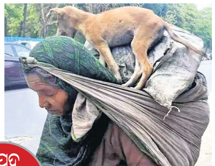
ବିପଦ ସମୟରେ ବି ଭୁଲିଲେନି

ପାଖାପାଖି ୬୫ ହେବ । ମୁଖରେ ନିଜର ଅତ୍ୟାବଶ୍ୟକ ଜିନିଷ ଗଣ୍ଠିଳ ଧରି ସେ ଚାଲିଚାଲି ଯାଉଛନ୍ତି । ତାଙ୍କ ସହ ରହୁଥିବା ଅସମୟର ସାଥୀ ଛୋଟ ପୋଷା କୁକୁର ମଧ୍ୟ ବୋଧେ ଉପରେ ବୋହିନେବାକୁ ସେ ଭୁଲିନାହାନ୍ତି । ସତେ ଯେମିତି କୁକୁରଟି ତାଙ୍କ ଜୀବନ ସେଇଭଳି ମନେହେଉଛି । ଜଣେ ସୁଇଚର ମୁକ୍ତର ଏଭଳି ଫଟୋକୁ ଶେୟାର କରି ଗତ ଦୁଇଦିନ ହେବ ମହିଳା ଜଣକ ଏଭଳି ଅହରହ ଚାଲୁଥିବା ଲେଖୁଛନ୍ତି । ଅଖୁଆ ଅପିଆ ଥିଲେ ବି କୁକୁର କଥା ସେ ବୁଝୁଛନ୍ତି । ଏହି ଫଟୋକୁ ଏବେଯୁକା ୨.୮ ହଜାର ଲାଲକ ମିଳିସାରିଛି । ୧