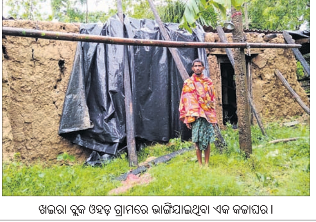
ଖଇରା ରୁକ୍ତ ଓହଡ଼ ଗ୍ରାମରେ ଭାଙ୍ଗିଯାଇଥିବା ଏକ କଳାଘର।

ବାତ୍ୟା ଅମ୍ଫନ ପ୍ରଭାବରେ ଗଛ ଉପୁଡ଼ିବା ତଥା ତାଳ ଭାଙ୍ଗିବା କାରଣରୁ ଖଇରା ରୁକ୍ତରେ ବ୍ୟାପକ କ୍ଷୟକ୍ଷତି ଘଟିଛି। ବହୁ ଗ୍ରାମର ଅନନ୍ତ ସାମଲଙ୍କ ଘର ଛପର ଭାଙ୍ଗି ପଡ଼ିଥିବା ବେଳେ ବିଦ୍ୟୁତ ଖୁଣ୍ଟ ମଧ୍ୟ ଭାଙ୍ଗି ରାସ୍ତାରେ ପଡ଼ିଛି। ସେହିଭଳି ବଡ଼ ବଡ଼ ଗଛ ଭାଙ୍ଗି ରାସ୍ତା ଉପରେ ପଡ଼ିବା କାରଣରୁ ଯୋଗାଯୋଗ ବାଧାପ୍ରାପ୍ତ ହୋଇଛି। ଅଭ୍ୟୁତପୁର ପଞ୍ଚାୟତ ଓହଡ଼ ଗ୍ରାମର ଦାମୋଦର କରଙ୍କ ପତ୍ନୀ ଚାଳଘର ପବନରେ ଭଗ୍ନିତ ହୋଇଥିବା ବେଳେ ବାସବାସୀ ହୋଇପଡ଼ିଛନ୍ତି। ସେହିଭଳି ଗଛ ଭାଙ୍ଗିପଡ଼ିବା କାରଣରୁ ବଡ଼ ପଡ଼ି ଅନେକ ଦୋକାନ ଗୃହ ମଧ୍ୟ ନଷ୍ଟ ହୋଇଛି। ପବନ କମିବା ପରେ କ୍ଷୟକ୍ଷତି ଆକଳନ କରାଯିବ ବୋଲି ଗ୍ରାମର ନନ୍ଦକିଶୋର ମାଝି, ମାଖନପୁର ୩ ସଦସ୍ୟଙ୍କୁ ବାତ୍ୟାଖଣ୍ଡ ସ୍ଥଳକୁ ସ୍ଥାନାନ୍ତର ପାଇଁ ଦାବି କରାଯାଇଛି। ଏହାଛଡ଼ା ଗଣ୍ଡବେଟ ବଜାରରେ ଗଛ ପଡ଼ି ଅନେକ ଦୋକାନ ଗୃହ ମଧ୍ୟ ନଷ୍ଟ ହୋଇଛି। ପବନ କମିବା ପରେ କ୍ଷୟକ୍ଷତି ଆକଳନ କରାଯିବ ବୋଲି ଗ୍ରାମର ନନ୍ଦକିଶୋର ମାଝି, ମାଖନପୁର ୩ ସଦସ୍ୟଙ୍କୁ ବାତ୍ୟାଖଣ୍ଡ ସ୍ଥଳକୁ ସ୍ଥାନାନ୍ତର ପାଇଁ ଦାବି କରାଯାଇଛି।