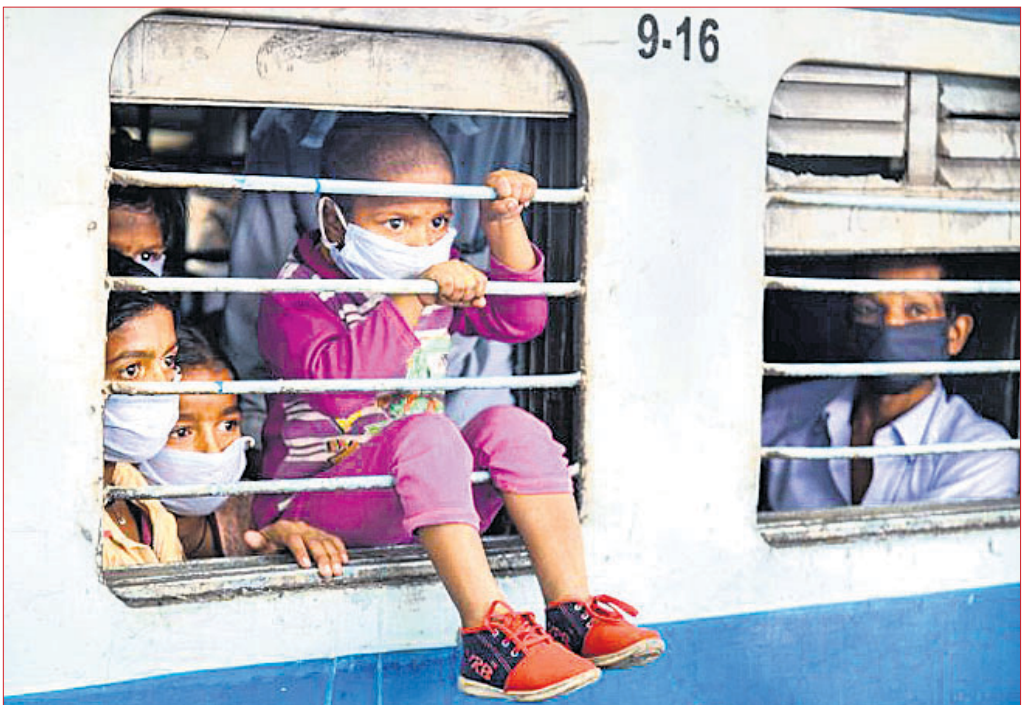
ଡେହରାଡୁନରୁ ବିହାର ଯାଉଥିବା ଟ୍ରେନ୍ରେ ଘରୁକୁ ଫେରୁଛନ୍ତି ପ୍ରବାସୀ।

ରହିଛନ୍ତି। ଯଦି ୧୯.୮୦ ଲକ୍ଷ ଲୋକ ପୁଣ୍ୟହୋଇ ଘରକୁ ଫେରିଛନ୍ତି, ତଥାପି ଦେଖିବାକୁ ମିଳୁଥିବା ବେଳେ ୧୭୨ ଜଣ ପ୍ରାଣ ହରାଇଛନ୍ତି। ଏଥିରେ ରୁଷିଆ ଓ ବ୍ରାଜିଲରେ ଉଚ୍ଚ ସଂକ୍ରମଣ ଯୋଗୁ ପରିସ୍ଥିତି ଜଟିଳ ରୂପ ଧାରଣ କରିଛି।