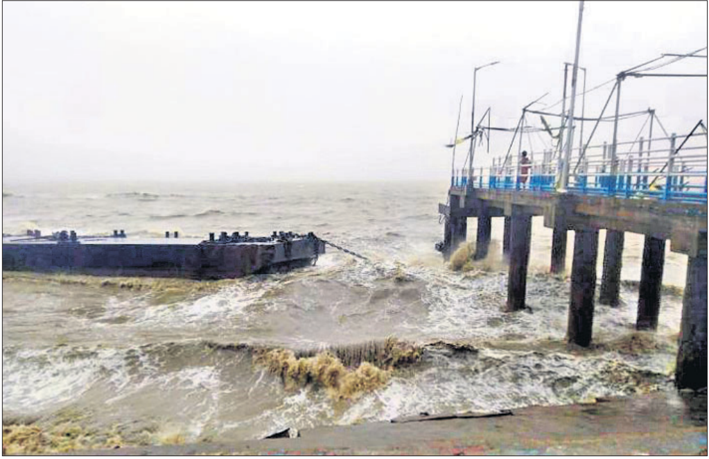
ବାଦ୍ୟରେ ଦକ୍ଷିଣ ୨୪ ପ୍ରଗଣା ଜିଲାର ବଖାଲିଠାରେ ଥିବା କଳୁବେରିଆ ଜେଟା ଭୁବ୍ଧି ପଡ଼ିଛି।