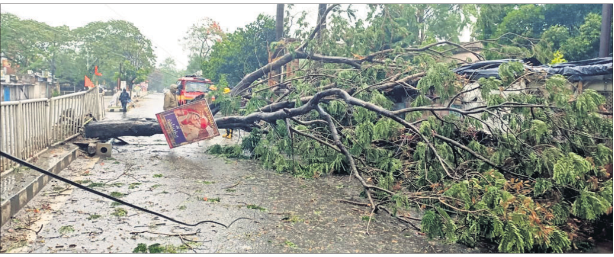
ଭଦ୍ରକ ସହରର ଏକ ରାସ୍ତାରେ ଗଛ ପଡ଼ି ଅବରୋଧ ହୋଇଛି।

ବାତ୍ୟା 'ଅମ୍ଫନ'କୁ ନେଇ ଭଦ୍ରକ ଜିଲ୍ଲା ବଡ଼ ରୁକ୍ତବାସୀ ଭୟଭୀତ ଥିବା ବେଳେ ଏହାର ମୁକାବିଲା ନେଇ ରୁକ୍ତ ପ୍ରଶାସନ ପକ୍ଷରୁ ପଦକ୍ଷେପ ଗ୍ରହଣ କରାଯାଇଛି। ବୁଧବାର ପୂର୍ବାହ୍ନ ୧୨ଟା ପୂର୍ବା ରୁକ୍ତର ବିଭିନ୍ନ ବିଦ୍ୟାଳୟ, ପଞ୍ଚାୟତ ଗୃହ, ବନ୍ୟା ଆଶ୍ରୟସ୍ଥଳ ରୂପରେ ଲୋକମାନଙ୍କୁ ଥଇଥାନ କରାଯାଇଛି। ବିଟିପୁର ଲୋକଙ୍କୁ ଥଇଥାନ କରାଯାଇଛି। ସମଗ୍ର ପଞ୍ଚାୟତର ହଳଦି ପୁରୀ ପ୍ରାଥମିକ ବିଦ୍ୟାଳୟ, ବଡ଼ମହାବିଗୋଠ ପଞ୍ଚାୟତର ହରିପୁର ପ୍ରାଥମିକ ବିଦ୍ୟାଳୟ, କୁଆଁଶମଢ଼ିଆ ଉଚ୍ଚ ପ୍ରାଥମିକ ବିଦ୍ୟାଳୟ, ରାମପୁର ପଞ୍ଚାୟତର ଚନ୍ଦ୍ରନାଥପୁର ପ୍ରାଥମିକ ବିଦ୍ୟାଳୟ, କୌଶଲ୍ୟା ନୋଡାଲ ଉଚ୍ଚ ବିଦ୍ୟାଳୟ, ଚାରିଗାଁ ପଞ୍ଚାୟତର ବହୁପୁରୀ ବନ୍ୟା ଆଶ୍ରୟସ୍ଥଳ ସମେତ କେନ୍ଦୁଆପଦା, ଗୋଟଗାଁ, ଛୟାକିଆ ଆଶ୍ରୟସ୍ଥଳ ରୂପରେ ଲୋକମାନଙ୍କୁ ଥଇଥାନ କରାଯାଇଛି। ବିଟିପୁର ଲୋକଙ୍କୁ ପାଇଁ ରୁକ୍ତ ପ୍ରଶାସନ ପକ୍ଷରୁ ରକ୍ଷା ଖାତ୍ୟର ବ୍ୟବସ୍ଥା କରାଯାଇଛି।