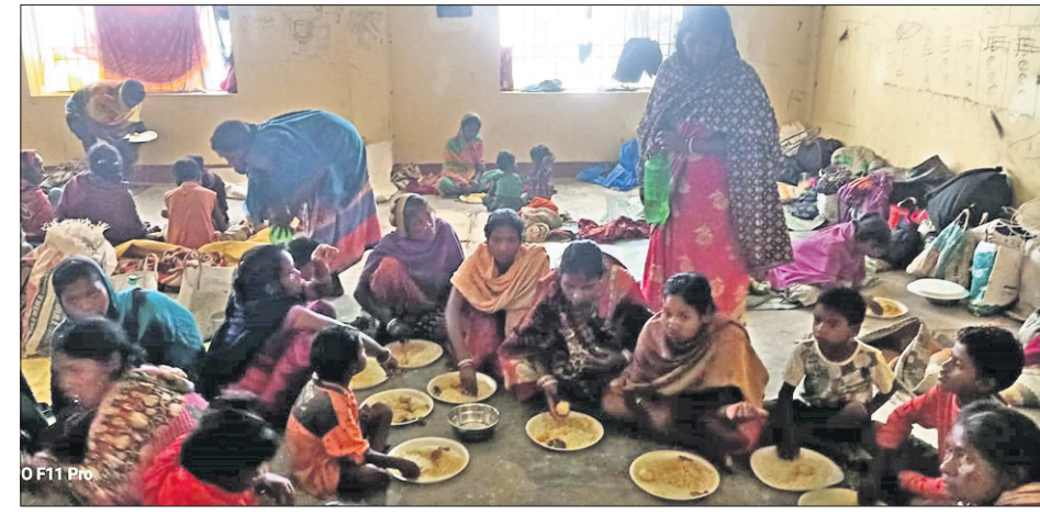
ବାଲେଶ୍ୱର ଜିଲା ଚାନ୍ଦିପୁର ବାତ୍ୟା ଆଶ୍ରୟସ୍ଥଳରେ ଲୋକଙ୍କୁ ରନ୍ଧାଖାଦ୍ୟ ଦିଆଯାଉଛି।