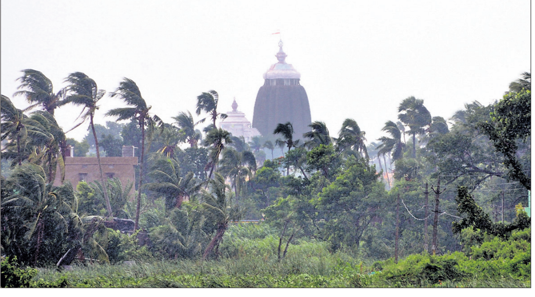
ପୁରୀରେ 'ଅଞ୍ଚଳ' ପ୍ରଭାବରେ ହେଉଥିବା ପବନ।