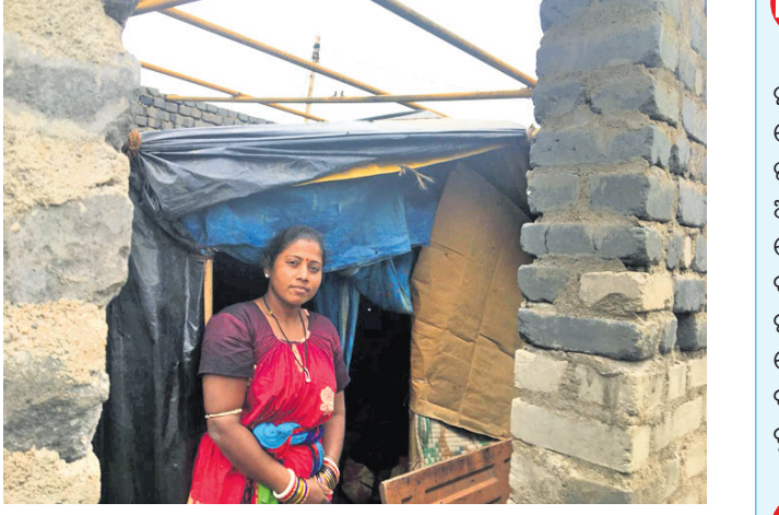
ବାତ୍ୟାରେ ପ୍ରଭାବିତ ହୋଇଥିବା ବିସ୍ଥାପିତ ପରିବାର ପାଇଁ ତଳେ ଆଶ୍ରୟ ଦେଇଛନ୍ତି।

'ସରକାର ବସ୍ତି ହେଇଯାଇଛନ୍ତି। ତାଙ୍କୁ ଆଉ କିଛି ଶୁଭୁଚି। ଚାରି ପୁରୁଷର ଭିତାମାଟିରୁ ତଡ଼ି ଆମକୁ କଲକଳ କରୁଛନ୍ତି। ମଙ୍ଗଳବାର ରାତିରୁ ଅନେକଙ୍କ ଘରେ ବୁଲି ଜଳିନି। ପିଲା ସବୁ ଉପାସରେ। ବିଷୁବ ଖାଲ ଦିନଟା ସରିଲା। ନଦୀକୂଳରେ ବହୁତ ହତସ୍ତ ହେଲେଣି। ଉଚ୍ଛ୍ୱେଦ, ଲକ୍ଷ୍ମୀଭାଗ୍ୟ ଯୋଗୁଁ କଷ୍ଟରେ ଥିଲୁ। ଏବେ ଅମ୍ଫନ ବୋଧେ ଉପରେ ନକିତା ବିଡ଼ା ଭଳି ହେଲା।' ଏହା ହେଉଛି ନିମପୁରସ୍ଥିତ ମହାନଦୀ କୂଳରେ ରହୁଥିବା ବିସ୍ଥାପିତ ବସ୍ତିବାସିନ୍ଦାଙ୍କ କ୍ଷୋଭ। ଘର କରିବା ପାଇଁ ଜାଗା ଆଉ ଟଙ୍କା ମିଳିଛି ସତ, ହେଲେ ବାସ୍ତବ ଚିତ୍ର ସମ୍ପୂର୍ଣ୍ଣ ଭିନ୍ନ ଓ ଯନ୍ତ୍ରଣାଦାୟକ। ସେମାନେ ଛାଡ଼ି ନ ଥିବା ଘରେ ରହୁଛନ୍ତି। ମାସେ ହେବ ଖରା ସହିବା ପରେ ଏବେ ଝଡ଼କୁ ମୁଣ୍ଡ ପାଟି ଗ୍ରହଣ କରିଛନ୍ତି। ଏସବୁର ମେଡିକାଲ କଲେଜ ଓ ହସ୍ପିଟାଲକୁ ବିଶ୍ୱସ୍ତରାୟ କରାଯିବା ପରିପ୍ରେକ୍ଷାରେ ତାଳବନ୍ଧା କେନାଲ ପାର୍ଶ୍ୱରୁ ୬ ଆକିଆ ରାସ୍ତାରେ ପରିଣତ କରାଯିବ। ଏଥିପାଇଁ କେନାଲ ପାର୍ଶ୍ୱ ଓ ଏହାର ଆଖପାଖ ବସ୍ତିକୁ ପର୍ଯ୍ୟାୟକ୍ରମେ ଉଚ୍ଛ୍ୱେଦ କରାଯାଇଛି। ଉଚ୍ଛ୍ୱେଦ ପରେ ଏହି ବସ୍ତିବାସିନ୍ଦାଙ୍କୁ ନିମପୁରସ୍ଥିତ