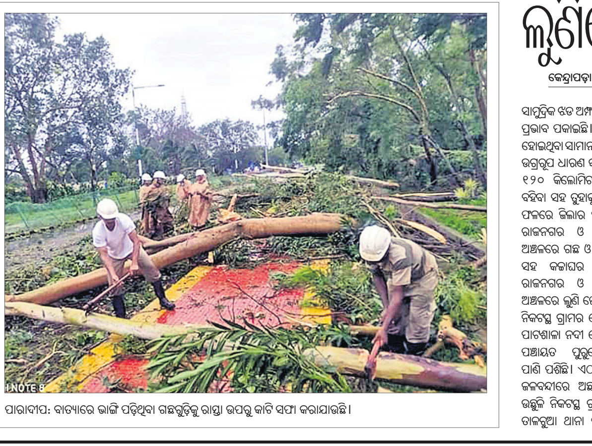
ପାରାଦୀପ: ବାତ୍ୟାରେ ଭାଙ୍ଗି ପଡ଼ିଥିବା ଗଛଗୁଡ଼ିକୁ ରାସ୍ତା ଉପରୁ କାଟି ସଫା କରାଯାଇଛି ।