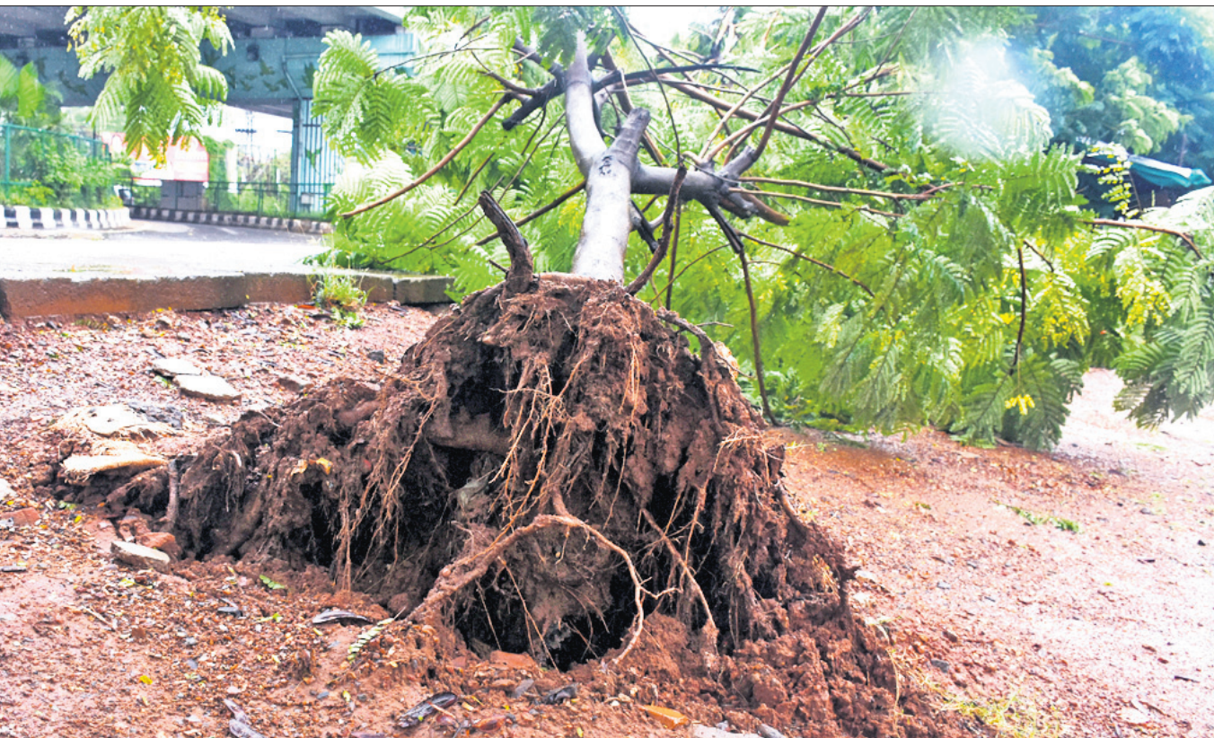
ଭୁବନେଶ୍ୱର ଆଗାଧ୍ୟ ବିହାର ଛକରେ ପବନ ଯୋଗୁ ଉପୁଡ଼ି ପଡ଼ିଥିବା ଗଛ।