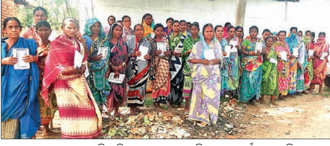
କେନ୍ଦୁପଡ଼ା ତୋଳାଲି ପରିଷଦ ପତ୍ର ଦେଖାଇ ବିକ୍ଷୋଭ ପ୍ରଦର୍ଶନ କରୁଛନ୍ତି।