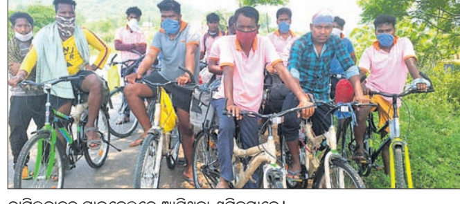
ତାମିଲନାଡୁରୁ ସାଇକେଲରେ ଆସିଥିବା ଶ୍ରମିକମାନେ।