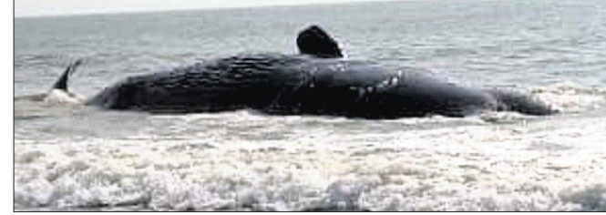
୬ଟି ଅମ୍ଳ ଏହି ସ୍ଥାନ ଦେଇ ଅତିକ୍ରମ କରିଛି। ଏହା ପ୍ରଭାବରେ ତିମି ମୃତ୍ୟୁ ହୋଇଥାଇପାରେ। ତିମି ବିଶାଦଦେଇ ସହ ଯୋଗାଯୋଗ କରାଯାଇ ମୃତ୍ୟୁର କାରଣ ଖୋଜାଯିବ ବୋଲି ସେ କହିଛନ୍ତି।