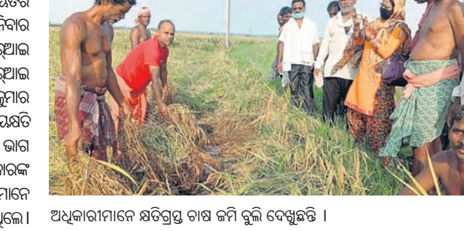
ଅଧିକାରୀମାନେ କ୍ଷତିଗ୍ରସ୍ତ ଚାଷ ଜମି ବୁଲି ଦେଖୁଛନ୍ତି।

ବାଟ୍ୟା ପ୍ରଭାବରେ ରେମୁଣା ବ୍ଲକ୍ ତୁଣ୍ଡୁରା ପଞ୍ଚାୟତର ୩୦ଏକର ଚାଷ ଜମି ଉଚ୍ଛ୍ଵେଦିତ ହୋଇଛି। ଶନିବାର କୃଷି ଅଧିକାରୀ କ୍ଷୟକ୍ଷତି ଆକଳନ କରିଥିଲେ। ପାଖାପାଖି ୮୦୦୦ ଟନ ଚାଷ ଧାନ ନଷ୍ଟ ହୋଇଛି। ଏଥିପାଇଁ ଚାଷୀମାନଙ୍କୁ ସରକାରଙ୍କ ତରଫରୁ ତୁରନ୍ତ ସାହାଯ୍ୟ କରିବା ପାଇଁ ଚାଷୀମାନେ ସରକାରୀ ଅଧିକାରୀଙ୍କୁ ନିବେଦନ କରିଥିଲେ।