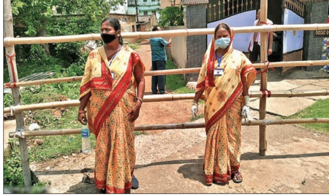
ଯାକପୁରରୋଡର ବାଣୀପାଣି ସାହିକୁ ଅବରୋଧ କରାଯାଇଛି।

ମହାନାମା କରୋନା ସଂକ୍ରମଣ ଦିନକୁ ଦିନ ବଢ଼ିଚାଲିଛି। ଶନିବାର ୧୪ ଜଣ ନୂତନ କରୋନା ସଂକ୍ରମିତ ଚିହ୍ନଟ ହେବା ପରେ ଯାକପୁର ଜିଲ୍ଲାରେ ସଂକ୍ରମିତ ସଂଖ୍ୟା ୨୩୯ରେ ପହଞ୍ଚିଛି। କଳିଙ୍ଗନଗର ଶିଳ୍ପାଞ୍ଚଳର ପୁଞ୍ଜଶାଳା ଭାବେ ପରିଚିତ ବ୍ୟାସନଗର ଯୁନିସିପାଲିଟିକୁ ପ୍ରଥମକରି କରୋନା ସଂକ୍ରମଣ ବ୍ୟାପିବାପରେ ସହରବାସୀଙ୍କ ଚିନ୍ତା ବଢ଼ିଯାଇଛି। ଗତ ୧୨ ତାରିଖରୁ ପ୍ରଶାନ୍ତିନିକୟମରୁ ଫେରିବା ପରେ ସରକାରୀ କ୍ଵାରାଣ୍ଟାଇନ୍‌ରେ ନ ରହି ହୋମ୍ କ୍ଵାରାଣ୍ଟାଇନ୍‌ରେ ରହୁଥିବା ବ୍ୟାସନଗର ଯୁନିସିପାଲିଟି ସାପରଡ଼ିଆର ୬୪ ଓ ୮୩ ବର୍ଷୀୟ ପୁରୁଷ ଏବଂ ବାଣୀପାଣି ସାହିର ୪୮ ବର୍ଷୀୟ ପୁରୁଷ କରୋନା ସଂକ୍ରମିତ ହୋଇଛନ୍ତି। ସେମାନଙ୍କୁ କାର୍ଯ୍ୟକାରୀ କ୍ଵାରାଣ୍ଟାଇନ୍‌ରେ ରଖାଯାଇ ନ ଥିଲା ବୋଲି ସହରବାସୀଙ୍କ ମଧ୍ୟରେ ଉଦ୍‌ବେଗ ପ୍ରକାଶ ପାଇଛି। ଅନ୍ୟପକ୍ଷରେ ଏହି ସଂକ୍ରମିତ ବ୍ୟକ୍ତିଙ୍କ ସଂସ୍ପର୍ଶରେ ଆସିଥିବା ମୋଟ ୩୪ ଜଣଙ୍କ ସ୍ଵାସ୍ଥ୍ୟ ସଂଗ୍ରହ କରାଯାଇ ପରୀକ୍ଷା ପାଇଁ ପଠାଯିବା ସହ ସମ୍ପୂର୍ଣ୍ଣ ଅଞ୍ଚଳକୁ ଅବରୋଧ କରାଯାଇଛି। ତେବେ ସଂକ୍ରମିତ ବ୍ୟକ୍ତିଙ୍କ ସମ୍ପର୍କୀୟ ବାହାରେ ବୁଲାଇ ଦିଆଯିବ ନାହିଁ ବୋଲି କରୋନା ସୂଚନା ମିଳିଛି। ଏହାବ୍ୟତୀ ପ୍ରଶାନ୍ତିନିକୟମରୁ ଫେରିବା ପାଇଁ ନିର୍ଦ୍ଦେଶ ଦିଆଯାଇଛି। ଏହି ସମୟରେ ମସ୍କିନ୍ ଓ ଇଞ୍ଚାକୁ ସାଧାରଣ ଜନତାଙ୍କ ପ୍ରଦେଶ ଉପରେ କଡ଼ା କଟକଣା ଜାରି କରାଯାଇଛି।