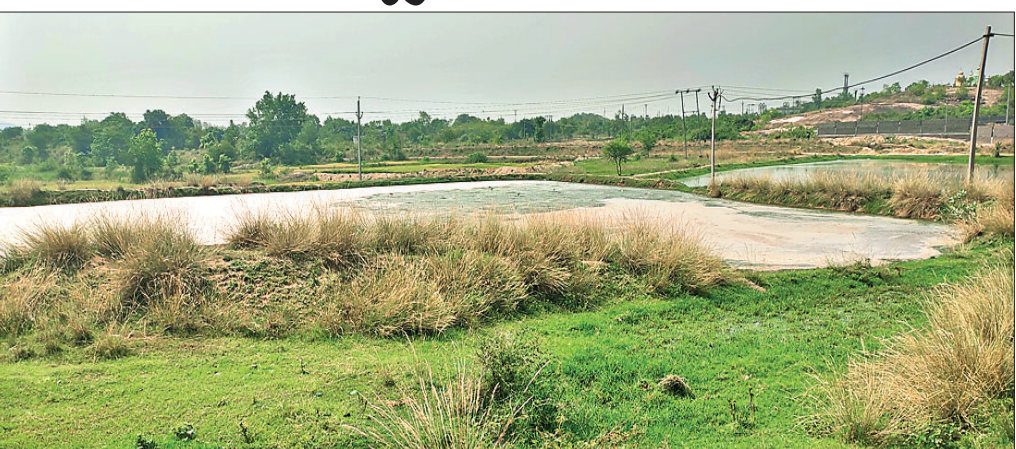
ମିଲ୍ ସମ୍ମୁଖରେ କୁଳକୁତ ରାଖତ ଓ ପ୍ରଦୃଷ୍ଟ ପାଣି।