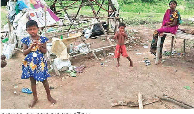
ବାଟ୍ୟାରେ ନଷ୍ଟ ହୋଇଯାଇଥିବା କୁଡ଼ିଆ।