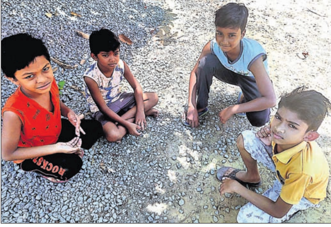
ବିନିକା ପାଠ୍ୟପୁସ୍ତକ ଅଭାବ ଚିନ୍ତାରେ ଅଭିଭାବକ

କରୋନାକୁ ନେଇ ରାଜ୍ୟର ସମସ୍ତ ସରକାରୀ ଓ ବେସରକାରୀ ଶିକ୍ଷାନୁଷ୍ଠାନ ଛୁଟି ୧୭ ଯାଏ ବନ୍ଦ ରହିବା ଲାଗି ସରକାରୀ ନିର୍ଦ୍ଦେଶ ରହିଛି । ତଦନୁଯାୟୀ ପୁସ୍ତକଗୁଡ଼ିକ ଜିଲ୍ଲା ବିନିକା ଅଞ୍ଚଳର ସରକାରୀ ଓ ଘରୋଇ ସ୍କୁଲ ବନ୍ଦ ରହିଛି । ଏହାମଧ୍ୟରେ ସରକାରୀ, ଘରୋଇ ଛାତ୍ରଛାତ୍ରୀଙ୍କ ପାଇଁ ଅନଲାଇନ୍, ହାର୍ଡ୍‌କପି ଆଦି ଓ ଦୂରଦର୍ଶନ ମାଧ୍ୟମରେ ଶିକ୍ଷା ଗ୍ରହଣ କରିବା ବ୍ୟବସ୍ଥା ହୋଇଛି । ମାତ୍ର ଏହିସବୁ ବ୍ୟବସ୍ଥାକୁ ବିନିକା ଅଞ୍ଚଳର ମଧ୍ୟବିତ୍ତ ଓ ଗରିବ ଶ୍ରେଣୀର ଛାତ୍ରଛାତ୍ରୀଙ୍କୁ ବଞ୍ଚିତ ହୋଇଛି । ଅପରପକ୍ଷରେ ପାଠ୍ୟପୁସ୍ତକ ଅଭାବରୁ ଘରୋଇ ସ୍କୁଲ ଛାତ୍ରଛାତ୍ରୀଙ୍କ ଶିକ୍ଷାଗ୍ରହଣ ଜଟିଳ ହେଉଛି । ବିନିକାରେ ୧୪ଟି ଘରୋଇ ଶିକ୍ଷାନୁଷ୍ଠାନ ରହିଛି । ମାତ୍ର ଏହିସବୁ ଶିକ୍ଷାନୁଷ୍ଠାନରେ ପ୍ରାୟ ୫ ହଜାରରୁ ଊର୍ଦ୍ଧ୍ୱ ବିନିକା ଅଧ୍ୟୟନ କରୁଛନ୍ତି । ପାଠ୍ୟପୁସ୍ତକ ବିଏସ୍‌ଲ ସିଲାଇସ୍ ଅନୁଯାୟୀ ଓଡ଼ିଆ ମାଧ୍ୟମ ପାଇଁ ସରକାରୀ ସ୍କୁଲ, ଘରୋଇ ସ୍କୁଲରେ ପ୍ରଚଳିତ ହୁଏ ।