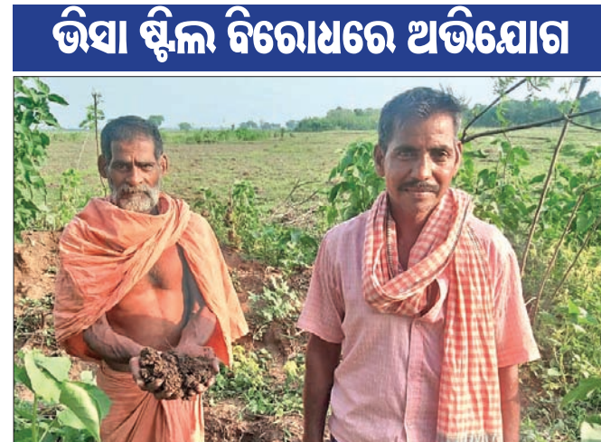
ଚାଷଜମିରେ କଳାମାଟି ଦେଖାଇଛନ୍ତି ଚାଷୀ।

କଳିଙ୍ଗନଗର ଭିକା ଷ୍ଟିଲ କାରଖାନାର ବିଷାକ୍ତ ପାଣି ଯୋଗୁ ଆଖପାଖ ଅଞ୍ଚଳର ପ୍ରାୟ ୨୦୦ ଏକର ଜମି ପଡ଼ିଆ ପଡ଼ିଛି। ମାଟି ଉର୍ବରତା ବୃଦ୍ଧିରେ ସହାୟକ ହେଉଥିବା ଅଶୁକ୍ଳାବ ଏହି ବିଷାକ୍ତ ପାଣି ଯୋଗୁ ନଷ୍ଟ ହେଉଥିବାରୁ ଏକଳ ପରିସ୍ଥିତି ସୃଷ୍ଟି ହୋଇଛି। ଚାଷଜମିର ଉତ୍ପାଦନ କ୍ଷମତା କ୍ରମଶଃ କମିଯିବା ଯାଉଥିବାରୁ ଚାଷୀ ବାଧ୍ୟହୋଇ ଚାଷକାର୍ଯ୍ୟ ଛାଡ଼ି ଦେଇଛନ୍ତି। ଏଭଳି ସର୍ବସାଧାରଣ ସମ୍ପର୍କି ଯତି କରିବା ଅଭିଯୋଗରେ କଳିଙ୍ଗନଗର ପରିବେଶ ସୁରକ୍ଷା ସମିତି ସମେତ ଏକାଧିକ ଚାଷୀ ରାଜ୍ୟ ପ୍ରତ୍ୟକ୍ଷ ନିୟନ୍ତ୍ରଣ ବୋର୍ଡ(ଏସ୍ପିସିବି)ର ଦୃଷ୍ଟି ଆକର୍ଷଣ କରିଛନ୍ତି। ଏହାପରେ ଏସ୍ପିସିବିର ସଦସ୍ୟ ସଚିବ ଗତ ୧୯ ତାରିଖରେ ଯାଜପୁର ଜିଲ୍ଲାପାଳଙ୍କୁ ଭିକା କାରଖାନାର ବର୍ଜ୍ୟପାଣିରେ ଚାଷଜମି କ୍ଷତି ଓ ଚର୍ମାରୋଗ ବ୍ୟାପୁଥିବା ଅଭିଯୋଗ ସମ୍ପର୍କରେ ତଦନ୍ତ କରାଇ ରିପୋର୍ଟ ଦାଖଲ କରିବାକୁ ଜଣାଇଛନ୍ତି। ରାଜ୍ୟରେ ଶିଳ୍ପାୟନକୁ ବିକାଶର ପ୍ରମୁଖ ଆଧାର ଭାବେ ଗ୍ରହଣ କରି ସରକାର ଶିଳ୍ପାୟନକୁ ପ୍ରୋତ୍ସାହିତ କରୁଛନ୍ତି। ଏହାଦ୍ଵାରା କୃଷିର କିପରି ବିକାଶ ଘଟୁଛି ତାହାର ଗୋଟିଏ ପଦ ରୋଟିଏ ପ୍ରମାଣ ଯାଜପୁର ଜିଲ୍ଲାରେ ଲୋକଲୋଚନକୁ ଆସିବାରେ ଲାଗିଛି। ଜିଲ୍ଲାର କଳିଙ୍ଗନଗର ଭିକା ଷ୍ଟିଲ