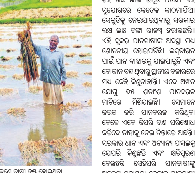
କଣେ ଚାଷୀ ନଷ୍ଟ ହୋଇଥିବା ଧାନଗଛ ଦେଖାଉଛନ୍ତି।