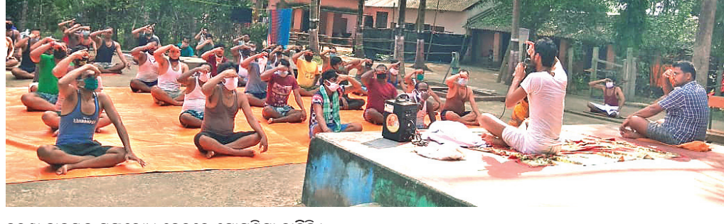
କୁରୁକ୍ଷା ସାଲସ୍କୁଲ ସଙ୍ଘରୋଧ କେନ୍ଦ୍ରରେ ଯୋଗଶିକ୍ଷା ଚାଲିଛି।