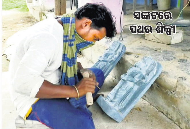
ସଙ୍କଟରେ ପଥର ଶିଳ୍ପୀ

କରୋନା ଭୁତାଣୁ ସଂକ୍ରମଣ ରୋକିବା ଲାଗି ସମସ୍ତ ଦେଶରେ ଏବେ ଲକଡ଼ାଉନ୍ ଘୋଷଣା କରାଯାଇଛି। କାମଧାରୀ ସବୁ ଠିକ୍ ହୋଇଯିବାକୁ ଶ୍ରମିକ, କାରିଗର ଶ୍ରେଣୀର ଲୋକଙ୍କ ଜୀବିକା ଉପରେ ଏହାର ପ୍ରଭାବ ପଡ଼ିଛି। ଦିନକୁ ଦୁଇ ଓକି ଖାଇବା ମଧ୍ୟ ସେମାନଙ୍କ ପାଇଁ କଷ୍ଟକର ହୋଇପଡ଼ିଲାଣି। ଏଭଳି ଦୁର୍ଦ୍ଦିନ ମଧ୍ୟରେ ରହିଛନ୍ତି କେନ୍ଦୁଝର ଜିଲ୍ଲା ଆନନ୍ଦପୁର ଉପଖଣ୍ଡ ଧଳୋଠା ଗ୍ରାମର ପଥରଶିଳ୍ପୀଙ୍କ ପରିବାର। ମୁଣ୍ଡ ଖାଲି ହୁଏତେ ମାରି ନିହାଣ ମୁନରେ ନିର୍ଜୀବ ପଥରକୁ ଜୀବନ୍ତ ରୂପ ଦେଉଥିବା ଏହି ପରିବାର ଉପରେ ପଡ଼ିଛି କରୋନା ଆହାର। ମୂର୍ତ୍ତି ତିଆରି କରି ବିକିଲେ ସେମାନଙ୍କ ପରିବାର ଚଳେ। ମୂର୍ତ୍ତି ବିକ୍ରି ବନ୍ଦ ହୋଇଯାଇଥିବାରୁ ଶିଳ୍ପୀମାନଙ୍କ ପାଇଁ ପରିବାର ଚଳାଇବା କଷ୍ଟକର ହୋଇପଡ଼ିଛି। ବହୁବର୍ଷ ଧରି ଏହି ଗ୍ରାମର ଲୋକମାନେ ପଥର ଖନନ କରି ମୂର୍ତ୍ତି