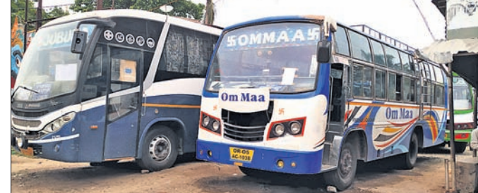
ଆବଶ୍ୟକ ସଂଖ୍ୟକ ଯାତ୍ରୀ ନ ହେବାରୁ ଖାଲି ପଡ଼ିଲା ସିଟ୍

ରାଜ୍ୟ ଘରୋଇ ବସ ମାଲିକ ସଂଘ ନିଷ୍ପତ୍ତି ଅନୁଯାୟୀ ଗୁରୁବାର ବସ ଚଳାଚଳ ଆରମ୍ଭ କରିଛି। ତେବେ ଆବଶ୍ୟକ ସଂଖ୍ୟକ ଯାତ୍ରୀ ନ ହେବାରୁ ସମସ୍ତ ବସ ବନ୍ଦିନାହିଁ। କଟକରୁ ମାତ୍ର ୪ଟି ବସ ଗଡ଼ଜାତକୁ ଯାତ୍ରା କରିଥିବାବେଳେ ଅନ୍ୟ ଜିଲ୍ଲାକୁ ୨ଟି ବସ ଆସିଥିଲା। ସବୁ ବସରେ ଅଧାରୁ ଅଧିକ ସିଟ୍ ଖାଲିପଡ଼ିଥିଲା। ଅନ୍ୟପକ୍ଷରେ ବସରେ ସିଟ୍‌କୁ କେତେକ ଯାତ୍ରୀ ବାବାମବାଡ଼ି ବସଷ୍ଟାଣ୍ଡକୁ ଆସିଥିଲେ। ମାତ୍ର ଷ୍ଟାଣ୍ଡରେ ବସ ନ ଥିବାବେଳେ ସୁତନାକେନ୍ଦ୍ରରେ ତାଲା ଝୁଲୁଥିବା ଦେଖି ନିରାଶ ହୋଇ ଫେରିଥିଲେ। ଦୀର୍ଘଦିନର ବ୍ୟବଧାନ ପରେ ରାଜ୍ୟର ପ୍ରମୁଖ ବସଷ୍ଟାଣ୍ଡ ଭାବେ ଜଣାଶୁଣା ବାବାମବାଡ଼ି ବସଷ୍ଟାଣ୍ଡ ଚଳଚଞ୍ଚଳ ହେବ ବୋଲି ଆଶା କରାଯାଉଥିଲା। ଗୁରୁବାର ଭୋରୁ ବାବାମବାଡ଼ି ଅଞ୍ଚଳରେ ଦୋକାନବନ୍ଦର ଭିତ୍ତିରେ ସରକାରୀ ସହ ଫୋଟୋଗ୍ରାଫିକ୍ ଭିତ୍ତି ଲାଗିଥିଲା। ସହରର ଏହି ପ୍ରମୁଖ ସ୍ଥାନ ଲୋକାରଣ୍ୟ ହେବ ବୋଲି ଛୋଟ