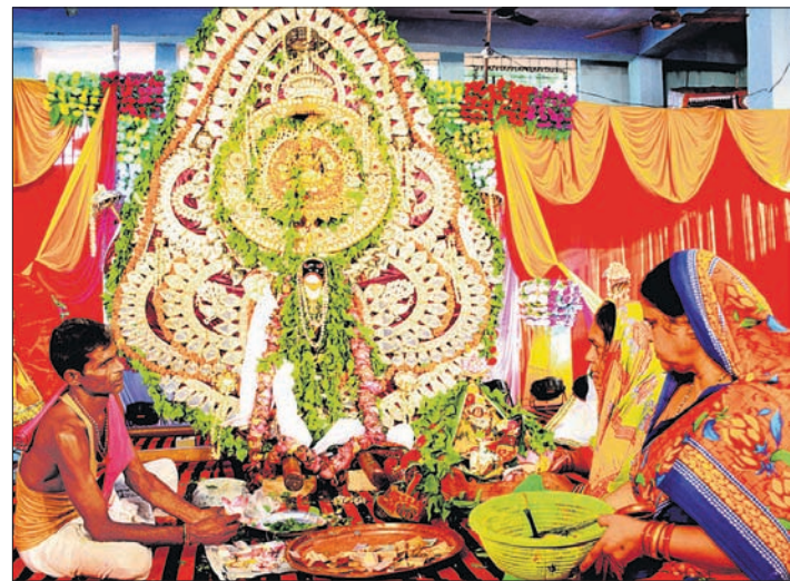
ଗୁରୁବାର ସମ୍ବଲପୁର ନନ୍ଦପଡ଼ା ବାଲୁକେଶ୍ୱର ବାବା ଓ ମାତା ପାର୍ବତୀଙ୍କୁ ଶ୍ରୀକାଳୁମାନେ ଦର୍ଶନ କରିବା ସହ ବନ୍ଦନା କରୁଛନ୍ତି ।