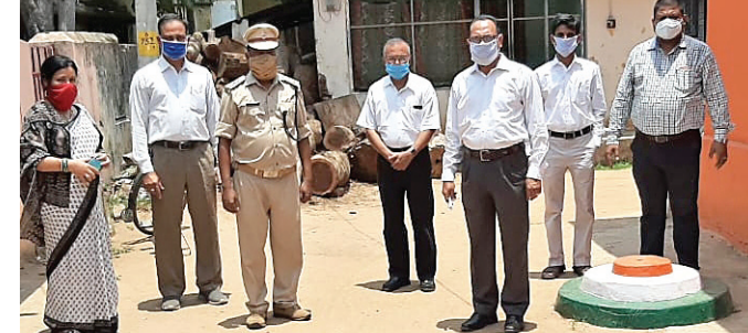
କୋର୍ କମିଟିର ସଦସ୍ୟମାନେ ରାୟଗଡ଼ା ଜେଲ୍ରେ କରୋନା ସୁରକ୍ଷା ଯାଞ୍ଚ କରୁଥିବା ଦିନର ଛବି।

ବୁଝାଇଥିଲେ। ଏଥିସହ ଅନ୍ତରାଳୀୟ ନିୟମିତ ସ୍ୱାସ୍ଥ୍ୟ ପରୀକ୍ଷା କରିବା, ସାମାଜିକ ଦୂରତା ବଜାୟ ରଖିବା ଏବଂ ମାସ୍କ ବ୍ୟବହାର କରିବା ପାଇଁ କେଲ କମିଟି ସଦସ୍ୟମାନେ ଗୁରୁବାର ରାୟଗଡ଼ା ଜେଲ୍ ପରିବର୍ତ୍ତନ କରିଛନ୍ତି। କରୋନା ମୁକାବିଲା ତଥା ଜେଲ୍ରେ ଥିବା ଅନ୍ତରାଳୀୟ ସୁରକ୍ଷା ପାଇଁ କିଭଳି ପଦକ୍ଷେପ ନିଆଯାଇଛି ସେ ବିଷୟରେ କମିଟି ତଦାରଖ କରିଛି। ସେହିପରି କରୋନା ଭୁତାଣୁଠାରୁ କିପରି ସୁରକ୍ଷିତ ରହିବେ, ସେ ନେଇ କମିଟିର ସଦସ୍ୟମାନେ ଅନ୍ତରାଳୀୟମାନଙ୍କୁ