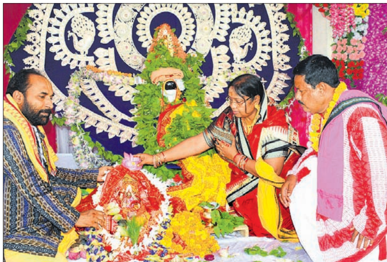
ସମ୍ବଲପୁର ମୁଦିପଡ଼ା ଜାଗେଶ୍ୱର ବାବାଙ୍କୁ ପାର୍ବତୀଙ୍କ ମାତାପିତା କନ୍ୟାଦାନ କରୁଛନ୍ତି ।