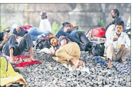
କାରବାର କ୍ଷତିଗ୍ରସ୍ତ ସ୍ଥିତିରେ ରହିଥିବାରୁ ଲୋକଙ୍କ ନିରୁତ୍ସାହିତ ଉପରେ ଗଭୀର ପ୍ରଭାବ ରହିବ।

କରୋନା ଭାରତର ଅର୍ଥ ବ୍ୟବସ୍ଥା ଗଭୀର ଭାବେ କ୍ଷତିଗ୍ରସ୍ତ ହୋଇଛି। କରୋନା ଯୋଗୁଁ ସାରା ଦିଶ୍ୱରେ ପ୍ରାୟ ୪.୯ କୋଟି ଲୋକ ଉତ୍ତର ଦାରିଦ୍ର୍ୟ ସୀମା ରାହିଯିବେ ବୋଲି ଆଶଙ୍କା କରାଯାଇଛି। ସେହିଭଳି ଭାରତରେ ୧.୨ କୋଟି ଲୋକ ଲୋକଙ୍କ ଜୀବିକା ସଙ୍କଟ ସ୍ଥିତିକୁ ଚାଲିଯିବ ବୋଲି ସେକ୍ଟର ଫର ମନିଟରିଂ ଲକ୍ଷ୍ୟାନ୍ଦ ଗଭୀର ପ୍ରଭାବ ରହିବ।