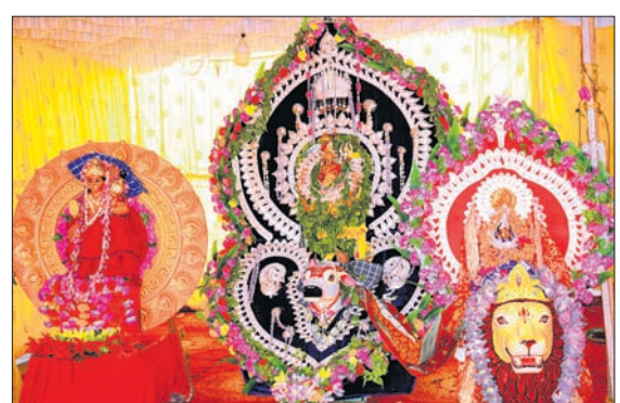
ସମ୍ବଲପୁର ବଡ଼ବଜାର ଶୀତଳେଶ୍ୱର ବାବା ଓ ମାତା ପାର୍ବତୀଙ୍କ ମୁଗଳ ମୂର୍ତ୍ତି ।

ସମ୍ବଲପୁର, ୨୮।୫ (ବୁଧବୋ): କରୋନା କଟକଣା ଯୋଗୁ ଶିବପାର୍ବତୀଙ୍କ ବିବାହ ନିକ୍ଷେପ ମନ୍ଦିରରେ ହୋଇଛି । ସାମାଜିକ ଦୂରତ୍ୱକୁ ଦୃଷ୍ଟିରେ ରଖି ସମସ୍ତ ନୀତିକାଳ କରାଯାଇଛି । ବିବାହ ସମୟରେ ମନ୍ଦିରର ସମସ୍ତ ଗେଟ୍ରେ ତାଲା ଦିଆଯାଇଥିଲା । ଭକ୍ତମାନେ ଭିତରକୁ ଯାଇ ଦର୍ଶନ କରିପାରି ନ ଥିଲେ । କେତେଜଣ ଭକ୍ତ ଗ୍ରୀକ୍ ବାହାରୁ ଦେବଦମ୍ପତିଙ୍କୁ ମୁଣ୍ଡିଆ ମାରୁଥିବା ଦେଖିବାକୁ ମିଳିଥିଲା । ଅନେକ ଭକ୍ତ ଫୁଲ ଓ ବେଲପତ୍ର ଲାଗି କରିବାକୁ ମନ୍ଦିର ପୂଜକ ଏବଂ ପଞ୍ଚିତଙ୍କୁ ଅନୁରୋଧ କରିଥିଲେ । ଅଧିକାଂଶ ଭକ୍ତ ଦେବଦମ୍ପତିଙ୍କ ମୁଗଳ ମୂର୍ତ୍ତି ଦର୍ଶନ କରିବାରୁ ବଞ୍ଚିତ ହୋଇଥିଲେ ।