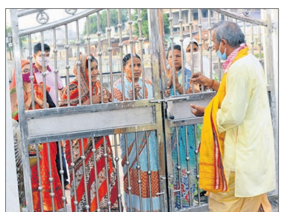
ସମ୍ବଲପୁର ମୁଦିପଡ଼ା ଶିବ ମନ୍ଦିର ଗ୍ରାମ୍ ବାହାରେ ଭକ୍ତମାନେ ଦର୍ଶନ ପାଇଁ ଅପେକ୍ଷା କରିଛନ୍ତି ।

ସମ୍ବଲପୁର, ୨୮।୫ (ବୁଧବୋ): କରୋନା କଟକଣା ଯୋଗୁ ଶିବପାର୍ବତୀଙ୍କ ବିବାହ ନିକ୍ଷେପ ମନ୍ଦିରରେ ହୋଇଛି । ସାମାଜିକ ଦୂରତ୍ୱକୁ ଦୃଷ୍ଟିରେ ରଖି ସମସ୍ତ ନୀତିକାଳ କରାଯାଇଛି । ବିବାହ ସମୟରେ ମନ୍ଦିରର ସମସ୍ତ ଗେଟ୍ରେ ତାଲା ଦିଆଯାଇଥିଲା । ଭକ୍ତମାନେ ଭିତରକୁ ଯାଇ ଦର୍ଶନ କରିପାରି ନ ଥିଲେ । କେତେଜଣ ଭକ୍ତ ଗ୍ରୀକ୍ ବାହାରୁ ଦେବଦମ୍ପତିଙ୍କୁ ମୁଣ୍ଡିଆ ମାରୁଥିବା ଦେଖିବାକୁ ମିଳିଥିଲା । ଅନେକ ଭକ୍ତ ଫୁଲ ଓ ବେଲପତ୍ର ଲାଗି କରିବାକୁ ମନ୍ଦିର ପୂଜକ ଏବଂ ପଞ୍ଚିତଙ୍କୁ ଅନୁରୋଧ କରିଥିଲେ । ଅଧିକାଂଶ ଭକ୍ତ ଦେବଦମ୍ପତିଙ୍କ ମୁଗଳ ମୂର୍ତ୍ତି ଦର୍ଶନ କରିବାରୁ ବଞ୍ଚିତ ହୋଇଥିଲେ ।