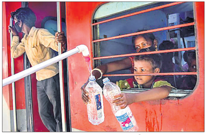
ଉତ୍ତରପ୍ରଦେଶର ମଥୁରା ରେଳଷ୍ଟେସନରେ ପହଞ୍ଚୁଥିବା ଶ୍ରମିକ ଯୋଗାଇ ଦେବା ପାଇଁ ପାନୀୟ ଜଳ ବିତାଯାଉଛି।

ଦାଦନ ଶ୍ରମିକମାନେ ସହରରୁ ନିଜ ରାଜ୍ୟକୁ ଫେରିବାବେଳେ ଟ୍ରେନ୍ ଓ ବସ ଯାତ୍ରା ପାଇଁ ଟଙ୍କା ଖର୍ଚ୍ଚ କରିବାକୁ ପଡ଼ିବ ନାହିଁ। ସେହିପରି ଯାତ୍ରାବେଳେ ଖାଦ୍ୟ ଓ ପାନୀୟ ଜଳ ମଧ୍ୟ ରାଜ୍ୟ ସରକାର ଯୋଗାଇଦେବେ। ଏନେଇ ପୁସ୍ତକାଳୟ ଗୁରୁବାର ରାଜ୍ୟ ସରକାରମାନଙ୍କୁ ଅଭିନୀତ ନିର୍ଦ୍ଦେଶ ଦେଇଛନ୍ତି। କରୋନା ମୁକାବିଲା ପାଇଁ ଜାରି ଲକଡାଉନ୍ ଯୋଗୁଁ ଦେଶର କୋଟି କୋଟି ପ୍ରବାସୀ ବଡ଼ ବଡ଼ ସହରରେ ଜୀବିକା ହରାଇବା ପରେ ନିଜ ରାଜ୍ୟକୁ ଫେରିବାରେ ଲାଗିଛନ୍ତି। ଅନେକ ସ୍ଥାନରେ ଏବେ ମଧ୍ୟ ବହୁ ସଂଖ୍ୟକ ଦାଦନ ଶ୍ରମିକ ଫିଲ୍‌ରେ ରହିଛନ୍ତି। ସେମାନେ ବିଭିନ୍ନ ସମୟରେ ହଜିରା ହେଉଥିବା ଦେଖିବାକୁ ମିଳୁଛି। ପୁସ୍ତକାଳୟ ଏନେଇ ଗୁରୁବାର ଟିକାସମ୍ବନ୍ଧ କରୁଛନ୍ତି। କୃଷି ସଂଗ୍ରହ କରୁଥିବା ଅଧିକାରୀଙ୍କୁ ଅଧିକାରୀଙ୍କୁ ତଥା କୃଷି ସଂଗ୍ରହ କୋଳି ଏବଂ ଏମ୍. ଆର୍. ଶାସ୍ତ୍ରୀଙ୍କୁ ନେଇ ଗଠିତ ଖଣ୍ଡପୀଠ କହିଛନ୍ତି, ଦାଦନ ଶ୍ରମିକମାନେ ନିଜ ରାଜ୍ୟକୁ ଫେରିବାକୁ ଚାହୁଁଛନ୍ତି। ସେମାନଙ୍କୁ ଟ୍ରେନ୍ କିମ୍ବା ବସ ଯାତ୍ରା ଖର୍ଚ୍ଚ ନିଆଯିବ ନାହିଁ। ସେମାନଙ୍କୁ ସମ୍ପୂର୍ଣ୍ଣ ରାଜ୍ୟ ଓ କେନ୍ଦ୍ରଶାସିତ ଅଞ୍ଚଳର ସରକାର ବା ପ୍ରଶାସନ ମାରଣରେ ଖାଦ୍ୟ ଖାଦ୍ୟ ପାନୀୟ ଯୋଗାଇଦେବେ। ଏହାସହ କେଉଁ ସ୍ଥାନରେ ମାରଣ ଖାଦ୍ୟ