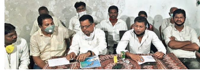
ଖବରଦାତା ସମ୍ମିଳନୀରେ କଂଗ୍ରେସ ନେତାମାନେ ।