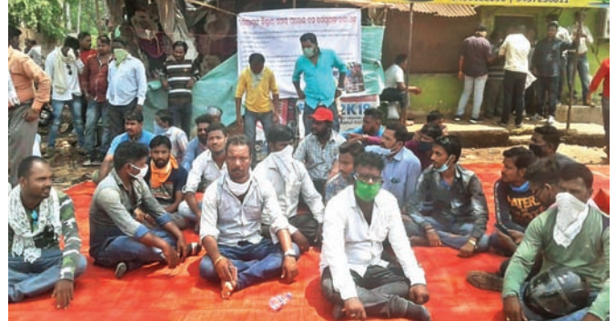
ବସ୍ କର୍ମଚାରୀମାନେ ଧାରଣାରେ ବସିଛନ୍ତି ।

ଲକ୍ଷ୍ମୀଭଗନ କୋହଳ କରାଯାଇ ୧ରୁ ବସ୍ ଚାଲିବା ନେଇ ସରକାର ନିଷ୍ପତ୍ତି ନେଇଥିଲେ । ମାତ୍ର କୋରାପୁଟ ଜିଲ୍ଲାରେ ଘରୋଇ ବସ୍ ଚାଲିବା ନେଇ ଅନିଷ୍ଠିତତା ଦେଖାଦେଇଛି । ଜିଲ୍ଲାର ସମସ୍ତ ଘରୋଇ ବସ୍ କର୍ମଚାରୀ ବିକ୍ଷୋଭ ପ୍ରଦର୍ଶନକରି କନ୍ୟପୁର ପୁରୁଣା ବସ୍ଷ୍ଟାଣ୍ଡର ଟିକେଟ କାଉଣ୍ଟରଠାରେ ଧାରଣା ଦେଇଛନ୍ତି । ଲକ୍ଷ୍ମୀଭଗନ ଯୋଗୁ ଆମେ ବସ୍ରେ କାର୍ଯ୍ୟରତ କର୍ମଚାରୀ ପ୍ରଶାସନଠାରୁ କୌଣସି ସହାୟତା ପାଇନାହିଁ । ସରକାର ମାଲିକମାନଙ୍କ ଦାବି ପୂରଣ କରି ବସ୍ ଚଳାଚଳ ନିର୍ଦ୍ଦେଶ ଦେଇଛନ୍ତି । ବସ୍ ଚାଲିଲେ ମାଲିକମାନେ ଟଙ୍କା ପାଇବେ, ଏବଂ କାର୍ଯ୍ୟାଳୟ ପାଇବେ, ଜନସାଧାରଣ ଉପକୃତ ହେବେ । ଏପରି ସ୍ଥିତିରେ କର୍ମଚାରୀମାନେ ନିଜ ସୁରକ୍ଷା ପାଇଁ ପ୍ରସ୍ତୁତ ରହିଛନ୍ତି । ବସ୍କୁ ସାମିତାଳକ୍ କରିବା, ଭୁବିରେ ଥାଇ ଯଦି କୌଣସି