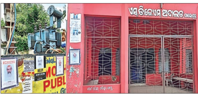
ଷ୍ଟେଶନହଲ ଓ ଏମ୍ପିଙ୍କୁ ଏମ୍ପି ଅବାଲତ ସମ୍ମୁଖରେ ଲାଗିଥିବା କେନ୍ଦ୍ରମନ୍ତ୍ରୀଙ୍କ ନିଖୋଜ ପୋଷ୍ଟର।

ବାଲେଶ୍ଵର ସହରର ବିଭିନ୍ନ ସ୍ଥାନରେ ରବିବାର ପୂର୍ବାହ୍ନରେ କେନ୍ଦ୍ର ଅଣ୍ଟା କ୍ଷୁଦ୍ର ଏବଂ ମଧ୍ୟମରାଜ୍ୟର, ମଧ୍ୟ, ପ୍ରାଣାଦିକାଶ ଏବଂ ଗୋପାଳନରାଷ୍ଟ୍ରମନ୍ତ୍ରୀ ତଥା ବାଲେଶ୍ଵର ଏମ୍ପି ପ୍ରତାପ ଷଡ଼ଙ୍ଗୀଙ୍କ ନିଖୋଜ ହୋଇଥିବା ନେଇ ସହରର ବିଭିନ୍ନ ସ୍ଥାନରେ ପୋଷ୍ଟର ଲଗାଯାଇଛି। ଷ୍ଟେଶନହଲ, ଫାଉଣ୍ଡେସନ, କଚେରୀ, ସଦରବଜାର, ଅବାଲତ, ଜିଲାପାଳ ଅଫିସ ପାଟେରୀ ଓ ସୁନ୍ଦରୀ ଓ ଲୋକସମ୍ପର୍କ ଅଫିସ ସମ୍ମୁଖରେ ଏହି ପୋଷ୍ଟର ଦେଖିବାକୁ ମିଳିଛି। ପୋଷ୍ଟର ଇଂରାଜୀ ଭାଷାରେ ଲେଖାଯାଇଛି। 'ଆମର ଏମ୍ପି ପ୍ରତାପ ଷଡ଼ଙ୍ଗୀ ନିଖୋଜ, ଦୟାକରି ଖୋଜିବାରେ ସାହାଯ୍ୟ କରନ୍ତୁ ବାଲେଶ୍ଵର ଅଧିବାସୀ'। ଏହି ପୋଷ୍ଟର ଦେଖି ସହରବାସୀ କିଛି ସମୟ ପାଇଁ ଭୟଭୀତ ହୋଇପଡ଼ିଥିଲେ। ଧୀରେ ଧୀରେ ଏହାର ରହସ୍ୟ ପଦାକୁ ଆସିଛି। ମହାମାରୀ କରୋନା ଏବଂ 'ଅମ୍ପାନ' ଭଳି ବାତ୍ୟା ବିପତ୍ତି ସମୟରେ ଜିଲାବାସୀ ଏମ୍ପିଙ୍କୁ ଦେଖିବାକୁ ପାଇ