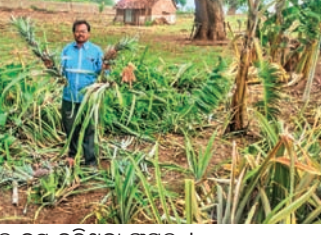
ହାତୀପଲ ନଷ୍ କରିଥିବା ଫସଲ ।

ରାୟଗଡ଼ା ଜିଲ୍ଲା ପୁନିଗୁଡ଼ା ବ୍ଲକ୍ ଅଧୀନ ନିୟମଗିରି ପାଦଦେଶରେ ଏକ ହାତୀପଲ ଗୁଳୁଥିବା ସୂଚନା ମିଳିଛି । ଏଥିରେ ଏକ ଦନ୍ତାହାତୀ, ୪ ମାଲହାତୀ ସମେତ ଏକ ଭୂଆଁ ହାତୀ ରହିଥିବା ବିନ ଦିବାର ପକ୍ଷରୁ ସୂଚନା ମିଳିଛି ।