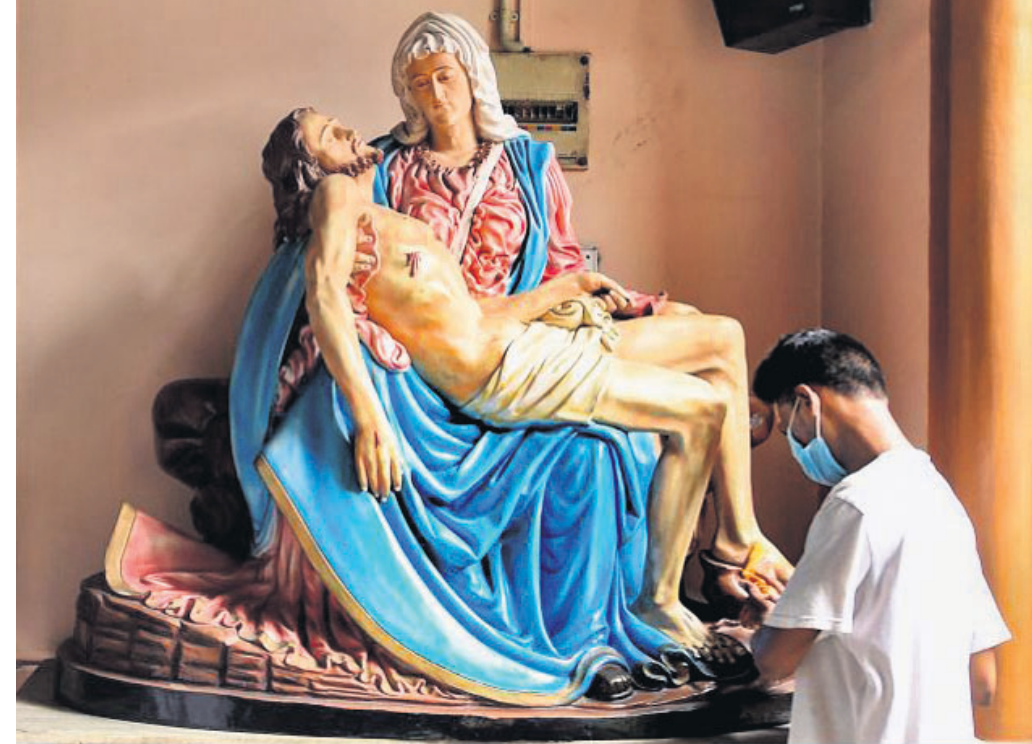
ଧର୍ମାନ୍ୱେଷନକୁଟିକା ଖୋଲିବା ପୂର୍ବରୁ କୋଲକାତାର ସେକ୍ସ ଚେରୋସା ଚର୍ଚ୍ଚିତ ଯିଶୁଖ୍ରୀଷ୍ଟଙ୍କ ମୂର୍ତ୍ତିକୁ ସଫା କରୁଛନ୍ତି ଜଣେ ଶ୍ରମିକ।