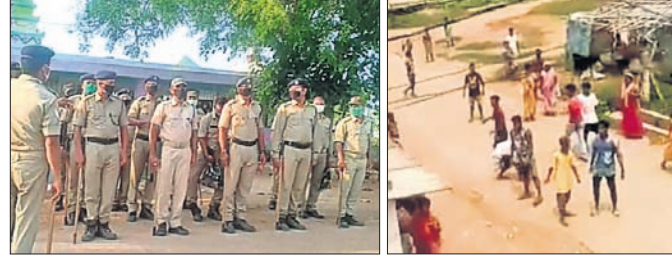
ଭୁବନେଶ୍ୱର, ୭।୬ (ବୁଧବୋ)