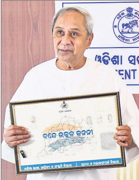
ଭୁବନେଶ୍ୱର, ୭।୬ (ବୁଧବେ)

ଦୀର୍ଘ ୮୪ ବର୍ଷ ପରେ ରାଜ୍ୟ ସରକାର କାନ୍ଦକବି ଲକ୍ଷ୍ମୀକାନ୍ତ ମହାପାତ୍ରଙ୍କ ରଚିତ ସମ୍ପୂର୍ଣ୍ଣ ଗୀତ 'ବନ୍ଦେ ଉତ୍କଳ ଜନନୀ'କୁ ରାଜ୍ୟ ସଙ୍ଗୀତର ମାନ୍ୟତା ଦେଇଛନ୍ତି। ରବିବାର ପୂର୍ବାହ୍ନରେ ପୂଜ୍ୟମନ୍ତ୍ରୀ ନବୀନ ପଟ୍ଟନାୟକଙ୍କ ଅଧ୍ୟକ୍ଷତାରେ ଅନୁଷ୍ଠିତ ଗୁରୁପୂର୍ଣ୍ଣ କ୍ୟାବିନେଟ ବୈଠକରେ ଏହାକୁ ଅନୁମୋଦନ କରାଯାଇଛି। ବୈଠକରେ କେବଳ ଗୋଟିଏ ପ୍ରସଙ୍ଗ ଭାବେ 'ବନ୍ଦେ ଉତ୍କଳ ଜନନୀ'କୁ ରାଜ୍ୟ ସଙ୍ଗୀତ ମାନ୍ୟତା ଦେବାକୁ