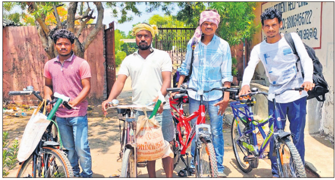
ସାଇକେଲରେ ଘରକୁ ଫେରିଥିବା ସୁବର୍ଣ୍ଣପୁର ଜିଲାର ପ୍ରବାସୀ ଶ୍ରମିକ।

ରୁକ୍ କଣ୍ଠାପାଲି ଭାରାଣ୍ଡାନ୍ ସେଣ୍ଟରରେ ରଖାଯାଇଛି। ସମସ୍ତେ ଏବେ ସୁଦ୍ଧା ଅଛନ୍ତି।