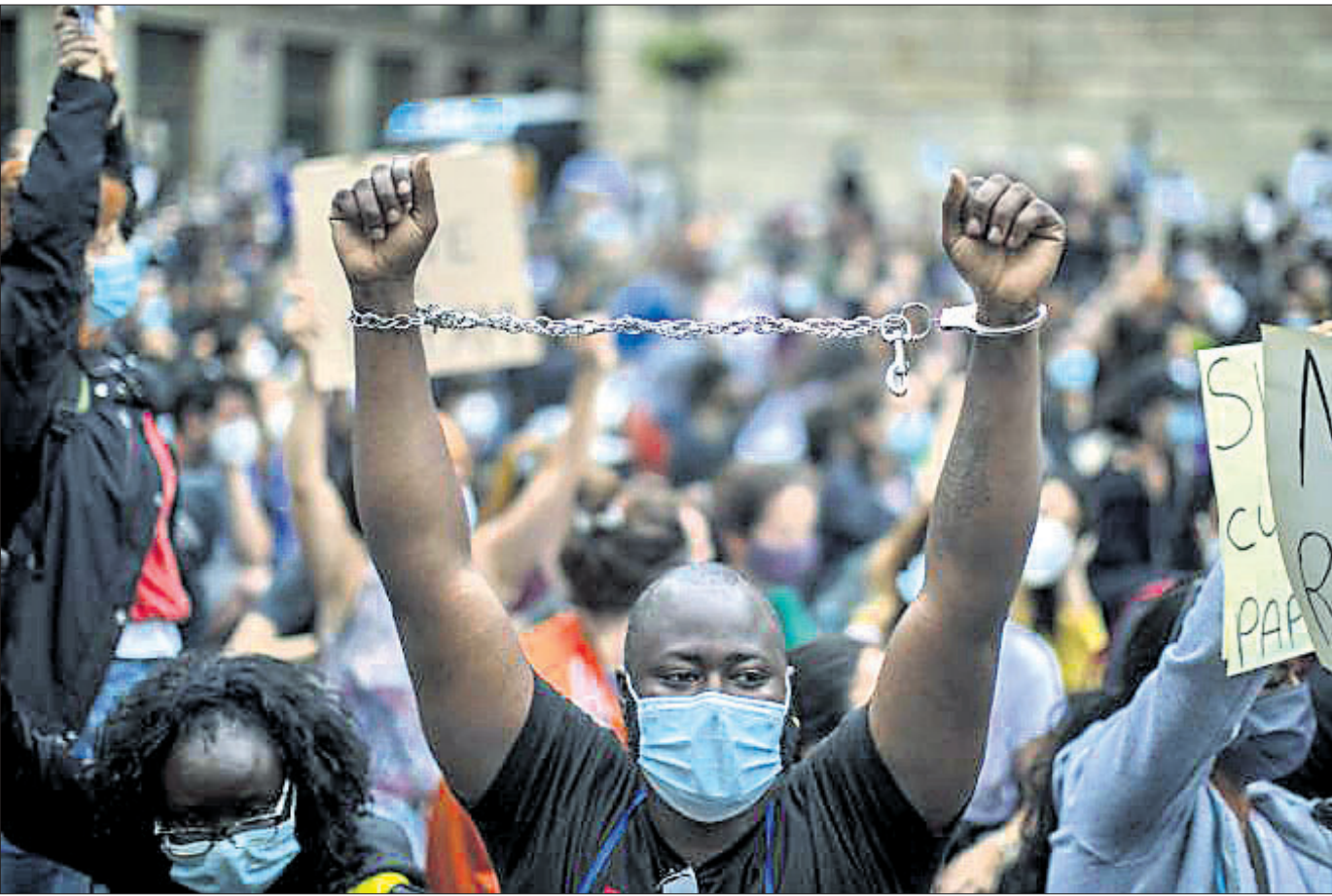
କୃଷକମାନେ ଆମେରିକୀୟ ଜର୍ଚ୍ଚ ପୂର୍ଣ୍ଣକ ମୃତ୍ୟୁ ପ୍ରତିବାଦରେ ସ୍ୱେଚ୍ଛା ବାସ୍ତବ୍ୟରେ ବିକ୍ଷୋଭ ପ୍ରଦର୍ଶନ କରିଛନ୍ତି।