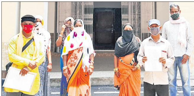
ମୌଳିକ ସୁବିଧା ଦାବିରେ ଜିଲାପାଳଙ୍କୁ ଫେରାଦ ହୋଇଥିବା ପଢ଼ାବାସୀ।

ବରଗଡ଼ ଅଫିସ୍, ୮୬ ବରଗଡ଼ ପୌର ପରିଷଦ ଅଧୀନ ଖାର୍ଦ୍ଦ୍ୟ ନ-୧୭ ରାଧାମାଧବ ପଢ଼ାକୁ ମୌଳିକ ସୁବିଧା ପ୍ରଯୋଗ ଅପହଞ୍ଚି ହୋଇ ପଢ଼ିଥିବା ଅଭିଯୋଗ ହୋଇଛି।