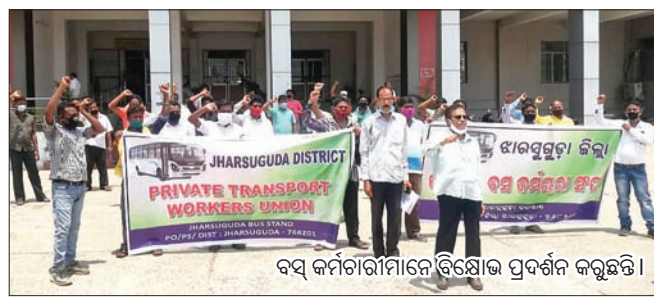
ବସ୍ କର୍ମଚାରୀମାନେ ବିକ୍ଷୋଭ ପ୍ରଦର୍ଶନ କରୁଛନ୍ତି।

ସର୍ବତଳା, ୮୬(ଡି.ଏନ.ଏ.): ବଲାଙ୍ଗୀର ଜିଲା ସର୍ବତଳା ବ୍ଲକ୍ ଗଣପଡ଼ାପାଲି ପଞ୍ଚାୟତର ଫସସା ଅଞ୍ଚଳରେ ସୋମବାର ଅପରାହ୍ନ ବଜ୍ରପାତ ଘଟି ୯ ଗାଈଙ୍କ ମୃତ୍ୟୁ ଘଟିଛି।