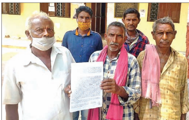
ପାଇଖାନା ଅନିୟମିତତା ନେଇ ଜିଲାପାଳଙ୍କୁ ଫେରାଦ ହୋଇଥିବା ହିତାଧିକାରୀଙ୍କ ଦ୍ୱାରା

ବରଗଡ଼ ଜିଲ୍ଲା ଭେଡ଼େନ ବ୍ଲକ୍ ଅନ୍ତର୍ଗତ କାଣ୍ଡୋଲ ଗ୍ରାମରେ ସ୍କୁଲ ଭାରତ ମିଶନ ଯୋଜନା ପାଇଖାନା ନିର୍ମାଣରେ ବ୍ୟାପକ ଅନିୟମିତତା ହୋଇଛି।