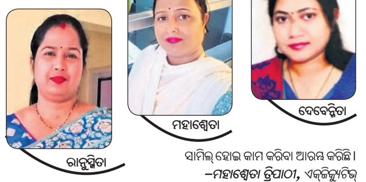
ବାନାଶ୍ରେଣୀ ମହାଶ୍ରେଣୀ ବେବେନିତା

ପାଚିଲା କଦଳୀକୁ କେବେ ଫ୍ରିଜରେ ରଖନ୍ତୁ ନାହିଁ। ରସୁଣ: ରସୁଣକୁ ପ୍ଲାଷ୍ଟିକ୍ ବ୍ୟାଗ କିମ୍ବା ଫ୍ରିଜରେ ରଖିବା ଉଚିତ ନୁହେଁ। ଏହା ନଷ୍ଟ ହୋଇଯାଏ। ଏହାକୁ ସୁରକ୍ଷିତ ରଖିବା ପାଇଁ ଘରର ସାଧାରଣ ଚାପମାତ୍ରାରେ କୌଣସି ଶୁଖିଲା ଗ୍ଲାସ୍‌ରେ ରଖନ୍ତୁ, ଯେଉଁଠିକୁ ପବନ ଚଳାଚଳ କରୁଥିବ। ବ୍ରେଡ୍: ଫ୍ରିଜରେ ବ୍ରେଡ୍ ରଖିଲେ ତା'ର ସ୍ୱାଦ ନଷ୍ଟ ହୋଇଯାଏ। ଫ୍ରିଜରେ ଥଣ୍ଡାରେ ରହିବା ପରେ ବ୍ରେଡ୍