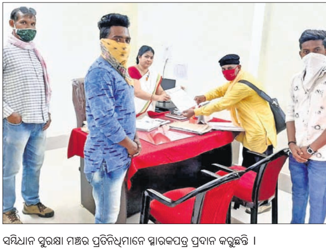
ସମ୍ବନ୍ଧରେ ସୂଚନା ମଧ୍ୟ ଏହାକୁ ବିରୋଧ କରିଛି।

ବରଗଡ଼ ଅଫିସ୍, ୮୬ କରୋନା ବିପର୍ଯ୍ୟୟ ସମୟରେ ସ୍କୁଲ ଫି, ବିଦ୍ୟୁତ୍ ଦେୟ, ଘରଭଡ଼ା ଅସୁଲି କରାଯାଇଥିବା ବରଗଡ଼ ଜିଲ୍ଲା ସମ୍ବନ୍ଧରେ ସୂଚନା ମଧ୍ୟ ଏହାକୁ ବିରୋଧ କରିଛି।