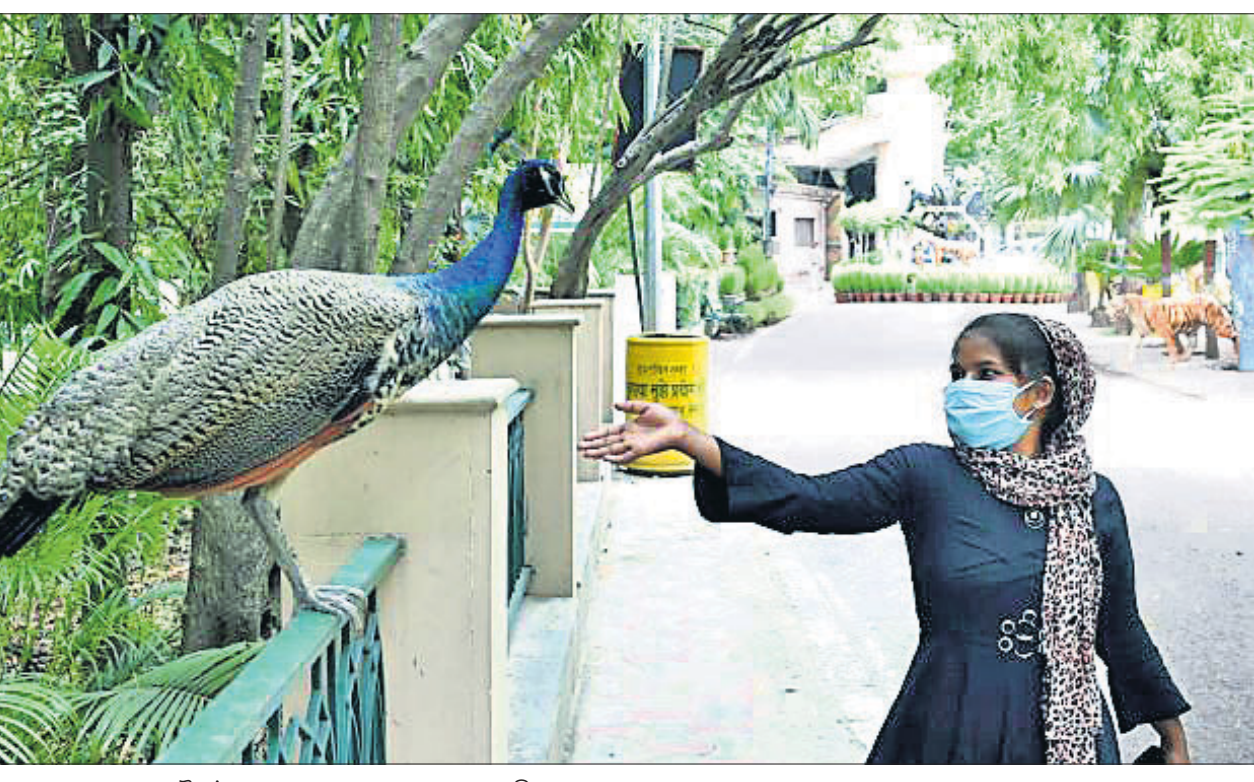
ଲକ୍ଷ୍ମୀନଗର କୋହଳ ହେବା ପରେ ଲକ୍ଷ୍ମୀ ଟୁରେ ଜଣେ ମୁଦତୀ ଏକ ମୟୂରକୁ ଡାକୁଛନ୍ତି।

କ୍ରିଡାୟ ଥର ଅବଧି ବଢ଼ାଇଲେ କେନ୍ଦ୍ର ସରକାର ସବୁ ରାଜ୍ୟ ଓ କେନ୍ଦ୍ରଶାସିତ ଅଞ୍ଚଳ ପାଇଁ ଆଡ଼ଭାଇଜରି ଅନ୍ୟ କୌଣସି ପ୍ରକାର କାରଗପତ୍ରର ବୈଧତା ବୃଦ୍ଧି କରିହେଉ ନାହିଁ, ସେଗୁଡ଼ିକୁ ମାର୍ଚ୍ଚ ୩୦ରେ ସରକାର ବଢ଼ାଇଥିଲେ। ଫେବୃଆରୀ ୩୧ରେ ଅବଧି ଶେଷ ହୋଇଥିବା କାରଗପତ୍ର ସମ୍ପର୍କରେ କ୍ଲିନ୍ ୩୦ ପର୍ଯ୍ୟନ୍ତ ଚଳାଇନେବା ପାଇଁ ମନ୍ତ୍ରାଳୟ ପକ୍ଷରୁ ପରାମର୍ଶ ଦିଆଯାଇଥିଲା। ପରେ କରୋନା ସଂକ୍ରମଣ ଲାଗି ରହିଥିବାରୁ ଏହି ଅବଧି ବୃଦ୍ଧି ପାଇଁ ବିଭିନ୍ନ ମହଲରୁ ଅନୁରୋଧ ଆସିଥିଲା। ଏବେ ଏଥିରେ ଦ୍ୱିତୀୟଥର ବୃଦ୍ଧି କରାଯାଇଛି। ଦହାଦିକଗୁଡ଼ିକର ବୈଧତାକରଣ ପାଇଁ କୌଣସି ଅତିରିକ୍ତ ଅର୍ଥ କିମ୍ବା ଲେଟ୍ ଫାଇନ ଦେବାକୁ ଯେଉଁ ଗାଡ଼ିଗୁଡ଼ିକର ଫିଟ୍‌ନେସ୍, ସମସ୍ତ ପ୍ରକାର ପରମିଟ୍, ଡ୍ରାଇଭିଂ ଲାଇସେନ୍ସ, ରେଜିଷ୍ଟ୍ରେଶନ କିମ୍ବା