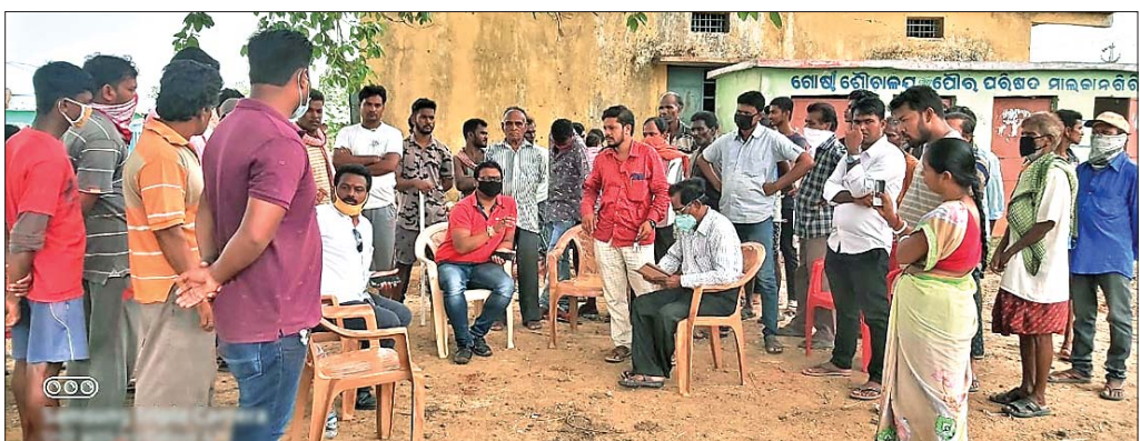
ଯନ୍ତ୍ରୀଙ୍କ ସହ ଆଶୀର୍ବାଦ କଲୋନିବାସୀ ଆଲୋଚନା କରୁଛନ୍ତି ।

ମାଲକାନଗିରି, ୯।୬(ଡି.ଏନ୍.ଏ.): ମାଲକାନଗିରି ସହରବାସୀଙ୍କ ପାନୀୟ ଜଳ ସମସ୍ୟା ଦୂର ପାଇଁ ଆରମ୍ଭ ହୋଇଥିଲା ବର୍ଷେ ତଳେ ଏକ ବୃହତ୍ କଳ ଯୋଗାଣ ପ୍ରକଳ୍ପ । କିନ୍ତୁ ବିଭିନ୍ନ ବିଭାଗ ମଧ୍ୟରେ ସମନ୍ୱୟ ଅଭାବରୁ ଏହି ପ୍ରକଳ୍ପ କାର୍ଯ୍ୟ ଶେଷ ହୋଇପାରି ନାହିଁ । ଫଳରେ ସହରବାସୀ ସବୁ ସମୟରେ ଭୋଗୁଛନ୍ତି ଜଳକଷ୍ଟ । ମାଲକାନଗିରି ପୌର ପରିଷଦ ଆଞ୍ଚଳିକ ବ୍ୟବସାୟ କରୁଥିବା ୧୯ଟି ଘର ଉପରେ କର୍ମଚାରୀଙ୍କ ବାସଗୃହକୁ ଜଳ ଯୋଗାଣ ଦେବାପାଇଁ ୨୦କୋଟି ଟଙ୍କା ବ୍ୟୟରେ ଏକ ବୃହତ୍ କଳ ଯୋଗାଣ ପ୍ରକଳ୍ପ ଗତ ଏକବର୍ଷ ତଳେ ଆରମ୍ଭ ହୋଇଥିଲା । କିନ୍ତୁ ଜନସ୍ଵାସ୍ଥ୍ୟ ବିଭାଗ, ଜାତୀୟ ରାଜପଥ ବିଭାଗ ଏବଂ ଦୂର ସଞ୍ଚାର ବିଭାଗ ମଧ୍ୟରେ ସମନ୍ୱୟ ଅଭାବରୁ ଏହି ପ୍ରକଳ୍ପ ଆଗ୍ରଗତ ହୋଇପାରି ନ ଥିବା ଜଣାପଡ଼ିଛି । ସହର ମଧ୍ୟରେ ବିଭିନ୍ନ ସାହିକୁ ପାଇପ ବିଛାଇବା ସମୟରେ ଅନେକ ଘ୍ନାନରେ