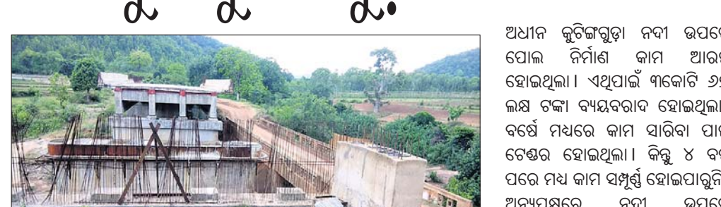
ପଠାଯାଇଛି । ଅନୁମୋଦନ ପରେ ଶୀଘ୍ର କାମ ଆରମ୍ଭ ହେବ । ପ୍ରକାଶଯୋଗ୍ୟ, ୨୦୧୭ରେ ପୂର୍ଣ୍ଣ ବିଭାଗ ପକ୍ଷରୁ କାଶୀପୁର ବ୍ଲକ ଚୋୟାପୁଟ୍ ପଞ୍ଚାୟତ

ଚିକିତ୍ସା, ୯।୬: ରାୟଗଡ଼ା ଜିଲାର କାଶୀପୁର ବ୍ଲକ କୁଟିଙ୍ଗାଗୁଡ଼ା ପୋଲ ନିର୍ମାଣ କାମ ୪ ବର୍ଷ ହେଲା ସରୁନି । ଅଧିକାରୀ ଆସିବା ପରେ କାମ ପଡ଼ିରହିଛି । ତେଣୁ ଲୋକଙ୍କ ଯାତାୟାତରେ ବହୁ ଅସୁବିଧା ହେଉଛି । ବିଶେଷକରି ବର୍ଷା ଦିନ ଆସିଲେ ଏହି ରାସ୍ତାରେ କାହୁଅ ଯୋଗୁ ଅନେକ ଲୋକ ପଡ଼ିଯାଇଥିବା ଗ୍ରାମବାସୀ କହିଛନ୍ତି । ଏ ନେଇ ବିଭାଗୀୟ ଯନ୍ତ୍ରୀ କହିଛନ୍ତି, ପୋଲର ଡିଜାଇନ ପରିବର୍ତ୍ତନ କରାଯିବା ସହିତ, ସରପଞ୍ଚ ପ୍ରମୁଖ ଉପସ୍ଥିତ ଥିଲେ ।