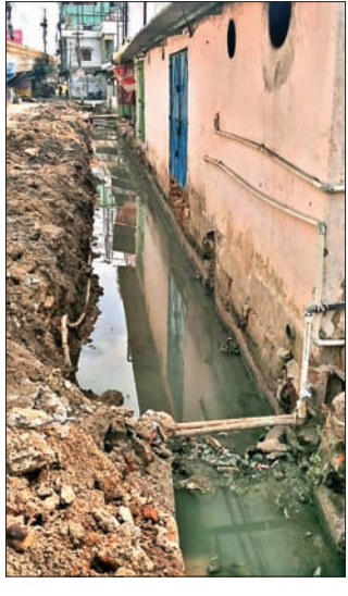
ସୁନ୍ଦରଗଡ଼ ଫାଟକ ଅଞ୍ଚଳରେ ଡ୍ରେନ୍ କାମ ଆରମ୍ଭ ହୋଇଛି।

ଫାଟକ(ଓଲଟ୍ରିକ)ରୁ କଟୁଥିବା ପର୍ଯ୍ୟନ୍ତ ରାସ୍ତା ପାଖରେ ଡ୍ରେନ୍ ନିର୍ମାଣ କାମ ମହାନଗର ନିଗମ ପକ୍ଷରୁ ଆରମ୍ଭ ହୋଇଛି। ହେଲେ ଜବରଦସ୍ତୀ ଭିକ୍ଷା ଦେବା ନ କରି ଡ୍ରେନ୍ ନିର୍ମାଣ କରାଯାଉଥିବା ଅଭିଯୋଗ ହେଉଛି। ପ୍ରଥମେ ଜବରଦସ୍ତୀ ଭିକ୍ଷା ଦେବା ନ କରି ଡ୍ରେନ୍ ନିର୍ମାଣ କରାଯାଉଥିବା ଅଭିଯୋଗ ହେଉଛି।