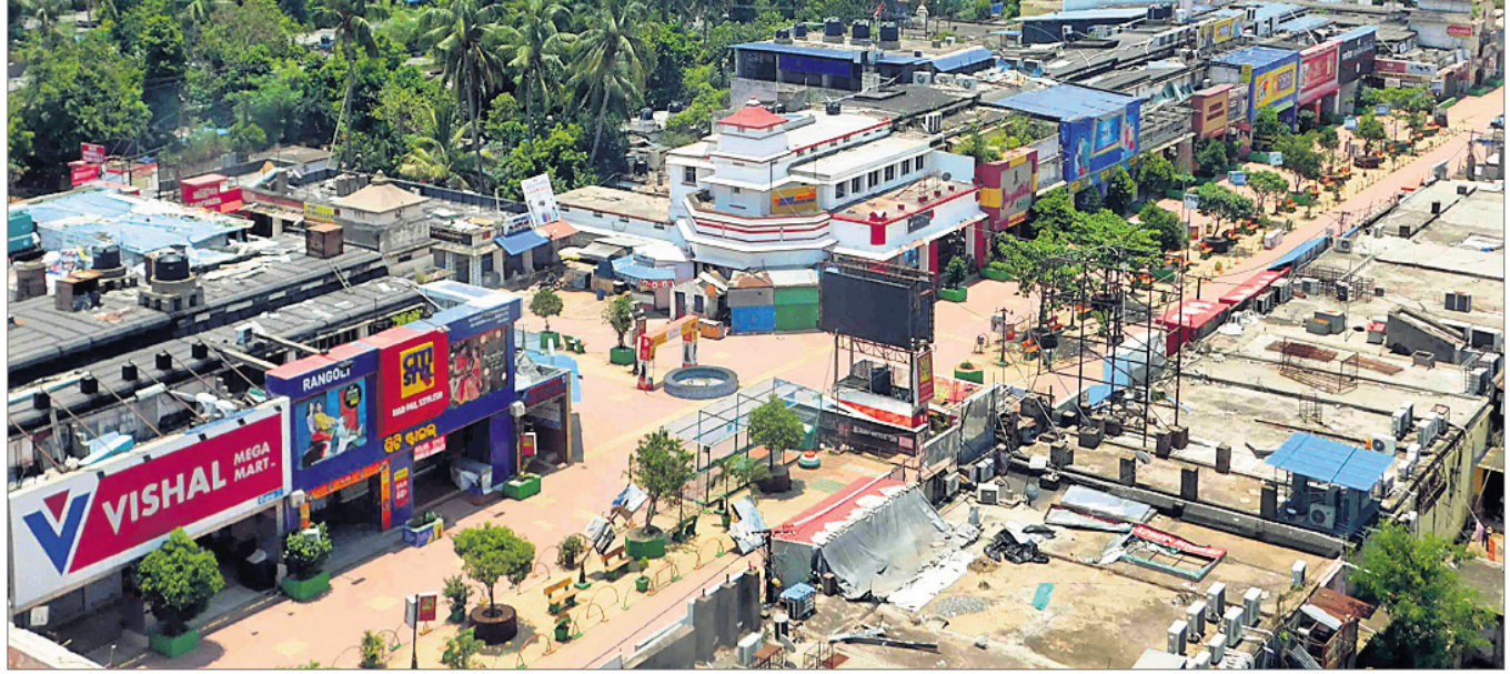
ସୁନିଟ-୨ରୁ ଫାର୍ମେଟ୍ ବିଲ୍ଡିଂ।