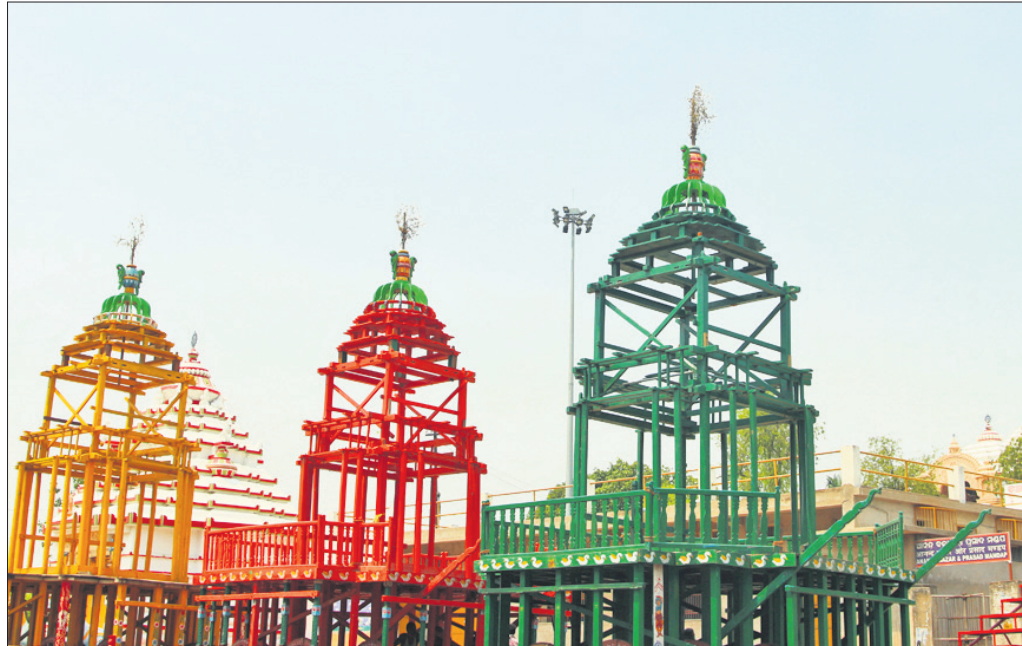
ଅନୁଗୋଳ ଶୈଳଗ୍ରାମରେ ଉତ୍ସବ କାର୍ଯ୍ୟ ଶେଷ ପର୍ଯ୍ୟାୟରେ ପହଞ୍ଚିଛି।

ବର୍ଷ କୌଣସି ପ୍ରତିଯୋଗିତା ଆୟୋଜନ ହେବନି। ସାମାଜିକ ଦୂରତ୍ୱ ନିୟମ ପାଳି ବିଭିନ୍ନ କାର୍ଯ୍ୟକ୍ରମକୁ ଲୋକେ ଦୂରେଇ ରହିବେ। ଏକାରଣରୁ ପର୍ବପାଳନ ପାଇଁ କାହା ମନରେ ଉତ୍ସାହ ନାହିଁ। କଟକଶାସକ ଯୋଗୁ ଗ୍ରାମାଞ୍ଚଳରେ ମଧ୍ୟ ରଜ ପର୍ବ ଟିକା ପଡ଼ିଛି। ଅନ୍ୟପକ୍ଷରେ ରଜ ପାଇଁ କୌଣସି ସ୍ଥାନରେ ଏକଚକ୍ର ହେବା, ଭୋଜି, ଅନୁଗୋଳବାସୀ, ଷ୍ଟେଜ ଆଦି ଆୟୋଜନ ଉପରେ ଜିଲା ପ୍ରଶାସନ ପକ୍ଷରୁ କଟକଣା ଲଗାଯାଇଛି।