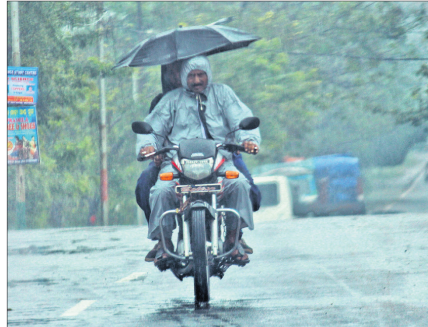
ଅନୁଗୋଳରୁ ମୌସୁମା ବୁଲିବାପରେ ଶନିବାର ବର୍ଷାରେ ତୁଳଜଣା ବାଇଦ୍ ଆରୋହୀ ଯାଉଛନ୍ତି।