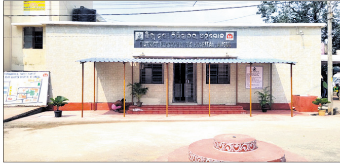
ଜିଲା ଚିକିତ୍ସାକର୍ମର ହେଲୁ ତେସ୍କ।

ରୋଗୀକୁ ଉତ୍ତମ ଚିକିତ୍ସା ସେବା ଯୋଗାଇଦେବା ଏବଂ ଚିକିତ୍ସାକର୍ମର ମାନ ବତାଇବାକୁ ଗୁରୁତ୍ୱପୂର୍ଣ୍ଣ ଦାୟିତ୍ୱ ଦିଆଯାଇଥିବା ମେଡିକାଲ ହେଲୁ ତେସ୍କ ଏବେ କୋମାରେ।