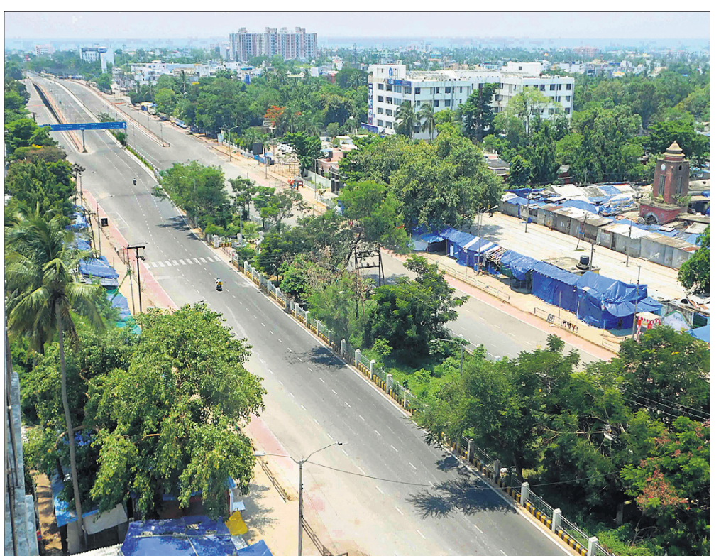
ରାଜମହଲରୁ ଏକ ଛକ ଶୁନିଟ୍।