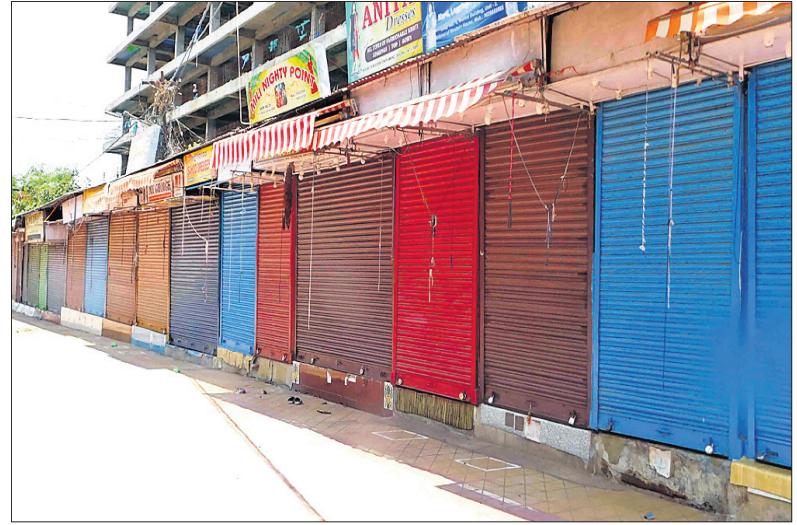
ଫାର୍ମେଟ୍ ବିଲ୍ଡିଂର ସମସ୍ତ ଦୋକାନରେ ଚାଲା ଝୁଲୁଛି।