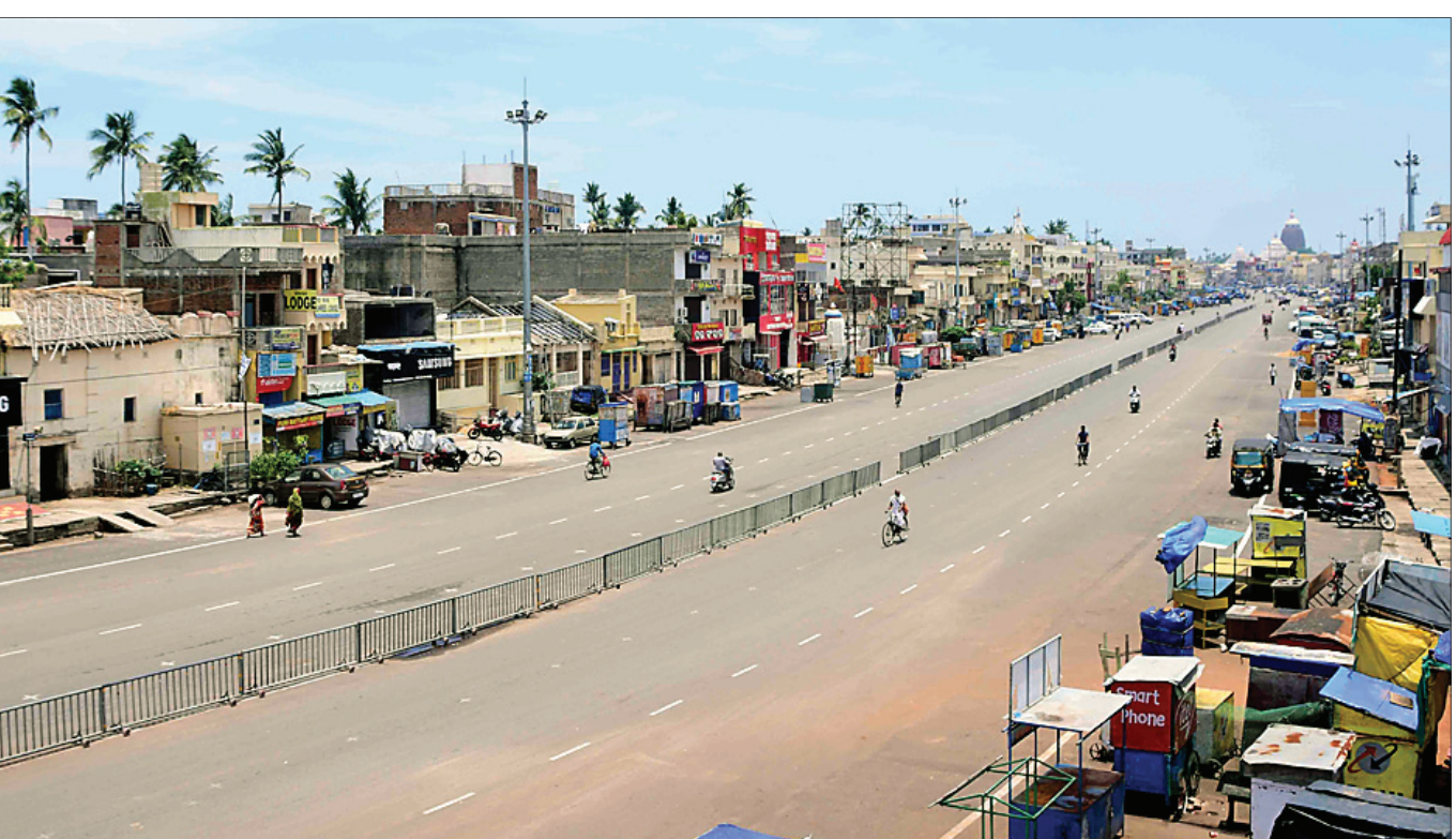
ପୁରୀ ବଡ଼ବାଣ ଖାଁ ଖାଁ।