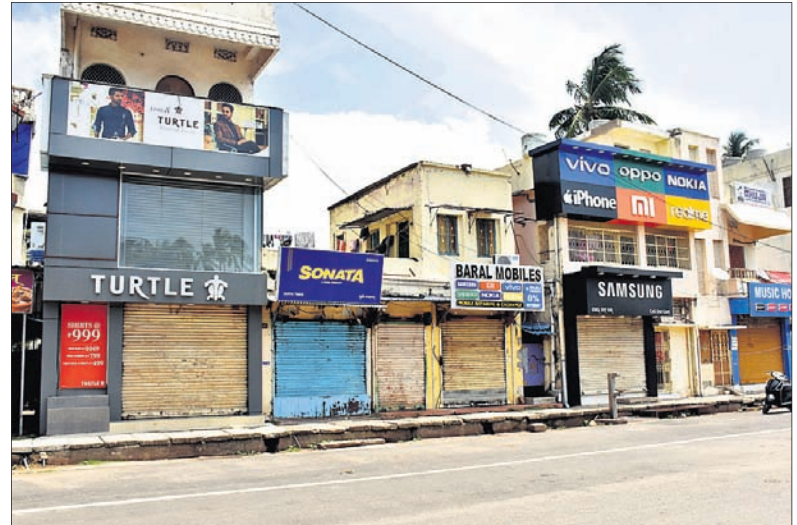
ପୁରୀ ସହରରେ ଦୋକାନବଜାର ବନ୍ଦ।