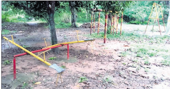
ଆଳତୁମା ରଜ ମହୋତ୍ସବ ପଡ଼ିଆ।

ଓଡ଼ିଶାର ସଂସ୍କୃତି, ପରମ୍ପରା ଏବଂ ପର୍ବପର୍ବାଣି ଉପରେ ପଢ଼ିଛନ୍ତି କରୋନା ଚଢ଼କ। କଟକଶାସକ ଯୋଗୁ ଉତ୍ସବ, ଯାନିଯାତ୍ରା, ମେଳା ମହୋତ୍ସବ ସବୁ ବନ୍ଦ ହୋଇଯାଇଛି।