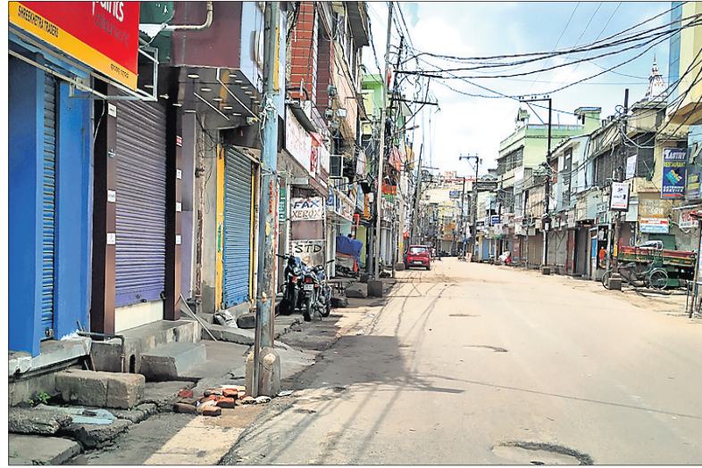
ଶୁନିଟ୍ ଟୋପିରୁ ବଜାର ରାସ୍ତା।