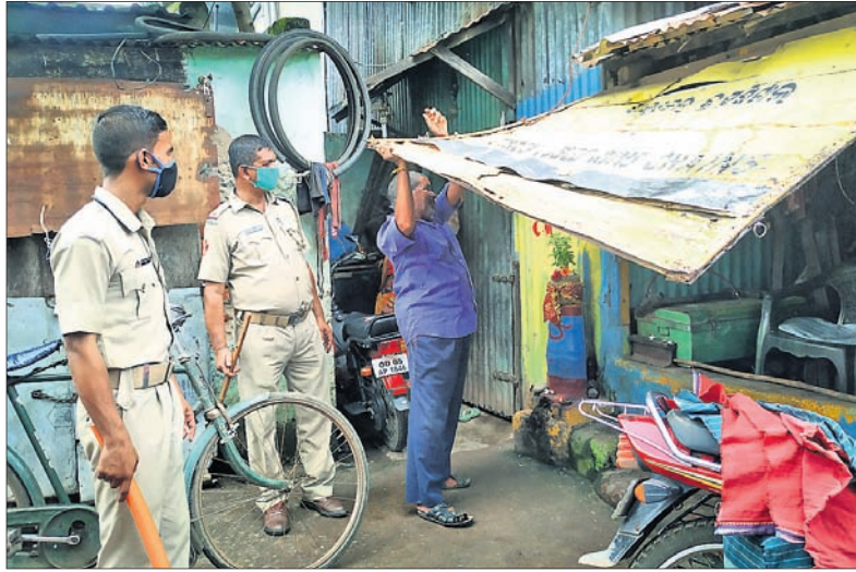
କଟକ ମାଲଗୋଦାମ ବେହେରାସାହିରେ ଖୋଲିଥିବା ଏକ ଦୋକାନକୁ ପୋଲିସ୍ ବନ୍ଦ କରୁଛି।

କେତେକ ସ୍ଥାନରେ ନିୟମ ଉଲ୍ଲଙ୍ଘନକାରୀଙ୍କଠାରୁ ପୋଲିସ୍ ଜରିମାନା ଆଦାୟ କରିଥିଲା। ହେଲେ ଏହି ସମୟରେ ଲୋକେ ଦସ୍ତଖତ କରିବା ପାଇଁ ପୋଲିସ୍‌ର ପେନ୍ ମାରିନେଇଥିବାକୁ ସଂକ୍ରମଣ ଭୟ ଘାଟିଥିଲା। ସେହିପରି ପିସିଆର୍ ପାଟ୍ରୋଲିଂ କରାଯାଇ ଭିଡି ଉପରେ ନଜର ରଖାଯାଇଥିଲା। ବିଶେଷକରି ସବୁ ଜିଲାରେ ଶନିବାର ଶରତାଭରଣ ଚିତ୍ର ନିଆରା ଥିଲା। ଛୋଟ ବଡ଼ ଦୋକାନ ସବୁ ବନ୍ଦ ରହିଥିବାବେଳେ କେବଳ ଔଷଧ ଦୋକାନ ଖୋଲା ରହିଥିଲା। ଅନ୍ୟପକ୍ଷରେ ଶରତାଭରଣ ସତର୍କ କରିଥିଲା ମୌସୁମୀ ବର୍ଷା। କହିବାକୁ ଗଲେ ପୋଲିସ୍ ପାଇଁ ବେଶ୍ ସହାୟକ ହୋଇଥିଲା ବର୍ଷା। ସାଧାରଣ ଜନତାକୁ ବାହାରକୁ ବାହାରିବାକୁ ସୁଯୋଗ ଦେଇ ନ ଥିଲା। ହେଲେ ବର୍ଷା ଛାଡ଼ିଯିବା ପରେ ସନ୍ଧ୍ୟାରେ ପୋଲିସ୍‌ର ଯାଞ୍ଚରେ ଟିକେ ଜିଲା ହୋଇଥିଲା। ଫଳରେ କିଛି ଲୋକ ବାହାରକୁ ବାହାରିଥିବା ଦେଖିବାକୁ ମିଳିଥିଲା।