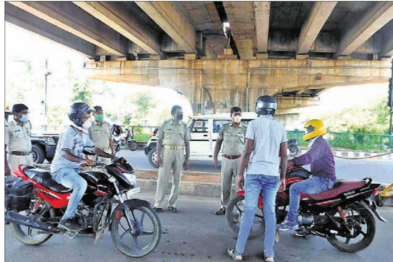
ସିଆର୍ପି ଛକରେ ଲୋକଙ୍କୁ ଯାଞ୍ଚ କରାଯାଉଛି।