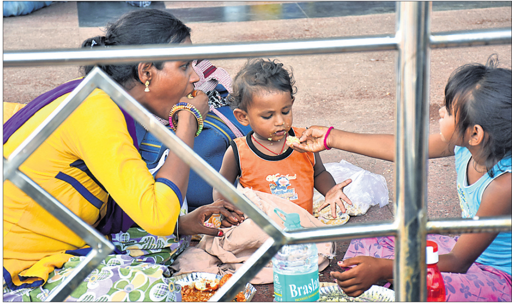
ଭୁବନେଶ୍ୱର ରେଳ ଷ୍ଟେସନରେ ଅଟକି ରହିଥିବା ଯାତ୍ରୀମାନେ ଖାଇଛନ୍ତି।