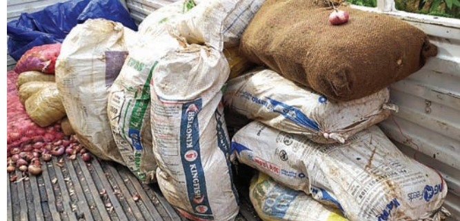
ଲମତାପୁଟ ଫାଣ୍ଡି ପକ୍ଷରୁ ପିଆଜ ବୋହେଇ ଟ୍ରକ୍ କବଚ ହୋଇଥିବା ଗଞ୍ଜେଇ ।

ଲମତାପୁଟ/ଜୟପୁର/ବୈପାରିଗୁଡ଼ା, ୧୫/୬(ଡି.ଏନ.ଏ)