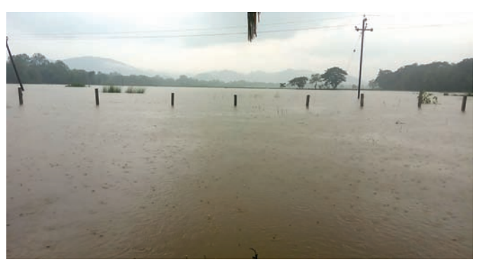
ତିନିଛକ ନିକଟରେ ଜମି ରହିଥିବା ପାଣି ।

ମୌସୁମୀ ବର୍ଷା ଆରମ୍ଭରେ ଶେରଗଡ଼ ଅବସ୍ଥା ବେହାଲ ହେଲାଣି । ଗତ ୪ଦିନ ମଧ୍ୟରେ ୩୦୦ ମିମି ବର୍ଷା ରେକର୍ଡ ହୋଇଥିବାବେଳେ ଏବେ ବି ବର୍ଷା ଲାଗିରହିଛି । ଫଳରେ ଶେରଗଡ଼ ତିନିଛକକୁ ଲାଗି ଥିବା ୫ଶହ ଏକର ଚାଷକର୍ମରେ ଅପୁର୍ଣ୍ଣ ଉତ୍ପାଦ ପାଣି ଜମି ରହିଛି । କଳ ନିଷ୍ପାସନ ହୋଇପାରୁ ନ ଥିବାରୁ ଚାଷ କାର୍ଯ୍ୟ ବାଧାପ୍ରାପ୍ତ ହୋଇଛି । ଏପରି ବର୍ଷା ଲାଗିରହିଲେ ଅଞ୍ଚଳରେ ଦିନେ ବୁଦ୍ଧଦିନ ମଧ୍ୟରେ ବନ୍ୟା ପରିସ୍ଥିତି ସୃଷ୍ଟି ହେବ । ଶେରଗଡ଼