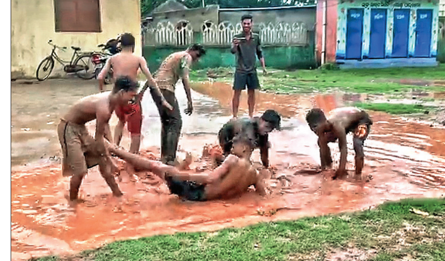
ମୌସୁନୀକୁ ନେଇ ଉତ୍ସାହରେ ଅନୁଗୋଳ ସହରର କେତେକଙ୍କ ଯୁବକ ବର୍ଷା ପାଣିରେ ଖେଳୁଛନ୍ତି ।