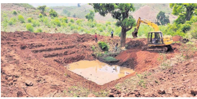
ଜେସିବି ଦ୍ୱାରା ଖୋଳା ଯାଉଥିବା ବନ୍ଧ ।

ଶ୍ରମିକଙ୍କ ଜାତିକ ନିର୍ବାହ ଲାଗି ସରକାର ବିଭିନ୍ନ ଯୋଜନାରେ କାର୍ଯ୍ୟ ଯୋଗାଇ ଦେବାକୁ ଉଦ୍ୟମ କରି ରଖିଛନ୍ତି। ମାତ୍ର କୋରାପୁଟ ଜିଲ୍ଲା ବନ୍ଧନପୁରରେ ସରକାରଙ୍କ ନିୟମକୁ ଉଲ୍ଲଙ୍ଘନ କରାଯାଇଛି। ଶ୍ରମିକଙ୍କ ବଦଳରେ ଠିକାଦାରମାନେ ଜେସିବି ମେଶିନ ଲଗାଇ କାର୍ଯ୍ୟ କରୁଛନ୍ତି। ଫଳରେ ଶ୍ରମିକମାନେ କାମ ପାଇବାକୁ ବଞ୍ଚିତ ହେଉଛନ୍ତି। ଏପରି ଦେଖିବାକୁ ମିଳିଛି ବନ୍ଧନପୁର ବ୍ଲକ୍ ରାଜିଆଗୁଡ଼ା ପଞ୍ଚାୟତର ପରଜାଗଡ଼ି ଗ୍ରାମରେ। ଗ୍ରାମରେ ୬୦ ପରିବାର ବସବାସ କରନ୍ତି। ଲକ୍ଷ୍ମୀନଗର ଯୋଗୁ କୌଣସି କାର୍ଯ୍ୟ ନ ପାଇ ଶ୍ରମିକମାନେ ହଇରାଣ ହେଉଥିଲେ। ପ୍ରଶାସନ ଜିଲ୍ଲାରେ ମୋଟ ୨୬ ଜଣ କରୋନା ପଜିଟିଭ ଟିକ୍ସଟ ହୋଇଥିବା ବେଳେ ସେମାନଙ୍କ ମଧ୍ୟରୁ ୧୨ ପୁରୁ ହୋଇଥିବା ବେଳେ କେବଳ ୫ ଜଣ ଚିକିତ୍ସିତ ହେଉଛନ୍ତି।