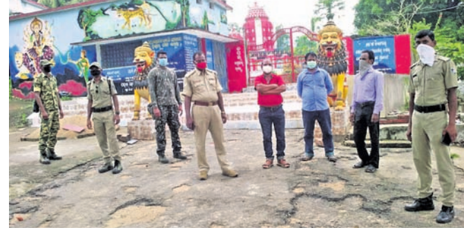
ମନ୍ଦିର ପରିସରରେ ପୋଲିସ ଜରିଆରେ ।

ଗଞ୍ଜାମ ଜିଲା ପୋଲିସର ବ୍ଲକ ପଞ୍ଚିରପଡ଼ା ପଞ୍ଚାୟତ କସିପଡ଼ାସ୍ଥିତ ସିଂହାସନୀ ପୀଠରେ ବେଶ୍ ଧୂମଧାମ୍ରେ ରଜପର୍ବ ପାଳିତ ହୋଇ ଆସୁଥିବା ବେଳେ ଚଳିତବର୍ଷ କରୋନା କଟକଣା ଯୋଗୁଁ ବନ୍ଦ ପାଇଁ ନିଷ୍ପତ୍ତି ହୋଇଥିଲା । ବିଗତ ବର୍ଷଗୁଡ଼ିକ ପରି ଚଳିତବର୍ଷ ଏଠାରେ ଗହଳିତହଳି ଦେଖିବାକୁ ମିଳି ନ ଥିଲା । ପ୍ରଶାସନର କଟକଣା ଯୋଗୁଁ କେବଳ ମନ୍ଦିର ପରିସରରେ ପୂଜକଙ୍କ ଦ୍ୱାରା ପୂଜାର୍ଚ୍ଚନା ମଧ୍ୟରେ ସାମିତ ରହିଗଲା । ସିଂହାସିକ ରଜପର୍ବ ମନ୍ଦିର