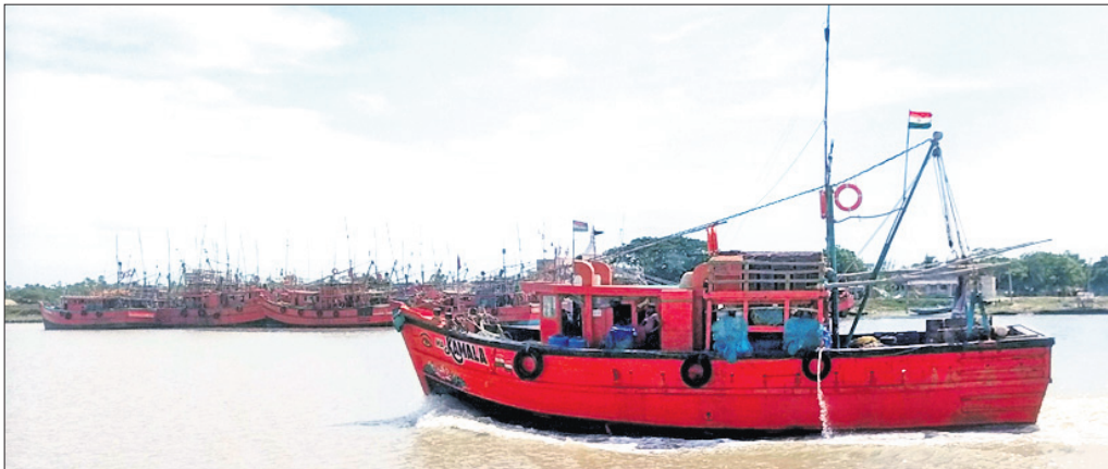
ବାପା ବେଳାକୁମ୍ଭରେ ମାଛଧରା ଟ୍ରଲର।