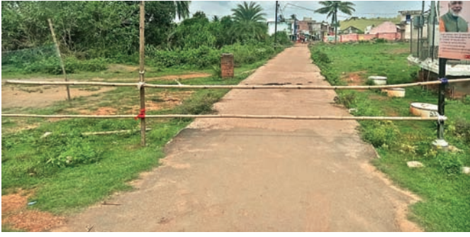
ଗାଁକୁ ସିଲ୍ କରାଯାଇଛି ।