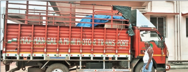
ଗାଡ଼ିରେ ଆସିଥିବା ତୁ ନେଟ୍ ମେଶିନ୍ ।