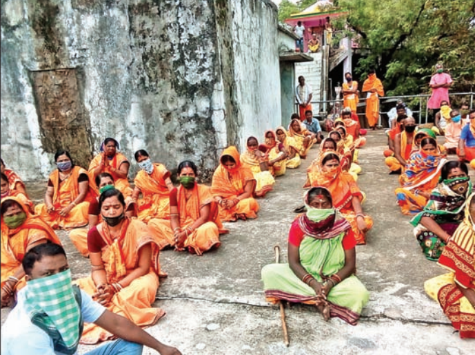
ଅନୁଗୋଳ ଜିଲା କଣିହାଁ ବ୍ଲକ୍ କଳା ସଂସ୍କୃତି ସଂଘ ତରଫରୁ ରବିବାର ଲୋକକଳା ଦିବସ ଅବସରରେ ଦେନାଳା ଗ୍ରାମସ୍ଥିତ ରାମେଶ୍ୱର ଶିବ ମନ୍ଦିରରେ ନିଆଯାଇଥିବା କଳାକାରମାନଙ୍କୁ କରାଯାଇଛି ।