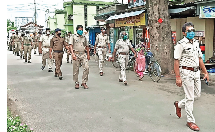
ଅନୁଗୋଳ ବଜାରରେ ଜନଗହଳ ବେଶ୍ ରବିବାର ପୋଲିସ ପକ୍ଷରୁ ଯୁଗମାଳି କରାଯାଇଛି ।