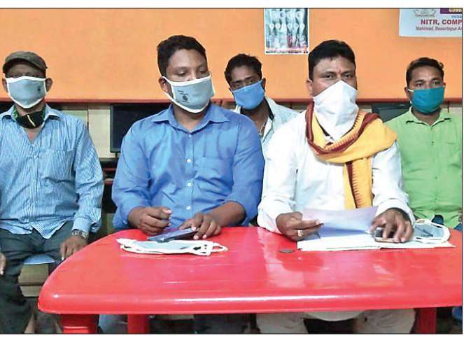
ଖବରଦାତା ସମ୍ମିଳନୀରେ ଭାଜପା କର୍ମକର୍ତ୍ତା।

ଠିକାଦାରଙ୍କ ସହ ୨୦୧୯ ଡିସେମ୍ବର ୪ ତାରିଖରେ ରୁଦ୍ଧି ହୋଇଥିଲା। ରୁଦ୍ଧି ସ୍ୱାକ୍ଷର ହେବାର ୩୦ଦିନ ମଧ୍ୟରେ କାର୍ଯ୍ୟାରମ୍ଭ ହେବା କଥା। କିନ୍ତୁ ଅଧ୍ୟାବଧି ନିର୍ମାଣ କାର୍ଯ୍ୟ ଆରମ୍ଭ ହୋଇ ନ ଥିବାରୁ ଚଳିତ ଶିକ୍ଷାବର୍ଷରେ ପିଲାଙ୍କ ନାମ ଲେଖା ହୋଇ ନ ପାରିବା ନେଇ ଆଶଙ୍କା ପ୍ରକାଶ ପାଇଛି। ଏହାକୁ ନେଇ ଅଭିଭାବକ ମଞ୍ଚଳରେ ଅସନ୍ତୋଷ ପ୍ରକାଶ ପାଇଛି। ଏ ସମ୍ପର୍କରେ ବରା ଶିକ୍ଷା ମଞ୍ଚଳ ପ୍ରଥମେ ସ୍ଥିରୀକୃତ ହୋଇଥିବା ସ୍ଥାନ ଅତିରିକ୍ତ ଆଦର୍ଶ ବିଦ୍ୟାଳୟ ଗୃହ ନିର୍ମାଣ ପାଇଁ ଶୁଭ ଦେଇଥିଲେ। ଉକ୍ତ ଗୃହ ନିର୍ମାଣ ଲାଗି ୩ କୋଟି ୫୪ ଲକ୍ଷ ୧୦ହଜାର ଟଙ୍କା ବ୍ୟୟବୋଧ ସ୍ଥାପନ କରିଥିଲେ। ଏହାପରେ ଜିଲ୍ଲା ଓ