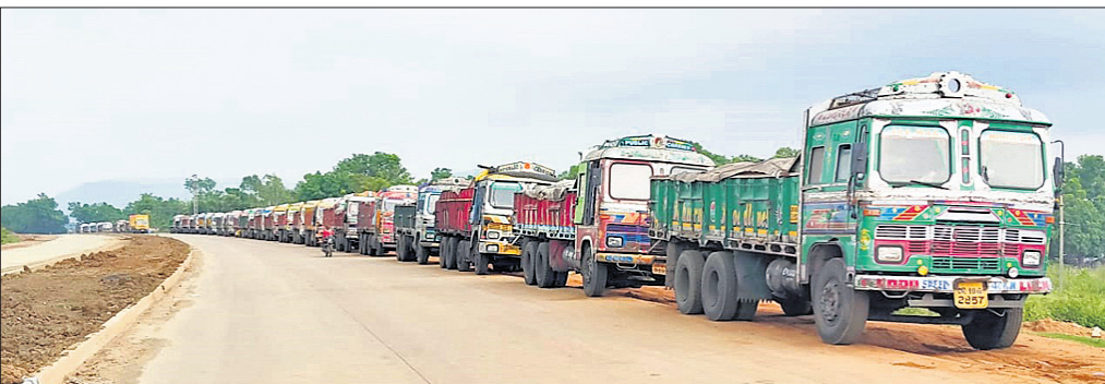
ରାଜପଥ ପାର୍ଶ୍ୱରେ ତ୍ରୁକ୍ ଅଟକି ରହିଛି ।

ପକ୍ଷରୁ ପଲିସଭା କରାଯିବାର ନିୟମ ଥିଲେ ମଧ୍ୟ ଏହା କରା ନ ଯାଇ ଏବଂ ଗ୍ରାମବାସୀଙ୍କ ମତାମତ ନିଆ ନ ଯାଇ ତିପୋ ନିର୍ମାଣ ହୋଇଛି । ଏଠାକୁ କୋଇଲା ପରିବହନ ପାଇଁ ସ୍ୱତନ୍ତ୍ର ରାସ୍ତା ନିର୍ମାଣ କରାଯାଇନାହିଁ । ଗ୍ରାମବାସୀ ଯାତାୟାତ କରୁଥିବା ଜାତୀୟ ରାଜପଥରୁ ପୁରୁଣା କୋଇଲା ପରିବହନ ପାଇଁ ସଂଖ୍ୟା