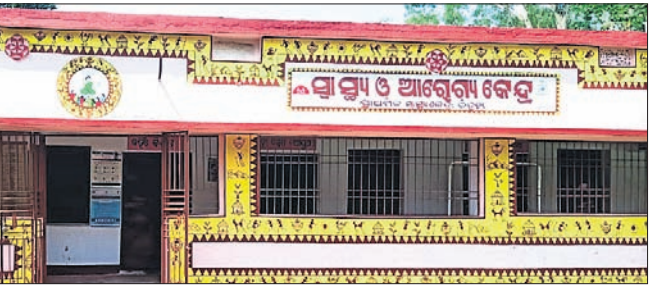
ଚିତ୍ରଡ଼ା ପ୍ରାଥମିକ ସ୍ଵାସ୍ଥ୍ୟକେନ୍ଦ୍ର।

ସ୍ଵାସ୍ଥ୍ୟ ସେବାକୁ 'ମୋ ସରକାର' ଯୋଜନାରେ ସାମିଲ କରି ଲୋକଙ୍କୁ ଉତ୍ତମ ସ୍ଵାସ୍ଥ୍ୟସୁବିଧା ଯୋଗାଇ ଦେବାକୁ ରାଜ୍ୟ ସରକାର ଲକ୍ଷ୍ୟ ରଖୁଥିବା ବେଳେ ମୟୂରଭଞ୍ଜ ଜିଲ୍ଲା ମୋରଡ଼ା ବ୍ଲକ୍ ଅଧୀନ ଚିତ୍ରଡ଼ା ଏବଂ ସାନ ଫୁଲବଣୀ ପ୍ରାଥମିକ ସ୍ଵାସ୍ଥ୍ୟକେନ୍ଦ୍ରରେ ରୋଗୀ ସେବା ବିପର୍ଯ୍ୟୟ ହୋଇ ପଡ଼ିଥିବା ଅଭିଯୋଗ ହୋଇଛି।