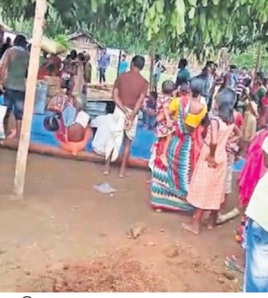
ସାମାଜିକ ଦୂରତା ରକ୍ଷା କରୁ ନ ଥିବା ଲୋକେ ।

କନ୍ଧମାଳ ଜିଲାରେ ଦିନକୁ ଦିନ କରୋନା ଆକ୍ରାନ୍ତଙ୍କ ସଂଖ୍ୟା ବୃଦ୍ଧିପାଉଛି । ମାତ୍ର ଲୋକେ ସାମାଜିକ ଦୂରତା ଓ ମାଧ୍ୟ ବ୍ୟବହାର ନିୟମକୁ ମାନ୍ୟନାହାନ୍ତି । ଗ୍ରାମାଞ୍ଚଳରେ ସଚେତନତା ଅଭାବକୁ କଟକଣାକୁ ନ ମାନି ସାମୁଦ୍ରିକ ହାଟ ଓ ବାହାଘର ଭୋଜିରେ ଶତାଧିକ ଲୋକ ଭିଡ଼ ଜମାଉଥିବା ଦେଖିବାକୁ ମିଳୁଛି । ବାଲିଗୁଡ଼ା ଥାନା ପୋଲିସରୁ ଗାଁରେ ଶନିବାର ଏକ ବିବାହ ଭୋଜି କାର୍ଯ୍ୟକ୍ରମ ଅନୁଷ୍ଠିତ ହୋଇଥିଲା । ଏଥିରେ ଶହ ଶହ ଲୋକ ଏକାଠି ହୋଇଥିଲେ । କାହାରି ପୁହଁରେ ମାଧ୍ୟ ନ ଥିଲା କିମ୍ବା କେହି ସାମାଜିକ ଦୂରତା ରକ୍ଷା କରି ନ ଥିଲେ । କିଛିଦିନ ତଳେ କୋରୋନା ଥାନା ଅଞ୍ଚଳର ଏହି ପଞ୍ଚାୟତର ଜନିତ ସରପଞ୍ଚଙ୍କ ଘରେ ବିବାହ ଭୋଜିରେ ଶତାଧିକ ଲୋକ ରୁଦ୍ଧ ହୋଇଥିଲେ । ପ୍ରଶାସନ ଏଥିପ୍ରତି ଦୃଷ୍ଟି ଦେବାକୁ ଦାବି ହେଉଛି ।