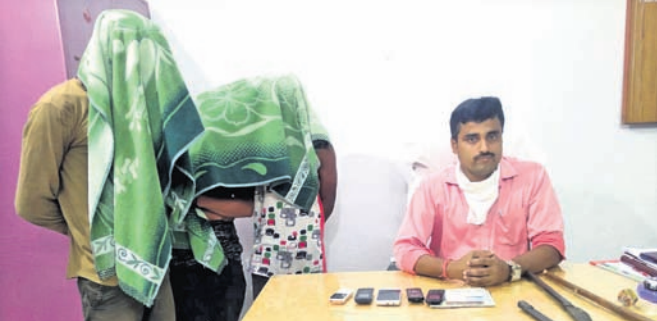
ଗିରଫ ଅଭିଯୁକ୍ତ ।