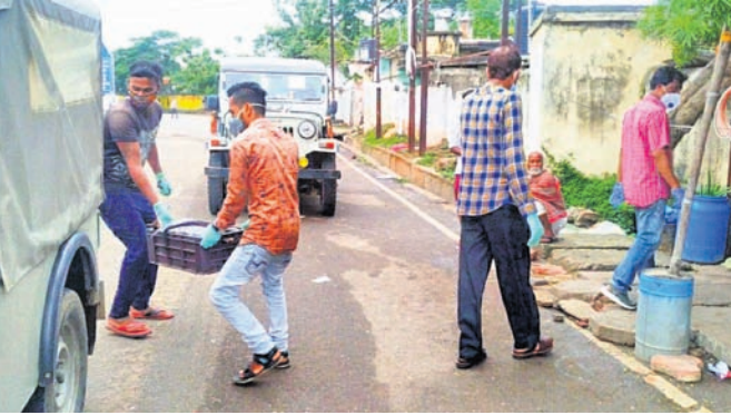
ପ୍ରଶାସନ ପକ୍ଷରୁ ଜବତ କରାଯାଇଥିବା ମାଛ ।

କରୋନା ମୁକାବିଲା ପାଇଁ ଗଞ୍ଜାମ ଜିଲାକୁ ପ୍ରଶାସନ ଶନିବାର ଓ ରବିବାର ଶରତାଉନ୍ ଘୋଷଣା କରିଛି । ତେବେ ରବିବାର ଶରତାଉନ୍ ସତ୍ତ୍ୱେ କମ୍ପାଉଣ୍ଡ ଓ ଉତ୍ତରତ୍ରିକ ନିକଟରେ କେତେକ ମହ୍ୟଜୀବୀ ଏହାକୁ ଉଲ୍ଲଙ୍ଘନ କରି ମାଛ ବିକ୍ରି କରୁଥିବା ଦେଖିବାକୁ ମିଳିଥିଲା । ପ୍ରଶାସନ ପକ୍ଷରୁ ମହ୍ୟଜୀବୀକୁ ତାରିକ କରାଯିବା ସହ ମାଛଗୁଡ଼ିକୁ ଜବତ କରାଯାଇଥିଲା । କିନ୍ତୁ ପରବର୍ତ୍ତୀ ସମୟରେ ମହ୍ୟଜୀବୀମାନେ