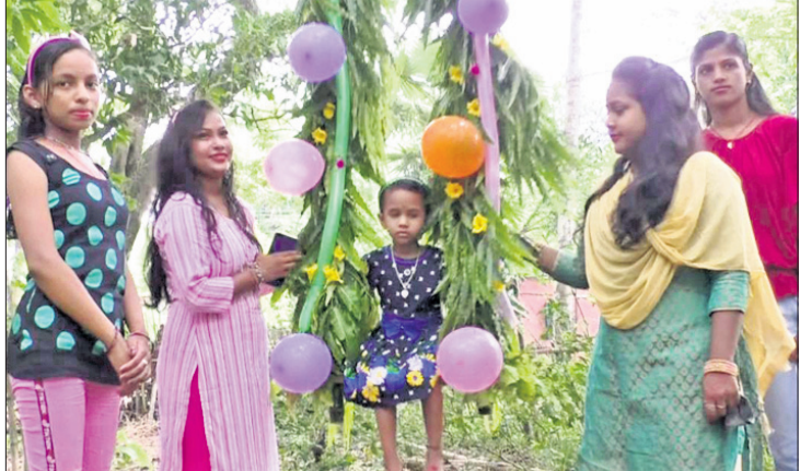
ଘର ବାଡ଼ିରେ ବନ୍ଧା ହୋଇଥିବା ବୋଲିରେ ମଜା ଉଠାଇଛନ୍ତି କୁଆଁରୀମାନେ।

ଭଦ୍ରକ ଅଫିସ, ୧୫୫୬ ଭଦ୍ରକ ଜିଲ୍ଲାରେ ସପ୍ତାହର ଦୁଇଦିନ ଶରତାଉନ ଥିବାରୁ ପହିଲି ରଜ ଫିକା ପଡ଼ିଛି। ଆଉ କିଏ ଘର ଭିତରେ ରଜ