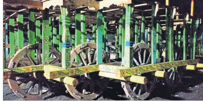
ରଥ ନିର୍ମାଣ କାମ ଜାରି ରହିଛି।