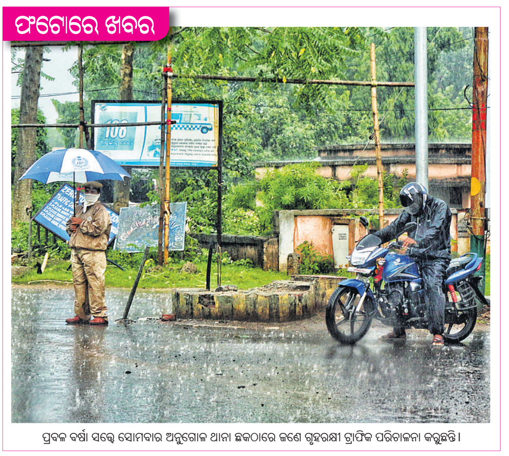
ପ୍ରବଳ ବର୍ଷା ସତ୍ତ୍ୱେ ସୋମବାର ଅନୁଗୋଳ ଥାନା ଛକଠାରେ ଜଣେ ଗୃହରକ୍ଷୀ ଗ୍ରାମିକ ପରିଚାଳନା କରୁଛନ୍ତି।

ପୁର ବିହନ ରହିଛି। ପରୀକ୍ଷଣ ପରେ ଚାଷୀ ଯୋଗାଇ ଦିଆଯିବ। ସେହିପରି ସାର ନେଇ କୌଣସି ସମସ୍ୟା ନାହିଁ। ଚଳିତ ଖରିଫ ଚାଷ ପାଇଁ ୧୪ ହଜାର ୨୦୦ ମେଟ୍ରିକ୍ ଟନ୍ ସାର ବରଦାର ଥିବାବେଳେ ଜିଲାରେ ଡିଏପି ଓ ପଦାସ ସଂପୂର୍ଣ୍ଣ ପରିମାଣର ମହଜୁଦ ଅଛି। ୫ ଶହ କୁଳଖାଇ ଘୁରିଆ ସାର ଗଚ୍ଛିତ ରହିଛି। ଚଳିତ ମାସରେ ଆଉ କିଛି ଘୁରିଆ ପହଞ୍ଚିବ। କରୋନା ଯୋଗୁ ପ୍ରବାସୀ ଶ୍ରମିକ ଘରକୁ ଫେରିଛନ୍ତି। ସେମାନଙ୍କ ଜୀବନ ଜାବିବାକୁ ଦୃଷ୍ଟିରେ ରଖି ଚାଷ କାର୍ଯ୍ୟରେ ସେମାନଙ୍କୁ ନିୟୋଜିତ କରିବା ସହ ସମସ୍ତ କୃଷିଭିତ୍ତିକ ଯୋଜନାକୁ ଉପେକ୍ଷାରେ ସହ କାର୍ଯ୍ୟକାରୀ କରିବା ଉପରେ ବିଭାଗ ଗୁରୁତ୍ୱ ଦେଉଛି। ଜିଲା ମୁଖ୍ୟ କୃଷି ଅଧିକାରୀ ବେହେରା କହିଛନ୍ତି, ଏ ବର୍ଷ ଠିକ୍ ସମୟରେ ମୌସୁମୀ ଆସି ପହଞ୍ଚିଛି। ଜିଲାର ପ୍ରାୟ ୧୫ ପ୍ରତିଶତ ଜମିରେ ବୁଣାବୁଣି ସରିଲାଣି। ଏଥର ଭଲ ଚାଷ ହେବ ବୋଲି ଆଶା କରାଯାଇଛି।