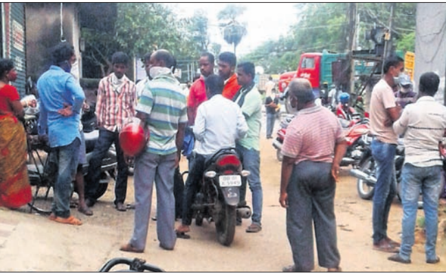
ନର୍ସିଂହୋମ୍ ସମ୍ମୁଖରେ ଉତ୍ତରଭାଗ ପରିବାର ଲୋକେ।