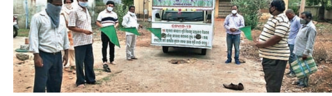
ଅଧିକାରୀମାନେ କୃଷି ସଚେତନତା ରଥକୁ ଉଦ୍‌ଘାଟନ କରୁଛନ୍ତି ।