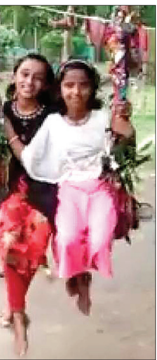
ଝିଅମାନେ ବୋଲି ଖେଳୁଛନ୍ତି।

ବାଲେଶ୍ଵର ଜିଲ୍ଲା ଅଧୀନ ଖଲରା ବ୍ଲକ୍‌ରେ ରଜ କଟକଣା ମଧ୍ୟରେ ପାଳନ କରାଯାଉଛି। ଝିଅମାନେ ସାମାଜିକ କଟକଣା ମଧ୍ୟରେ ବୋଲି ଖେଳୁଥିବା ବେଳେ ଅଳତା ମେହେନ୍ଦିରେ ସଜେଇ ହେଉଥିବା ଦେଖିବାକୁ ମିଳୁଛି। ଲୋମାରେ ଘରେ ପିଠାପଣାରେ ଆନନ୍ଦ ନେଉଛନ୍ତି। ସେହିଭଳି ବ୍ଲକ୍‌ର ଲୁଆଁକଗଡ଼ିଆ, ସିପୁଲିଆ, ନନ୍ଦିପୁର, ନହଙ୍ଗ ଆଦି ଗ୍ରାମରେ ବିନା ଗହଳିରେ ପୂଜା ଯଥାବିଧି ନୀତିରେ ସମ୍ପର୍ଣ୍ଣ ହେଉଛି।