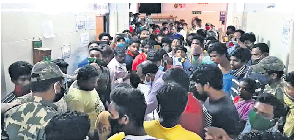
ରୋଗୀଙ୍କ ମୃତ୍ୟୁକୁ ନେଇ ସମ୍ପର୍କୀୟମାନେ ତାହାରଖାନା ପରିସରରେ ପାଟିବୁଝ କରୁଛନ୍ତି ।

ଚିକିତ୍ସା ଅବହେଳାକୁ ଜଣେ ରୋଗୀଙ୍କ ମୃତ୍ୟୁକୁ ନେଇ ଯୋଗଦାନ ରାୟଗଡ଼ା ଜିଲ୍ଲା ମୁଖ୍ୟ ଚିକିତ୍ସାଳୟରେ ଉଡ଼େଜନା ପ୍ରକାଶ ପାଇଛି । ଘଟଣାରୁ ପ୍ରକାଶ ଯେ, ରାୟଗଡ଼ା ଜିଲ୍ଲା ଚାନ୍ଦିଲି ଥାନା ଅଧୀନ ନାୟରୁପେଟା ଅଞ୍ଚଳର ସାମାଜିକ ସରଫିଆ ବୌଦ୍ଧି କାରଣରୁ ଘରେ ଆତ୍ମହତ୍ୟା ଉଦ୍ୟମ କରିଥିଲେ । ପରିବାର ଲୋକେ ଚିକିତ୍ସା ପାଇଁ ଚାଲୁ ଜିଲ୍ଲା ମୁଖ୍ୟ ଚିକିତ୍ସାଳୟରେ ଭର୍ତ୍ତି କରିଥିଲେ । ମାତ୍ର ସେଠାରେ ତାହାର ଚାଲୁ ମୃତ ଯୋଷଣା କରିଥିଲେ । ତେବେ ତାହାରଖାନା ନେବା ସମୟରେ ସରଫିଆ ଜୀବିତ ଥିବାବେଳେ ଉପଯୁକ୍ତ ଚିକିତ୍ସା ନ କରିବାରୁ ତାଙ୍କର ମୃତ୍ୟୁ ଘଟିଥିବା ପରିବାର ଲୋକ ଅଭିଯୋଗ କରିଥିଲେ । ସେମାନେ ତାହାରଖାନାରେ ଚେୟାର ଚେରୁଲି ଯୋଡ଼ାଥିଲେ । ମୃତଦେହ ବାହାରେ ରଖି ମେଡିକାଲ