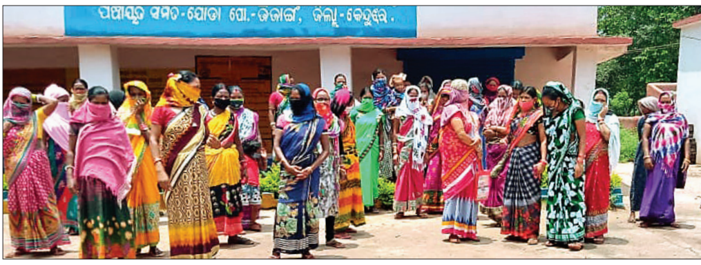
ସୋର ପଞ୍ଚାୟତ କାର୍ଯ୍ୟାଳୟରେ ଏକତ୍ରିତ ହୋଇଥିବା ଅଞ୍ଚଳବାସୀ।

ହୋଇଥିଲା। ଭୋଜନ ପରେ ପୁନର୍ବାର ଡାକ୍ତରଟିପ୍ ପରୀକ୍ଷା କରି ଘରକୁ ଫେରିବା ପରେ ସେ ଫାକ୍ତି ସମ୍ମୁଖରେ ଥିବା ଗଛମୂଳ ପକ୍ଷା ପିଠିରେ ବିଶ୍ଵାସ ନେଇଥିଲେ। ଦେହ ଅସ୍ତ୍ରୁ ଲାଗିବାକୁ ସେ ସେଠାରେ ଶୋଇପଡ଼ିଥିଲେ। ଦୀର୍ଘ ସମୟ ପର୍ଯ୍ୟନ୍ତ ସେ ନ ଉଠିବାରୁ ଲୋକେ ତାଙ୍କୁ ଡାକି ଓପିଡ଼ିକୁ ନେଇଯାଇଥିଲେ। ମାତ୍ର ସେଠାରେ ଡାକ୍ତର ତାଙ୍କୁ ମୃତ ଘୋଷଣା କରିଥିଲେ। ପରେ ତାଙ୍କର ସମ୍ପର୍କୀୟ ଭାଣିଜା ଓ ଭାଣିଜାବାଳିକା ମୃତଦେହ ଟିକ୍ସ କରି ପରିବାର ଲୋକଙ୍କୁ ଖବର ଦେଇଥିଲେ। ଫାକ୍ତି ପୋଲିସ୍ ମୃତଦେହ ଜବତ କରି ଏକ ଅପମୃତ୍ୟୁ ମାମଲା ରୁଜୁ କରି ବ୍ୟବହୃତ ନିମନ୍ତେ ପଠାଇଛି।