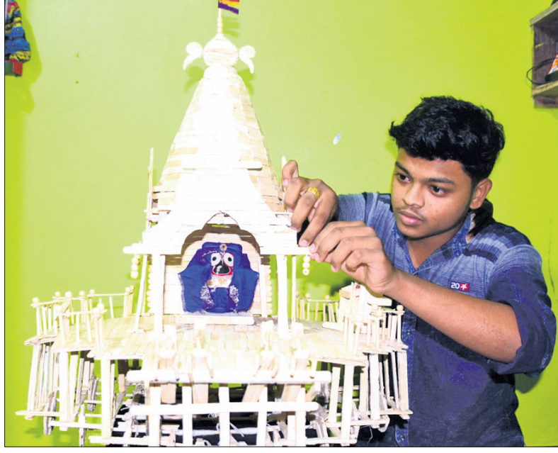
ପୁରୀ କୁମ୍ଭଟିପାଟଣାର ବିଶ୍ୱକିର୍ତ୍ତ ନାୟକଙ୍କ ଦ୍ୱାରା ୨୫୭୫ଟି ଆଇସ୍କ୍ରିମ୍ କାଠିରେ ନିର୍ମିତ ରଥ। ଏହାର ଉଚ୍ଚତା ୨୭ ଲକ୍ଷ ଓ ଚଉଡ଼ା ୨୨ ଲକ୍ଷ। ଏହାକୁ ସମ୍ପୂର୍ଣ୍ଣ କରିବାକୁ ୧୦ ଦିନ ଲାଗିଛି।