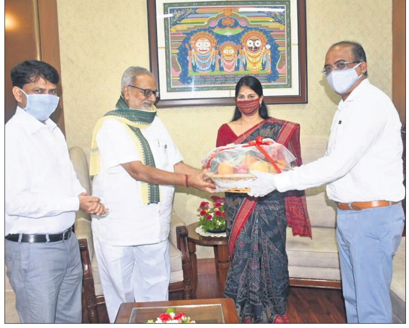
ରକ ପାଇଁ ଅବସରରେ ସୋମବାର ରାଜଭବନରେ ରାଜ୍ୟପାଳ ପ୍ରଫେସର ଗଣେଶୀ ଲାଲ୍‌କୁ ରକପିଠା ପ୍ରଦାନ କରୁଛନ୍ତି ଓଡ଼ିଶା ଅଧ୍ୟକ୍ଷା ଶ୍ରୀମତୀ ମିଶ୍ର ଓ ଅନ୍ୟମାନେ।