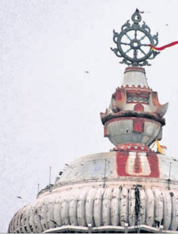
ଶ୍ରୀମନ୍ଦିର ନୀଳଚକ୍ରରୁ ସୋମବାର ପତିତପାବନ ବାନା ଉଡ଼ିଯାଇଛି।

ପୂର୍ବା ଅପସ, ୧୫୬ ଶ୍ରୀମନ୍ଦିର ନୀଳଚକ୍ରରୁ ଉଡ଼ିଗଲା ପତିତପାବନ ବାନା। ସୋମବାର ସକାଳ ପ୍ରାୟ ୯ଟାରେ ପୂର୍ବାରେ ଉଡ଼ିଗଲା ପତିତପାବନ ବାନା। ସୋମବାର ସକାଳ ପ୍ରାୟ ୯ଟାରେ ପୂର୍ବାରେ ଉଡ଼ିଗଲା ପତିତପାବନ ବାନା। ସୋମବାର ସକାଳ ପ୍ରାୟ ୯ଟାରେ ପୂର୍ବାରେ ଉଡ଼ିଗଲା ପତିତପାବନ ବାନା।