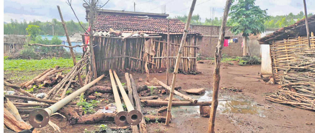
ବିଛା ହେବାକୁ ଆସିଥିବା ପାଇପ୍ ଗ୍ରାମରେ ୨ ବର୍ଷ ହେଲା ପଡ଼ିରହିଛି ।

ବର୍ଷାରୁ ଆସିଲାଣି । ତଥାପି ପାନୀୟ ଜଳ ସମସ୍ୟା ସୁଧୁରିନି କୋରାପୁଟ ଜିଲ୍ଲା ବନମତୀପୁର ବ୍ଲକ୍ ଲୁଲ୍ଲା ପଞ୍ଚାୟତର ଲୁଲ୍ଲା ଗ୍ରାମର ହରିଜନ ସାହିରେ । ଜଳ ଯୋଗାଣ ଲାଗି ସାହିରେ ପାଇପ୍ ପଡ଼ି ନଷ୍ଟହେବାକୁ ବସିଯାଇଛି । ମାତ୍ର ଏ ଦିଗରେ ବିଭାଗ ପଦକ୍ଷେପ ନେଉନି ବୋଲି ସାହିବାସିନ୍ଦା ଅଭିଯୋଗ କରିଛନ୍ତି । ଶତାଧିକ ପରିବାର ବସବାସ କରୁଥିବା ଏହି ସାହିରେ ଜଳ ଯୋଗାଣ ଲାଗି ପଞ୍ଚାୟତ ନିକଟସ୍ଥ ଭାଲିଆ ଡଙ୍ଗରରେ ୨୦ ହଜାର ଲିଟର କ୍ଷମତାବିଶିଷ୍ଟ ଏକ ପାଣିଟାଙ୍କି ନିର୍ମାଣ ହୋଇଥିଲା । ତେବେ ଖୁବ୍ କମ୍ ଦିନ ଜଳ ଯୋଗାଣ ପରେ ଏହା ଅଚଳ ହୋଇପଡ଼ିଥିଲା । ପରେ ଏଠାରେ ୪୦ ହଜାର ଲିଟର ଜଳଧାରଣ କ୍ଷମତାବିଶିଷ୍ଟ ଟାଙ୍କି ନିର୍ମାଣ ହୋଇଥିଲା । ନିମ୍ନମାନର ଟାଙ୍କି ନିର୍ମାଣ କରି ବାସିନ୍ଦା ହେଉଥିବା ଠିକାଦାର କାମ ଛାଡ଼ିଦେବା ପରେ ଆରତ୍ନସୁଧାଏସ୍‌ଏସ୍‌ଏସ୍ କନିଷ୍ଠ ଯନ୍ତ୍ରୀ ଆଉ ଜଣେ ଠିକାଦାରଙ୍କୁ ପାଇପ ବିଛାଇବା କାର୍ଯ୍ୟ ଦେଇଥିଲେ । ପାଇପ କାର୍ଯ୍ୟ ସରି ଛିଣ୍ଡି ମାସ ପରେ ହରିଜନ