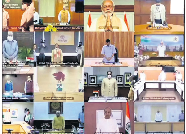
ରୁଧିରା ଭିତ୍ତି କନ୍ଦୁରେ କର୍ମଚାରୀଙ୍କ ସମ୍ମୁଖରେ ନବୀନ ଶହୀଦ ସମାଜର ଉଦ୍ଦେଶ୍ୟରେ ପ୍ରଧାନମନ୍ତ୍ରୀ ନରେନ୍ଦ୍ର ମୋଦି, ମୁଖ୍ୟମନ୍ତ୍ରୀ ନବୀନ ପଟ୍ଟନାୟକ ଓ ଅନ୍ୟ ମୁଖ୍ୟମନ୍ତ୍ରୀମାନେ ନୀରବ ପ୍ରାର୍ଥନା କରୁଛନ୍ତି।

ଭୁବନେଶ୍ୱର, ୧୭୬୭(ଭୁବନେ) କରୋନା(କୋଭିଡ୍-୧୯) ମହାମାରୀ ସଂକ୍ରମଣ ଆଶଙ୍କା ଯୋଗୁ ଖୁଲି, କଲେଜ ବନ୍ଦ ରହିଛି।