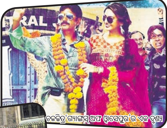
ଚଳଚ୍ଚିତ୍ର 'ଗ୍ୟାଙ୍ଗସ୍ ଅଫ୍ ଓସେପୁର'ର ଏକ ଦୃଶ୍ୟ

ହିନ୍ଦୀ ସିନେମା 'ଗ୍ୟାଙ୍ଗସ୍ ଅଫ୍ ଓସେପୁର'ର ଅବଧି କେତେ ଥିଲା ଜାଣନ୍ତି ? ୩୧୯ ମିନିଟ୍ । ଭାରତରେ ଏହି ସିନେମାଟି ବୁଲଟି ପାର୍ଟରେ ରିଲିଜ୍ ହୋଇଥିଲା । କିନ୍ତୁ କାନ୍ସ ଫିଲ୍ମ ଫେଷ୍ଟିଭାଲରେ ଏହାକୁ ଏକତ୍ର ଗୋଟିଏ ସିନେମା ଆକାରରେ ପ୍ରଦର୍ଶନ କରାଯାଇଥିଲା । ଏହାର ମୁଖ୍ୟ ଭୂମିକାରେ ମନୋଜ ବାଜପେୟୀ ଏବଂ ରିତା ବତ୍ସା ଅଭିନୟ କରିଥିଲେ ।