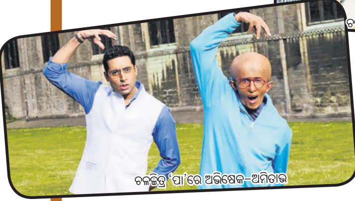
ଚଳଚ୍ଚିତ୍ର 'ପା'ରେ ଅଭିଷେକ-ଅମିତାଭ

ଥରେ ମନେ ପକାନ୍ତୁ ନା ସେହି ହିନ୍ଦୀ ସିନେମା 'ପା'କୁ । ଏଥିରେ ଅମିତାଭ ବଚନଙ୍କ ଭୂମିକା ଦର୍ଶକଙ୍କୁ ବେଶ୍ ପ୍ରଭାବିତ କରିଥିଲା । ଉକ୍ତ ଚଳଚ୍ଚିତ୍ରରେ ଅଭିଷେକ ବଚନଙ୍କୁ ମଧ୍ୟ ଦେଖିବାକୁ ମିଳିଥିଲା । ଏଥିରେ ସେ ଅମିତାଭଙ୍କ ପୂଅ ଭୂମିକାରେ ଅଭିନୟ କରିଥିଲେ ।