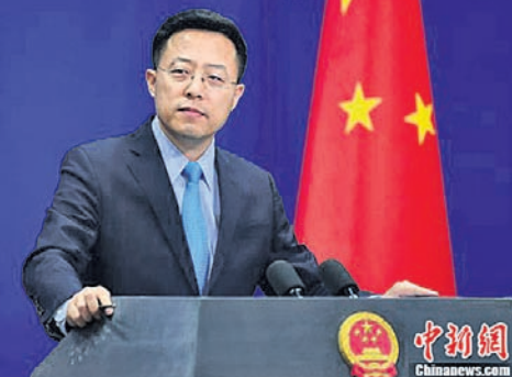
ଚାଇନା ବହିର୍ବ୍ୟାପାର ମନ୍ତ୍ରଣାଳୟ ମୁଖ୍ୟପାତ୍ର ଝାଓ ଲିଜିଆନ୍

ଚାଇନା ବହିର୍ବ୍ୟାପାର ମନ୍ତ୍ରଣାଳୟ ମୁଖ୍ୟପାତ୍ର ଝାଓ ଲିଜିଆନ୍ ଏକ ଖବରଦାତା ସମ୍ମିଳନୀରେ କହିଛନ୍ତି, ଗଲ୍‌ଡ୍ରାନ୍ ଉପତ୍ୟକା ଅଞ୍ଚଳରେ ସବୁବେଳେ ଚାଇନାର ସାଧାରଣ ସେନା ରହିଥାଏ। ଏହା ଚାଇନାର ଅଞ୍ଚଳ। ତେବେ ଗଲ୍‌ଡ୍ରାନ୍‌କୁ ଭାରତ-ଚାଇନାର ସୀମା ଭାବେ ବିବେଚନା କରାଯାଉଥିବାବେଳେ ବେଙ୍ଗି ଏହା ଉପରେ ସାଧାରଣ ସେନା କାହିଁକି କାହିଁକି କରୁଛି ବୋଲି ଖବରଦାତାମାନେ ପ୍ରଶ୍ନ କରିଥିଲେ। ଏହାର ଉତ୍ତରରେ ଝାଓ କହିଥିଲେ, ଏହି ଅଞ୍ଚଳ ଏଲ୍‌ଏସିଏ ଚାଇନା ପଟେ ଅଛି। ତେଣୁ