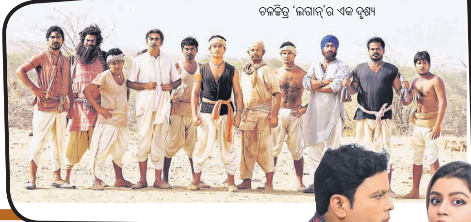
ଚଳଚ୍ଚିତ୍ର 'ଲଗାନ'ର ଏକ ଦୃଶ୍ୟ

ଚାଇନାରେ ରିଲିଜ୍ ହୋଇଥିବା ପ୍ରଥମ ହିନ୍ଦୀ ସିନେମାଟି ହେଉଛି 'ଲଗାନ' । ଆଶୁତୋଷ ଗୋପ୍ପାଲଙ୍କ ନିର୍ଦ୍ଦେଶିତ ଏହି ଫିଲ୍ମରେ ଆମୀର ଖାଁ ନାୟକ ସାଜିଥିଲେ । ଉକ୍ତ ସିନେମାର ଆଉ ଏକ ରୋଚକ କଥା ରହିଛି । ଏଥିରେ ସର୍ବାଧିକ ସଂଖ୍ୟାର ବ୍ରିଟିଶ କଳାକାର ଅଭିନୟ କରିଥିଲେ ।