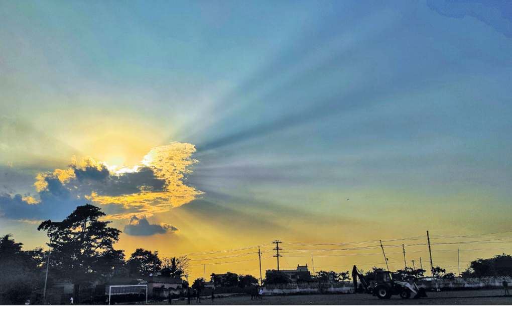
ବାବଲ ତଳେ ଅଗ୍ରାମୀଣୀ ସୂର୍ଯ୍ୟର ଦୃଶ୍ୟ।