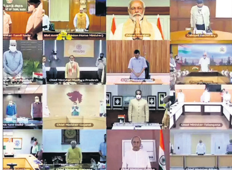
ବୁଧବାର ଭିଡିଓ କନ୍ଫରେନ୍ସ ସମୟରେ ବୀର ଶହୀଦ ଯବାନଙ୍କ ଉଦ୍ଦେଶ୍ୟରେ ପ୍ରଧାନମନ୍ତ୍ରୀ ନରେନ୍ଦ୍ର ମୋଦି, ମୁଖ୍ୟମନ୍ତ୍ରୀ ନବୀନ ପଟ୍ଟନାୟକ ଓ ଅନ୍ୟ ମୁଖ୍ୟମନ୍ତ୍ରୀମାନେ ନୀରବ ପ୍ରାର୍ଥନା କରୁଛନ୍ତି।

ଭୁବନେଶ୍ୱର, ୧୭୬୭(ଭୁବନେଶ୍ୱର) କରୋନା(କୋଭିଡ୍-୧୯) ମହାମାରୀ ସଂକ୍ରମଣ ଆଶଙ୍କା ଯୋଗୁ ସ୍କୁଲ, କଲେଜ ବନ୍ଦ ରହିଛି। ଯୁକ୍ତ ଦୁଇ ପରୀକ୍ଷା ମଧ୍ୟ ଅଧାରୁ ବନ୍ଦ ରହିଛି। ଅବଶିଷ୍ଟ ପରୀକ୍ଷା ଶେଷ ହେବା ପରେ ଜାତୀୟ ସ୍ତରରେ ହେଉଥିବା ଏନିଭାଇଟି, ଜେଇଇ ମେନ, ସିଏଲ୍ଏସି ଭଳି ପ୍ରବେଶିକା ପରୀକ୍ଷା କରିବାକୁ ମୁଖ୍ୟମନ୍ତ୍ରୀ ନବୀନ ପଟ୍ଟନାୟକ ପ୍ରଧାନମନ୍ତ୍ରୀ ନରେନ୍ଦ୍ର ମୋଦିଙ୍କୁ ଅନୁରୋଧ କରିଛନ୍ତି। କରୋନା ସଂକ୍ରମଣ ସ୍ଥିତି ଓ ଅନାମ୍ୟ ବିଷୟରେ ପ୍ରଧାନମନ୍ତ୍ରୀ ନରେନ୍ଦ୍ର ମୋଦି ବିଭିନ୍ନ ରାଜ୍ୟକୁ ଗ୍ରାମ୍ୟରୁ ରାଜ୍ୟର ମୁଖ୍ୟମନ୍ତ୍ରୀମାନଙ୍କ ସହ ଦୁଇଦିନ ହେବ ଆଲୋଚନା କରୁଛନ୍ତି। ବୁଧବାର ଅପରାହ୍ନରେ ପ୍ରଧାନମନ୍ତ୍ରୀ ନବୀନଙ୍କ ସହ ରାଜ୍ୟର କରୋନା ମୁକାବିଲା ଓ ଅନାମ୍ୟ ବିଷୟରେ ଭିଡିଓ କନ୍ଫରେନ୍ସ କରିଆଣେ ଆଲୋଚନା କରିଥିଲେ। ଆଲୋଚନା ବେଳେ ମୁଖ୍ୟମନ୍ତ୍ରୀ ୩ଟି ଦାବି କରିଛନ୍ତି । ମୁଖ୍ୟମନ୍ତ୍ରୀ କହିଛନ୍ତି ଯେ, ଓଡ଼ିଶା ପାଇଁ ଜୁନ ମାସ ଅନ୍ତେ କଠିନ ସମୟ। ରାଜ୍ୟରେ ମୌସୁମୀ ବର୍ଷା ଆରମ୍ଭ ହୋଇଯାଇଛି। ବହୁ ସଂଖ୍ୟାରେ ପ୍ରବାସୀ ରାଜ୍ୟକୁ ଫେରିଛନ୍ତି। ପୂର୍ବଭଳି ରାଜ୍ୟକୁ ଟ୍ରେନ୍ ଓ ବିମାନ ସେବା ଉପରେ କଟକଣା ଜାରି ରଖିବାକୁ ମୁଖ୍ୟମନ୍ତ୍ରୀ ଅନୁରୋଧ କରିଛନ୍ତି। ସେହିପରି ଉପସାଗରୀୟ ଦେଶଗୁଡ଼ିକରେ ଓଡ଼ିଶାର କେତେକ ଲୋକ ରହିଯାଇଛନ୍ତି। ସେମାନଙ୍କ ମଧ୍ୟରେ ଅନେକ ଛୋଟ ଛୋଟ ଚାକିରି କରିଛନ୍ତି। ସେମାନଙ୍କୁ ଫେରାଇ ଆଣିବାକୁ ମୁଖ୍ୟମନ୍ତ୍ରୀ ପ୍ରଧାନମନ୍ତ୍ରୀଙ୍କୁ ଅନୁରୋଧ କରିଛନ୍ତି।