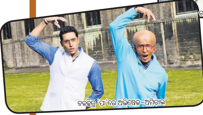
ଚଳଚ୍ଚିତ୍ର 'ପା'ରେ ଅଭିଷେକ-ଅମିତାଭ

ଥରେ ମନେ ପକାନ୍ତୁ ନା ସେହି ହିନ୍ଦୀ ସିନେମା 'ପା'କୁ । ଏଥିରେ ଅମିତାଭ ବଚନଙ୍କ ଭୂମିକା ଦର୍ଶକଙ୍କୁ ବେଶ୍ ପ୍ରଭାବିତ କରିଥିଲା । ଉକ୍ତ ଚଳଚ୍ଚିତ୍ରରେ ଅଭିଷେକ ବଚନଙ୍କୁ ମଧ୍ୟ ଦେଖିବାକୁ ମିଳିଥିଲା । ଏଥିରେ ସେ ଅମିତାଭଙ୍କ ପୂଅ ଭୂମିକାରେ ଅଭିନୟ କରିଥିଲେ ।