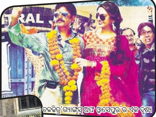
ଚଳଚ୍ଚିତ୍ର 'ଗ୍ୟାଙ୍ଗସ୍ ଅଫ୍ ଓସେପୁର'ର ଏକ ଦୃଶ୍ୟ

ହିନ୍ଦୀ ସିନେମା 'ଗ୍ୟାଙ୍ଗସ୍ ଅଫ୍ ଓସେପୁର'ର ଅବଧି କେତେ ଥିଲା ଜାଣନ୍ତି ? ୩୧୯ ମିନିଟ୍ । ଭାରତରେ ଏହି ସିନେମାଟି ବୁଲ୍ଡି ପାର୍ଟରେ ରିଲିଜ୍ ହୋଇଥିଲା । କିନ୍ତୁ କାନ୍ସ ଫିଲ୍ମ ଫେଷ୍ଟିଭାଲରେ ଏହାକୁ ଏକତ୍ର ଗୋଟିଏ ସିନେମା ଆକାରରେ ପ୍ରଦର୍ଶନ କରାଯାଇଥିଲା । ଏହାର ମୁଖ୍ୟ ଭୂମିକାରେ ମନୋଜ ବାଜପେୟୀ ଏବଂ ରିତା ବତ୍ସା ଅଭିନୟ କରିଥିଲେ ।