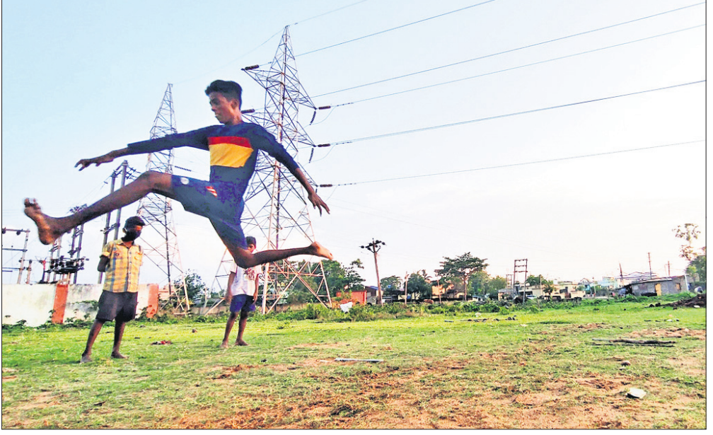
ଅନୁଗୋଳ ସହର ଉପକଣ୍ଠରେ ପିଲାମାନେ ବାଡ଼ିଆଁ ଖେଳୁଛନ୍ତି।