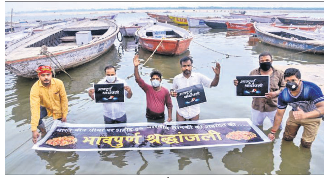
ଗଙ୍ଗାନଦୀରେ ଶହାଦ ଯବାନମାନଙ୍କୁ ଭାବପୂର୍ଣ୍ଣ ଶ୍ରଦ୍ଧାଞ୍ଜଳି ଦେଉଛନ୍ତି ବାରାଣସୀର ସ୍ଥାନୀୟ ଲୋକେ।