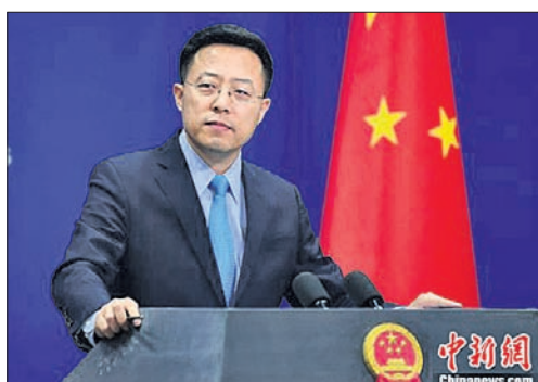
ଚାଇନା ବହିର୍ବ୍ୟାପାର ମନ୍ତ୍ରୀମାନଙ୍କ ମୁଖପାତ୍ର ଝାଓ ଲିଜିଆନ୍

ଲଦାଖର ଗଲ୍‌ଡ୍ରାନ୍ ଉପତ୍ୟକା ଉପରେ ବୁଧବାର ପୁଣିଥରେ ନିଜର ଦାବି ଦୋହରାଇଛି ଚାଇନା। ଏହି ଅଞ୍ଚଳ ସବୁବେଳେ ଚାଇନାର ଥିଲା ବୋଲି ବେଙ୍ଗି ପକ୍ଷରୁ କୁହାଯାଇଛି। ଅନ୍ୟପକ୍ଷରେ ସମ୍ପୂର୍ଣ୍ଣ ଭୂଖଣ୍ଡର ଛିଡାବନ୍ଧାରେ ଚାଇନା ସେନାର ଏକତରଫା ପରିବର୍ତ୍ତନ ଉଦ୍ୟମ ଯୋଗୁ ବୁଦ୍ଧବେଶ ମଧ୍ୟରେ ସଂଘର୍ଷ ଘଟିଥିବା ଭାରତର ବହିର୍ବ୍ୟାପାର ମନ୍ତ୍ରୀମାନଙ୍କ ପକ୍ଷରୁ ଜାରି ଏକ ବିବୃତ୍ତିରେ କୁହାଯାଇଛି। ଚାଇନା ବହିର୍ବ୍ୟାପାର ମନ୍ତ୍ରୀମାନଙ୍କ ମୁଖପାତ୍ର ଝାଓ ଲିଜିଆନ୍ ଏକ ଖବରଦାତା ସମ୍ମିଳନୀରେ କହିଛନ୍ତି, ଗଲ୍‌ଡ୍ରାନ୍ ଉପତ୍ୟକା ଅଞ୍ଚଳରେ ସବୁବେଳେ ଚାଇନାର ସାର୍ବଭୌମତ୍ୱ ରହିଆସିଛି। ଏହା ଚାଇନାର ଅଞ୍ଚଳ। ତେବେ ଗଲ୍‌ଡ୍ରାନ୍କୁ ଭାରତ-ଚାଇନାର ସୀମା ଭାବେ ବିବେଚନା କରାଯାଉଥିବାବେଳେ ବେଙ୍ଗି ଏହା ଉପରେ ସାର୍ବଭୌମତ୍ୱ କାହିଁକି କାହିଁକି କରୁଛି ବୋଲି ଖବରଦାତାମାନେ ପ୍ରଶ୍ନ କରିଥିଲେ। ଏହାର ଉତ୍ତରରେ ଝାଓ କହିଥିଲେ, ଏହି ଅଞ୍ଚଳ ଏଲ୍‌ଏସିଏ ଚାଇନା ପଟେ ଅଛି। ତେଣୁ