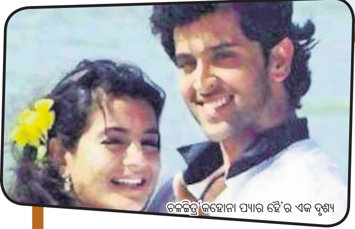
ଚଳଚ୍ଚିତ୍ର 'କିଶୋରୀ ପ୍ୟାର ହେ'ର ଏକ ଦୃଶ୍ୟ