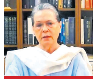
ଦେଶବାସୀଙ୍କୁ ଜଣାନ୍ତୁ ପ୍ରଧାନମନ୍ତ୍ରୀ: ସୋନିଆ

ନୂଆଦିଲ୍ଲୀ, ୧୭୬୬ (ପି.ଟି.) ଚାଲିନା କିପରି ଭାରତୀୟ ଅଞ୍ଚଳକୁ ଦଖଲ କଲା ଏବଂ କ’ଣ ପାଇଁ ୨୦ ଯବାନ ଶହାଦ ହେଲେ ପ୍ରଧାନମନ୍ତ୍ରୀ ନରେନ୍ଦ୍ର ମୋଦି ଏ ସମ୍ପର୍କରେ ଦେଶବାସୀଙ୍କୁ ଜଣାଇବା ଆବଶ୍ୟକ ବୋଲି କଂଗ୍ରେସର ଅଧ୍ୟକ୍ଷ ସୋନିଆ ଗାନ୍ଧୀ କହିଛନ୍ତି। ଭାରତର କେତେ ଅଞ୍ଚଳ ଚାଲିନା ଦଖଲକୁ ଯାଇଛି ଏବଂ ସ୍ଥିତିର ମୁକାବିଲା ପାଇଁ ସରକାର କ’ଣ ରଣନୀତି ଗ୍ରହଣ କରିଛନ୍ତି ତାହା ଜଣାଇବାକୁ ସୋନିଆ ଆହ୍ୱାନ ଦେଇଛନ୍ତି। ଏଭଳି ସକ୍ତ ସମୟରେ କଂଗ୍ରେସ ଭାରତୀୟ ସେନା, ଏହାର ଯବାନ, ସେମାନଙ୍କ ପରିବାର ଓ ସରକାରଙ୍କ ସହିତ ରହିଥିବା ସେ କହିଛନ୍ତି।