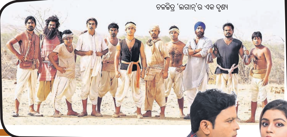
ଚଳଚ୍ଚିତ୍ର 'ଲଗାନ'ର ଏକ ଦୃଶ୍ୟ

ଚାଇନାରେ ରିଲିଜ୍ ହୋଇଥିବା ପ୍ରଥମ ହିନ୍ଦୀ ସିନେମାଟି ହେଉଛି 'ଲଗାନ' । ଆଶୁତୋଷ ଗୋପ୍ପାଲଙ୍କ ନିର୍ଦ୍ଦେଶିତ ଏହି ଫିଲ୍ମରେ ଆମୀର ଖାଁ ନାୟକ ସାଜିଥିଲେ । ଉକ୍ତ ସିନେମାର ଆଉ ଏକ ରୋଚକ କଥା ରହିଛି । ଏଥିରେ ସର୍ବାଧିକ ସଂଖ୍ୟାର ବ୍ରୁଟିଶ କଳାକାର ଅଭିନୟ କରିଥିଲେ ।