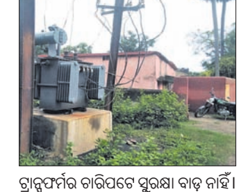
ଗ୍ରାହକମାନଙ୍କ ଚାରିପାଖେ ସୁରକ୍ଷା ବାଡ଼ି ନାହିଁ।