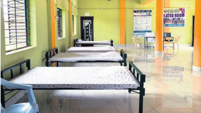
କୋଭିଡ଼ କେୟାର ହୋମ୍ କାମ ଚାଲିଛି।