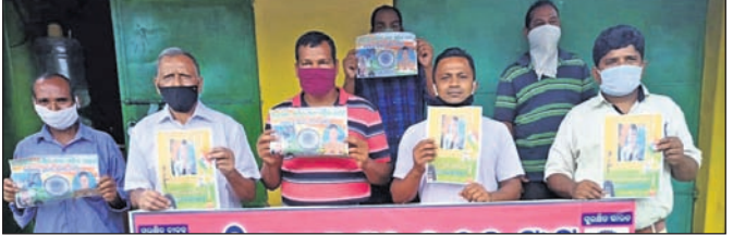
ରାଜକିଆ ମୋଟର ଚାଳକ ସଂଘ ତରଫରୁ ଶ୍ରଦ୍ଧାଞ୍ଜଳି ଦିଆ ଯାଉଛି।