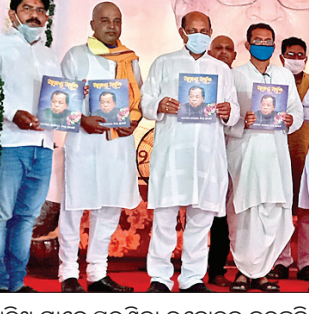
ଅତିଥି ମାନେ ସ୍ମରଣୀକା ଉନ୍ମୋଚନ କରୁଛନ୍ତି।