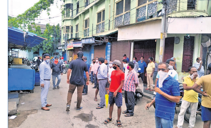
ଅନୁପୂର୍ଣ୍ଣା ମାର୍କେଟ ଅଞ୍ଚଳର ଏକ ଦୋକାନକୁ ବନ୍ଦ କରାଯାଇଛି।