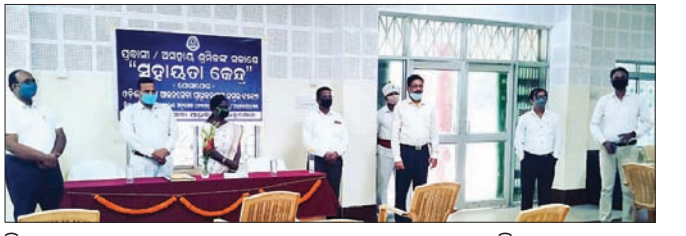
ଜିଲା ଆଇନସେବା ପ୍ରାଧିକରଣ ପକ୍ଷରୁ ସହାୟତା କେନ୍ଦ୍ର ଉଦ୍ଘାଟିତ।