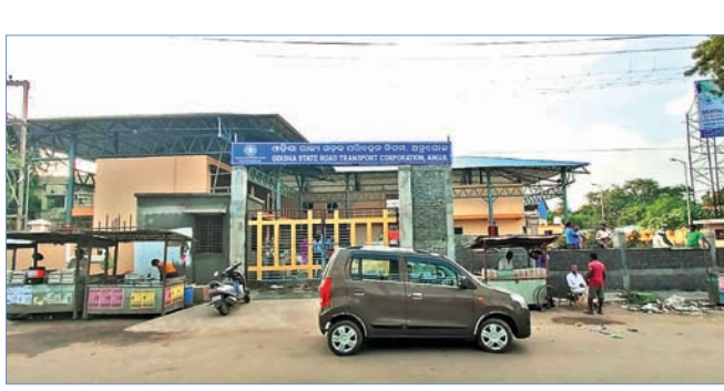
ଅନୁଗୋଳରେ ଥିବା ଓଏସ୍‌ଆର୍‌ସି ଅଫିସ୍।