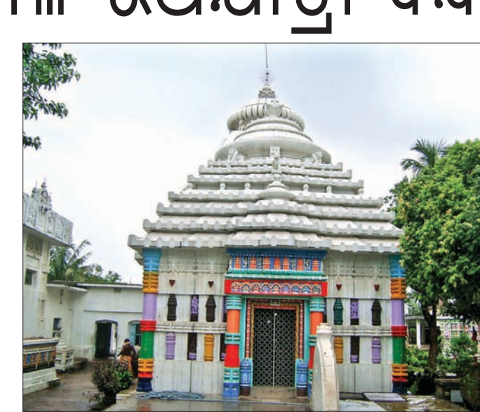
ଡେକାନାଲ ବଳରାମ ମନ୍ଦିର।