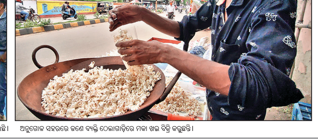
ଅନୁଗୋଳ ସହରରେ କଣେ ବ୍ୟକ୍ତି ଠେଲାଗାଡ଼ିରେ ମକା ଖଳ ବିକ୍ରି କରୁଛନ୍ତି।