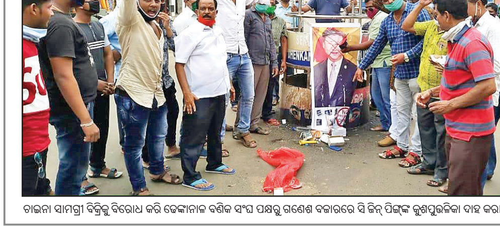
ଚାରଣା ସାମଗ୍ରୀ ବିକ୍ରିକୁ ବିରୋଧ କରି ଡେକାନାଲ ବଣିକ ସଂଘ ପକ୍ଷରୁ ଗଣେଶ ବଜାରରେ ସି ଜିଏ ପିଏଙ୍କ ବୁଣାପୁରୁଲିକା ଦାହ କରାଯାଇଛି।

ଅନୁଗୋଳ ସହରରେ କଣେ ବ୍ୟକ୍ତି ଠେଲାଗାଡ଼ିରେ ମକା ଖଳ ବିକ୍ରି କରୁଛନ୍ତି।