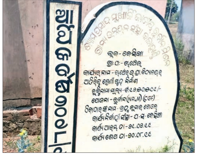
କେସିଜା ବ୍ଲକ୍‌ର ଗଞ୍ଜେଇ ଉପା ବିଦ୍ୟାଳୟର ଅତିରିକ୍ତ ଶ୍ରେଣୀ ଗୃହ ଧାର୍ଯ୍ୟ ତାରିଖ ଭିତରେ ସମ୍ପୂର୍ଣ୍ଣ ହୋଇନାହିଁ।

କେନ୍ଦ୍ର ସରକାର ଓଡ଼ିଶାରେ ଅଣ ଆଦିବାସୀ ଅଞ୍ଚଳରେ ବିଭିନ୍ନ ଉନ୍ନତମାନଙ୍କ କାର୍ଯ୍ୟ କରିବା ପାଇଁ ଓଡ଼ିଶାରେ ୧୪ଟି ରୁର୍ବାନ କେନ୍ଦ୍ର ସ୍ଥଳକୁ ଗ୍ରହଣ କରିଛନ୍ତି।