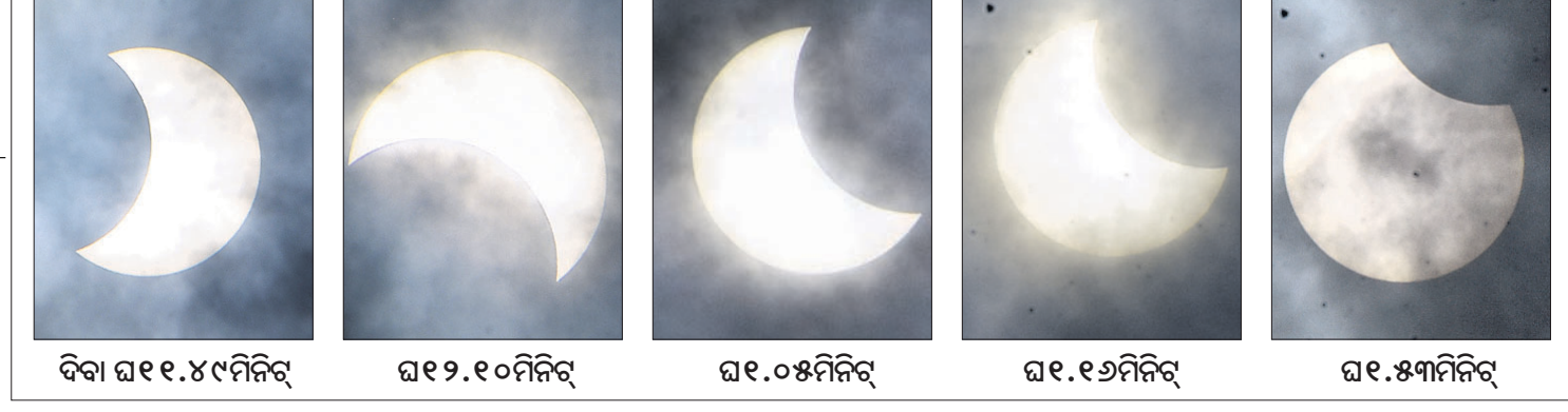
ବିବା ୧୧.୪୯ମିନିଟ୍, ୧୧.୧୦ମିନିଟ୍, ୧୧.୦୫ମିନିଟ୍, ୧୧.୧୨ମିନିଟ୍, ୧୧.୫୩ମିନିଟ୍