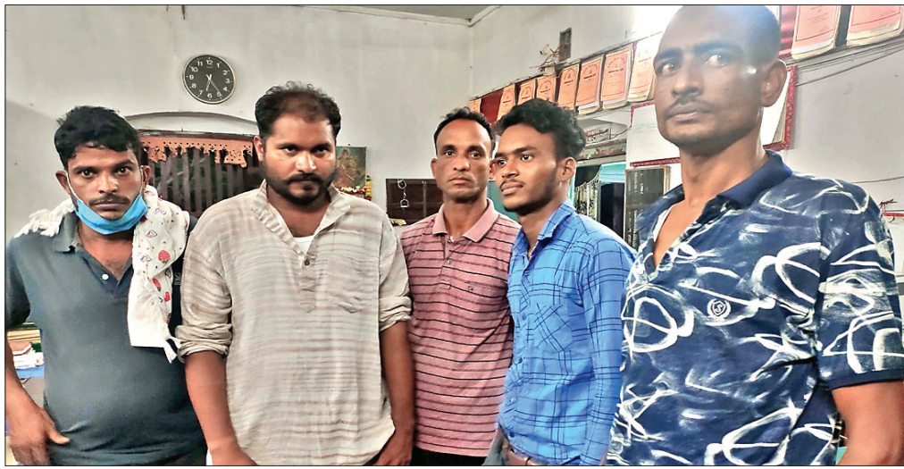
ଅପହରଣ ଘଟଣାର ଚିରଫ ଅଭିଯୁକ୍ତମାନେ।