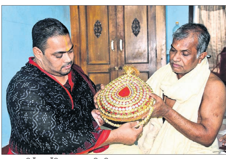
ପୁରୀ: ବାବୁଦିଆଁଙ୍କ ପାଇଁ ଚିତା ପ୍ରସ୍ତୁତ କରୁଛନ୍ତି ବଣିଆ ସେବାୟତ।