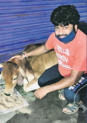
କାର୍ଯ୍ୟରେ କଟକର ସିଲଭର ସିଟି କଟକ ଗ୍ରୁପ୍, ଶିବଗଣ୍ଡି ଗୋ ସେବା ସଂଘ ଆଦି ବିହାର, କଳିଆବୋଦା, ଶିଖରପୁର, ପୋଡ଼ାପୋଖରୀ, ମାୟାପାଟଣା ଅଞ୍ଚଳରେ ଚାକର ସବୁ ରାତିରେ ଏହି ଅଭିଯାନ ଚାଲିଛି। ଆଭାସଙ୍କୁ ଏହି

ଲକ୍ଷ୍ମୀଭଣ୍ଡନ ସମୟରେ ଦୋକାନ ବନ୍ଦୀ ଓ ହୋଟେଲ ବନ୍ଦ ରହିବା ପରେ ବୁଲାଇବାକୁ ଓ ଅନ୍ୟ ପ୍ରାଣୀମାନେ ଖାଦ୍ୟ ପାଇନାହିଁ। ସେକଲ ସମୟରେ ସେମାନଙ୍କୁ ଆହାର ଯୋଗାଇଛନ୍ତି କଟକ ମହାନଦୀ ବିକାର ଅଞ୍ଚଳର ଆଭାସ ମହାନ୍ତି।