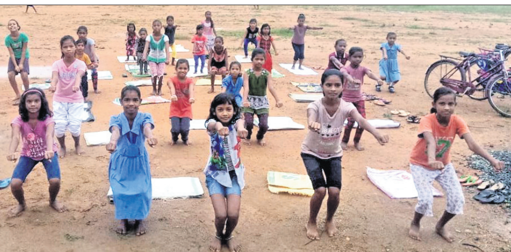
ରବିବାର ସମ୍ବଲପୁର ଜିଲ୍ଲା ବିଶାଳଖଣ୍ଡା ଗାଁରେ ସ୍ତ୍ରୀଗ୍ରାମୀଣ ଯୋଗାଭ୍ୟାସ କରୁଛନ୍ତି।

ଅନ୍ତର୍ଜାତୀୟ ଯୋଗ ଦିବସ ରବିବାର ହାରାକୃତ କଲୋନୀ ସ୍ଥିତ ପଞ୍ଚମଣି ଯୋଗ ପ୍ରତିଷ୍ଠା କେନ୍ଦ୍ରରେ ଅନୁଷ୍ଠିତ ହୋଇଯାଇଛି।