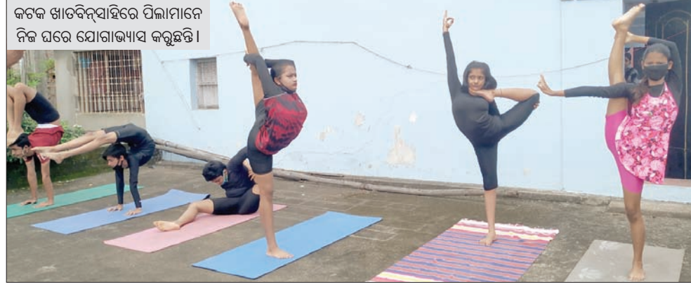
କଟକ ଖାତବିନ୍ଦସାହିରେ ପିଲାମାନେ ନିଜ ଘରେ ଯୋଗାଭ୍ୟାସ କରୁଛନ୍ତି।