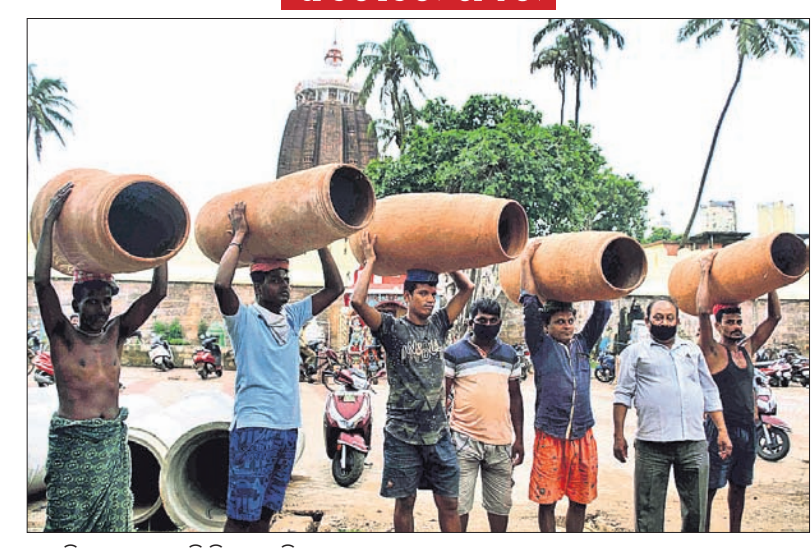
ଶ୍ରୀମନ୍ଦିରକୁ ଅଧର ହାଣ୍ଡି ନିଆଯାଉଛି।