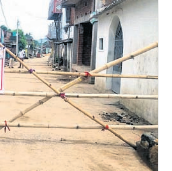
ପଦ୍ମପୁର ପୌରାଞ୍ଚଳରେ ବ୍ୟାରିକେଡ୍ କରାଯାଇଛି।

ବରଗଡ଼ ଜିଲ୍ଲାରେ କରୋନା (କୋଭିଡ୍-୧୯) ସଂକ୍ରମଣ ବଢ଼ିଚାଲିଛି। ଏପର୍ଯ୍ୟନ୍ତ ଏଥିରେ ଜିଲ୍ଲାର ୬୬ଜଣ ଆକ୍ରାନ୍ତ ହୋଇଛନ୍ତି। ସେମାନଙ୍କ ମଧ୍ୟରୁ ୨୬ଜଣ ମୃତ୍ୟୁ ହୋଇଛି।