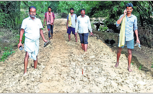
ରାସ୍ତାରେ ଲୋକେ ହାତରେ ଜୋତା ଧରି ଯାଉଥିବା ବେଳେ ଅନ୍ୟକଣ୍ଠେ ସାଇକେଲ କାନ୍ଧେଇ ଯାଉଛନ୍ତି।

ଏମିତି ରାସ୍ତା ରହିଛି ଯେଉଁଠି ପାଦରେ ଚପଳ ପିନ୍ଧି ଯିବା ଅସମ୍ଭବ। ଲୋକେ ହାତରେ ଜୋତା ଧରି କାନ୍ଧରେ ସାଇକେଲ ପକାଇ ଘରୁ ବାହାରିଥାନ୍ତି। ମାଣ୍ଡହ ନିଟର ପର୍ଯ୍ୟନ୍ତ ଏମିତି ଅବସ୍ଥାରେ ଆସିବା ପରେ ମୁଖ୍ୟ ରାସ୍ତାରେ ପହଞ୍ଚିଥାନ୍ତି। ଏଭଳି ଦୁର୍ଗମ ବେଞ୍ଚବାକୁ ମିଳେ ଭଦ୍ରକ ଜିଲ୍ଲା ଭଣ୍ଡାରପୋଖରୀ ବ୍ଲକ୍ ଜଳମଣ୍ଡୁଆ ପଞ୍ଚାୟତରେ। ଆରଡ଼ି ରୋଡ଼ ସରିପୁରଠାରୁ ୩୦୦ ମିଟର ପର୍ଯ୍ୟନ୍ତ ରାସ୍ତାର ଅବସ୍ଥା ଏହିଭଳି ହୋଇଥିବାରୁ ଲୋକେ ଅକଥମାନଙ୍କ ଦୁର୍ଦ୍ଦଶାର ସମ୍ମୁଖୀନ ହେଉଛନ୍ତି। ଗ୍ରାମ୍ୟଭିତ୍ତୀନ ରାସ୍ତା ସରିପୁରଠାରୁ ବିଭାଗର ରେବ ନଦୀବନ୍ଧ ରାସ୍ତା। ସରିପୁରଠାରୁ ରେବନଦୀ ପର୍ଯ୍ୟନ୍ତ ରାସ୍ତାର ଲମ୍ବ ପ୍ରାୟ ୧କି.ମି.। ନଦୀବନ୍ଧ ରାସ୍ତା ହୋଇଥିବାରୁ ଏହା ଯାକପୁର ଜଳସମ୍ପଦ ବିଭାଗ ଅଧୀନରେ ରହିଛି। ରାସ୍ତାର କ୍ଷତାଂଶ ଅଧିକାରୀ ଭାବେ ଆଖୁଆପଦା ଜଳସମ୍ପଦ ବିଭାଗ ଉପନିବହାୟତ୍ରୀ ଓ ବାରିକପୁର ଜଳସମ୍ପଦ ବିଭାଗ କନିଷ୍ଠସମ୍ପାଦକ ଉପରେ ରେବ ନଦୀବନ୍ଧର ଉତ୍ତରାଧିକାରୀ ଦାୟିତ୍ୱ ରହିଛି। ଉଚ୍ଚ