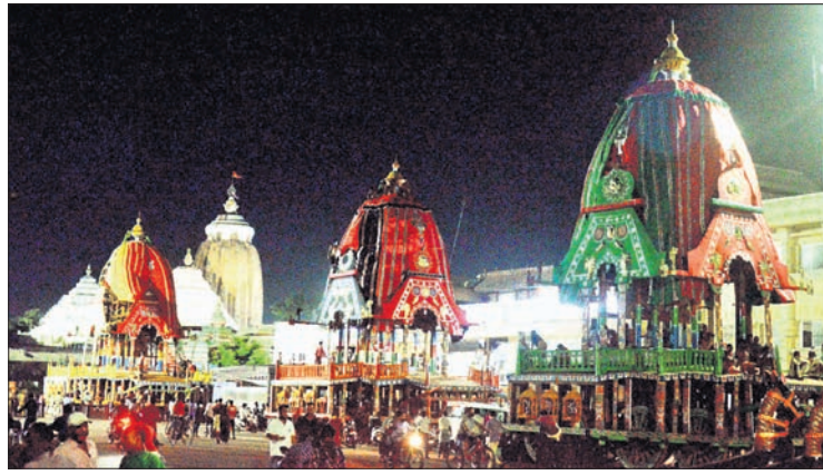
କପଡ଼ା ଲଗାଯିବା ପରେ ତିନିଠା

ରଥଯାତ୍ରାକୁ ନେଇ ବୃହତ୍ ସୁର ହୋଇଛି। ଏଥର ବଡ଼ଦାଣ୍ଡରେ ରଥ ରହିବ ନାହିଁ ବୋଲି ସୁପ୍ରିମକୋର୍ଟ ରାୟ ଦେଇଥିଲେ। ମାତ୍ର ଏହାକୁ ନେଇ ତୀବ୍ର ଅସନ୍ତୋଷ ପ୍ରକାଶ ପାଇବା ପରେ ରାୟର ପୁନର୍ବିଚାର ପାଇଁ ସୁପ୍ରିମକୋର୍ଟରେ ଏକାଧିକ ରିକ୍ତ୍ୟ ପିଟିଶନ ଦାଏର ହୋଇଛି। ତେଣୁ ରଥଯାତ୍ରା ଆଶା ପୂର୍ଣ୍ଣ ଭଙ୍ଗାଦିତ ହୋଇଛି। ଶେଷ ହୋଇ ନ ଥିବା ଆଶା ଓ ଦୂର ହୋଇ ନ ଥିବା ଆଶଙ୍କା ଭିତରେ ଏବେ ତିନିଠା ଉପରେ ସମସ୍ତଙ୍କ ନଜର। ବିଧି ପୂରାବଦ୍ଧ ରଥଯାତ୍ରା ପୂର୍ବଦିନ ଅର୍ଥାତ୍ ସୋମବାର ଆଜ୍ଞାମାଳ ବିଜେ ହେବେ କି ନାହିଁ ସେ ନେଇ ଯେଉଁ ଆଶଙ୍କା ରହିଥିଲା ତାହାକୁ ଦୂର କରିଛନ୍ତି ପରିଚାଳନା କମିଟିର ସେବାୟତ ପ୍ରତିନିଧି। ଭିତର ଦେବତା ନିଯୋଗରେ ରବିବାର ଆଜ୍ଞାମାଳ ବିଜେ ହେବେ ବୋଲି ନିଶ୍ଚିତ ଭାବରେ ସମ୍ପର୍କିତମାନଙ୍କୁ କମିଟିର ୫ ସେବାୟତ ପ୍ରତିନିଧି କହିଛନ୍ତି, ସୋମବାର ସକାଳ ଧୂପ ପରେ ରଥକୁ