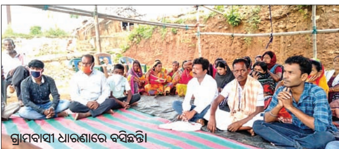
ଗ୍ରାମବାସୀ ଧାରଣାରେ ବସିଛନ୍ତି।

ଦିନରେ ପହଞ୍ଚିଛି। ସମସ୍ୟାର ସମାଧାନ ହେଉ ନ ଥିବାରୁ ରବିବାରଠାରୁ ଅହୋରାତ୍ର ଗଣଧାରଣା ଆରମ୍ଭ ହୋଇଛି। ପୂର୍ବତନ