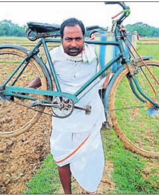
ରାସ୍ତାରେ ଲୋକେ ହାତରେ ଜୋତା ଧରି ଯାଉଥିବା ବେଳେ ଅନ୍ୟକଣ୍ଠେ ସାଇକେଲ କାନ୍ଧେଇ ଯାଉଛନ୍ତି।

ନଦୀବନ୍ଧ ରାସ୍ତା ପୂର୍ବରୁ ଅଣୁପ୍ରସାରିଆ ରହି ମୋରମ ମୋଟାଳ ପଡ଼ିଥିଲା। ଗ୍ରାମକୁ ଜରୁରୀକାଳୀନ ରାତି ଯିବାକୁ ଅସୁବିଧା ହେଉଥିଲା। ଜଳସମ୍ପଦ ବିଭାଗ ପକ୍ଷରୁ ଆରଡ଼ି ରୋଡ଼ ସରିପୁରଠାରୁ ୩୦୦ ମିଟର ପର୍ଯ୍ୟନ୍ତ ୭ଲକ୍ଷ ଟଙ୍କା ବ୍ୟୟରେ ଚେଣ୍ଡର ହୋଇ ୧୫ମାସ ତଳେ କାମ ଆରମ୍ଭ ହୋଇଥିଲା। ରାସ୍ତାରେ ମାଟି ପଡ଼ି ଚଉଡ଼ା ହେବା ସହ ମୋରମ ବିଛାଯାଇ ରୋଲିଂ ହେବା କଥା। ଏହି କାମକୁ ଯାକପୁର ଅଞ୍ଚଳର ଜଣେ ଠିକାଦାର ବେଣ୍ଡର ନେଇଛନ୍ତି। ଠିକାଦାର ୨୫।୨୧.୯୯ରୁ କାମ ଆରମ୍ଭ କରି ୨୪।୪।୧୯ରେ ଶେଷ କରିବାକୁ ଏଗ୍ରିମେଣ୍ଟ କରିଥିଲେ। ଇତିମଧ୍ୟରେ