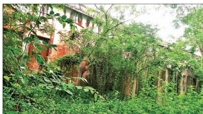
କଳିଙ୍ଗ ସମବାୟ ସୂତାକଳ।

ଡେକାନାଲ ସଦର ବ୍ଲକ୍ ଗୋବିନ୍ଦପୁରସ୍ଥିତ କଳିଙ୍ଗ ସମବାୟ ସୂତାକଳ ୧୮ବର୍ଷ ହେଲା ପରିତ୍ୟକ୍ତ ଅବସ୍ଥାରେ ପଡ଼ିଛି। ପରିଚାଳନା ଆଭାବରୁ ଏହା ଏବେ ଭୂତକୋଠିରେ ପରିଣତ ହୋଇଛି। ଶିଳ୍ପସମୂହ ଜିଲାରେ ଗୋଟିଏ ପରେ ଗୋଟିଏ କଳକାରଖାନା ଭୂଗଣ ହୋଇପଡ଼ୁଥିବାବେଳେ ଏହାକୁ ପୁନରୁଦ୍ଧାର କରିବାକୁ ଦାବି କରିଛି ଡେକାନାଲ ସଚେତନ ନାଗରିକ ଫୋରମ୍। ଏ ନେଇ ଫୋରମ୍ ପକ୍ଷରୁ ପୁଖ୍ୟମନ୍ତ୍ରୀଙ୍କ ଉଦ୍ଦେଶ୍ୟରେ ଏକ ସ୍ମାରକପତ୍ର ପ୍ରଦାନ କରାଯାଇଛି। ୫୨ ଏକର ପରିମିତ ଜମିରେ ୧୯୭୯ରେ ଏହି ସୂତାକଳ ପ୍ରତିଷ୍ଠା ହୋଇଥିଲା। ଏହା ଉପରେ ଆଖପାଖ