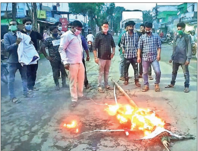
ଛାତ୍ର କଂଗ୍ରେସ ପକ୍ଷରୁ କୁଶପୁରୁଲିକା ଦାହ କରାଯାଇଛି।

ପେଟ୍ରୋଲ ଓ ଡିଜେଲର ଦର ବୃଦ୍ଧି ପ୍ରତିବାଦରେ ଅନୁଗୋଳ ବଜାର ଛକ ଠାରେ ଓଡ଼ିଶା ପ୍ରଦେଶ ଛାତ୍ର କଂଗ୍ରେସ ପକ୍ଷରୁ ବିକ୍ଷୋଭ ପ୍ରଦର୍ଶନ କରାଯାଇଛି। ଛାତ୍ର କଂଗ୍ରେସ କାର୍ଯ୍ୟକାରୀତା ସଦସ୍ୟ ପ୍ରଫୁଲ୍ଲ ସାହୁଙ୍କ ନେତୃତ୍ୱରେ କର୍ମୀମାନେ ପ୍ରଧାନମନ୍ତ୍ରୀ ନରେନ୍ଦ୍ର ମୋଦି ଓ କେନ୍ଦ୍ରମନ୍ତ୍ରୀ ଧର୍ମେନ୍ଦ୍ର ପ୍ରଧାନଙ୍କ କୁଶପୁରୁଲିକା ଦାହ କରିଥିଲେ। ଛାତ୍ର