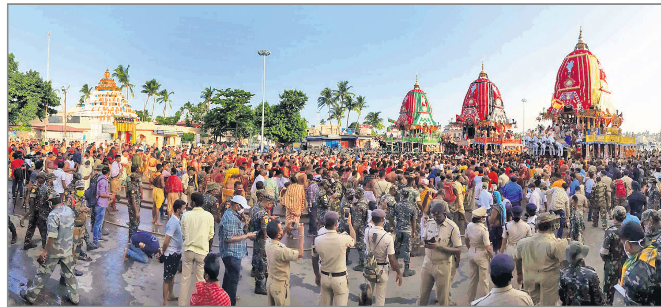
କୃତ୍ରିମ ମନ୍ଦିର ସମ୍ମୁଖରେ ରଥ ରଥ।