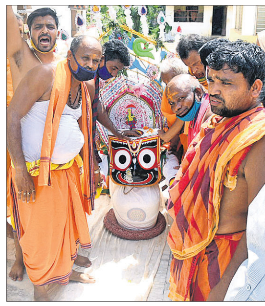
ଭୁବନେଶ୍ୱର ଜାଗମରାସ୍ତିର ଧର୍ମ ବିହାର ମନ୍ଦିରରେ ଶ୍ରୀ କାନ୍ତଙ୍କ ପହଣ୍ଡି ।