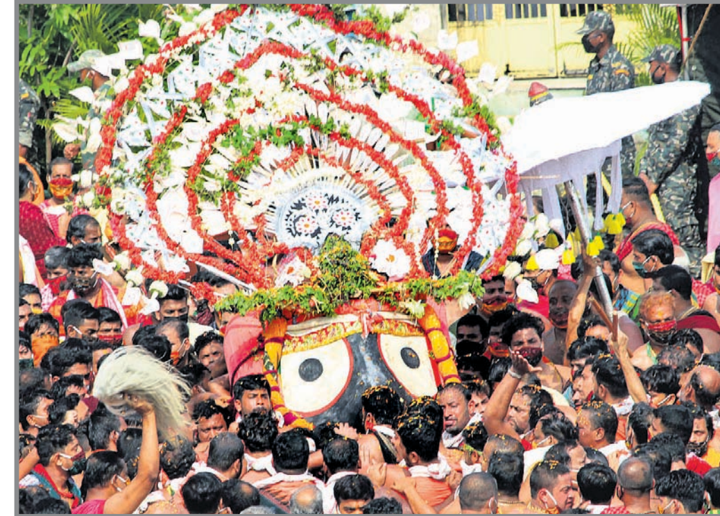
ମହାପ୍ରଭୁ ଶ୍ରୀକଟକାଳୟ ପହଞ୍ଚି ବିଚାର କରାଯାଇଛି।