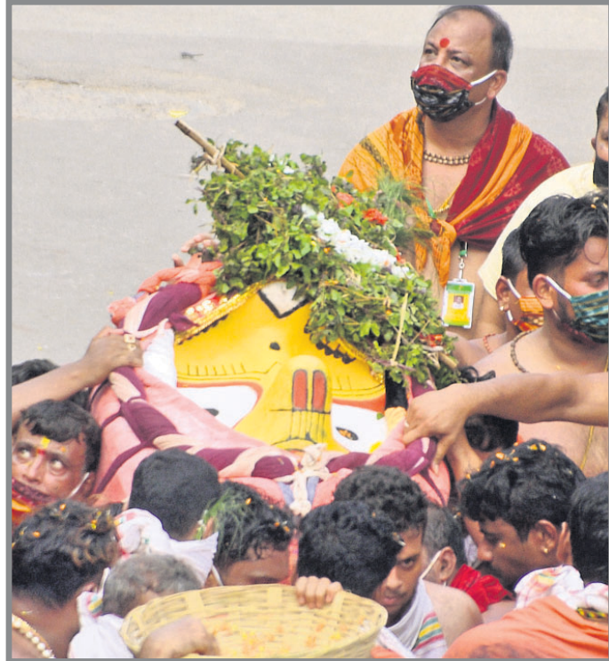
ଦେବା ପୁରୁଡ଼ାକୁ ପହଞ୍ଚି କରି ନିଆଯାଇଛି।