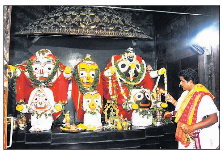
ଭୁବନେଶ୍ୱର ଚନ୍ଦ୍ରଶେଖରପୁର ଆରସିଏଏମ୍ କଲେଜରେ ଚତୁର୍ଦ୍ଧାମୂର୍ତ୍ତିଙ୍କୁ ପୂଜକ ଆଳତି କରୁଛନ୍ତି ।