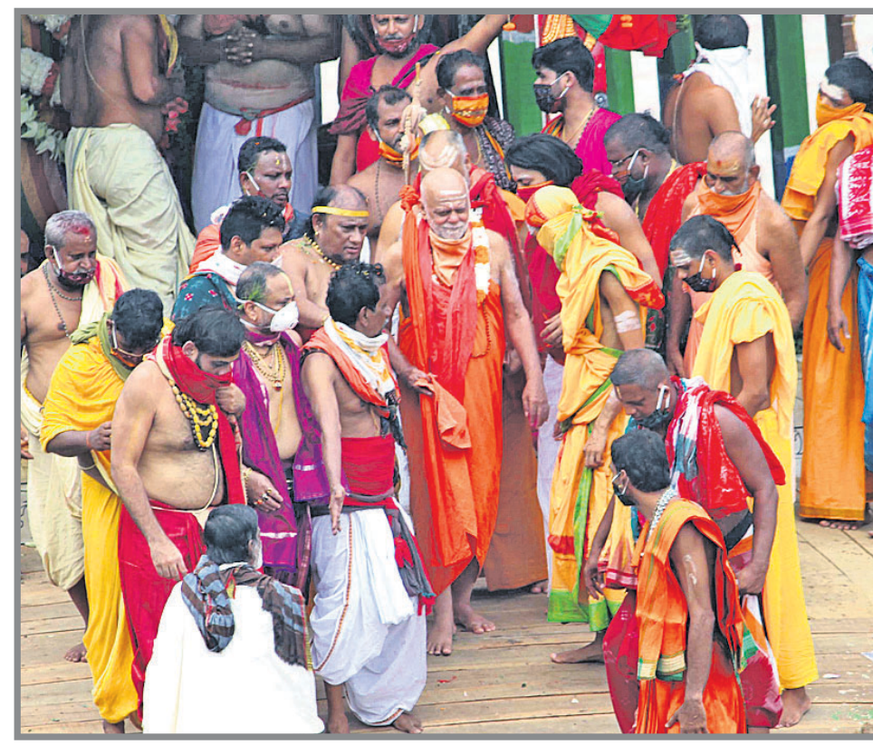
କଟକରୁ ଶ୍ରୀକଟକାଳୟ ଉପରେ ଚର୍ଚ୍ଚାମୂର୍ତ୍ତିଙ୍କ ଦର୍ଶନ ସାରି ଯୋଡ଼ାଛି।