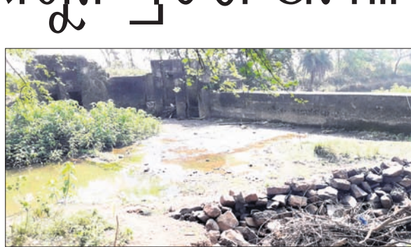
ଜରାକାର୍ଯ୍ୟ ଅବସ୍ଥାରେ ଥିବା ବେଶବନ୍ଧ ଚେକ୍‌ଡ୍ୟାମ୍।

ଭଦ୍ରକ ଜିଲା ବନ୍ତ ବୁକ ଅଞ୍ଚଳରେ ବ୍ରିଟିଶ ବିନାୟକରେ ନିର୍ମିତ ଚେକ୍‌ଡ୍ୟାମ୍ (ବେଶବନ୍ଧ) ଏବେ ଆଉ ପୂର୍ବେକ ଚାଷୀଙ୍କ କାମରେ ଲାଗୁନା। ଋଣଶୋଧନ ଓ ପୁନରୁଦ୍ଧାର ହୋଇ ନ ପାରିବାରୁ ଏହା ନଷ୍ଟ ହେବାକୁ ବସିଛି। ଚାଷକର୍ମୀଙ୍କୁ ପାଣିମାତୃନ ଥିବାବେଳେ ଏବେ ଏହି ସ୍ଥାନରେ ମଧ୍ୟକାଳୀନେ ମାଛ ଧରୁଥିବା ଦେଖିବାକୁ ମିଳୁଛି। ବନ୍ତ ବୁକ ଗଣିକାଙ୍ଗ-କାମବଣି ଭାୟା ବିନାୟକରେ ରାସ୍ତା ତଥା ଗଣିକାଙ୍ଗ ବନ୍ଦରଠାରୁ ୫ ଶହ ମିଟର ଦୂରରେ ସରୁସାଗର ନଦୀ ଉପରେ ଦୁଇପାଖ ଚାଷକର୍ମୀଙ୍କୁ ଜଳସେଚିତ କରିବା ଲକ୍ଷ୍ୟରେ ଏହି ଚେକ୍‌ଡ୍ୟାମ୍ ନିର୍ମାଣ ହୋଇଥିଲା। ମାଛବାସି, ଗଣିକାଙ୍ଗ, ହାସିନପୁର, ଭଦ୍ରକ ବୁକର ବରପଦା, ଅବତୁଳାପୁର,