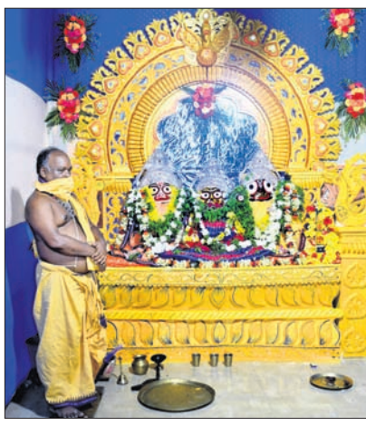
ଅସ୍ଥାୟୀ ମାଉସୀ ମା' ମନ୍ଦିରରେ ତିନି ଠାକୁର।