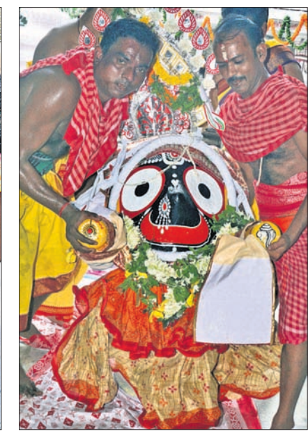
କଟକ ଚାନ୍ଦିନୀ ଚୌକରେ ମହାପ୍ରଭୁଙ୍କ ପହଣ୍ଡି ।