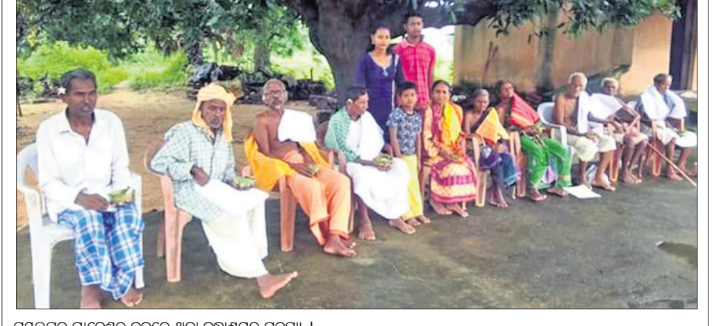
ସମ୍ବଲପୁର ମାନେଶ୍ୱର କୁଳରେ ଥିବା ବ୍ୟାଘ୍ରମର ସଦସ୍ୟ ।