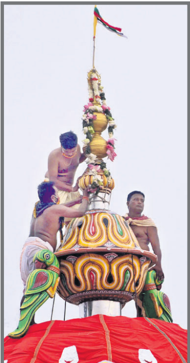
ଉପରେ ବନ୍ଦ କରାଯାଇଛି।