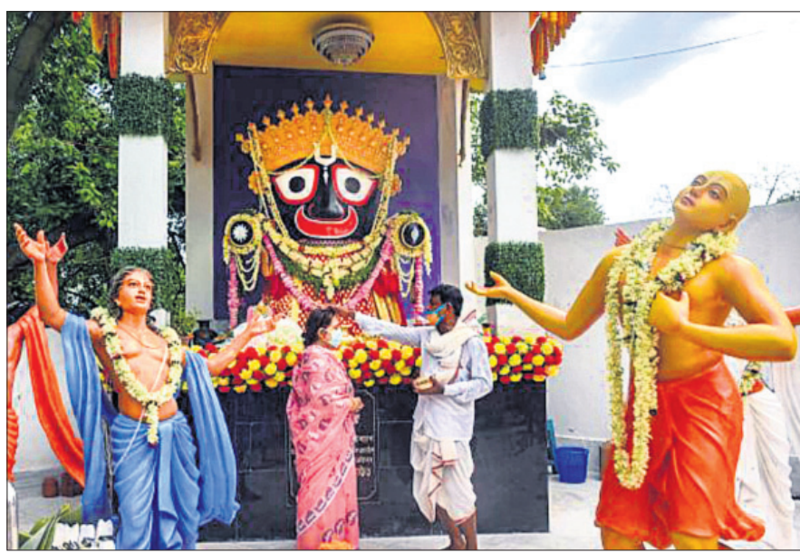
କୋଲକାତାରେ ରଥଯାତ୍ରା ପାଳନ ଅବସରରେ ଭକ୍ତଙ୍କ ପୂଜାର୍ଚ୍ଚନା ।