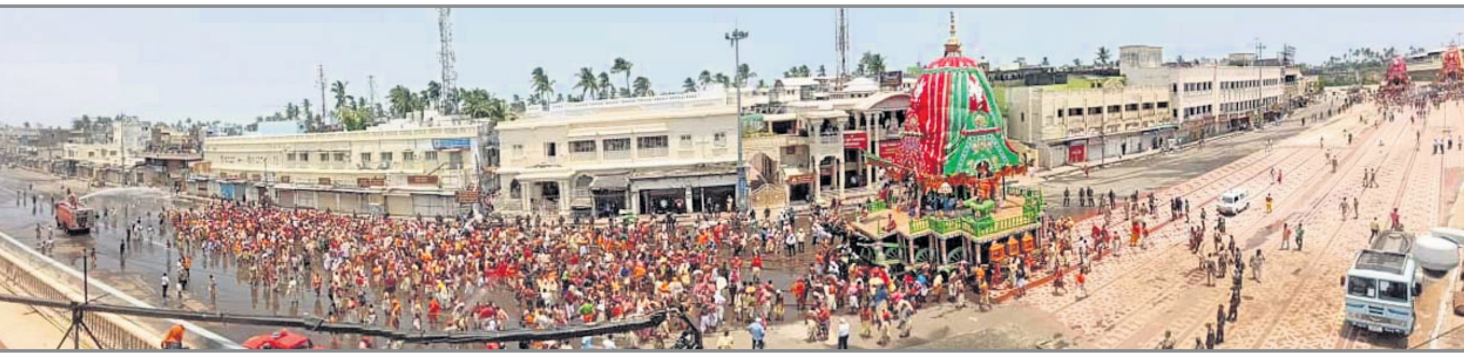
ମହାପ୍ରଭୁଙ୍କୁ ପୂଜା ଦେବାପରେ ସେବାୟତମାନେ ରଥ ଗଠି ନେଇଛନ୍ତି।

ପ୍ରତି ରଥରେ ୧୦ ସେବକ ସମସ୍ତ ସେବାୟତଙ୍କ ମଧ୍ୟରେ ରଥଯାତ୍ରା କାରି ନିୟମ ହୋଇଥିଲା। ତେଣୁ ପ୍ରତି ରଥରେ ୧୦ ସେବକ ରହିବେ ବୋଲି ନିଶ୍ଚିତ ହୋଇଥିଲା। ଶ୍ରୀମନ୍ଦିର ପ୍ରଣାୟକ। ଏହାକୁ