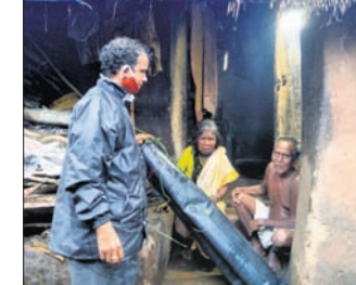
ଅସହାୟ ବୃଦ୍ଧ ଦମ୍ପତିଙ୍କ ନିକଟରେ ତହସିଲଦାର। ଶୁଖିଲା ଖାଦ୍ୟ ପ୍ରଦାନ କରିଥିଲେ। ବ୍ଲକ୍ ଓ ଜିଲ୍ଲା ପ୍ରଶାସନ ସହ ଆଲୋଚନା କରି ସମସ୍ତ ସରକାରୀ ସହାୟତା ଯୋଗାଇ ଦେବେ ବୋଲି ପ୍ରତିଶ୍ରୁତି ଦେଇଛନ୍ତି।