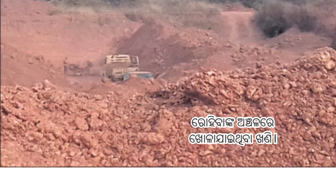
ରୋହିବାଙ୍କ ଅଞ୍ଚଳରେ ଖୋଳାଯାଇଥିବା ଖଣି ।

ନୟାଗଡ଼ ଜିଲ୍ଲା ଓଡ଼ିଆ ତତ୍ତ୍ଵାବଧାନ କୋମଣ୍ଡ ପଞ୍ଚାୟତର କୋମଣ୍ଡ ଓ ଉଦୟପୁର ଏବଂ ରୋହିବାଙ୍କ ପଞ୍ଚାୟତର ଭଗବତୀପ୍ରସାଦ ଅଞ୍ଚଳରେ ଅବାଧରେ ଚାଲିଛି ମାଙ୍କଡ଼ାପଥର ଖନନ । ନିଲାମ ହେଉ ନ ଥିବାରୁ ସରକାର ରାଜସ୍ଵ ହରାଇ ଚାଲିଛନ୍ତି । ଓଡ଼ିଆ ଥାନା ସମ୍ମୁଖ ରାସ୍ତାରେ ନୟାଗଡ଼ ଓ ଓଡ଼ିଆ ବ୍ଲକ୍ ସମେତ ଗଞ୍ଜାମ ଜିଲ୍ଲାକୁ ଏହି ବେଆଇନ ପଥର ଚାଲାଣ ହେଉଛି । ପୋଲିସ ପକ୍ଷରୁ କାଠି ଭଙ୍ଗ ହେଉଥିଲେ ମଧ୍ୟ ଏହା ଚୋରା ଚାଲାଣକୁ ରୋକିପାରିନି । ସୂଚନା ଅନୁଯାୟୀ, କୋମଣ୍ଡ, ଉଦୟପୁର, ଭଗବତୀପ୍ରସାଦ ଅଞ୍ଚଳରେ ଥିବା ସରକାରୀ ଓ ବେସରକାରୀ ଜମିକୁ ବେଆଇନ ଭାବେ ମାଙ୍କଡ଼ାପଥର ଖନନ ଚାଲିଛି । ଏ ସମ୍ପର୍କରେ ବିଭିନ୍ନ ସମୟରେ ଅଭିଯୋଗ ହୋଇଆସୁଥିଲେ ମଧ୍ୟ