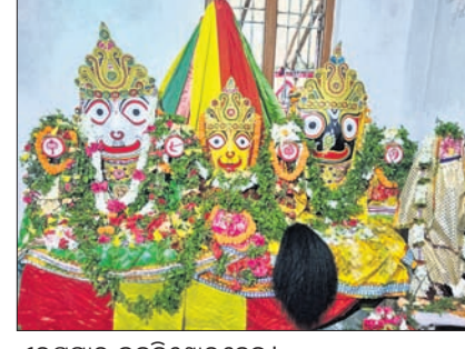
ଏରସମାର ବ୍ରଜକିଶୋରଦେବ ।