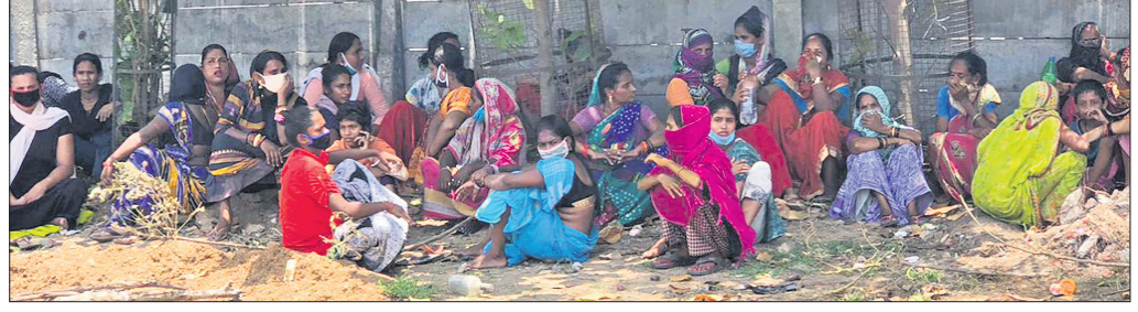
ଜମି ବିବାଦକୁ ନେଇ ମାଲିକ-କିନ୍ନର ମୁହାଁମୁହିଁ