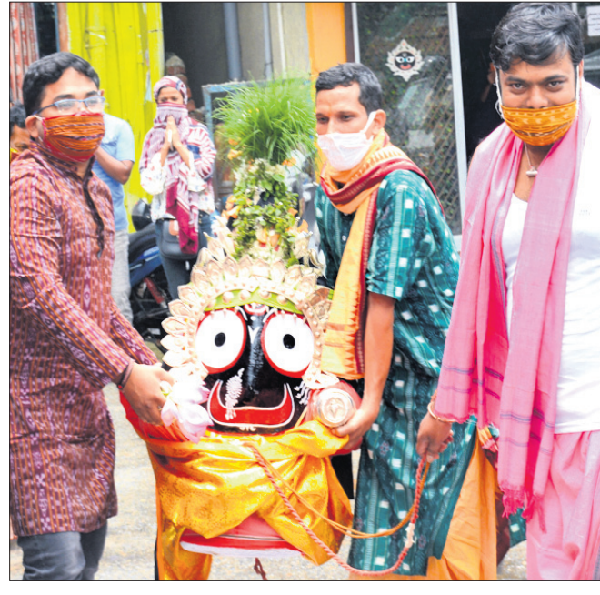
ମଙ୍ଗଳବାର ସମ୍ବଲପୁର ପୂର୍ବପଦା ଜଗନ୍ନାଥ ମନ୍ଦିରରେ ଠାକୁରଙ୍କୁ ପହଞ୍ଚି କରାଯାଉଛି ।