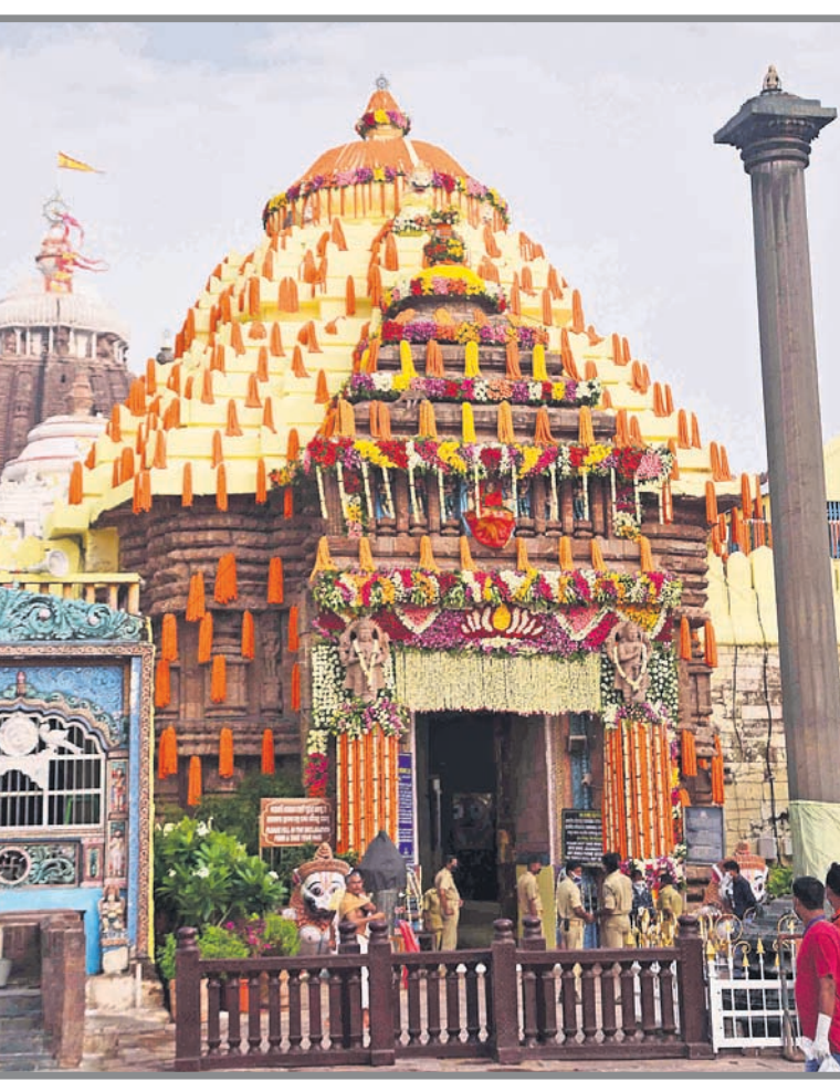
ଶ୍ରୀମନ୍ଦିର ଦିଗ୍‌ଗମ୍ଭୀରଙ୍କୁ ପୂଜାରେ ସଜିତ କରାଯାଇଛି।