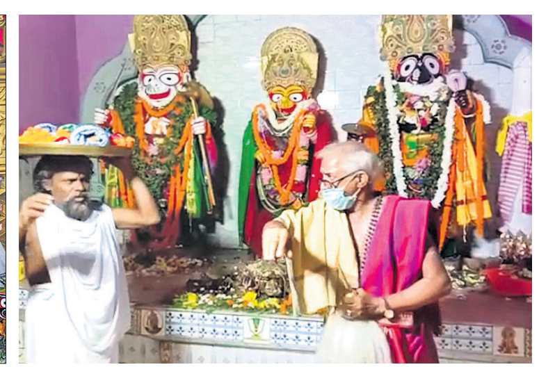
ଖୋର୍ଦ୍ଧା କାକୁଳାଳ ପାଟଣାସ୍ଥିତ ପୁନର୍ବିଗ୍ରହ ଶ୍ରୀଅନନ୍ତ ପୁରୁଷୋତ୍ତମଙ୍କ ଆଜ୍ଞାମାଳ ନିଆଯାଇଛି ।