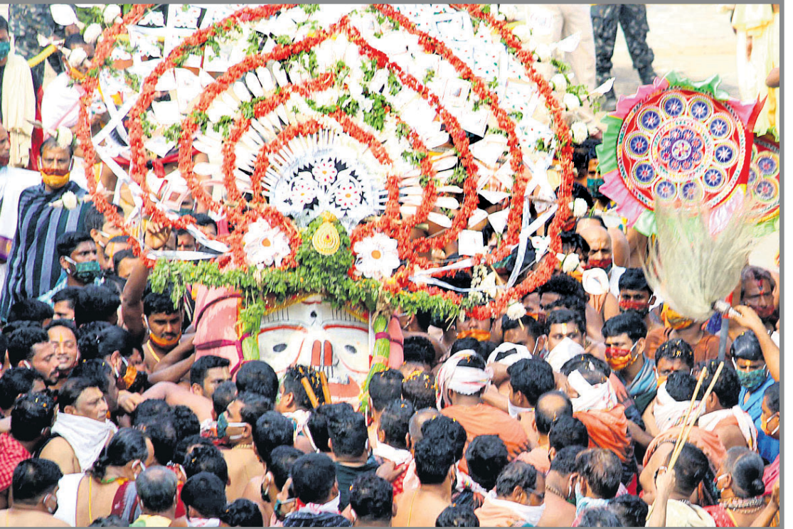
ବଡ଼ ଠାକୁର ବନକପୁତ୍ରଙ୍କ ପହଞ୍ଚି ବିଚାର।