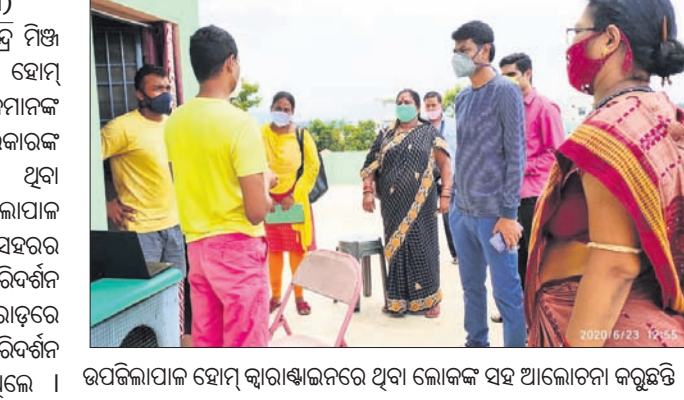
ଉପଜିଲ୍ଲାପାଳ ହୋମ୍ କ୍ୱାରାଣ୍ଟାଇନରେ ଥିବା ଲୋକଙ୍କ ସହ ଆଲୋଚନା କରୁଛନ୍ତି।