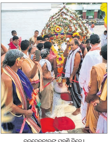
ବନଦେବଜୀଉଙ୍କ ପହଣ୍ଡି ବିଜେ ।