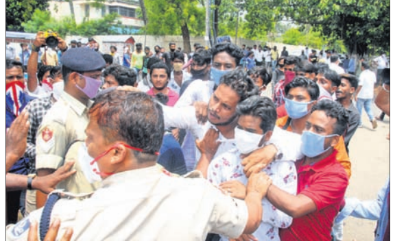
ରାଜ୍ୟ କଂଗ୍ରେସ ଭବନରେ ଦୁଇ ଗୋଷ୍ଠୀ ମଧ୍ୟରେ ଗଣଗୋଲନ ଦୃଶ୍ୟ।