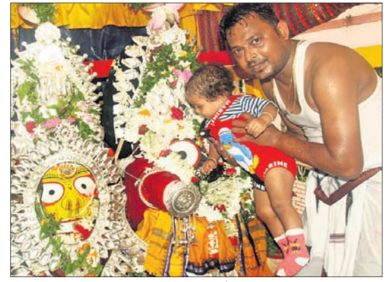
ଜଣେ ଶିଶୁକୁ ରଥାରୁ ଶ୍ରୀକରନାଥଙ୍କୁ ଛୁଆଁ ଯାଉଛି। (ଫାଇଲ ଫଟୋ)