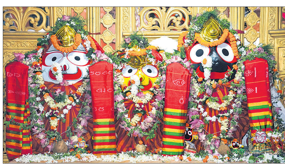
କଟକ ରାଣୀହାଟ ବକଦେବ ଜାତ ମନ୍ଦିର ପରିସରରେ ଅଗ୍ନିଆ ବେଦିରେ ତିନି ଠାକୁର ।