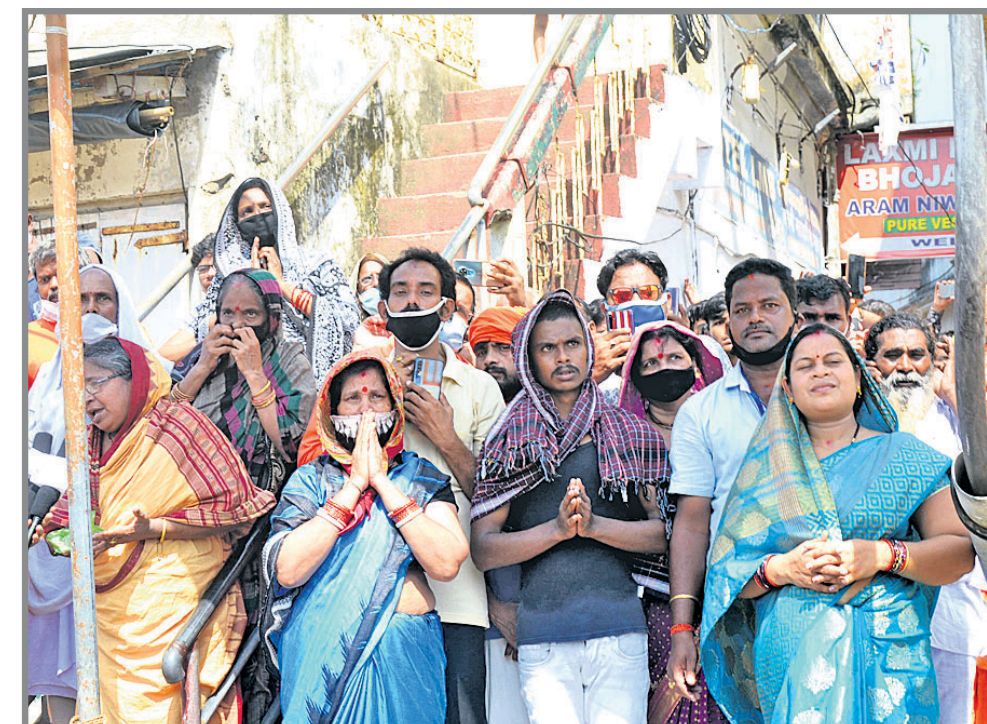
କଟକର ଯୋଗୁ ଶ୍ରୀକଟକାଳୟର ବଦନାଶକୁ ସମାପନ ପାଇଁ ପର ସମ୍ପୂର୍ଣ୍ଣରେ ରଥ ମହାପ୍ରଭୁଙ୍କୁ ପ୍ରଣିପାତ କରୁଛି।