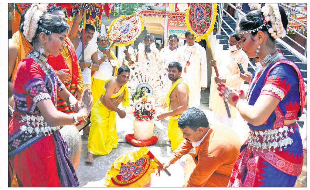
ଭୁବନେଶ୍ୱର ଯୁନିଟ-୫ରୁଁତ ଜଗନ୍ନାଥ ମନ୍ଦିରରେ ଶ୍ରୀଜଗନ୍ନାଥଙ୍କୁ ପହଣ୍ଡି କରି ଆଡ଼ପ ମଣ୍ଡପକୁ ନିଆଯାଇଛି ।