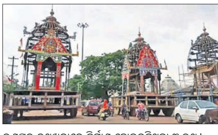
ରଣପୁର ରଥଖଳାରେ ନିର୍ମାଣ ହୋଇରହିଥିବା ୩ ରଥ ।

ନୟାଗଡ଼ ଅଧିକାରୀ/ରଣପୁର, ୨୩।୬ (ସ୍ଵ.ପ୍ର.): ନୟାଗଡ଼ ଜିଲ୍ଲା ରଣପୁରରେ ୨୭୦ ବର୍ଷର ପରମ୍ପରା ଭାଙ୍ଗିଛି । ରଥ ନ ଗତିବାରୁ ଭକ୍ତଙ୍କ ମଧ୍ୟରେ ଅସନ୍ତୋଷ ପ୍ରକାଶ ପାଇଛି । ରଥ ନିର୍ମାଣ କାର୍ଯ୍ୟ ୧୯୯୯ ପ୍ରତିଷ୍ଠିତ ଶେଷ ହୋଇଯାଇଥିଲା । ପୂର୍ବରୁ ସୁପ୍ରମକୋର୍ଟେ ରାୟ ପରେ ରଥଯାତ୍ରା ମନ୍ଦିର ମଧ୍ୟରେ ରାତିନି ଅନୁସାରେ ମଙ୍ଗଳବାର ଶ୍ରୀଜୀଉଙ୍କ ପୂଜାର୍ଚ୍ଚନା କରାଯାଇଥିଲା ।