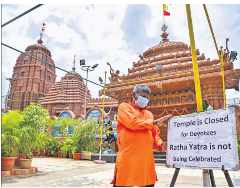
ହାଇଦ୍ରାବାଦରେ ରଥଯାତ୍ରା ପାଳନ କରାଯାଉ ନାହିଁ । ଭକ୍ତମାନଙ୍କୁ ଏହି ବନ୍ଧୁକ ଜଣାଇବା ପାଇଁ ଜଗନ୍ନାଥ ସ୍ୱାମୀ ମନ୍ଦିର ବାହାରେ ନୋଟିସ୍ ବୋର୍ଡ଼ ଲଗାଉଛନ୍ତି ପୂଜକ ।