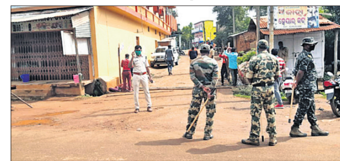
ଚୁକ୍ତିବାଡ଼ି ଛକରେ ପୋଲିସ୍ ପକ୍ଷରୁ ସିଲ୍ କରାଯାଇଛି।