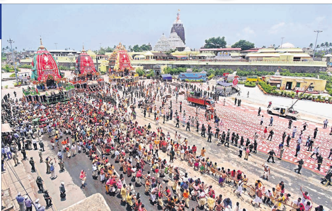
ପୁରୀ ସିଂହଦ୍ଵାର ସମ୍ମୁଖରୁ ସେବାୟତମାନେ ମଙ୍ଗଳବାର ତାଳଧ୍ଵଜ ରଥକୁ ଟାଣି ନେଉଛନ୍ତି।

ପ୍ରତୀକ୍ଷାର ଅନ୍ତ ଘଟିଲା। ନିର୍ଦ୍ଧାରିତ ସମୟଠାରୁ ୨୫ମିନିଟ୍ ବିଳମ୍ବରେ ଆରମ୍ଭ ହୋଇଥିଲା ଚତୁର୍ଦ୍ଧାଦିଗ୍ରହଙ୍କ ପହଞ୍ଚି। ପ୍ରାୟ ୪ଟା ୨୫ରେ ଠାକୁରଙ୍କ ମଙ୍ଗଳ ଆକାଶ ହୋଇ ଅନ୍ୟାନ୍ୟ ନୀତି ବଢ଼ିଥିଲା। ସକାଳ ୭ଟା ୪୫ରେ ସକାଳ ଧୂପ ବଢ଼ିଥିଲା। ଏହାପରେ ଦେଉଳ ପୁରୋହିତ ତିନିରଥ ପ୍ରତିଷ୍ଠା କରିଥିଲେ। ସକାଳ ୭ଟା ୧୫ରେ ମଙ୍ଗଳାପଣ ପରେ ପୁଷ୍ପାଞ୍ଜଳି ସରିଥିଲା। ଏହାର ଠିକ୍ ୧୦ମିନିଟ୍ ପରେ ବାଜିଉଠିଥିଲା ବିଜେ କାହାଳୀ। ସକାଳ ୭ଟା ୨୫ରେ ଆରମ୍ଭ ହୋଇଥିଲା ମହାପ୍ରଭୁଙ୍କ ପହଞ୍ଚି। ଭକ୍ତ ନ ଥିବାରୁ ଶୁଣିବାକୁ ମିଳି ନ ଥିଲା ହରିବୋଲ କି ହୁଲହୁଲି ଧ୍ଵନି। କିନ୍ତୁ ଘଣ୍ଟନାଦରେ ପ୍ରକଟିତ ହୋଇଥିଲା ଶ୍ରୀମନ୍ଦିର ପରିସର। ପରମ୍ପରା ଅନୁଯାୟୀ ପ୍ରଥମେ ସୁବର୍ଣ୍ଣନ, ତା' ପରେ ବଡ଼ଠାକୁର ବଳଭଦ୍ର, ଦେବୀ ସୁଭଦ୍ରା ଏବଂ ଶେଷରେ ମହାପ୍ରଭୁ ଶ୍ରୀଜଗନ୍ନାଥ ଧାଡ଼ି ପହଞ୍ଚିରେ ଆସି ରଥାତ୍ମକ ହୋଇଥଲେ। ଧାର୍ଯ୍ୟ ସମୟର ୫୦ ମିନିଟ୍ ପୂର୍ବରୁ ଶେଷ ହୋଇଥିଲା ପହଞ୍ଚି। ଶ୍ରୀପୁରୁଷୋତ୍ତମ, ଶ୍ରୀବଳଭଦ୍ର ଏବଂ ପୁଷ୍ପା-୪