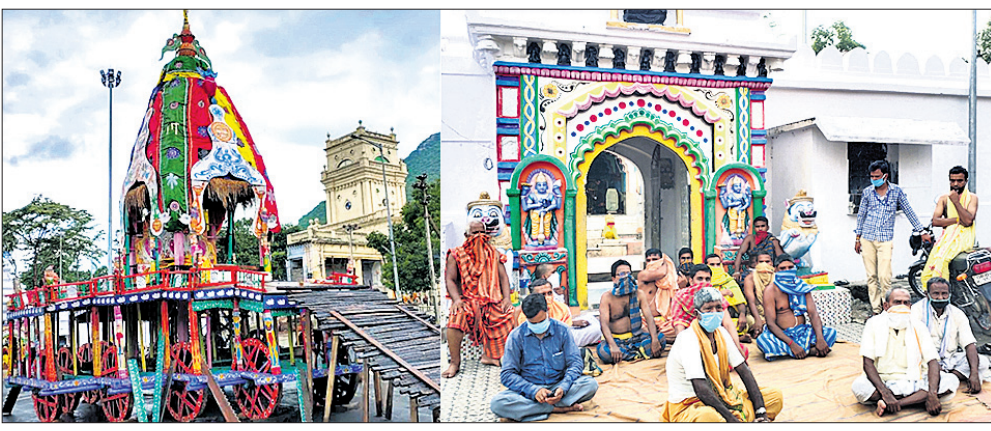
ନିର୍ମାଣ ହୋଇଥିବା ରଥ ଏବଂ ଧାରଣାର ପୂଜକ ଓ ସେବକ।

ବାଲେଶ୍ୱର ଜିଲା ବୃତ୍ତାୟ ଶ୍ରୀକ୍ଷେତ୍ର ନୀଳଗିରିରେ ରଥଯାତ୍ରା ବନ୍ଦ ହେବା ନେଇ ଭକ୍ତଙ୍କ ଗହଣରେ ଅସନ୍ତୋଷ ବୃଦ୍ଧି ପାଇଛି। ଚତୁର୍ଦ୍ଧାପୂର୍ବିକ ନୀତିକାନ୍ତିରେ ବିକ୍ରାନ୍ତ ଓ ମାଉସୀ ମା' ମନ୍ଦିର ପର୍ଯ୍ୟନ୍ତ ତିନିଠାକୁରଙ୍କୁ ନେବା ଦାବିରେ ଜଗନ୍ନାଥମନ୍ଦିର ପୁଖ୍ୟପୁର ଆଗରେ ପୂଜକ, ସେବକ, ଘଣ୍ଟୁଆମାନେ ଧାରଣା ଦେଇଛନ୍ତି। ସେପଟେ ମନ୍ଦିର ପରିସର ଓ ରଥପାଖରେ ମଙ୍ଗଳବାର ପୂର୍ବାହ୍ଣ ୬ଟାରୁ ଆସନ୍ତା ୨୫ଟାରିଖ ରାତ୍ର ୧୧ଟା ୩୫ରୁ ଯାତ୍ରା ନିମନ୍ତେ କୁଳାଇ ୧ଟାରିଖ ପୂର୍ବାହ୍ଣ ୬ଟାରୁ ୨ଟାରିଖ ରାତ୍ର ୧୧ଟା ପର୍ଯ୍ୟନ୍ତ ଉପଜିଲ୍ଲାପାଳଙ୍କ ନିର୍ଦ୍ଦେଶାନୁସାରେ ମନ୍ଦିର ଚତୁର୍ଦ୍ଧାପୂର୍ବ ଓ ମନ୍ଦିର ସାମ୍ନା ହାଟ ଛକ ପର୍ଯ୍ୟନ୍ତ ୧୪୪ ଧାରା ଜାରି ହୋଇଛି। ତିନିଠାକୁର ରଥାଗୁଡ଼ି ନ ହେବା ଓ ମାଉସୀ ମା' ମନ୍ଦିରକୁ ନ ଗଲେ, ରତ୍ନ ସିଂହାସନକୁ ଫେରିବା ଅସମ୍ଭବ ବୋଲି ପୂଜକ ଓ ସେବକ କହିବା ସହ ଯେମିତି ହେଲେ ତିନିଠାକୁରଙ୍କୁ