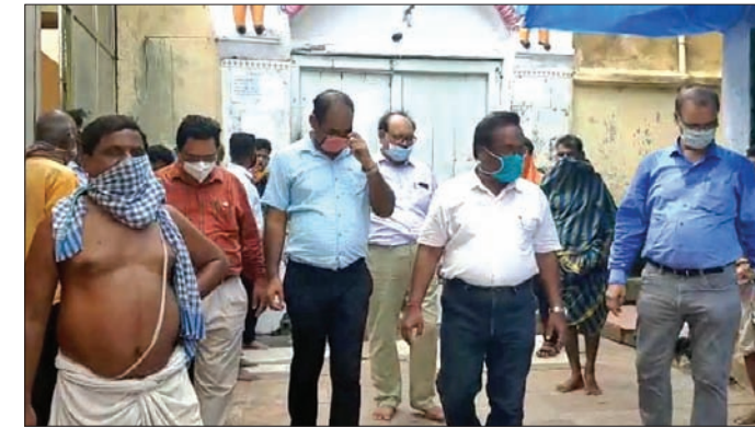
ଅଧିକାରୀମାନେ ଆରଡ଼ି ପୀଠ ବୁଲି ଦେଖୁଛନ୍ତି।

ଭଦ୍ରକ ଜିଲ୍ଲାର ଶ୍ରେଣିପୀଠ ଆରଡ଼ିରେ ଉନ୍ନତକରଣ ପାଇଁ ଜିଲ୍ଲା ପ୍ରଶାସନ ତଥା ମନ୍ଦିର ପ୍ରଶାସନ ପକ୍ଷରୁ ତତ୍ପରତା ପ୍ରକାଶ ପାଇଛି। ଏଥିଲାଗି ଓଡ଼ିଶା ସରକାରଙ୍କ ତରଫରୁ ୬ କୋଟି ଟଙ୍କା ବ୍ୟୟବୋଧ କରାଯାଇଥିଲା। ପୀଠରେ ଥିବା ମନ୍ଦିର ଗର୍ଭଗୃହର ମରାମତି କାର୍ଯ୍ୟ, ମନ୍ଦିର ବେଢ଼ା ସଂପ୍ରସାରଣ ଓ ଚଟାଣ କାର୍ଯ୍ୟ, ମନ୍ଦିର ୪ ଦ୍ୱାର ସୌନ୍ଦର୍ଯ୍ୟକରଣ, ଭୋଗ ମଣ୍ଡପ ପ୍ରତିଷ୍ଠା ଆଦି କାର୍ଯ୍ୟ ଖୁବ୍ ଶୀଘ୍ର କରାଯିବ ବୋଲି ଜଣାପଡ଼ିଛି। ପରବର୍ତ୍ତୀ ପର୍ଯ୍ୟାୟରେ ରାଜ୍ୟ ସଂସ୍କୃତି ବିଭାଗକୁ