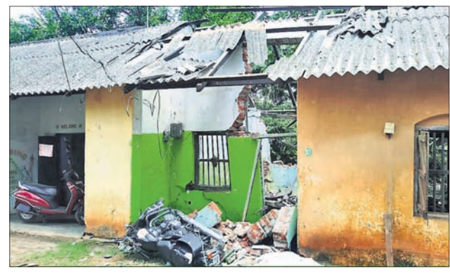
ବିସ୍ଫୋରଣରେ କ୍ଷତିଗ୍ରସ୍ତ କ୍ୱାର୍ଟର।