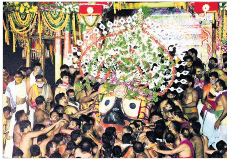
ଶ୍ରୀଜଗନ୍ନାଥଙ୍କୁ ଆଡ଼ପମଣ୍ଡପକୁ ବିଜେ କରି ନିଆଯାଇଛି ।

ପୁରୀ ଅପ୍ରେଲ, ୨୪.୬ ଶେଷରେ ଲୀଳାମୟଙ୍କ ପୂରଣ ହୋଇଛି ଲକ୍ଷ୍ମୀ । ଜନ୍ମଦେବିରେ ବିଜେ କରିଛନ୍ତି ଚତୁର୍ଦ୍ଧାବିଗ୍ରହ । ଶରଧାବାଲିରେ ଗୋଟିଏ ରାତି ଏବଂ ଗୋଟିଏ ଦିନ ରଥରେ ରହିଲେ ଜଗତଠାକୁର । କିନ୍ତୁ ଭକ୍ତଙ୍କ ପାଇଁ ନ ଥିଲା ଦର୍ଶନ ସୁଯୋଗ । ତେବେ ବୁଧବାର ସନ୍ଧ୍ୟାରେ ଗୋଟି ପହଣ୍ଡିରେ ଯାଇ ଆଡ଼ପମଣ୍ଡପରେ ବିଜେ କରିଛନ୍ତି ବିଶ୍ୱନିୟତା । ଜନ୍ମଦେବିରେ ଲୀଳା କରିବେ ଲୀଳାମୟ, ଆଉ ବାହାରିବ ଆଡ଼ପ ଅବତାର । ହେଲେ ଭକ୍ତଙ୍କୁ ମିଳିବନି ଆଡ଼ପ ଦର୍ଶନ । କାରଣ ଭକ୍ତ-ଭଗବାନଙ୍କ ମଧ୍ୟରେ କରୋନା ଚାରିଛି ଲକ୍ଷ୍ମଣଗଣେଶ । ଏବିପୁ ଆସ୍ତାନ୍ତ ଶୁକ୍ଳ ଦ୍ୱିତୀୟା ତିଥି ଅର୍ଥାତ୍ ମଙ୍ଗଳବାର ଭଉଣୀଭାଇଙ୍କୁ ସାଥୀରେ ଧରି ଘୋଷଯାତ୍ରାରେ ବାହାରିଥିଲେ କଳା ସାଆନ୍ତା ବିନା ଭକ୍ତରେ ବଡ଼ଦାଣ୍ଡରେ ରହିଥିଲା ରଥ । ସଞ୍ଜ ନଇଁବା ପୂର୍ବରୁ ଚତୁର୍ଦ୍ଧାବିଗ୍ରହ ପହଞ୍ଚି ଯାଇଥିଲେ ଗୁଣ୍ଡିଚା ମନ୍ଦିର ସମ୍ମୁଖରେ । ଶରଧାବାଲିରେ ଲାଗିଥିଲା ତିନିରଥ । ଦାରୁବିଗ୍ରହମାନେ ବୁଧବାର ଦିନତମାମ୍ବରୀରୁ ରହିଲେ । ରଥ ଉପରେ ସମସ୍ତ ନୀତିକାନ୍ତି ସମ୍ପନ୍ନ ହେଲା । ମଙ୍ଗଳ ଆକାଶରୁ ସନ୍ଧ୍ୟାଧୂପ ପର୍ଯ୍ୟନ୍ତ ସମସ୍ତ ନୀତି ଅପରାହ୍ଣ ଟପା ମଧ୍ୟରେ ଶେଷ ହୋଇଥିଲା । ଏହାପରେ ଦାରୁଦେବତାଙ୍କ