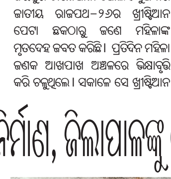
ହୋଇଥିବା ନିମ୍ନମାନର କାର୍ଯ୍ୟ ।

କୋଭିଡ୍ ହସ୍ପିଟାଲରେ ଭର୍ତ୍ତି କରାଯାଇଛି । ଏହି ୭୭ ଜଣଙ୍କୁ ମିଶାଇ ବର୍ତ୍ତମାନ ଗଜପତିରେ ୩୫୫ଜଣ ଜରୋନା ଆକ୍ରାନ୍ତ ଚିହ୍ନଟ ହୋଇଛନ୍ତି । ନୂତନ ଭାବେ ଚିହ୍ନଟ ହୋଇଥିବା ୭୭ଜଣଙ୍କ