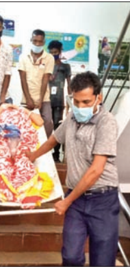
ଜଣେ ଗର୍ଭବତୀଙ୍କୁ କ୍ଷେତ୍ରରେ ୩ ମହଲାକୁ ନିଆଯାଇଛି।

କରୋନା ଭୟରେ ସାଧାରଣ ରୋଗୀ ଏବେ ଜିଲ୍ଲା ମୁଖ୍ୟ ଚିକିତ୍ସାଳୟକୁ ଆସୁ ନାହାନ୍ତି। ଫଳରେ ରାତ ୩ ମାସ ମଧ୍ୟରେ ଏଠାରେ ବର୍ଦ୍ଧିତଭାଗ ରୋଗୀଙ୍କ ସଂଖ୍ୟା ୬୩ ପ୍ରତିଶତ ଓ ଅନ୍ଧତାଭାଗ ରୋଗୀଙ୍କ ସଂଖ୍ୟା ପ୍ରାୟ ୨୦ ପ୍ରତିଶତ ହ୍ରାସ ପାଇଛି। କରୋନା ଯୋଗୁଁ ସରକାରୀ ଡାକ୍ତରଖାନାରେ ସାଧାରଣ ରୋଗୀଙ୍କ ଚିକିତ୍ସା ଉପରେ କଟକଣା ଏବଂ ଡାକ୍ତରଖାନା ଆସିବାକୁ ଗମନାଗମନ ଅସୁବିଧା ଯୋଗୁଁ ବହୁ ରୋଗୀ ସରକାରୀ ସ୍ୱାସ୍ଥ୍ୟସେବାକୁ ବଞ୍ଚିତ ହେଉଛନ୍ତି। ସରକାରୀ ଡାକ୍ତରଖାନାରେ ଅଣ କରୋନା ରୋଗୀଙ୍କ ପ୍ରତି ଚିକିତ୍ସାକ୍ଷମ ଅବହେଳା ମୁଖ୍ୟତଃ ଗ୍ରାମାଞ୍ଚଳର ଲୋକଙ୍କୁ ସମସ୍ୟାରେ ପକାଇଛି। ଅପରପକ୍ଷରେ ଜିଲ୍ଲା ଚିକିତ୍ସାଳୟରେ ପ୍ରସ୍ତବ ପାଇଁ କରାଯାଇଥିବା ବ୍ୟବସ୍ଥା ୩ ମହଲା ଉପରେ ରହିଛି। ଯାହାଫଳରେ ୩ ମହଲା ଉପରକୁ ବୁଝାଯାଇଛି। କର୍ମଚାରୀ ଅଭାବ କାରଣରୁ ରୋଗୀଙ୍କ ସମ୍ପର୍କୀୟମାନେ କ୍ଷେତ୍ରର ସାହାଯ୍ୟରେ ବୋହି ନେବାକୁ ବାଧ୍ୟ ହେଉଛନ୍ତି। ଏହା