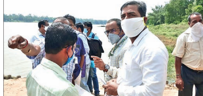
ପରିବେଶବିତ୍ ଓ ଅନ୍ୟ ଅଧିକାରୀମାନେ ବାଲି ସୈରାତ ଅଞ୍ଚଳ ପରିଦର୍ଶନ କରୁଛନ୍ତି।

ବାଲେଶ୍ୱର ଜିଲ୍ଲା କଳେଶ୍ୱର ତହସିଲ ଅଞ୍ଚଳ ମଧ୍ୟବେଳ ପ୍ରବାହିତ ସୁବର୍ଣ୍ଣରେଖା ନଦୀର ବିଭିନ୍ନ ବାଲି ସୈରାତରୁ ଦୀର୍ଘ ଦିନ ହେଲା ପରିବେଶ ଆଇନକୁ ଉଲ୍ଲଙ୍ଘନ କରି ବେଆଇନ ଭାବେ ବାଲି ଉତ୍ତୋଳନ କରାଯାଉଥିବା ଭଳି ଅଭିଯୋଗ ବିଭିନ୍ନ ସମୟରେ ହୋଇ ଆସୁଛି। ଏପରିକି ବିଭିନ୍ନ ସମୟରେ ଜାତୀୟ ଗ୍ରୀନ୍ ଟ୍ରଷ୍ଟିମାନଙ୍କ (ଏନ୍‌ଜିଓ) ନିର୍ଦ୍ଦେଶ କ୍ରମେ ଜିଲ୍ଲା ନିର୍ଦ୍ଦେଶକ ବାଲି ସୈରାତ ସମ୍ପୂର୍ଣ୍ଣ ଭାବେ ବନ୍ଦ ଥିବା ଦେଖିବାକୁ ମିଳିଛି। କିନ୍ତୁ କେତେକ ବାଲି ବ୍ୟବସାୟୀ ତଥା ମାପିଆକ ପୁନଃପାଖୋର ମନୋବୃତ୍ତି ଅଦ୍ୟାବଧି ପରିବର୍ତ୍ତନ ନ ହେବା ଫଳରେ ଏନ୍‌ଜିଓ ଦ୍ୱାରା ହୋଇଛି ଜନସାଧାରଣ ଯାହାର ଫଳ ସ୍ୱରୂପ ବୁଧବାର ଏନ୍‌ଜିଓ