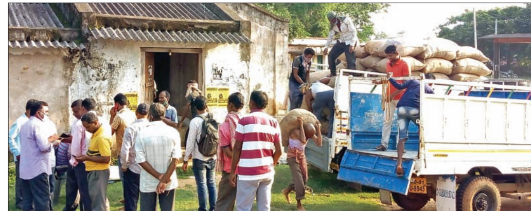
ଚାଷୀମାନେ ଧାନ ଫେରାଇ ନେଉଛନ୍ତି।