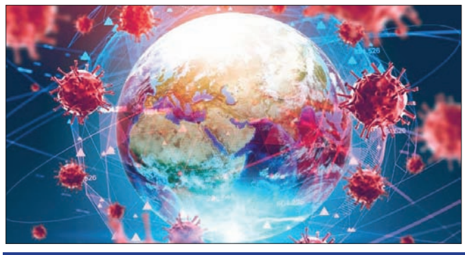
ଆଶଙ୍କା ପ୍ରକଟ କଲା ଆଇଏମ୍‌ଏଫ୍

ବିଶ୍ୱ ବଜାର ମାନ୍ୟତା ଦେଇ ରହି କରୁଥିବା ବେଳେ ବଜାର ପ୍ରଭାବିତ ହୋଇ ରହିଛି।