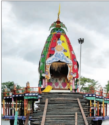
ପ୍ରସ୍ତୁତ ହୋଇ ରହିଥିବା ରଥ। ସୂଚାରୁ ରୂପେ ସମ୍ପନ୍ନ ହୋଇଥିଲା। ବୁଧବାର ରଥ ନ ଚଢ଼ିବାରୁ ରଥଯାତ୍ରା ନାଟିକାନ୍ତି ପାଳନ ହୋଇପାରି ନାହିଁ। ମହାପ୍ରଭୁଙ୍କର ଦୈନନ୍ଦିନ ନାଟି ଯେଉଁଠାରେ ଶେଷ ହୋଇଥାଏ କୌଣସି ଅପରଣ ଘଟିଲେ ପୁନର୍ବାର

ତୃତୀୟ ଶ୍ରୀକ୍ଷେତ୍ର ଭାବେ ପରିଚିତ ବାଲେଶ୍ୱର ଜିଲ୍ଲା ନୀଳଗିରିଠାରେ ଚଳିତବର୍ଷ ମହାପ୍ରଭୁଙ୍କ ଯୋଗାଯାତ୍ରା ବନ୍ଦ ହୋଇଛି। ମହାମାରୀ କରୋନା ପାଇଁ ଏଥର ଚଢ଼ିପାରି ନାହିଁ ରଥ କିମ୍ବା ରଥାଭୂତ ହୋଇପାରି ନାହିଁ। ଚତୁର୍ଦ୍ଧାମୂର୍ତ୍ତି, ବୁଧବାର ରଥ ନ ଚଢ଼ିବା ଯୋଗୁଁ ରଥଯାତ୍ରା ନାଟିକାନ୍ତି ପାଳନ ହୋଇପାରି ନାହିଁ। ଠାକୁରଙ୍କ ପାଖରେ ଅନ ଲାଗି ହୋଇ ପାରି ନାହିଁ। ଅଣସର ଚକଡ଼ାରେ ମହାପ୍ରଭୁ ବର୍ଣ୍ଣନ ଦେଉଛନ୍ତି। ମହାପ୍ରଭୁଙ୍କର ଦେବସ୍ନାନ ନାଟି ଶେଷ ହୋଇଥିଲା। ଅଣସର ନାଟି ଏବଂ ନବଯୌବନ ବେଶରେ ରହିଥିଲେ ଠାକୁର। ଆଣସର ପିଣ୍ଡିକା ତ୍ୟାଗ କରି ହେବା କଥା ପହଞ୍ଚି ରଥଯାତ୍ରା। ମାତ୍ର କରୋନା ଯୋଗୁଁ ସୁପ୍ରିମକୋର୍ଟଙ୍କ ନିର୍ଦ୍ଦେଶ କ୍ରମେ ଏହି ରଥଯାତ୍ରା ଉପରେ ପ୍ରଶାସନ କଟକଣା ଜାରି କରିଥିଲା। ଏହାର ପ୍ରତିବାଦରେ ନୀଳଗିରି ଜଗନ୍ନାଥ ମନ୍ଦିର ସମ୍ମୁଖରେ ପୂଜକ, ସେବକ ଓ ଘଣ୍ଟୁଆମାନେ ଆରଣାରେ ବସିଥିଲେ। ହେଲେ ପହଞ୍ଚି ପାଇଁ କୌଣସି ନିଷ୍ପତ୍ତି ବାହାରି ନ ଥିଲା। ରଥଯାତ୍ରା ପୂର୍ବରୁ ସମସ୍ତ ନାଟିକାନ୍ତି ମଙ୍ଗଳକାର ରାତି ପର୍ଯ୍ୟନ୍ତ