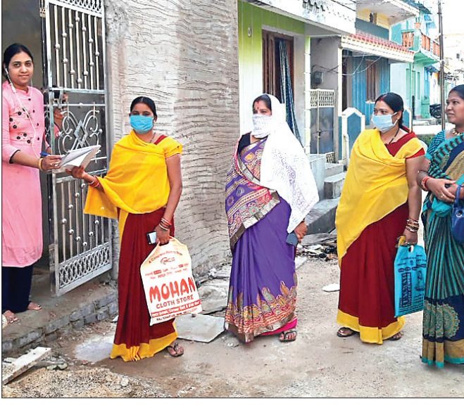
ଘରକୁ ଘର ବୁଲି ଲୋକଙ୍କ ସ୍ୱାସ୍ଥ୍ୟବସ୍ଥାର ଯାଞ୍ଚ କରାଯାଉଛି।