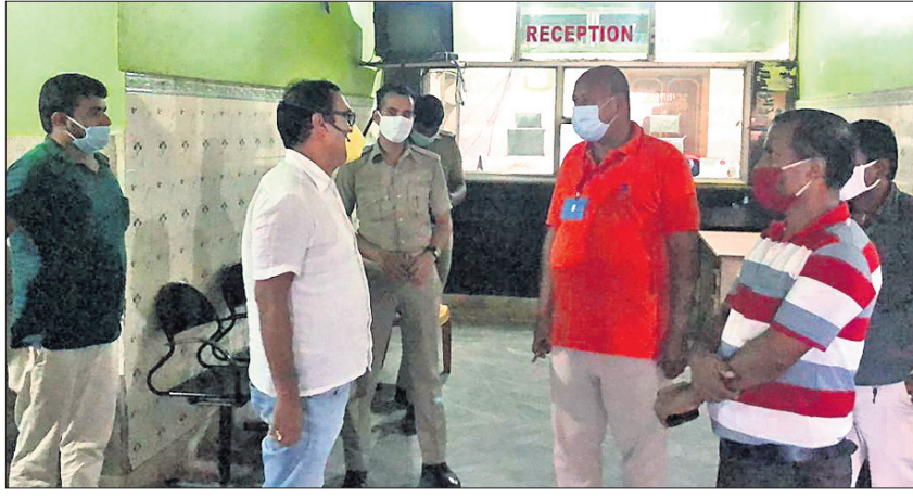
ଏକ ଘରୋଇ ନର୍ସିଂହୋମ୍‌ରେ ସିଏମ୍‌ସିଆର ସ୍ୱତନ୍ତ୍ର ଚଢ଼ାଉ କରୁଛି।