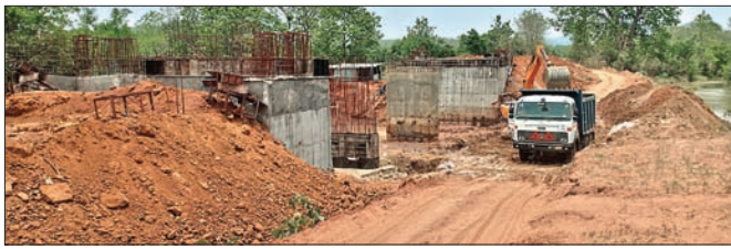
କଡ଼େଶିର ଗ୍ରାମପଞ୍ଚାୟତ ଅଧୀନ ଉଲ୍ଲୁସିଂହାର ।

କଳାହାଣ୍ଡି ଜିଲ୍ଲା କେସିଙ୍ଗା ବୁକ କଡ଼େଶିର ପଞ୍ଚାୟତ ଅଧୀନ ଗେଠିପଡା ଉଲ୍ଲୁସିଂହାରକୁ ଜୟନ୍ତପୁର ସହିତ ସଂଯୋଗ କରିବା ପାଇଁ ଆରୁଡ଼ି ବିଭାଗ ପକ୍ଷରୁ ତ୍ରିଜ କାମ ଚାଲିଛି। ଏହି ତ୍ରିଜ ନିର୍ମାଣ ହେଲେ କଡ଼େଶିର, ମାଝିପଡା, ଗେଠିପଡା ଓ ଜୟନ୍ତପୁର ଲୋକଙ୍କ ଗମନାଗମନ କ୍ଷେତ୍ରରେ ସୁବିଧା ହୋଇପାରିବ।