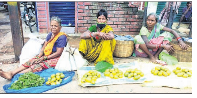
ବନବାସୀମାନେ ଦେଶୀ ଆୟ ବିକି କରୁଛନ୍ତି ।

ବଣ ପାହାଡ଼ ଘେରା କେନ୍ଦ୍ରରେ ଜିଲାର ଆଦିବାସୀମାନେ ଜଳାଳୁ ବିଭିନ୍ନ ଫଳ ସଂଗ୍ରହ କରି ଖାଇବା ସହ ବଳକା ହାଟବଜାରରେ ବିକି ଗୁରୁତାର ମେଣ୍ଟାଉଛନ୍ତି । ଚଳିତ ବର୍ଷ ଜଳବାୟୁରେ ପରିବର୍ତନ ଯୋଗୁଁ ଦେଶୀ ଆୟର ଉତ୍ପାଦନ କମିଥିବାରୁ ସେମାନେ ମୁକ୍ତରେ ହାଟ ଦେଇ ବସିଛନ୍ତି । ଅନ୍ୟ ପକ୍ଷରେ କରୋନା ପ୍ରଭାବରେ ଜଳାଳୁ ସଂଗ୍ରହ ଆୟ ବିକ୍ରି କରିବାକୁ ସେମାନେ ହାଟ ବଜାରକୁ ଆସି ପାରୁନାହାନ୍ତି ।