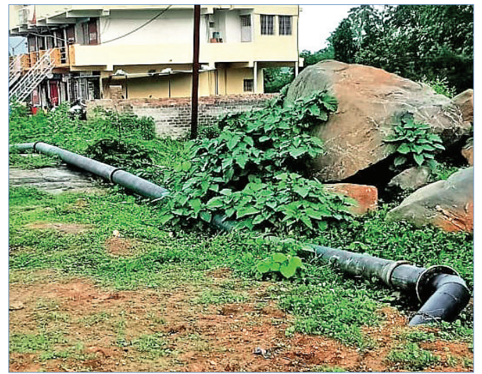
ଜାତୀୟ ରାଜପଥ ନିର୍ମାଣସ୍ଥଳରେ ପିପର୍ଡି ପକ୍ଷରୁ ପାଇପ ବିଛାଯାଉଛି ।

ଓ ଅଧିକାରୀଙ୍କ ଖାମସ୍‌ଆଳ ନାତି ଯୋଗୁ ଆଜି ଏକାକି ସମସ୍ୟା ସୃଷ୍ଟି ହୋଇଛି ବୋଲି ସ୍ଥାନୀୟ ଲୋକେ କହିଛନ୍ତି । କାମ ଆରମ୍ଭ ସମୟରେ ସ୍ଥାନୀୟ ଲୋକେ ଏ ନେଇ ଅଭିଯୋଗ କରିଥିଲେ । ଏହାପରେ ଜାତୀୟ ରାଜପଥ, ପିପର୍ଡି ଓ ଠିକା କମ୍ପାନୀର ଅଧିକାରୀମାନେ ଘଟଣାସ୍ଥଳ ମିଳିତ ଭାବେ ପରିବେଶନ କରିଥିଲେ । ସେ ସମୟରେ ପିପର୍ଡିକୁ ରାସ୍ତା ପାର୍ଶ୍ୱରେ ପାଇପ ବିଛାଯାଉ ବୋଲି କୁହାଯାଇଥିଲା । ଠିକାଦାର ସମସ୍ତଙ୍କ ସମ୍ମୁଖରେ ରାସ୍ତା ପାର୍ଶ୍ୱରେ ପାଇପ ବିଛାଯିବ ବୋଲି କହିଥିଲେ । ହେଲେ ଆରମ୍ଭ ସମୟରେ ପାଇପ ବିଛାଯିବ ବୋଲି କହିଥିଲେ ।