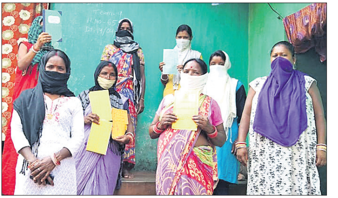
ରାଶନ ସାମଗ୍ରୀ ବଣ୍ଟନରେ ଅନିୟମିତତା