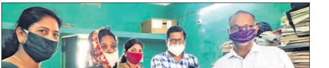
ମୃତ ଚାଷୀଙ୍କ ସ୍ତ୍ରୀଙ୍କୁ ସହାୟତା ପ୍ରଦାନ କରାଯାଇଛି ।

ରାଶନ ସାମଗ୍ରୀ ନ ପାଇ ଅଭିଯୋଗ କରିବାକୁ ଆସିଥିବା ହିତାଧିକାରୀ । ଜଣେ ବ୍ୟକ୍ତିଙ୍କୁ ସରକାରଙ୍କ ପକ୍ଷରୁ ଠେଙ୍ଗାରେ ପିଟି ହାଲୁ ହତ୍ୟା କରାଯାଇଛି । ମୃତକ ହେଲେ କିନା ମୁଣ୍ଡା (୪୫) ।