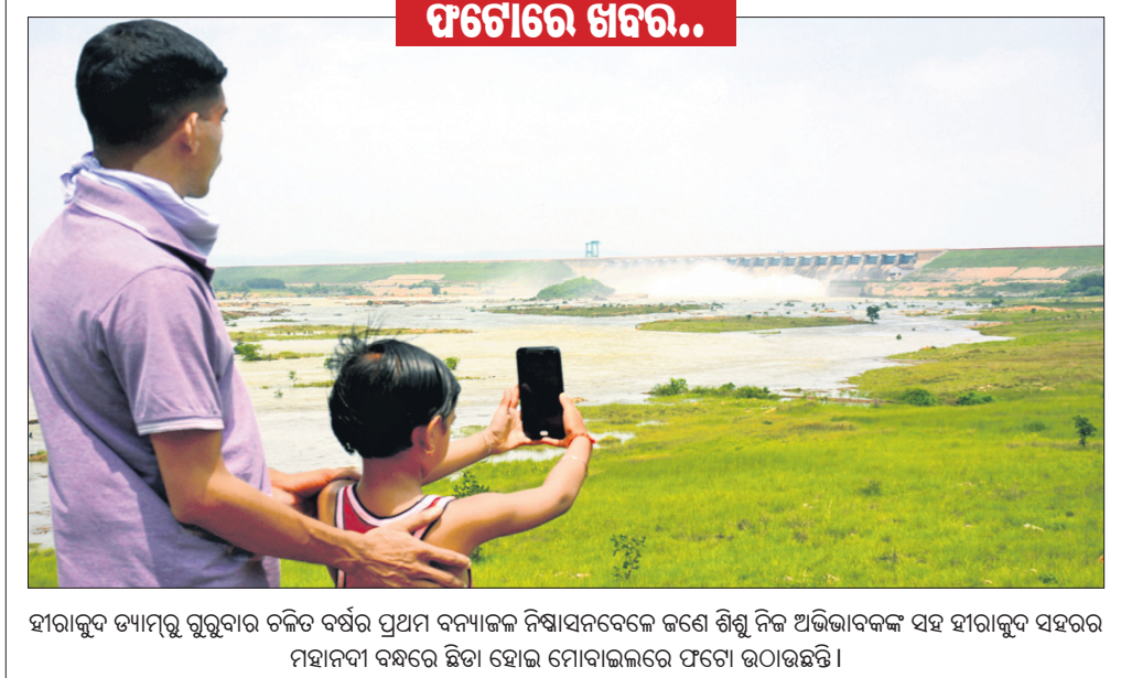
ହାରାକୁଦ ତ୍ୟାମରୁ ଗୁରୁବାର ଚଳିତ ବର୍ଷର ପ୍ରଥମ ବନ୍ୟାକଳ ନିଷ୍ପାଦନବେଳେ ଜଣେ ଶିଶୁ ନିକ ଅଭିଭାବକଙ୍କ ସହ ହାରାକୁଦ ସହରର ମହାନଦୀ ବନ୍ଧରେ ଛିଟା ହୋଇ ମୋବାଇଲରେ ଫଟୋ ଉଠାଉଛନ୍ତି।

ନୂଆପଡା ଅତିସ,୨୫।୬: ନୂଆପଡା ସହରରେ ରାଷ୍ଟ୍ରୀୟ ମଦ ଦୋଳାନ ଉଚ୍ଛେଦ ଦାବି କରିଛି ସାମାଜିକ ସଂଗଠନ ଗରିବ ସେନା। ଏ ନେଇ ସଂଗଠନ ପକ୍ଷରୁ ପ୍ରଶାସନ ନିକଟରେ ଦାବି କରାଯାଇଛି। ସହରର ଚେଲିପଡା ନିକଟରେ ଦୀର୍ଘଦିନ ଧରି ଏକ ଦୋଳାନ ମଦଭାଡ଼ି ରହିଛି। ଏହି ରାସ୍ତାଦେଇ ପ୍ରତ୍ୟେକ ସ୍ତୂଳ, କଲେଜ ପିଲାଙ୍କ ଯିବା ଆସିବା ସହ ଗହଳି ଲାଗି ରହିଥାଏ।