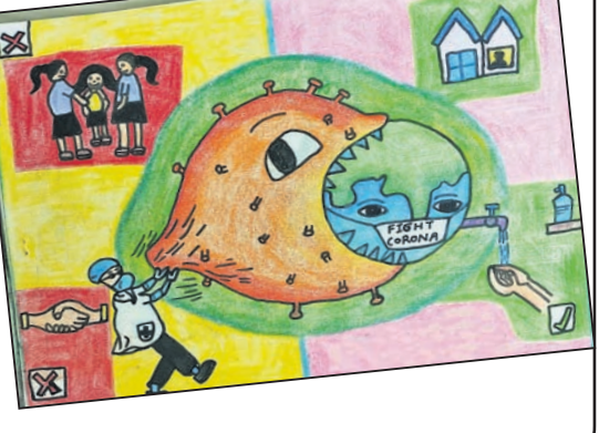
ଅୟସ୍କାନ୍ତ ପତି କ୍ଲାସ୍-୪, ତିଏଭି ସ୍କୁଲ, ପୋଖରାପୁର, ଭୁବନେଶ୍ଵର