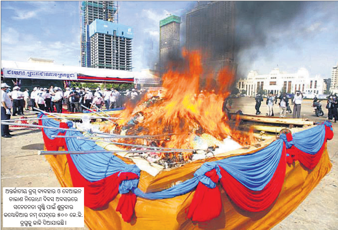
ଅନ୍ତର୍ଜାତୀୟ ଡ୍ରଗ୍ ବ୍ୟବହାର ଓ ବେଆଇନ ଚାଲାଣ ନିରୋଧୀ ଦିବସ ଅବସରରେ ସଚେତନତା ସୃଷ୍ଟି ପାଇଁ ଶୁକ୍ରବାର କମେଡିଆର ନମ୍ ପେନ୍‌ରେ ୫୦୦ କେ.ବି. ଡ୍ରଗ୍‌କୁ ଜାଳି ଦିଆଯାଇଛି।