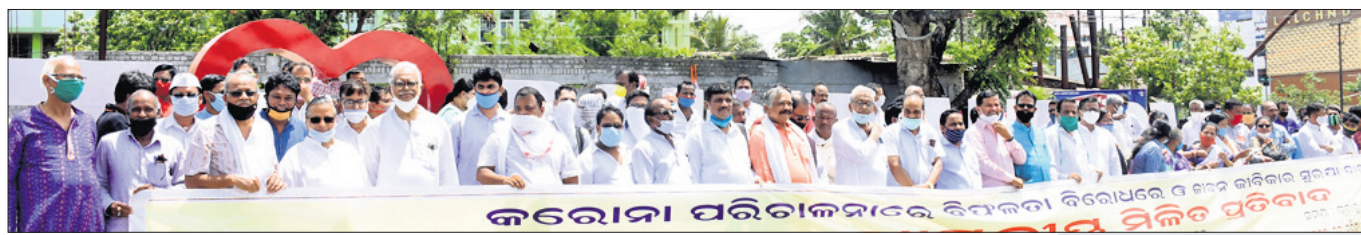
କରୋନା ପରିଚାଳନାରେ ବିଫଳତା ବିରୋଧରେ ବିକଳ ପ୍ରତିବାଦ

କରୋନା ସମୟରେ ରାଜ୍ୟ ସରକାରଙ୍କ ପରିଚାଳନାରେ ବିଫଳତାକୁ ନେଇ ଶୁଦ୍ଧକାର କଂଗ୍ରେସ ସମେତ ରାଜ୍ୟର ୧୩ ରାଜନୈତିକ ଦଳ ଭୁବନେଶ୍ୱରସ୍ଥିତ ମାଷ୍ଟରକ୍ୟାଣ୍ଟିନ ଛକଠାରେ ବିରୋଧ ପ୍ରଦର୍ଶନ କରିଛନ୍ତି । ତାଲାବନ୍ଦ ଯୋଗୁ ରାଜ୍ୟ ତଥା ଦେଶର ଅର୍ଥନୀତି ବିପର୍ଯ୍ୟସ୍ତ ହୋଇପଡ଼ିଛି । ଏହାସହ ଦେଶର କୋଭିଡ୍ ରେଷ୍ଟ୍ରିଡ୍ ହାର ଯଥେଷ୍ଟ କମ୍ ରହିଥିବାରୁ ସଂକ୍ରମଣ ଦିନକୁ ଦିନ ବଢ଼ିବାରେ ଲାଗିଛି ବୋଲି ରାଜନୈତିକ ଦଳଗୁଡ଼ିକ ଅଭିଯୋଗ କରିଛନ୍ତି । ଏନେଇ ସମେତ ରାଜ୍ୟପାଳଙ୍କୁ ଭେଟି ଦାବିପତ୍ର ପ୍ରଦାନ କରିଛନ୍ତି । ଏହାସହ ଦୁର୍ଦ୍ଦଶା ଭୋଗୁଥିବା ପ୍ରବାସୀ ତଥା ଆୟକର ପରିସରଭୁକ୍ତ ହୋଇ ନ ଥିବା ପରିବାରକୁ ମାସିକ ୭ହଜାର ୫୦୦ଟଙ୍କା ଦେବାକୁ ସମେତେ