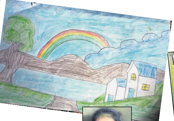
ଲିପି ପ୍ରଧାନ କ୍ଲାସ-୭, ସରକାରୀ ଉନ୍ନତ ବିଦ୍ୟାଳୟ, ବେଲେର, ଖପ୍ରାଖୋଲ, ବଲାଙ୍ଗୀର