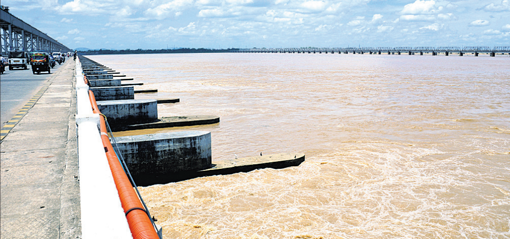
କଟକସ୍ଥିତ ଯୋତ୍ରା ଆନିକଟଠାରେ ମହାନଦୀରେ ପ୍ରସାହିତ ବର୍ଷାଜଳ ।

ଜମିରେ ବେଆଇନ ଟ୍ରିକ୍ ଓ କଲର୍ଜଟ କାର୍ଯ୍ୟ ବନ୍ଦ କରିବା, ନିମ୍ନମାନର କାର୍ଯ୍ୟ ଭିଲ୍ଲାସ୍ ତଦନ୍ତ, ଧାନର ଅଭାବକୁ ରୋକାଯିବା, ପଞ୍ଜୀକୃତ ଚାଷୀଙ୍କ ଠାରୁ ଶାସ୍ତ୍ର ଧାନ କ୍ରୟ କରିବା, ଫନା ଷ୍ଟିଗ୍ରପ୍ତ ଧାନ ଓ ପାନ ତହସିଲ ଅଫିସ୍ରେ ବିରୋଧ ପ୍ରଦର୍ଶନ କରିଥିଲେ । ରେଞ୍ଚ ଛକଠାରୁ ନିମାପଡ଼ା ପୂର୍ତ୍ତ ବିଭାଗ ରାସ୍ତା ପ୍ରଶସ୍ତାବନଣା, ଚାଷୀଙ୍କ