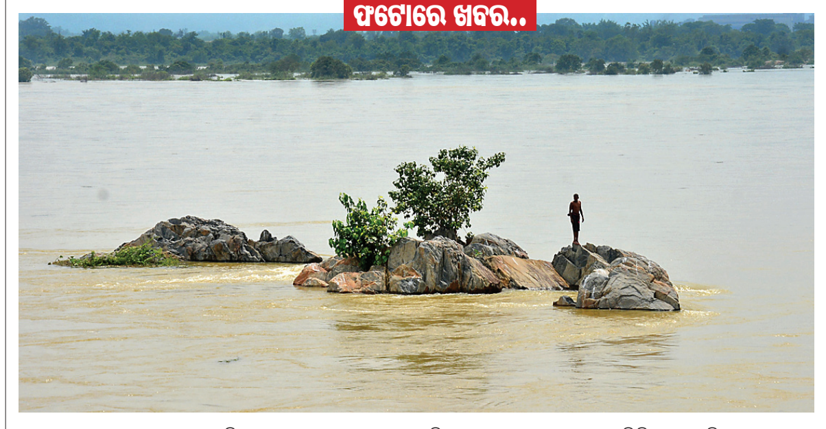
ହାରାକୁ ବ୍ୟାପାରୀ ଶୁକ୍ରବାର ବନ୍ୟାକଳ ନିଷ୍ଠାସନ ପରେ ସମଲପୁର ମହାନଦୀ ମଝିରେ ଥିବା ପଥର ଉପରେ ଜଣେ ବ୍ୟକ୍ତି ଛିଡ଼ା ହୋଇଛନ୍ତି ।

ବରଗଡ଼ ଜିଲା ଗାଇସିଲେଟ୍ ବୁକ୍ ଅଞ୍ଚଳର ଅନେକ କ୍ଷତିଗ୍ରସ୍ତ ଚାଷୀ ଗତ ୨୦୧୯-୨୦ ଫସଲକ୍ଷତି ବାବଦକୁ ଦାମା ଶ୍ରତିପୁରଣ ଏପର୍ଯ୍ୟନ୍ତ ପାଇନାହାନ୍ତି । ଏଭଳି ଅଭିଯୋଗ ନେଇ ତହସିଲଦାରଙ୍କୁ ଏକ ସ୍ମାରକପତ୍ର ଶୁକ୍ରବାର ଭାଙ୍ଗି ପକ୍ଷରୁ ଗାଇସିଲେଟ୍ ତହସିଲ ଅଫିସ୍ ଘେରାଉ କରାଯାଇଥିଲା । ଭାଙ୍ଗି ପକ୍ଷରୁ ଉପସଭାପତି ପ୍ରବାଶ