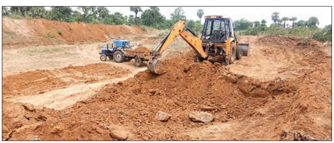
ମେଶିନ ଦ୍ୱାରା ଏମ୍ବ୍ରିଫିଏସଆରଇଡିଏସ୍ କାମ କରାଯାଉଛି ।

କରୋନା ପାଇଁ ଅନେକ ରୋଜଗାର ହରାଇଥିବା ବେଳେ ଶ୍ରମିକ ଶ୍ରେଣୀର ଲୋକେ ବିଶେଷ ଭାବେ ପ୍ରଭାବିତ ହୋଇଛନ୍ତି । ସୁବର୍ଣ୍ଣପୁର ଜିଲାର ୧୫ ହଜାରରୁ ଊର୍ଦ୍ଧ୍ୱ ପ୍ରବାସୀ ଶ୍ରମିକ କର୍ମୀସଂସ୍ଥାନ ହରାଇ ଶୂନ୍ୟହସ୍ତରେ ଘରକୁ ଫେରିଛନ୍ତି । ଶିଳ୍ପ ବିହୀନ ଏହି ଜିଲାରେ ଶ୍ରମିକ ଓ ଉଦିବ ଲୋକଙ୍କୁ ରୋଜଗାର ଯୋଗାଇବା ପ୍ରଶ୍ନାସନ ପାଇଁ ଏକ ବଡ଼ ଆହ୍ୱାନ । ଏଭଳି ସ୍ଥିତିରେ ପ୍ରବାସୀଙ୍କୁ କାମ ଧନ୍ୟାୟୋଗ ପାଇଁ ଶ୍ରମଜିଉଲ ଯୋଜନା ମହାତ୍ମା ଗାନ୍ଧୀ ଜାତୀୟ ଗ୍ରାମୀଣ ନିର୍କ୍ଷିତ କର୍ମନିମ୍ମୁକ୍ତି ଯୋଜନା (ଏମ୍ବ୍ରିଫିଏସଆରଇଡିଏସ୍) ଏକମାତ୍ର ସାହାଯ୍ୟ ଯୋଜନାରେ ଦୈନିକ ମଜୁରି ବଢ଼ିଛି । ମଜୁରି ଦିନକୁ ୧୮୨ ଟଙ୍କାରୁ ୨୦୭ ଟଙ୍କାକୁ ସରକାର ବୃଦ୍ଧି କରିଛନ୍ତି । ପ୍ରବାସୀ ଶ୍ରମିକ ଜିଲାକୁ ପହଞ୍ଚିବା ପୂର୍ବରୁ ଲକଡ଼ାଉନ୍ ମୁକ୍ତ ପର୍ଯ୍ୟାୟ ପରେ ସରକାର ଏମ୍ବ୍ରିଫିଏସଆରଇଡିଏସ୍ରେ ଅଧିକ କାମ କରିବା ପାଇଁ ନିଷ୍ପତ୍ତି ନେଇଥିଲେ । ଜିଲାରେ ୧ ଲକ୍ଷ ୨୩ ହଜାର ୭୨୯ଟି ଚିକିତ୍ସା କ୍ଷେତ୍ର ଅଛି । ଏହି ଯୋଜନାରେ ଉଚ୍ଚତମ ଶ୍ରମିକ ମାନେ ଅଧିକ ସଂଖ୍ୟାରେ କାମ ପାଇବେ ସେ