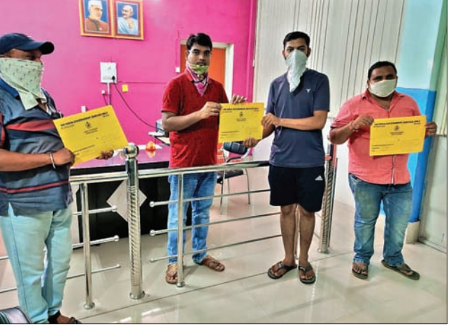
ତହସିଲଦାର କ୍ରେଡ଼ାମାନଙ୍କୁ ପଢ଼ା ପ୍ରଦାନ କରୁଛନ୍ତି ।