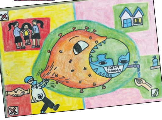
ଅୟସ୍କାନ୍ତ ପତି କ୍ଲାସ୍-୪, ତିଏରି ସ୍କୁଲ, ପୋଖରୀପୁର, ଭୁବନେଶ୍ୱର