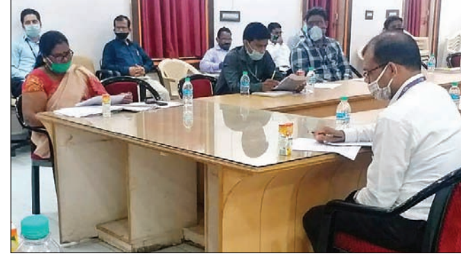
ବ୍ୟାଙ୍କ ରଣ ସହାୟତା ପ୍ରଦାନ ବୈଠକରେ ଜିଲାପାଳ ଏବଂ ଅନ୍ୟମାନେ ।