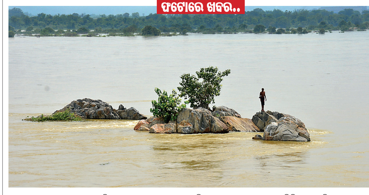
ହାରାକୁ ବ୍ୟାପୀ ଶୁକ୍ରବାର ବନାଜଳ ନିଷାଦ୍ରବ୍ୟ ପରେ ସମଲପୁର ମହାନଗର ନିଗମରେ ଥିବା ପଥର ଉପରେ ଜଣେ ବ୍ୟକ୍ତି ଛିଡା ହୋଇଛନ୍ତି ।