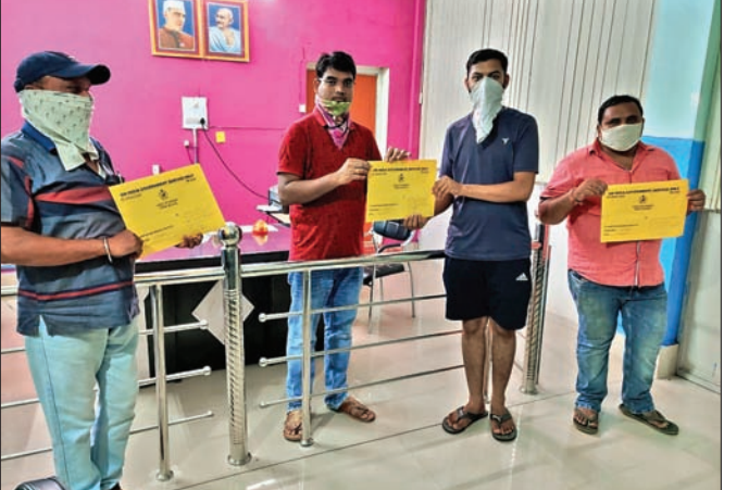
ତହସିଲଦାର କ୍ରେଡ଼ାମାନଙ୍କୁ ପତ୍ର ପ୍ରଦାନ କରୁଛନ୍ତି ।

କୁମାର, ୨୬/୬ (ଡି.ଏନ୍.ଏ.) ଓଡ଼ିଶା ମ୍ୟୁଚେଶନ ମାନ୍ୟତା ଦାଖଲ ହେଲା ପରେ ରାଜ୍ୟର ବିଭିନ୍ନ ତହସିଲରେ ଜମି କ୍ରୟର ୫୦୦ ଓ ୧୦୦୦ ମଧ୍ୟରେ କ୍ରେଡ଼ାମାନେ ପତ୍ର ପାଇ ପାରୁଛନ୍ତି । ଏହି ପରିପ୍ରେକ୍ଷାରେ କଳାହାଣ୍ଡି ଜିଲ୍ଲା କୁମାର ତହସିଲରେ ଗୁରୁବାର ୨୧ଜଣ କ୍ରେଡ଼ା