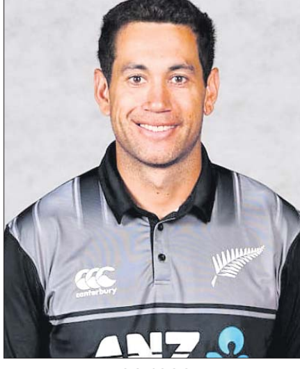
ରସ୍ ଟେଲର ଅଧିକ ବୋଲି ଟେଲର କହିଛନ୍ତି। ଦିନିକିଆ ୫୦ ଓଭର ବିଶିଷ୍ଟ ଖେଳ ହୋଇଥିବାକୁ ମ୍ୟାଚ୍ ଚାଲି ହେବା ମଧ୍ୟ ଗୋଟିଏ ଭଲ ପରିଣାମ ବୋଲି ସେ କହିଛନ୍ତି। ଉଲ୍ଲେଖଥାଉ କି, ସୁପର ଓଭରରେ ନ୍ୟୁଜିଲାଣ୍ଡର ପ୍ରଦର୍ଶନ ନୈରାଶ୍ୟଜନକ ରହିଛି। ୮ଟି ସୁପର ଓଭର ଖେଳି ନ୍ୟୁଜିଲାଣ୍ଡ ୭ଟିରେ ପରାଜୟ ବରଣ କରିଛି।

ଭୁଆଦିଲ୍ଲା, ୨୬୬୬ (ପି.ଟି.): ଦିନିକିଆ ଫର୍ମାଟ୍ରେ ସୁପର ଓଭରର ଆବଶ୍ୟକତା ନାହିଁ ବୋଲି ନ୍ୟୁଜିଲାଣ୍ଡ ସିନିୟର ବ୍ୟାଟ୍ସମ୍ୟାନ ରସ୍ ଟେଲର କହିଛନ୍ତି। ଯଦି ମ୍ୟାଚ୍ ଚାଲି ହୁଏ ତା'ହେଲେ ଦୁଇ ଫାଇନାଲିଷ୍ଟକୁ ଯୁକ୍ତ ବିଭେଦ ଯୋଗିତ ଉଚିତ ବୋଲି ସେ ମତ ଦେଇଛନ୍ତି। ଇଂଲଣ୍ଡରେ ଅନୁଷ୍ଠିତ ୨୦୧୯ ଦିନିକିଆ ବିଶ୍ୱକପ୍ ଫାଇନାଲରେ ଇଂଲଣ୍ଡ ଓ ନ୍ୟୁଜିଲାଣ୍ଡ ପରସ୍ପରକୁ ଭେଟିଥିଲେ। ଏହି ମ୍ୟାଚ୍ ଚାଲି ରହିବା ପରେ ସୁପର ଓଭରର ସହାୟତା ନିଆଯାଇଥିଲା। ତେବେ ସୁପର ଓଭର ଚାଲି ରହିବା ପରେ ଦାଉଣ୍ଡରି ସଂଖ୍ୟାକୁ ଦୃଷ୍ଟିରେ ରଖି ଇଂଲଣ୍ଡ ଚାମ୍ପିୟନ ଘୋଷିତ ହୋଇଥିଲା। ଯଦି ଦୁଇଦଳକୁ ଚାମ୍ପିୟନ ଘୋଷିତ କରାଯାଇଥାନ୍ତା ତା'ହେଲେ ଭଲ ହୋଇଥାନ୍ତା ବୋଲି ଟେଲର କହିଛନ୍ତି। ବିଶ୍ୱକପ୍ରେ ଇଂଲଣ୍ଡକୁ ଚାମ୍ପିୟନ ଘୋଷିତ କରିବା ପରେ ଅର୍ଦ୍ଧଶତାବ୍ଦୀ କ୍ରିକେଟ୍ କାଉନ୍ସିଲ୍ (ଆଇସିସି) ବିଭିନ୍ନ ମହଲରୁ କଡ଼ା ସମାଲୋଚନାର ଶିକାର ହୋଇଥିଲା। ଫଳରେ ଆଇସିସି ସୁପର ଓଭର ନିୟମରେ ପରିବର୍ତ୍ତନ ଆଣିଥିଲା। ଗୁଆ ନିୟମ ଅନୁସାରେ ମ୍ୟାଚ୍ ଚାଲି ହେଲେ ବିଭେଦ ନିରୁପଣ ନ ହେବା ପର୍ଯ୍ୟନ୍ତ ସୁପର ଓଭର ବାରମ୍ବାର ଖେଳାଯିବ ଓ ଏ ନେଇ ଆଇସିସି ନିୟମରେ ସଂଶୋଧନ କରିଛି। ତେବେ ଦୁଇ ଦଳ ଯଦି ଟ୍ରଫି ଭାଗ କରିବେ ତାହାର ପ୍ରାସଙ୍ଗିକତା