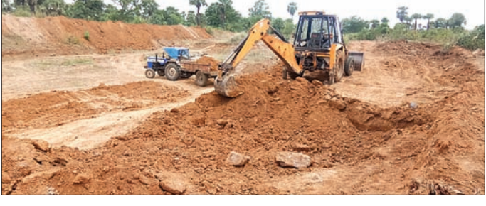
ମେଣିନ ବ୍ଲକର ଏମ୍ପ୍ଲି-ଏମ୍ପ୍ଲି-ଆରଜି-ଏସ୍ ପ୍ରକଳ୍ପର କାମ କରାଯାଉଛି ।

ଦିଗରେ ଦୃଷ୍ଟି ଦେବାକୁ ସରକାର ସମସ୍ତ ବିଭାଗକୁ ଠିକ୍ କରିଥିଲେ । ତଦନୁଯାୟୀ ସୁବର୍ଣ୍ଣପୁର ଜିଲ୍ଲାରେ ଏହାକୁ କଡ଼ାକଡ଼ି ଭାବେ ପାଳନ କରାଯିବାକୁ ଜିଲ୍ଲାପାଳ ଇଡ଼ାପାଳ ଗ୍ରାମାଞ୍ଚଳ ନିଷ୍ପତି କର୍ମନିମୁକ୍ତ ଯୋଜନା(ଏମ୍ପ୍ଲି-ଏମ୍ପ୍ଲି-ଆରଜି-ଏସ୍) ଏକାଗ୍ରତା ସହାୟା ଯୋଜନାରେ ଦୈନିକ ମହୁରି ବଢ଼ିଛି । ମହୁରି ଦିନକୁ ୧୮୨ ଟଙ୍କାକୁ ୨୦୭ ଟଙ୍କାକୁ ସରକାର ବୃଦ୍ଧି କରିଛନ୍ତି । ପ୍ରାୟ ୩୫ ଶ୍ରମିକ ଜିଲ୍ଲାକୁ ପହଞ୍ଚିବା ପୂର୍ବରୁ ଲକଡ଼ାଉନ୍ ଲାଗୁ କରିବା ପର୍ଯ୍ୟନ୍ତ ପରେ ସରକାର ଏମ୍ପ୍ଲି-ଏମ୍ପ୍ଲି-ଆରଜି-ଏସ୍ ପ୍ରକଳ୍ପ କାମ କରିବା ପାଇଁ ନିଷ୍ପତ୍ତି ନେଇଥିଲେ । ଜିଲ୍ଲାରେ ୧ ଲକ୍ଷ ୨୩ ହଜାର ୬୨୮ଟି ଛାତ୍ରଛାତ୍ରୀ ଅଛି । ଏହି ଯୋଜନାରେ ଉତ୍ତମ ଶ୍ରମିକ ମାନେ ଅଧିକ ସଂଖ୍ୟାରେ କାମ ପାଇବେ ସେ