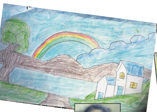
ଲିପି ପ୍ରଧାନ କ୍ଲାସ-୭, ସରକାରୀ ଉନ୍ନତ ବିଦ୍ୟାଳୟ, ବେଲେର, ଖପ୍ରାଖୋଲ, ବଲାଙ୍ଗୀର