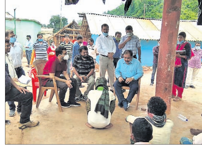
ନଗଡ଼ାବାସୀଙ୍କ ସହ ଜିଲ୍ଲାପାଳ ଆଲୋଚନା କରୁଛନ୍ତି।