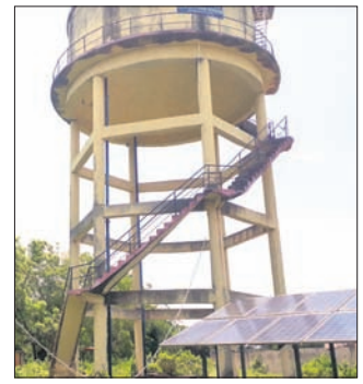
ଅଟକ ହୋଇରହିଥିବା ପ୍ରକଳ୍ପ।