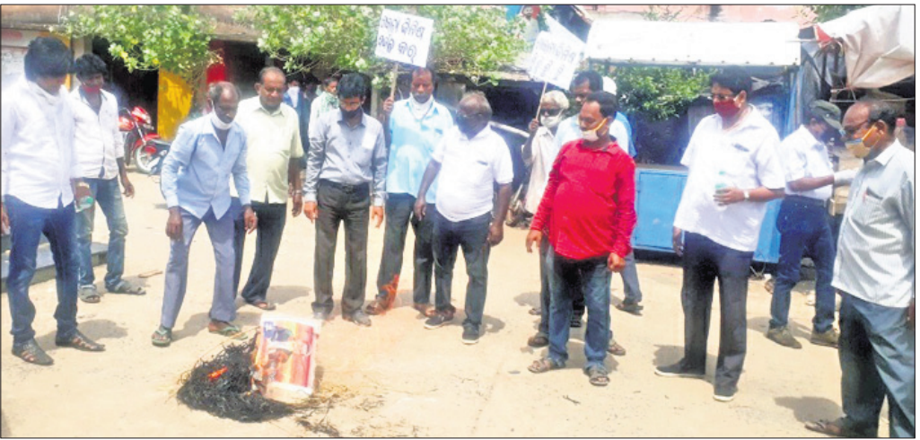
ଶୋଭାଯାତ୍ରାରେ ଚାଇନା ରାଷ୍ଟ୍ରପତି ସି.ଜି.ପିଙ୍ଗଳ କୁଶପୁରୁଷୋତ୍ତମ ଦାହ କରାଯାଇଛି।