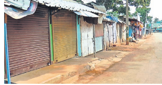
ଖୋର୍ଦ୍ଧା ସହରରେ ଶନିବାର ଶର୍ବତାଉନ୍‌ଟେ ବନ୍ଦ ଥିବା ଦୋକାନ ବଜାର ।