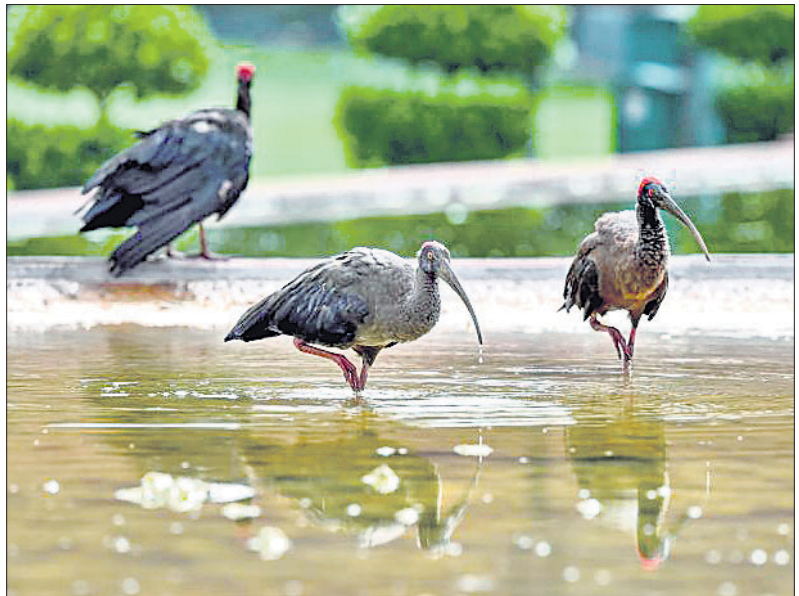
ନୂଆଦିଲ୍ଲୀର ଏକ ଝରଣା ପାଣିରେ ପକ୍ଷୀଗୁଡ଼ିକ ଦେହକୁ ଥଣ୍ଡା କରୁଛନ୍ତି ।