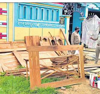
ବନବିଭାଗ ପକ୍ଷରୁ ଜବତ କରାଯାଇଥିବା କାଠନିର୍ମିତ ସାମଗ୍ରୀ।