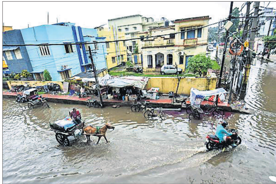
ପାଟଣାରେ ପ୍ରବଳ ବର୍ଷା ଯୋଗୁଁ ରାସ୍ତା ଉପରେ ପାଣିର ତେଜା ।