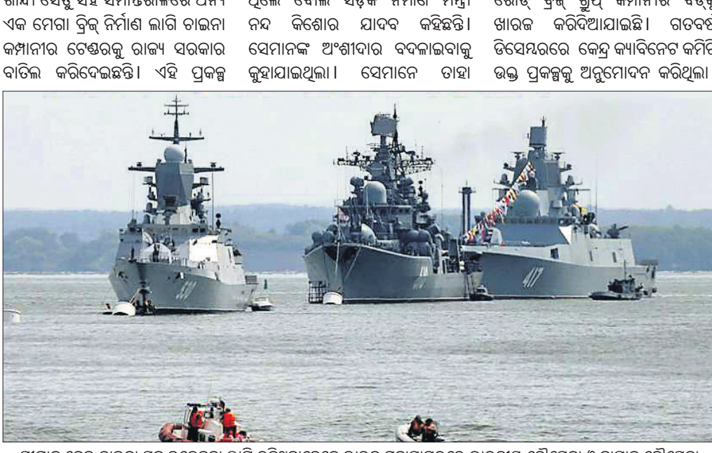
ସୀମାକୁ ନେଇ ଚାଇନା ସହ ଉଭେଜନା ଲାଗି ରହିଥିବାବେଳେ ଭାରତ ମହାସାଗରରେ ଭାରତୀୟ ନୌସେନା ଓ ଡାପାନ୍ ନୌସେନା ମିଳିତ ସମରାଭ୍ୟାସରେ ସାମିଲ ହୋଇଛନ୍ତି । ଏଥିରେ ଉଭୟ ଦେଶର ୪ଟି ଯୁଦ୍ଧନାହିକ ଭାଗ ନେଇଛନ୍ତି ।

ପାଇଁ ଚୟନ ହୋଇଥିବା ୪ ଠିକାଦାରଙ୍କ ମଧ୍ୟରୁ ଉଚ୍ଚତମ ଚାଇନା ଅଂଶଦାର ଗାନ୍ଧୀ ସେତୁ ସହ ସମାନ୍ତରାଳରେ ଅନ୍ୟ ଏକ ମେରା ଟ୍ରିକ୍ ନିର୍ମାଣ ଲାଗି ଚାଇନା କମ୍ପାନୀର ଟେଣ୍ଡରକୁ ରାଜ୍ୟ ସରକାର ବାତିଲ କରିଦେଇଛନ୍ତି । ଏହି ପ୍ରକଳ୍ପ