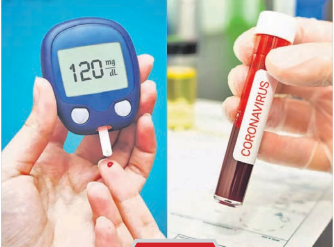
ଅଗ୍ନୀଶୟ ବା ପାନକ୍ରିୟାଚିକ୍ ଲନସୁଲିନ ନାମକ ହରମୋନ ସୃଷ୍ଟି କରୁଥିବା ବିଟା ସେଲ୍ ନଷ୍ଟ ହେବାକୁ ଆରମ୍ଭ କରେ। ଏହି ବିଟା ସେଲ୍‌ରେ ବିଟା କୋଷ ନଷ୍ଟ ହେବା ଯୋଗୁ ଉଭୟ ଶର୍କରା ନିୟନ୍ତ୍ରଣ କ୍ଷମତା କମିଯାଇଥାଏ, ଯାହା ଡାକ୍ତରୀରେ ଚିକିତ୍ସା କରାଯାଏ।

ନୂଆଦିଲ୍ଲୀ: କରୋନା ଭୂତାଣୁ ଆକ୍ରାନ୍ତକ ଶରୀରରେ ତାଳବେଟିଏ ସୃଷ୍ଟି କରୁଥିବା ତାଳୁର ବିଶେଷଜ୍ଞମାନେ ଜାଣିବାକୁ ପାଇଛନ୍ତି। ଏ ସଂକ୍ରମଣରେ ଏକ ରିପୋର୍ଟ ମଧ୍ୟ ଲାଞ୍ଜି କର୍ମାଳ ଅପ୍ ମେଡିସିନରେ ପ୍ରକାଶ ପାଇଛି। ଏଥିଯୋଗୁ ରୋଗୀ ବିଶେଷ କରି ଚାଲି-୧ ଡାକ୍ତରୀରେ ଶିକାର ହେଉଥିବା ସାମାଜିକ ଆଦି। ବିଶେଷଜ୍ଞମାନେ ଅନୁସନ୍ଧାନ ପାଇଁ ମଣିଷର ଷ୍ଟେମ କୋଷକୁ ବ୍ୟବହାର କରି ମୂଷା ଶରୀରରେ ପାନକ୍ରିୟାଚିକ୍ ଏଣ୍ଡୋକ୍ରାଇନ ସେଲ୍ ପ୍ରତିରୋଧକ କରିଥିଲେ। ପରେ କରୋନା ଭୂତାଣୁ ମୂଷା ଦେହରେ ପ୍ରବେଶ କରାଯାଇ ପରୀକ୍ଷା କରାଯାଇଥିଲା। ଗବେଷଣାକୁ ଜଣାପଡିଥିଲା ଯେ, କରୋନା ଭାଇରସ୍ ଶରୀରରେ ପ୍ରବେଶ କରିବା ପରେ ରୋଗ ପ୍ରତିରୋଧକ ଶକ୍ତି ଖୁବ୍ ଆକ୍ରମଣାତ୍ମକ ହୋଇଉଠେ। ଏଥିଯୋଗୁ